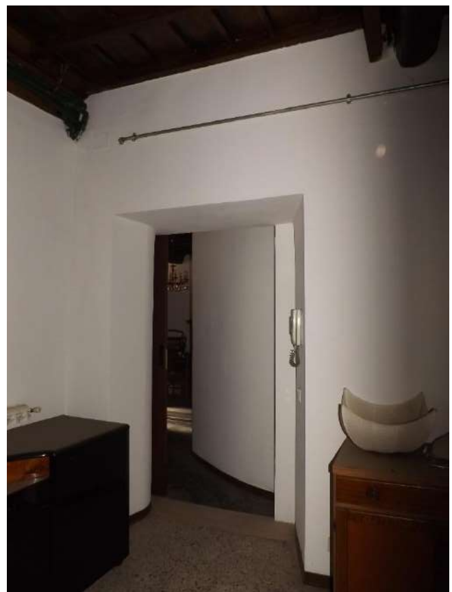
Foto 33 – Vista dal sub. 3 del vano porta che collega i sub. 21 e 3