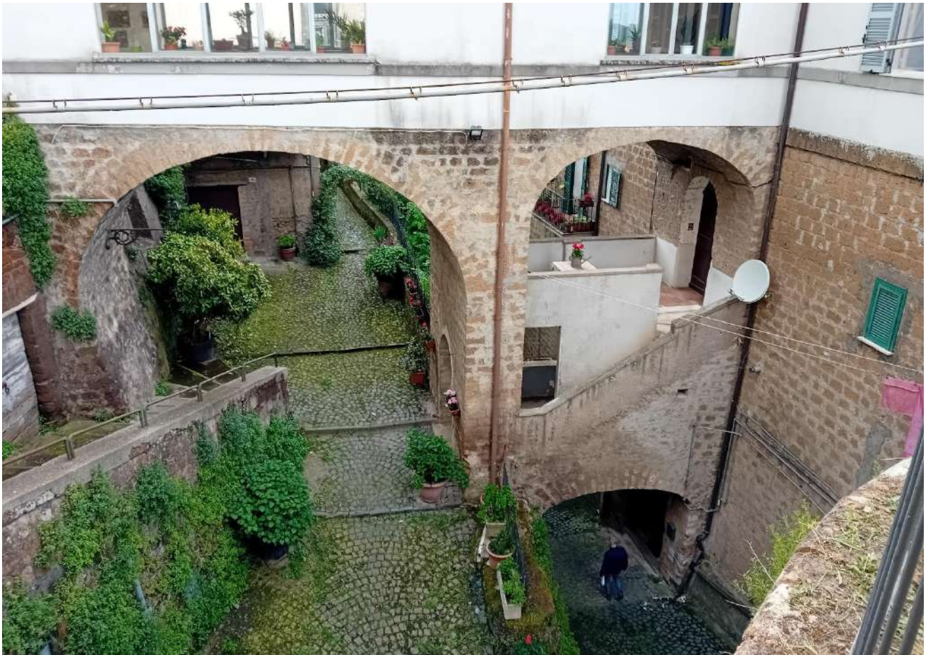
Foto 5 – Vista del ponte su cui è posizionato l'androne del fabbricato