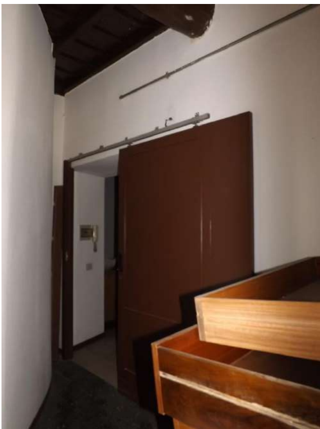
Foto 32 – Vista dal sub. 21 della porta scorrevole tra i sub. 21 e 3