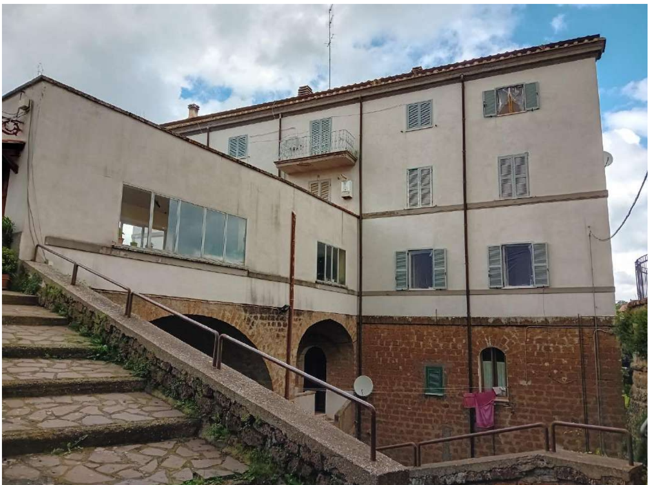
Foto 4 – Vista dell'androne dell'edificio da Vicolo della Fontana