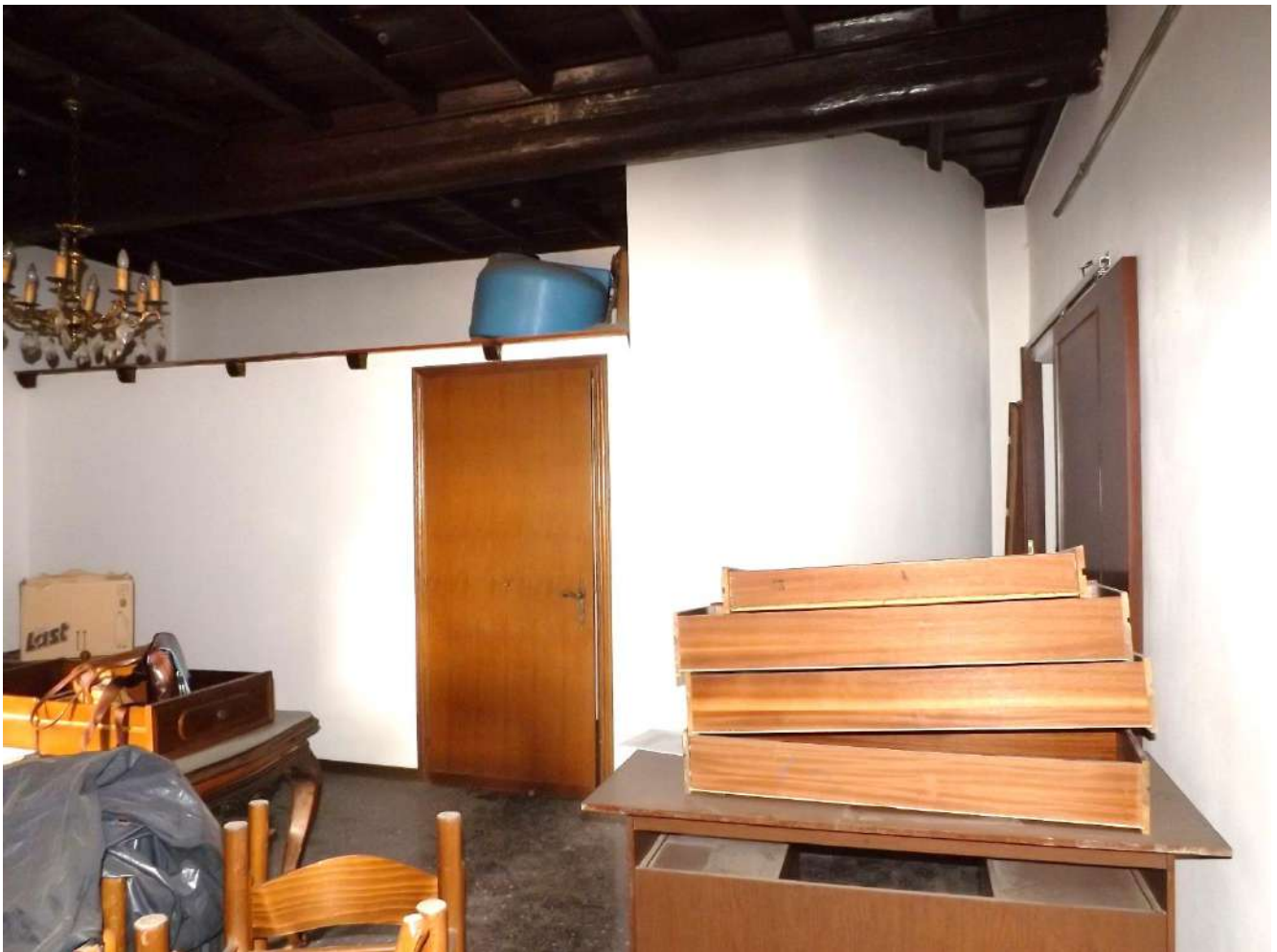
Foto 24 – Ingresso del monocale con vista sull'area soppalcata posta sopra il vano di accesso comune ai sub. 20 e 21