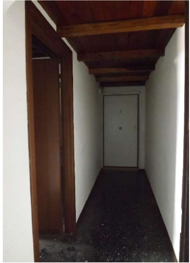
Foto 23 – Vano comune con gli accessi del sub. 21 e 20 (in fondo)