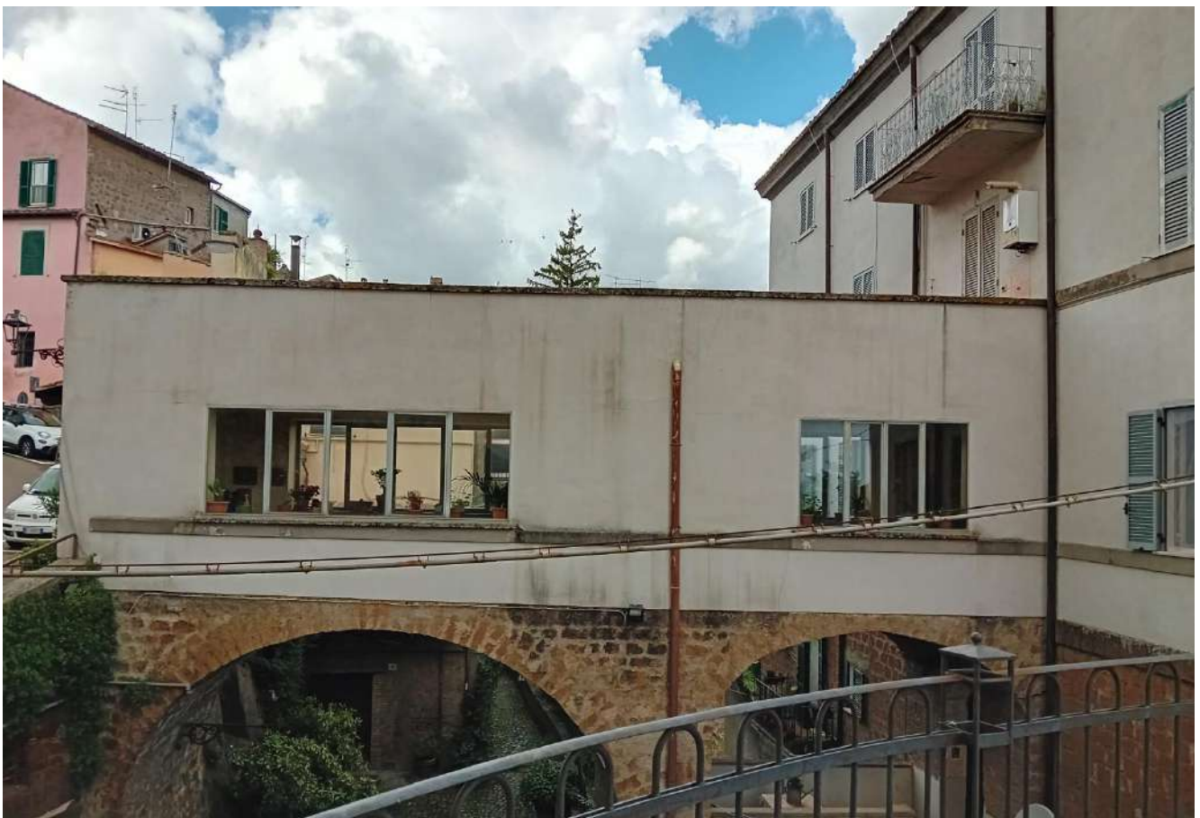
Foto 6 – Vista dell'androne condominiale con soprastante terrazza di proprietà degli esecutari