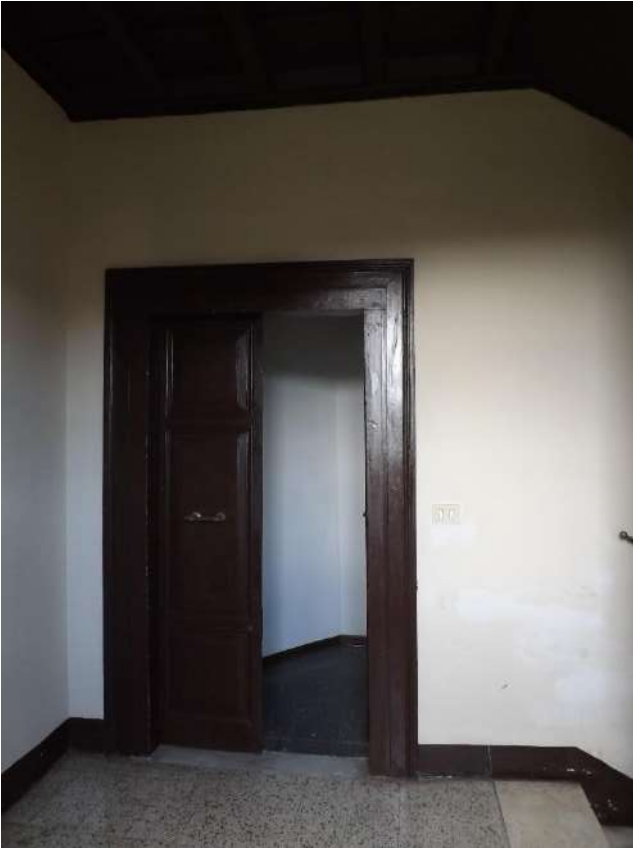
Foto 22 – Portone di ingresso al vano con gli accessi ai sub. 20-21