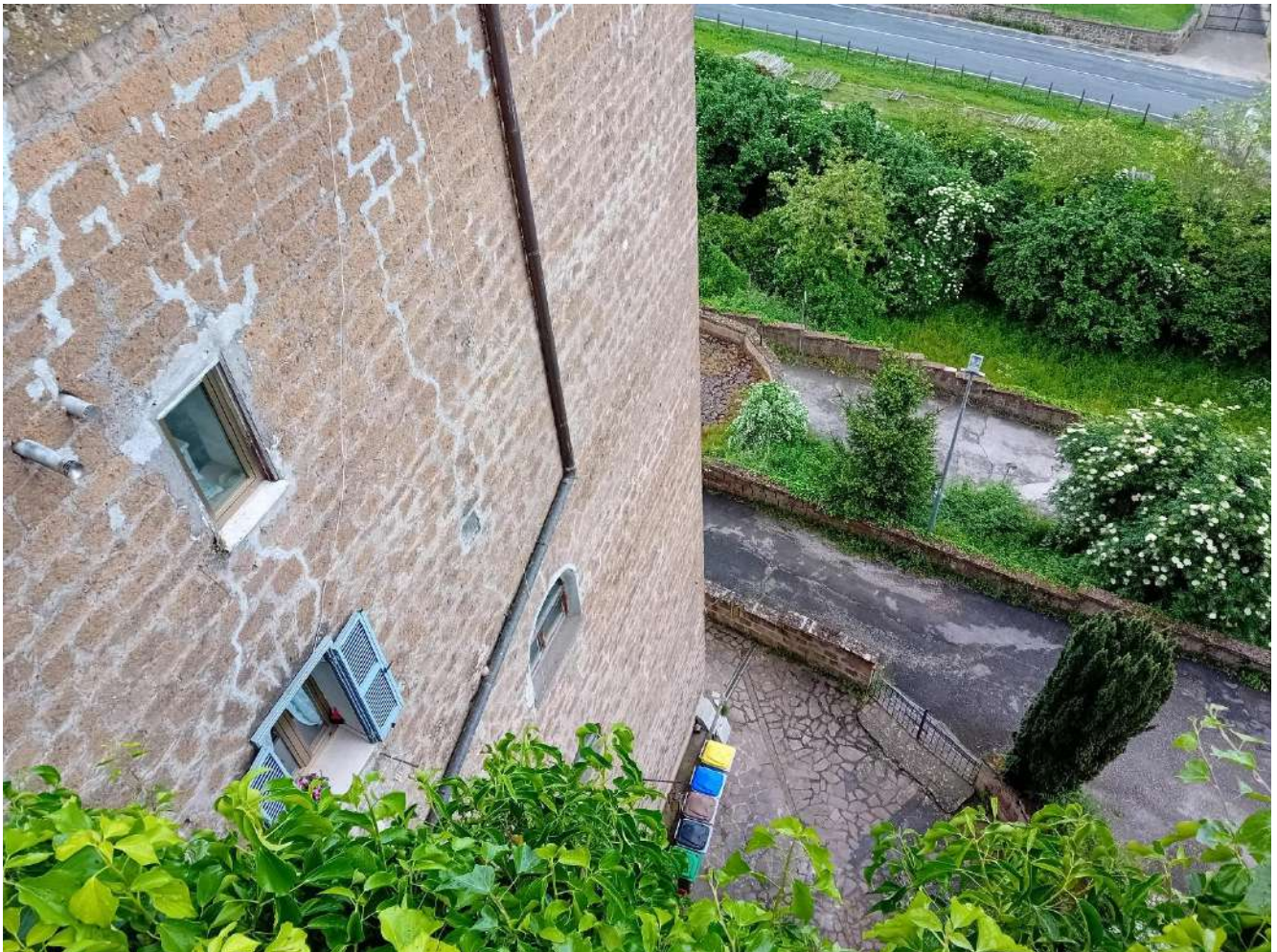
Foto 9 – Vista del prospetto est, Via Acqua alle Rupi e sul fondo Via XX Settembre (SS Cassia)