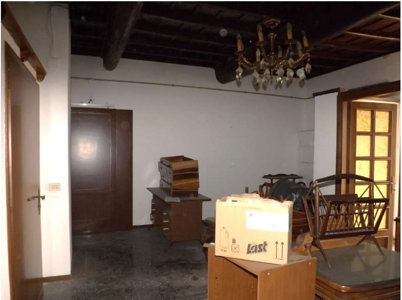
Foto 31 – Vista dal monocale della porta che mette in comunicazione il bene con il subalterno 3 con cui risulta fuso