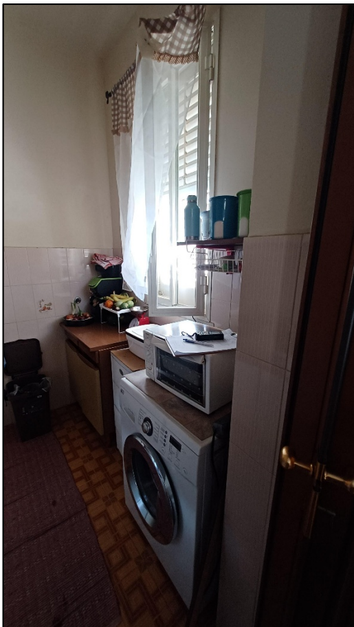
Figura 11 – locale ripostiglio adiacente alla cucina