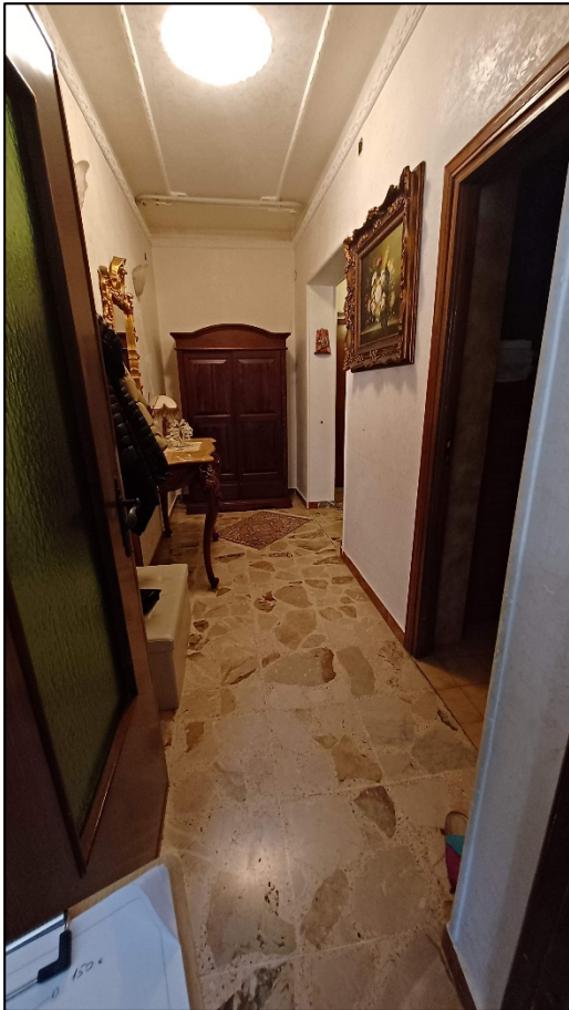
Figura 8 - corridoio