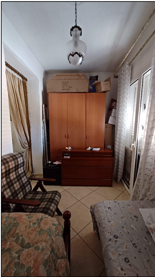
Figura 5 – camera con affaccio su via Puccini