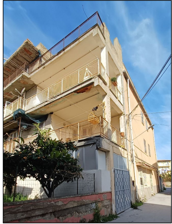
Figura 2 – Prospetto su via Maresciallo Agrò e prospetto sud