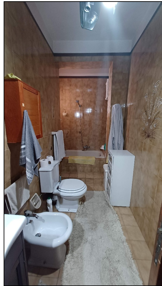
Figura 6 - bagno