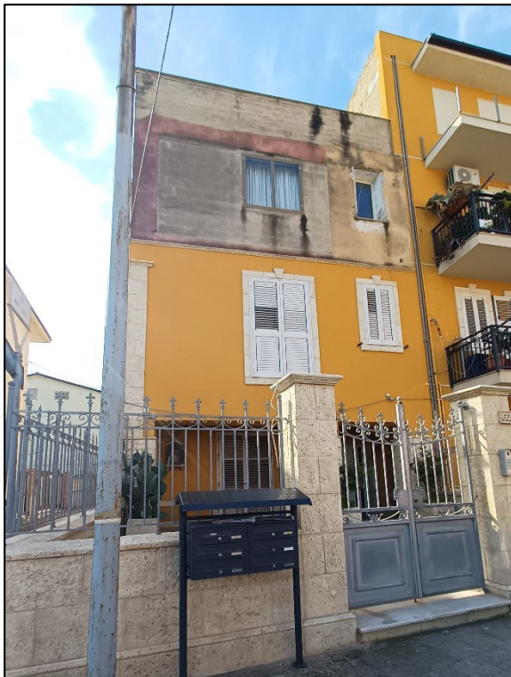
Figura 3 – Prospetto su via G. Puccini