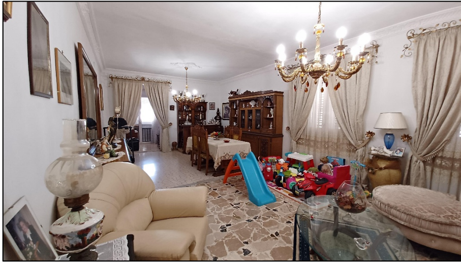
Figura 4 – vista del soggiorno