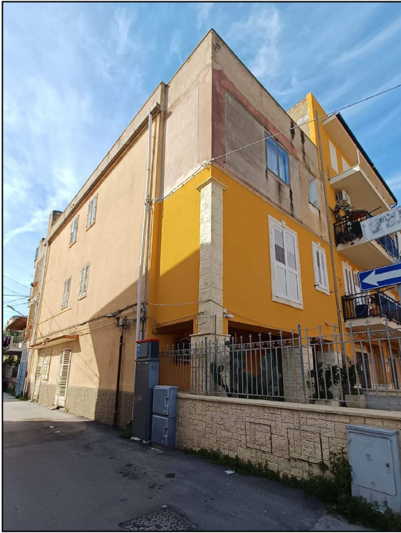
Figura 1 – Prospetti su via G. Puccini e via Maresciallo Agrò