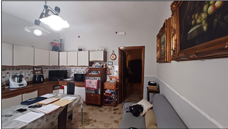
Figura 10 - cucina