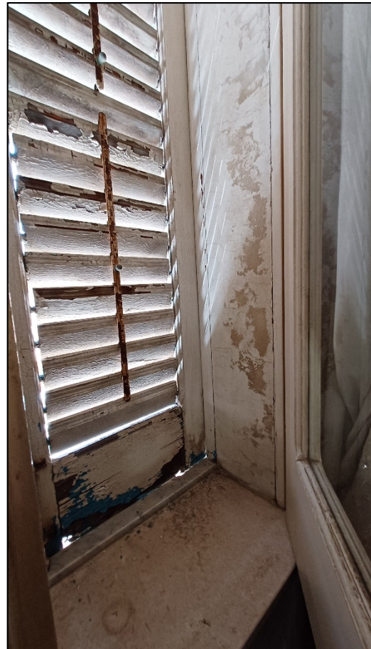
Figura 9 – tipologia infissi