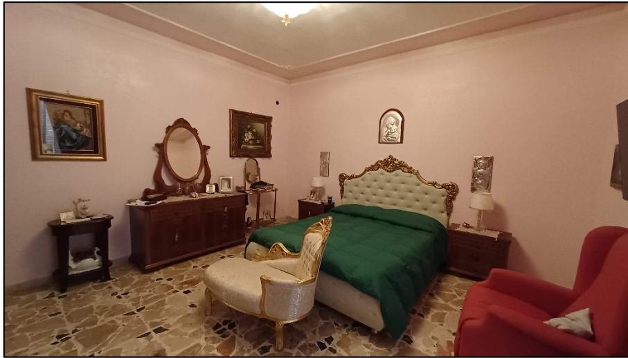
Figura 7 – camera da letto