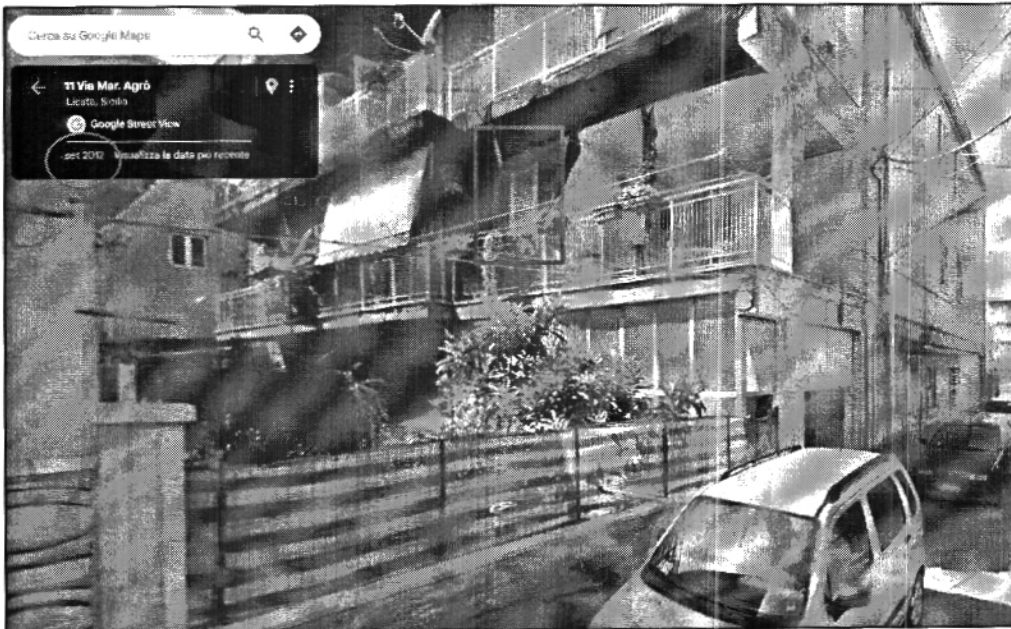
Figura 3 – vista prospetto lato sud – Google Street View settembre 2012