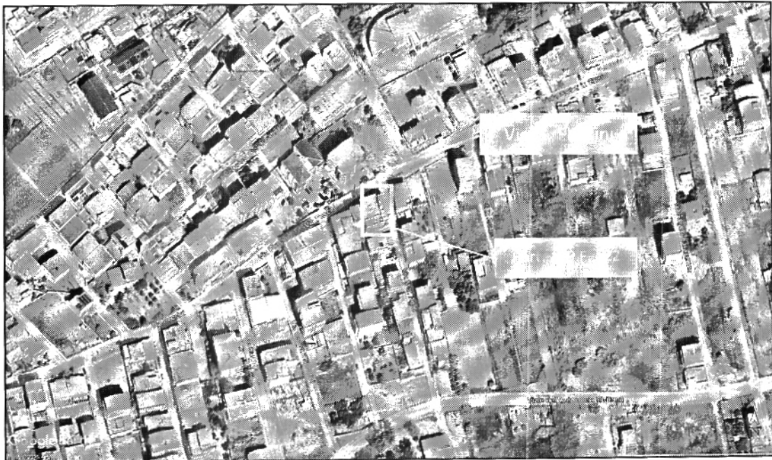
Figura 1 - Vista aerea dell'area