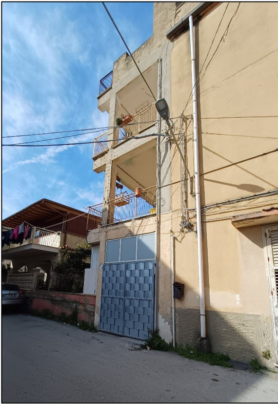
Figura 1 – Prospetto su via Maresciallo Agrò – porta in ferro accesso a veranda