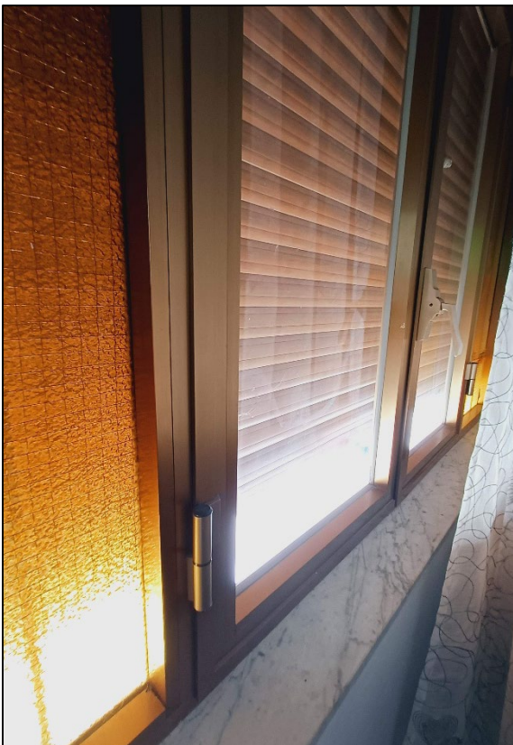
Figura 6 – Infissi in alluminio delle finestre