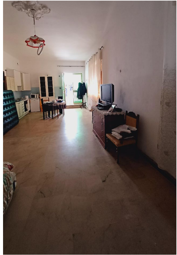
Figura 5 – Vista interna del magazzino