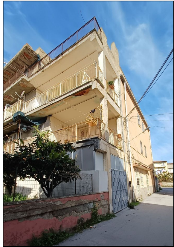
Figura 2 – Prospetto su via Maresciallo Agrò e prospetto sud