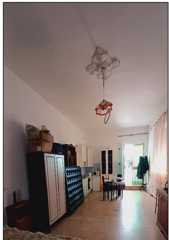
Figura 7 – Vista interna magazzino