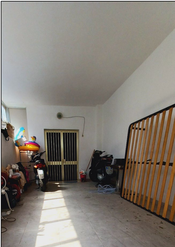
Figura 3 – Porta di accesso al magazzino attraverso la veranda