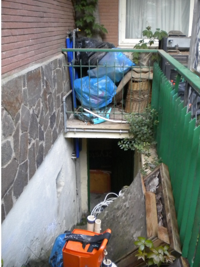
Foto 6- Scala di accesso al piano interrato.