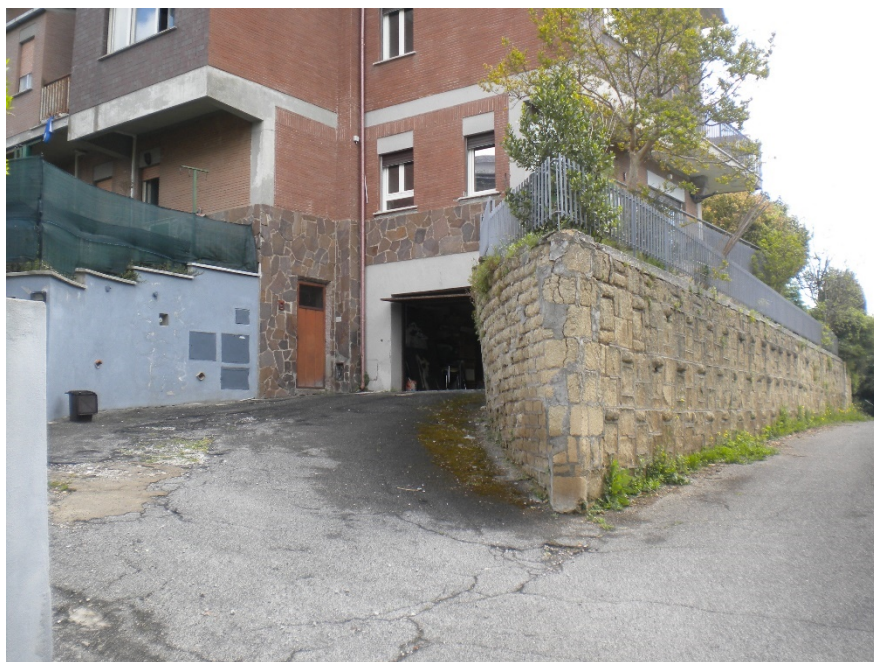
Foto 9- Rampa ingresso piano S1 da Via del Lampioncino