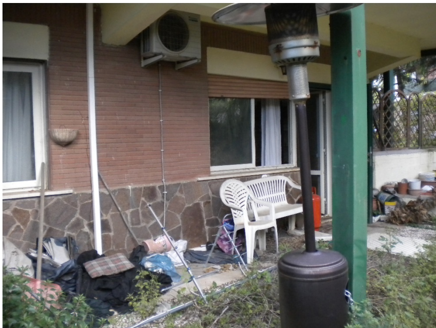
Foto 3- Ingresso abitazione