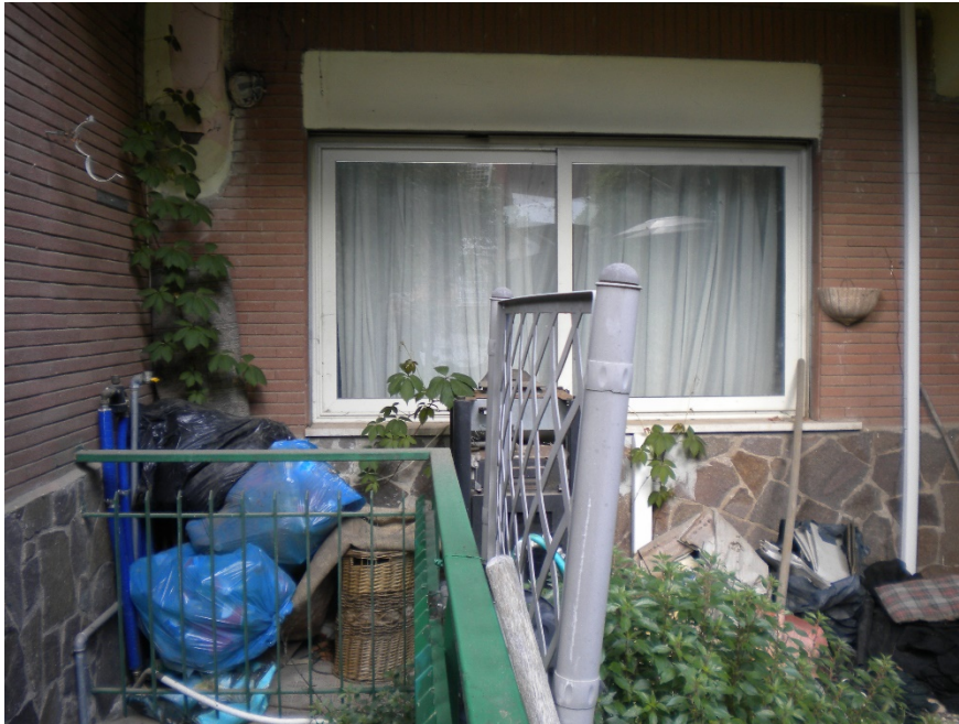
Foto 5- Prospetto principale abitazione, con latistante scala di accesso al piano interrato