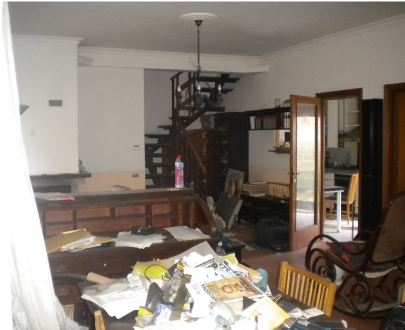
Foto 13 – Piano terra. Soggiorno con scala di collegamento al piano primo