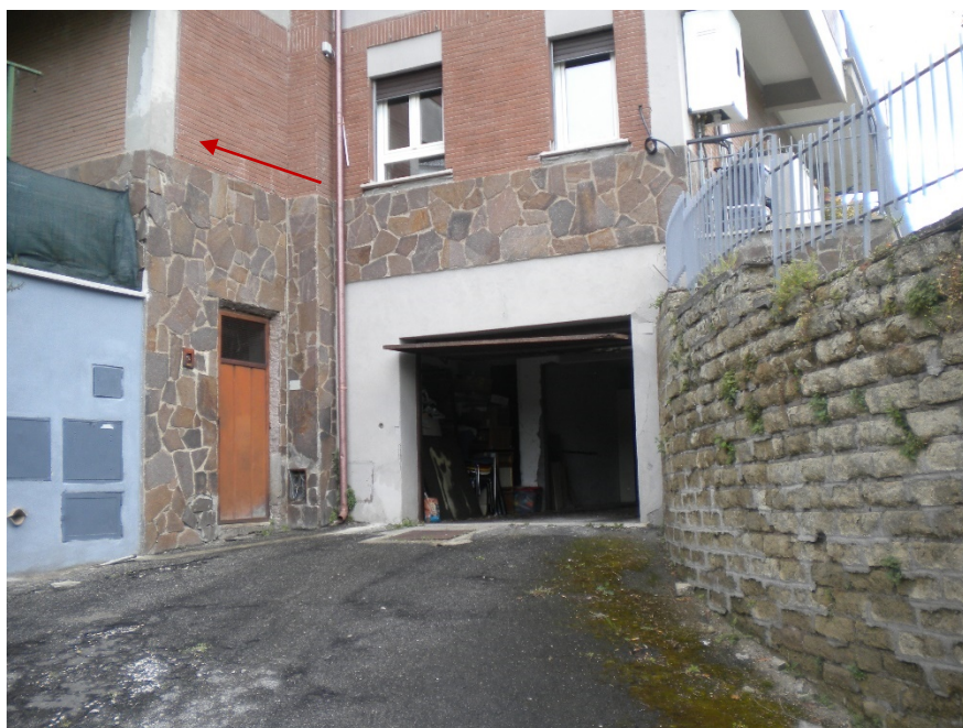
Foto 10-Particolare ingresso piano S1. In evidenza, con freccia rossa, la parete laterale piano terra dell'appartamento, con antistante piccola area scoperta.