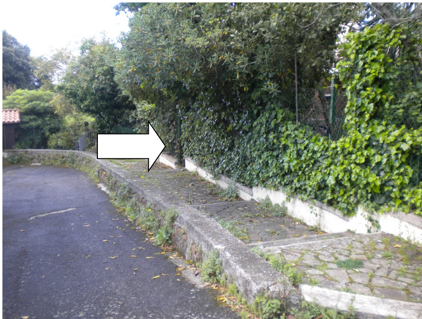
Foto 1- Ingresso giardino, da Via delle Roccette, 21