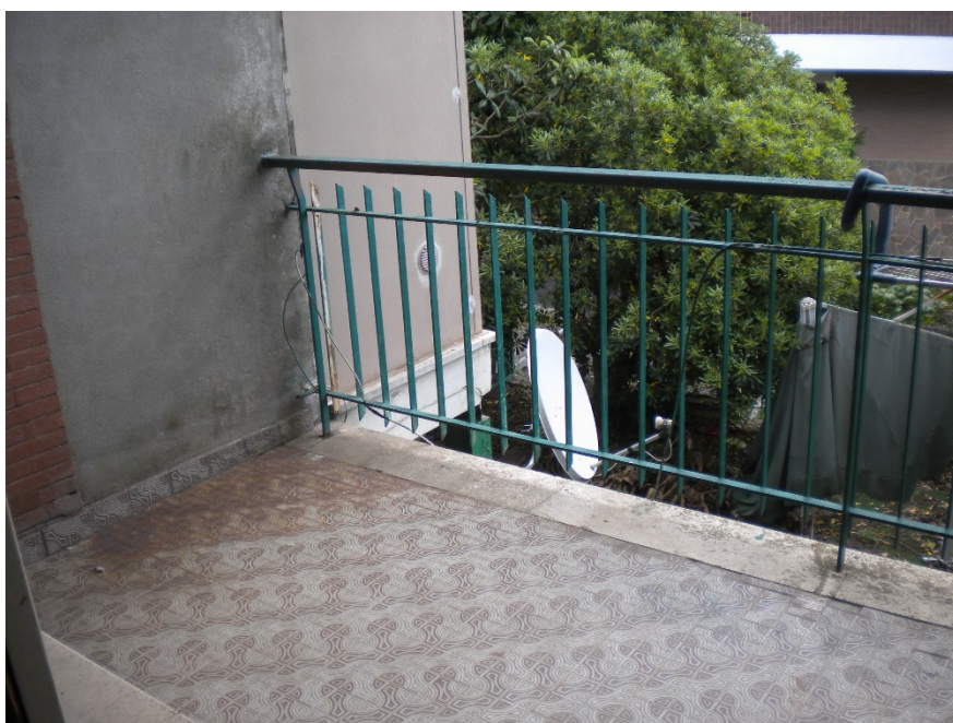
Foto 22 – Esterno balcone con affaccio su – Giardino principale sottostante (prospetto est)