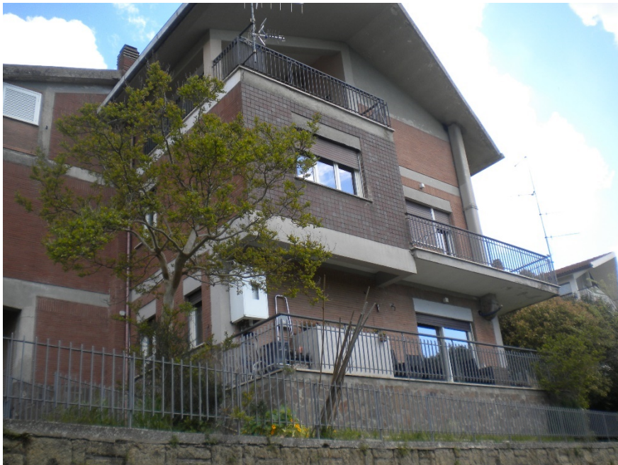
Foto 8- Prospetto sud edificio, lato Via del Lampioncino