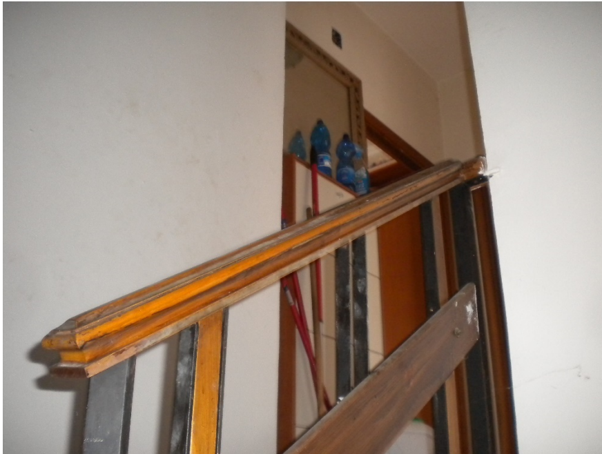
Foto 19 – Scala interna (con struttura in ferro scatolare e legno) con sbarco al piano primo.