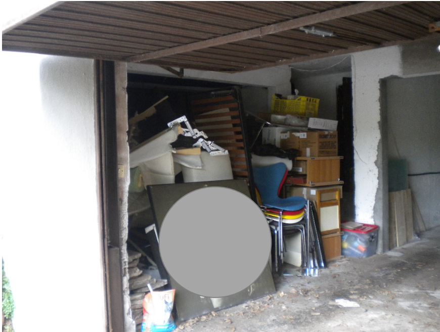
Foto 29 – Posto auto completamente occupato da oggetti di vario tipo