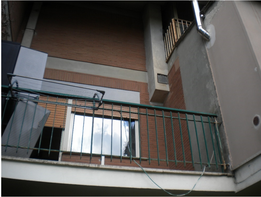
Foto 7- balcone piano primo ripreso dal giardino.