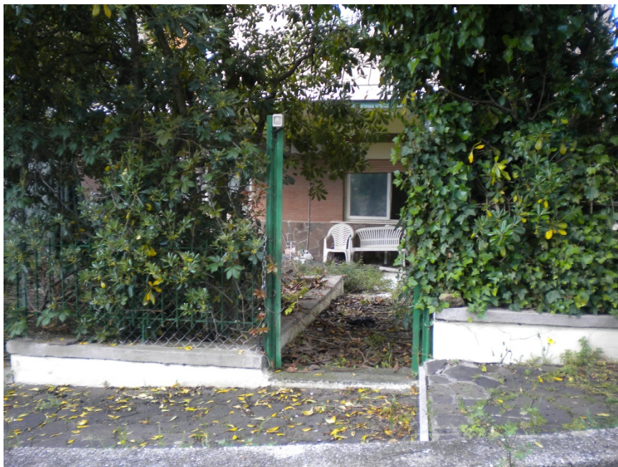
Foto 2- Ingresso giardino e prospetto principale