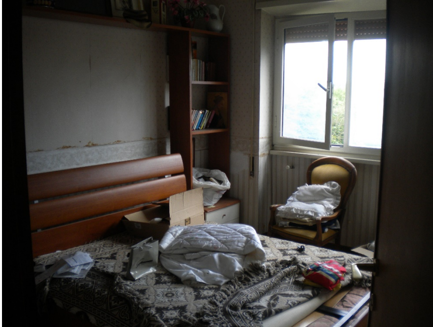
Foto 25 – Seconda camera da letto con affaccio su giardino retrostante (prospetto ovest)