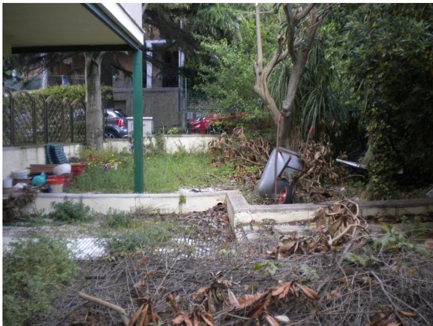
Foto 4- Zona antistante e area giardinata