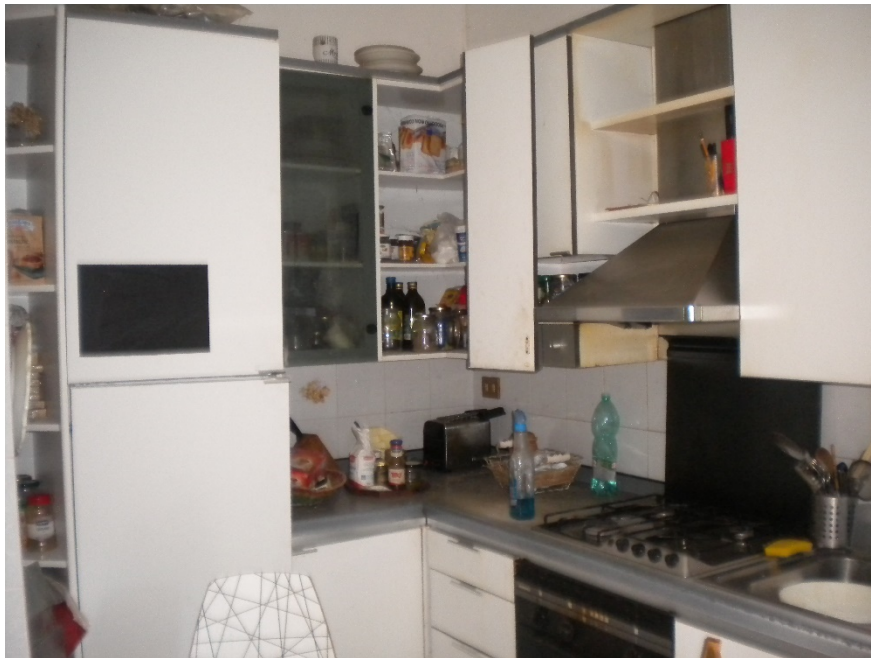
Foto 14 -Cucina