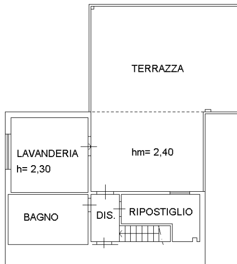
PIANO SECONDO hm = 2,00