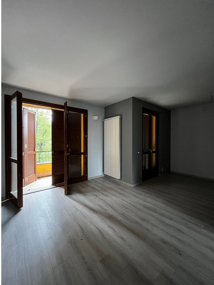
Immagine 6. Vista dall'ingresso verso il locale soggiorno con sullo sfondo il balcone.