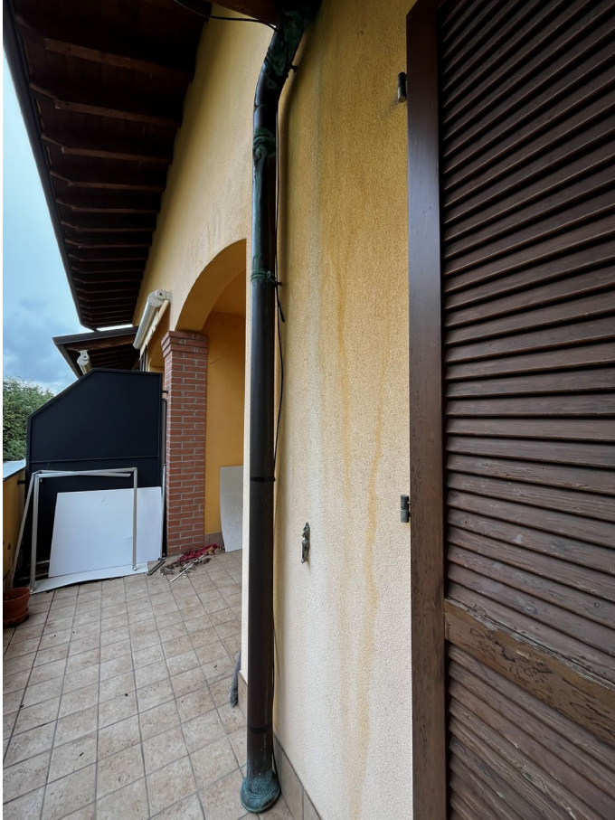
Immagine 18. Infiltrazione dal tetto.