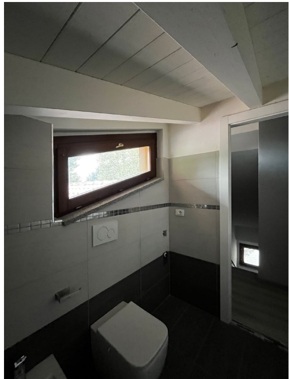
Immagine 13. Il bagno al secondo livello – sottotetto.