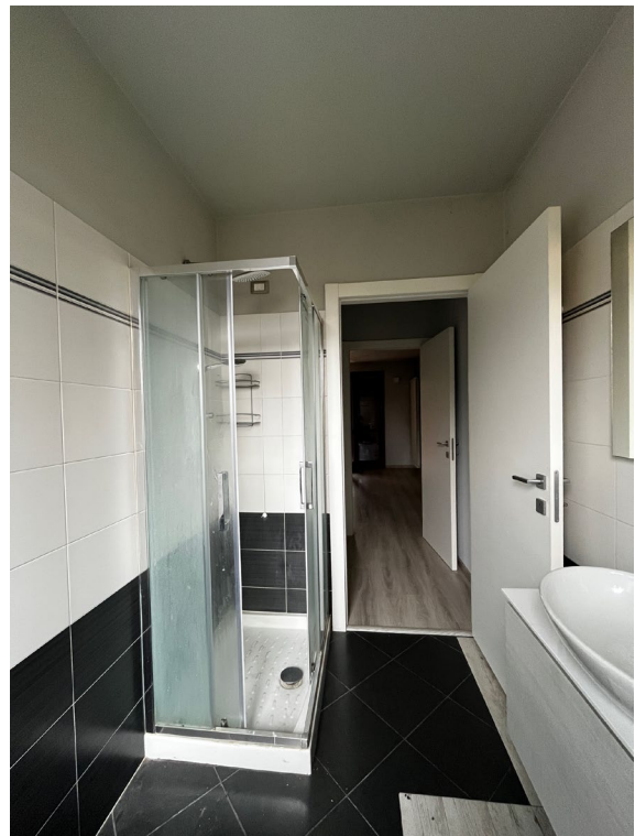
Immagine 10. Il bagno visto verso l'ingresso.