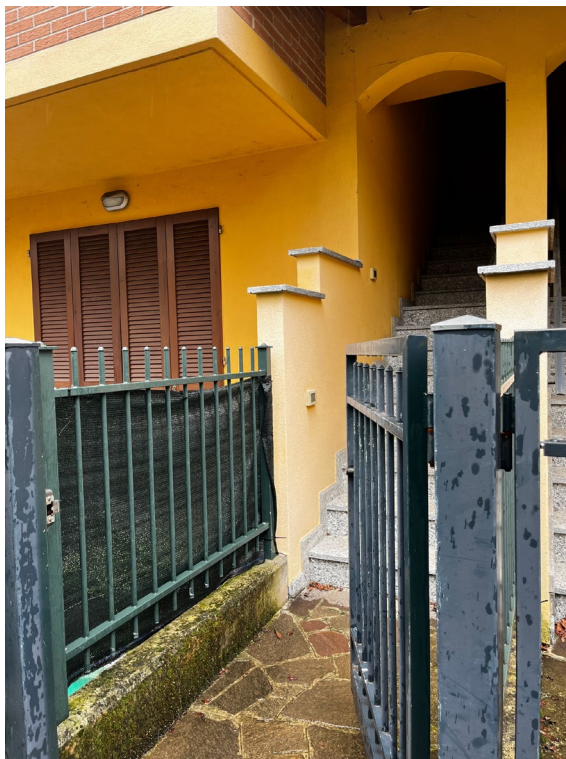
Immagine 2. Il cancelletto di ingresso che immette nella proprietà (area di pertinenza a piano terra).