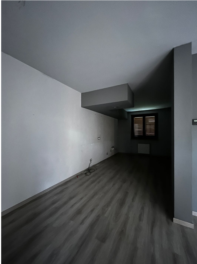
Immagine 8. La zona predisposta come cucina / spazio cottura.