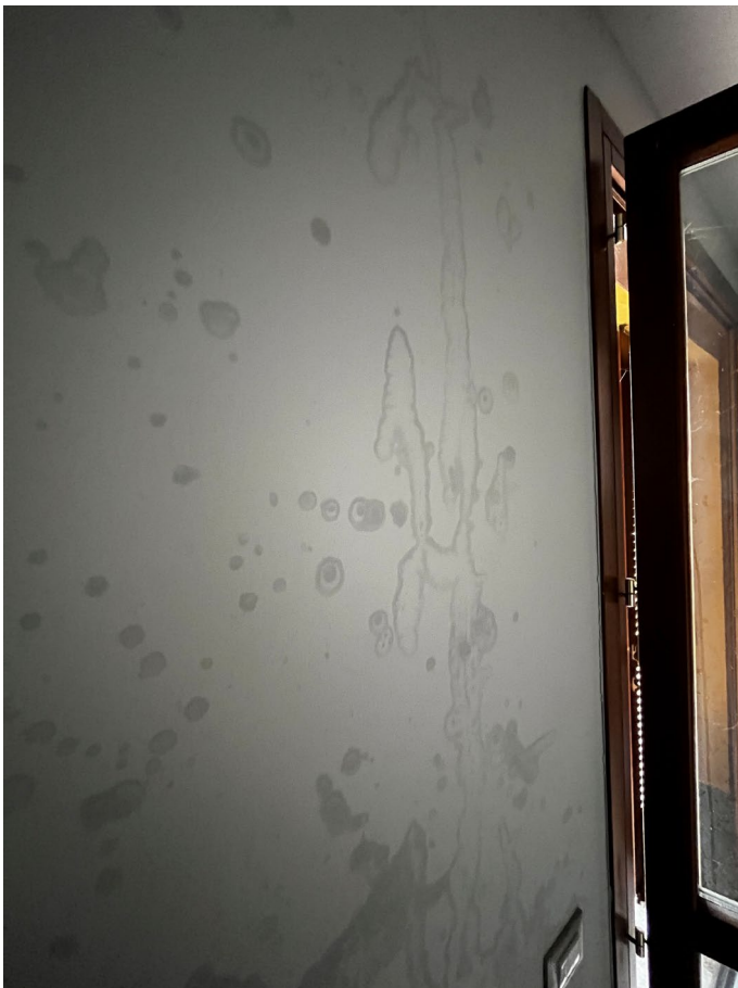
Immagine 19. Infiltrazione, vista dall'interno.