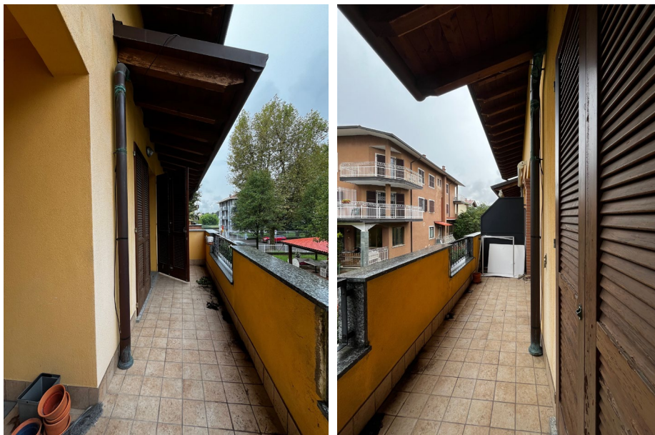
Immagine 7. Il balcone antistante il soggiorno che affaccia sul vialetto condominiale.