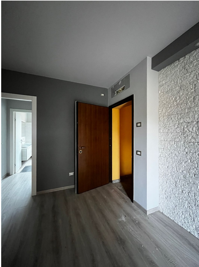
Immagine 4. L'ingresso dalle scale all'appartamento.