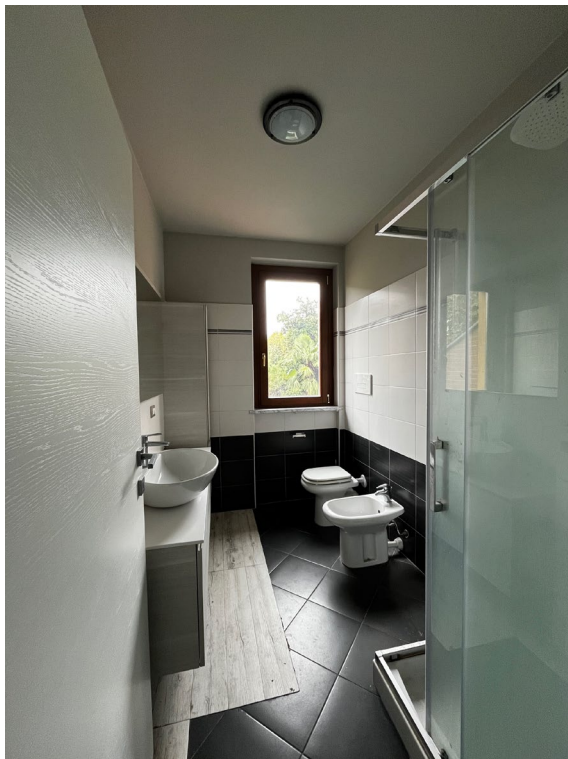
Immagine 9. Il bagno visto dall'ingresso e verso l'ingresso.