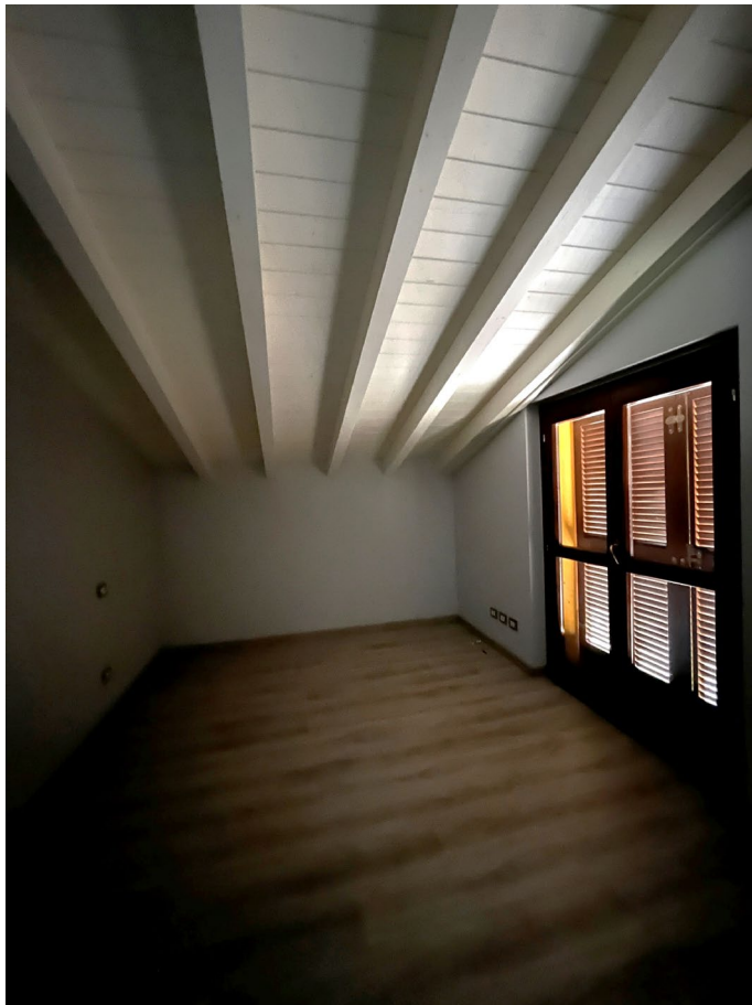
Immagine 14. Uno dei locali deposito al piano sottotetto.