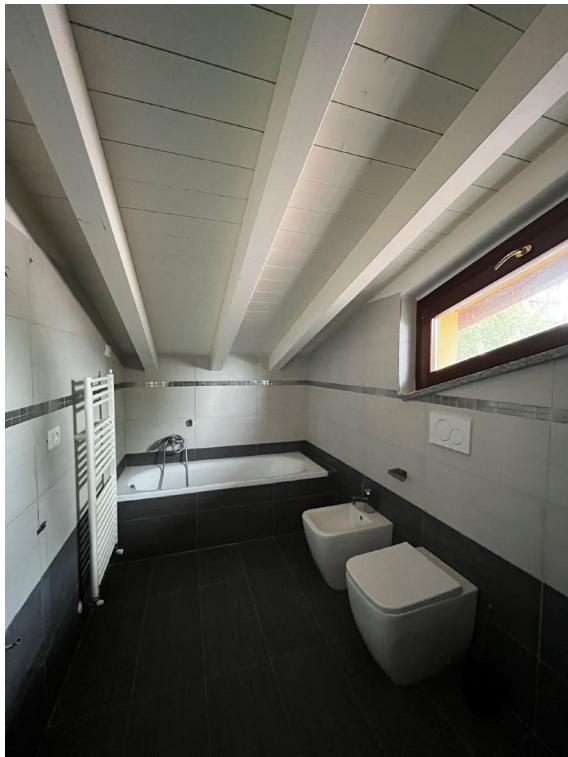
Immagine 12. Il bagno al secondo livello – sottotetto.