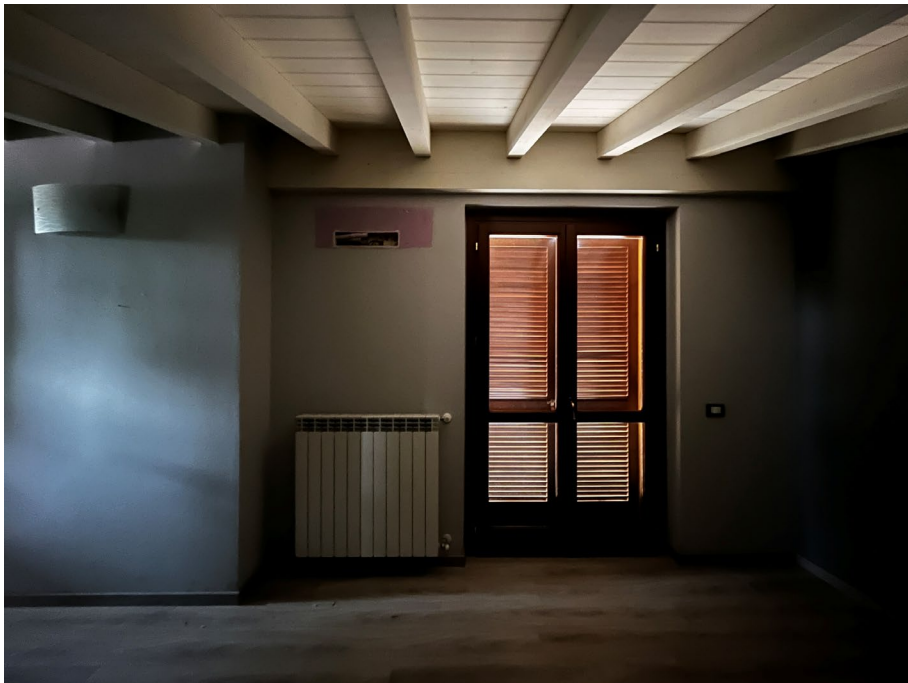
Immagine 16. Il secondo “ripostiglio” al piano sottotetto.