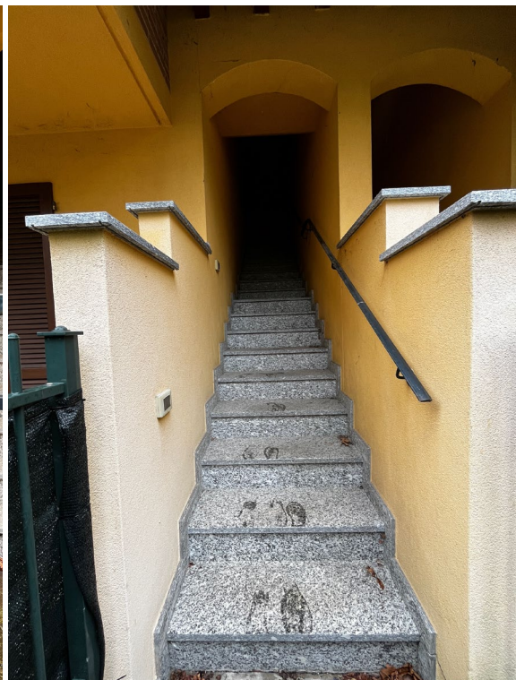
Immagine 3. La scala che conduce al piano abitabile. L'unità non è accessibile e è difficilmente adattabile.