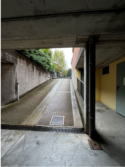
Immagine 24. La rampa di accesso all'autorimessa opposta rispetto alla scala pedonale.