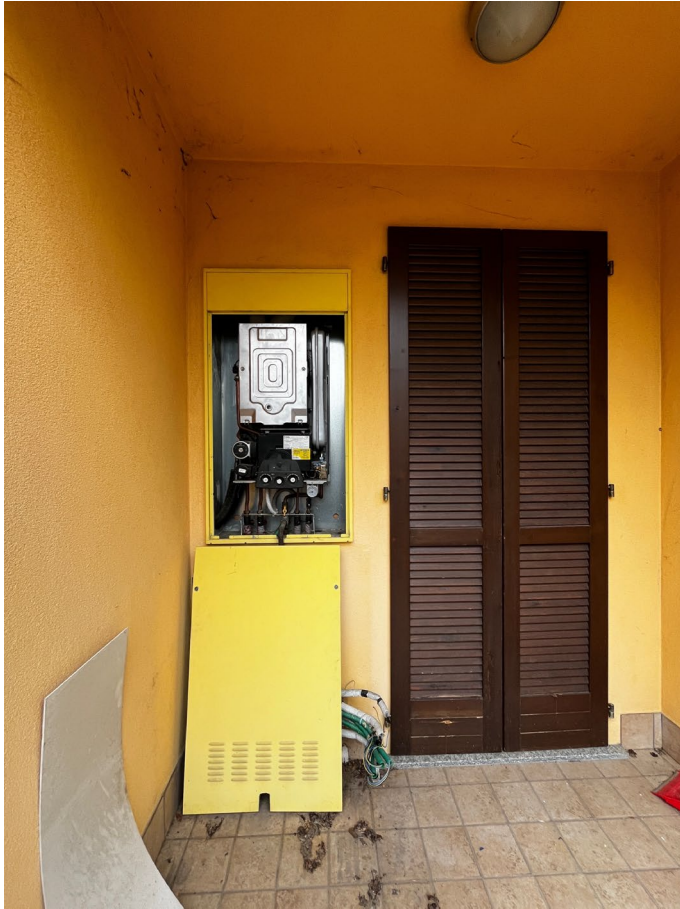
Immagine 11. Il terrazzino con la caldaia sul fianco della porta finestra.