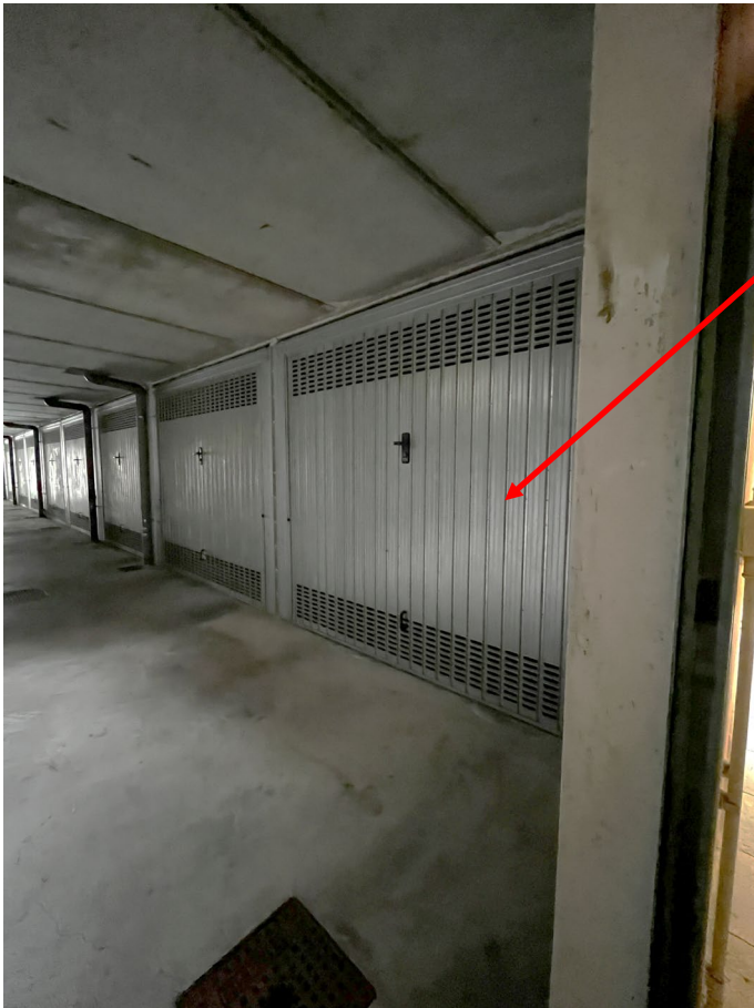
Immagine 25. L'autorimessa pertinenziale. (L'accesso non è stato possibile il giorno del sopralluogo).