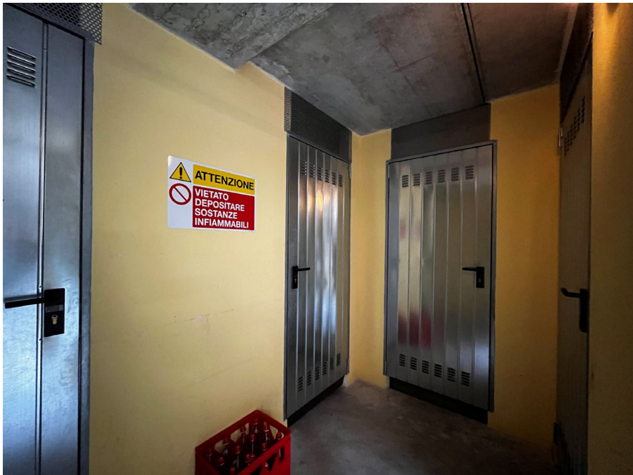
Immagine 26 e Immagine 27. Al termine del corsello in prossimità della rampa sono localizzate alcune cantine tra cui quella di pertinenza dell'unità oggetto di valutazione e essa stessa parte del compendio (L'accesso non è stato possibile il giorno del sopralluogo).