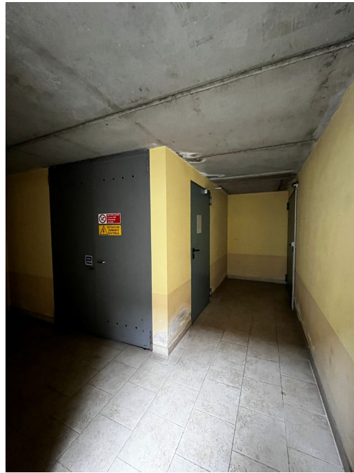
Immagine 20. La scala che dal cortile permette di scendere al piano box e cantine e il disimpegno ( Immagine 21 ) rispetto all'autorimessa.