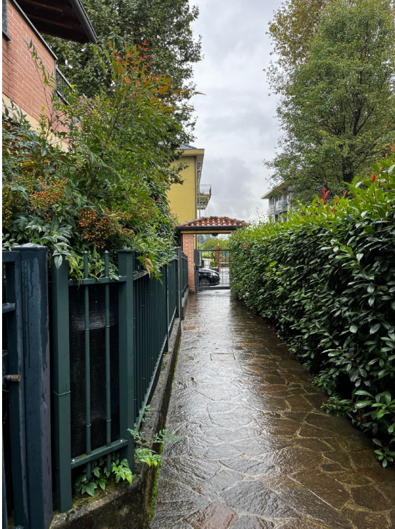
Immagine 1. Vialetto di ingresso; sul fondo si nota il cancelletto di ingresso al condominio dalla pubblica via.