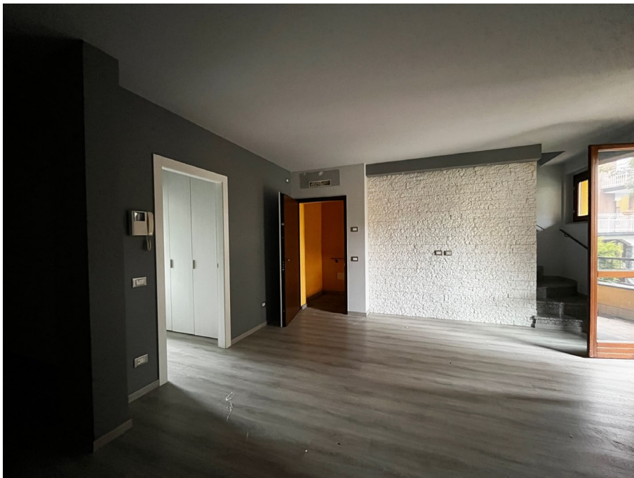
Immagine 5. L'ingresso dalle scale all'appartamento; vista dall'interno. Si nota il video - citofono sulla parete che separa soggiorno dalla cucina.