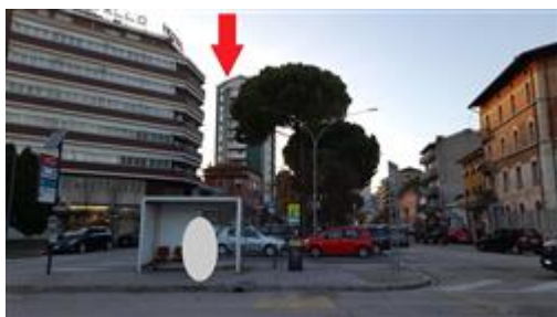
Fabbricato visto da piazzale Gabriele d'Annunzio

L'intero edificio sviluppa 15 piani, 14 piani fuori terra, 1 piano interrato. Immobile costruito nel 1961.