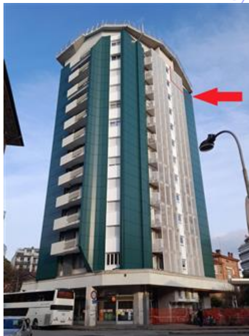
Facciata posteriore lato autostazione corriere