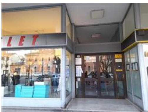
Ingresso al fabbricato dal viale Leopardi