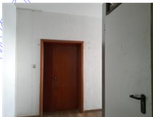
Ingresso all'appartamento dal vano scale condominiale