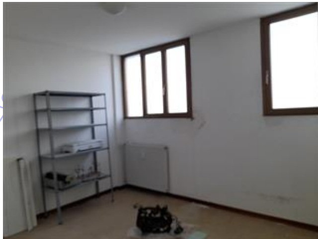
stanza al 13° piano