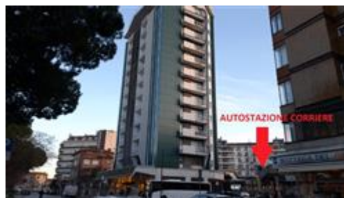
Fabbricato e autostazione corriere visti da via Leopardi verso piazzale d'Annunzio