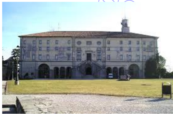
Castello di Udine