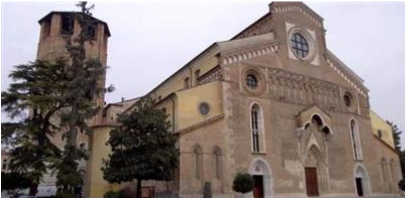
Cattedrale Santa Maria Annunziata - Duomo di Udine