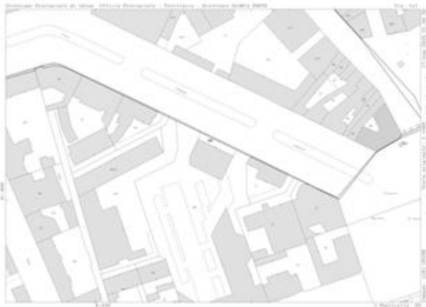
copia di mappa