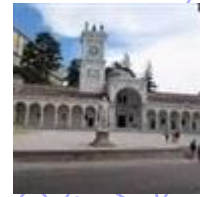
Loggia del Lionello