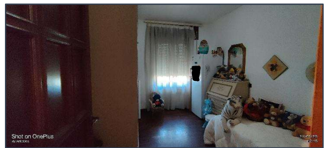
Figura 6 Camera da letto doppia