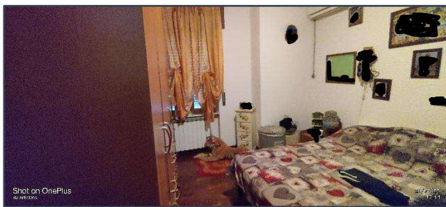
Figura 5 Camera da letto matrimoniale