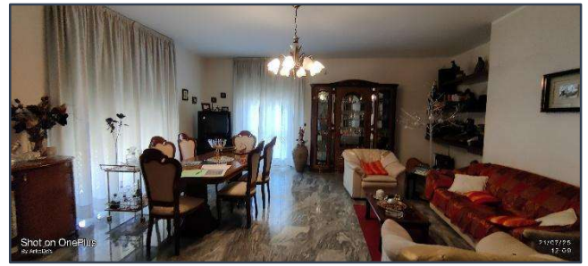
Figura 2 Salotto-pranzo