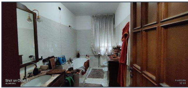
Figura 3 Bagno principale