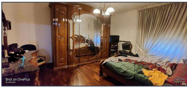
Figura 7 Camera da letto matrimoniale