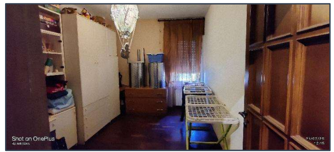
Figura 8 Camera da letto doppia

(Cifra Allegato 12 Documentazione fotografica "Lotto Unico")