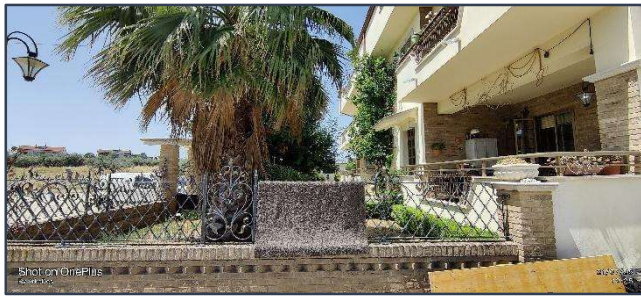
Figura 1 Fronte principale