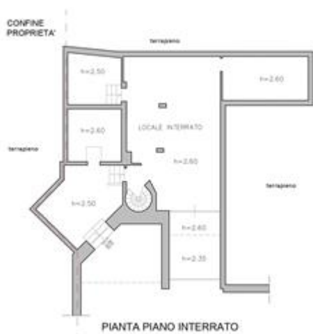
PIANTA PIANO INTERRATO - STATO DI FATTO