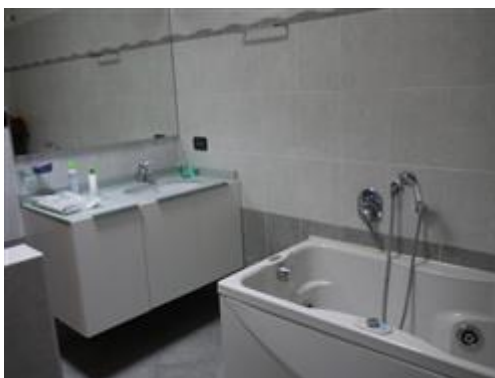
viste interne piano terreno bagno esistente nei locali da destinare deposito