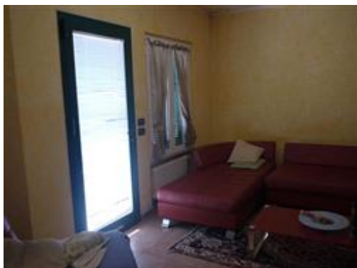
viste interne piano terreno soggiorno

Le condizioni di manutenzione delle finiture e delle dotazioni impiantistiche sono in generale appena sufficienti anche se, considerato il protratto periodo di inutilizzo, va certamente previsto un intervento di controllo ed eventuale adeguamento delle dotazioni impiantistiche e di generale ripresa delle finiture, oltre che naturalmente, un intervento di rimessa in pristino delle difformità urbanistiche sopra segnalate che verranno meglio descritte nei capitoli che seguono.