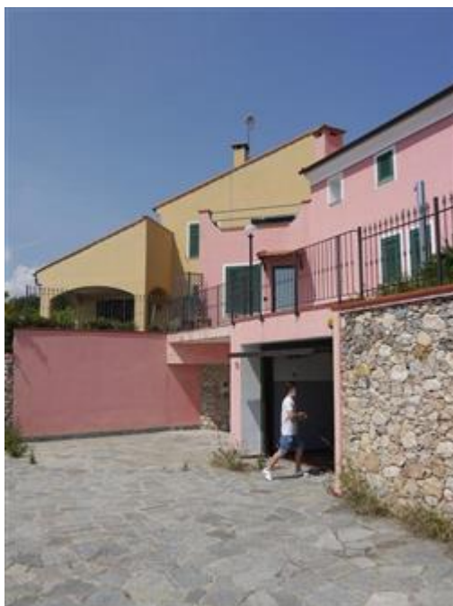
Porzione di villa bifamigliare viste dalla corte pertinenziale esclusiva