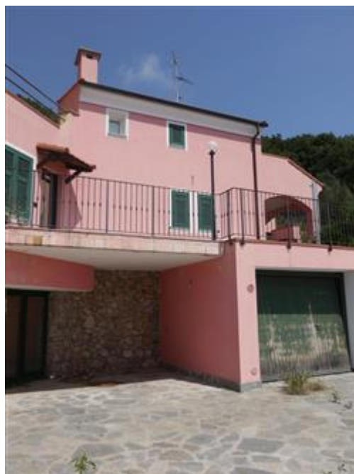
Porzione di villa bifamigliare viste dalla corte pertinenziale esclusiva