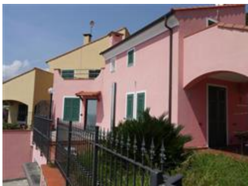
Porzione di villa bifamigliare viste piano terreno parte abitativa