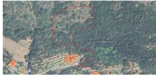
DELIMITAZIONE PROPRIETA' SU BASE SATELLITARE