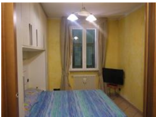
viste interne piano terreno camera da letto