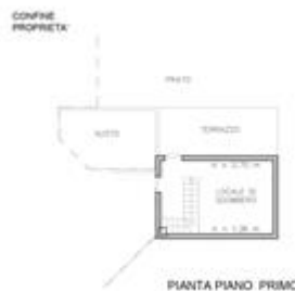
PIANTA PIANO 1 - AUTORIZZATO