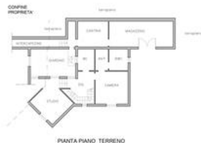
PIANTA PIANO T - AUTORIZZATO

Permane in ogni caso l'alea di incertezza riconducibile alla discrezionalità del parere vincolante che la Soprintendenza sarà chiamata a rilasciare sugli aspetti di natura paesaggistica.