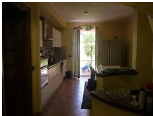
viste interne piano terreno cucina