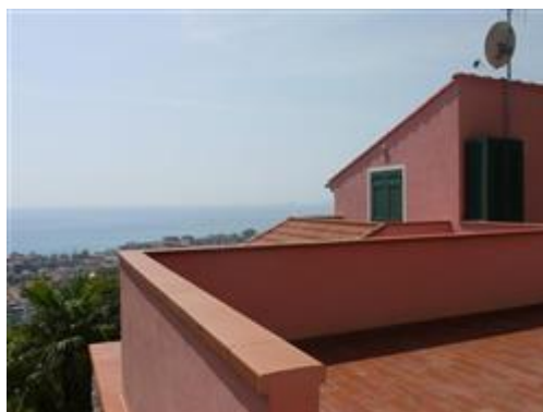
Porzione di villa bifamigliare vista da terrazza piano primo