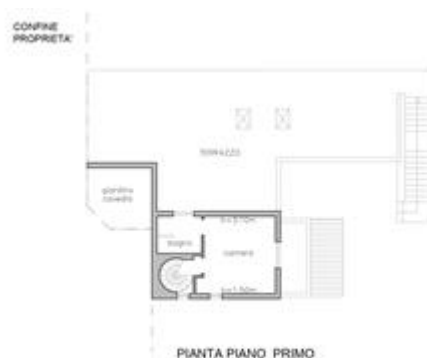
PIANTA PIANO PRIMO - STATO DI FATTO