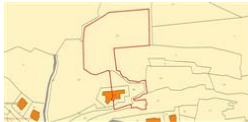
DELIMITAZIONE PROPRIETA' SU BASE CATASTALE