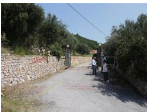
Accesso al complesso da via San Francesco - porzioni di proprietà di terzi