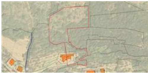
DELIMITAZIONE PROPRIETA' - SOVRAPPOSIZIONE SATELLITE/CATASTO