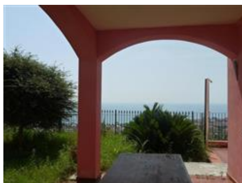
vista porticato cucina