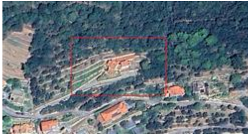
INDIVIDUAZIONE EDIFICIO - VISTA SATELLITARE