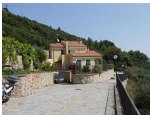
Porzione di accesso di proprietà di terzi