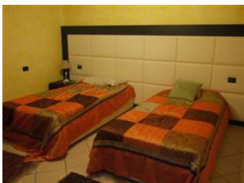
viste interne piano terreno locali da destinare a deposito