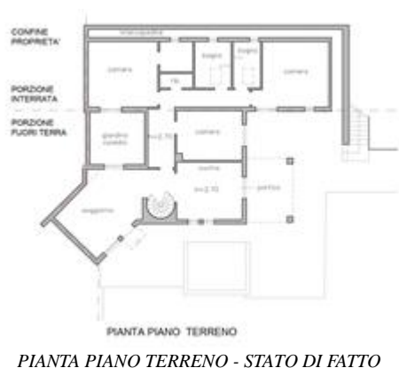
PIANTA PIANO TERRENO - STATO DI FATTO