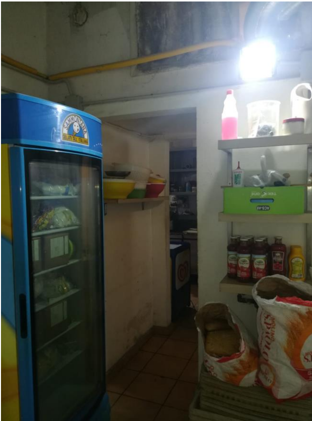
Foto n. 9 : Vista su porzione della chiostrina adibita a deposito/magazzino;