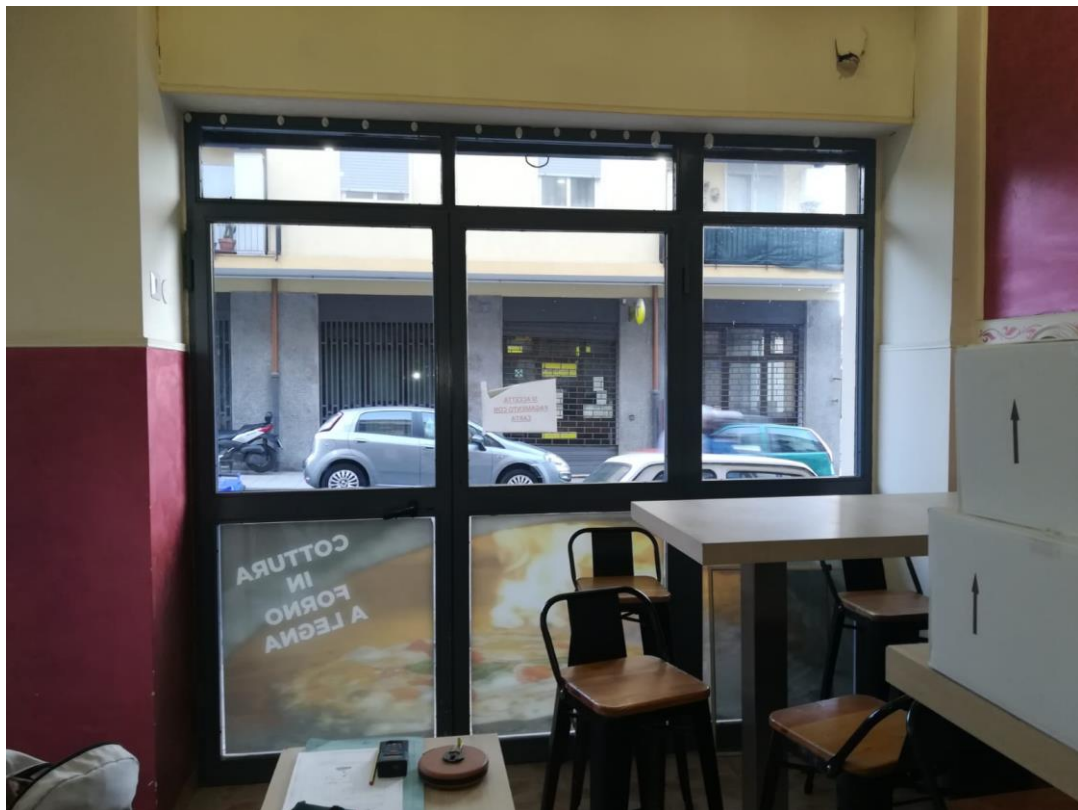
Foton.2 : Vista interno negozio verso la via Palermo;