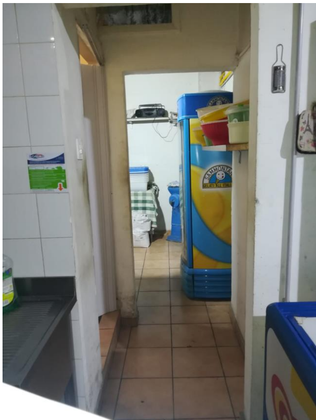
Foton.3 : Disimpegno tra chiostrina e il wc;