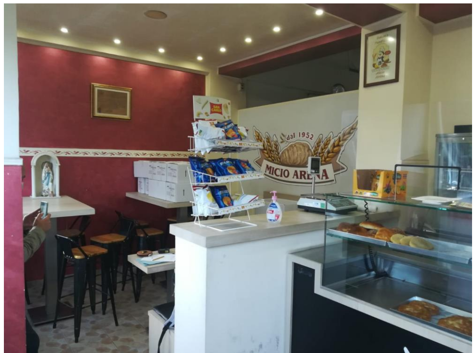
Foto n. 12 : Area destinata alla consumazione in loco dei preparati ;