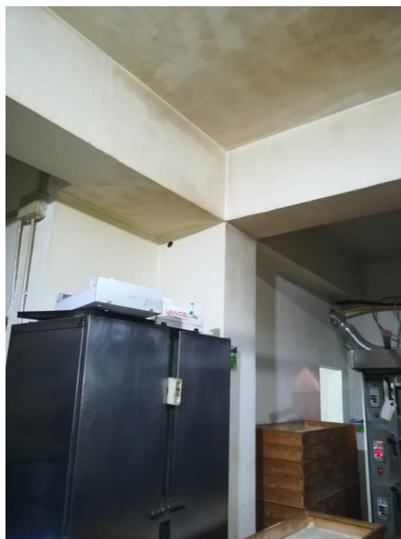
Foton.4 : Particolare della zona adibita a preparazione pane ;