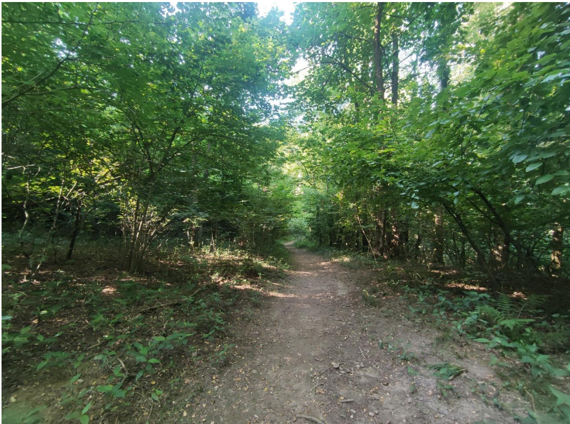
5. Sentiero di accesso alla part. 565 del Comune di Alzate B.