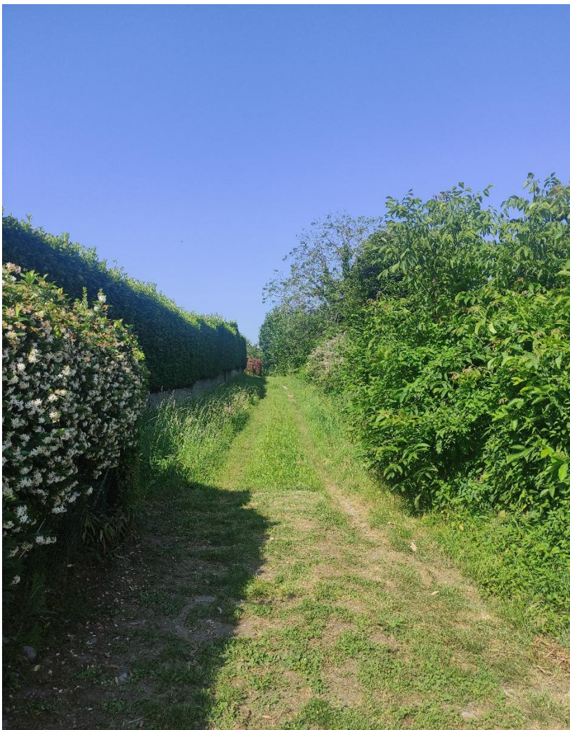
4. Strada di accesso dalla zona edificata