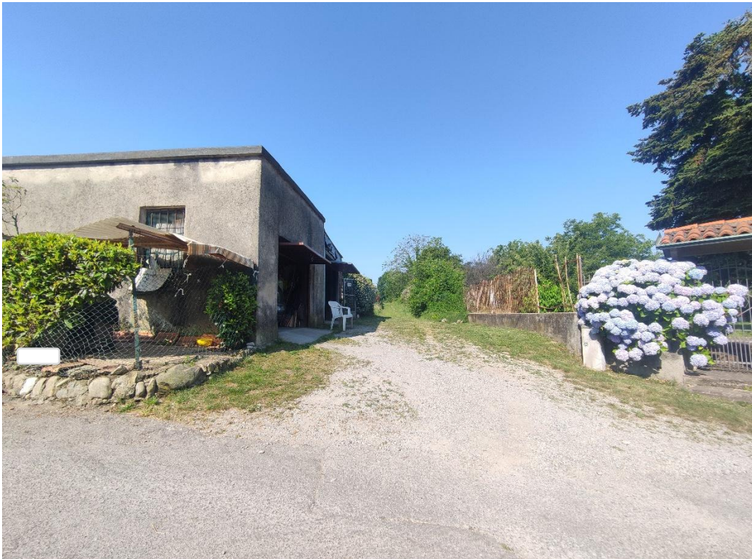
3. Strada di accesso dalla zona edificata di Via Monte Sabotino