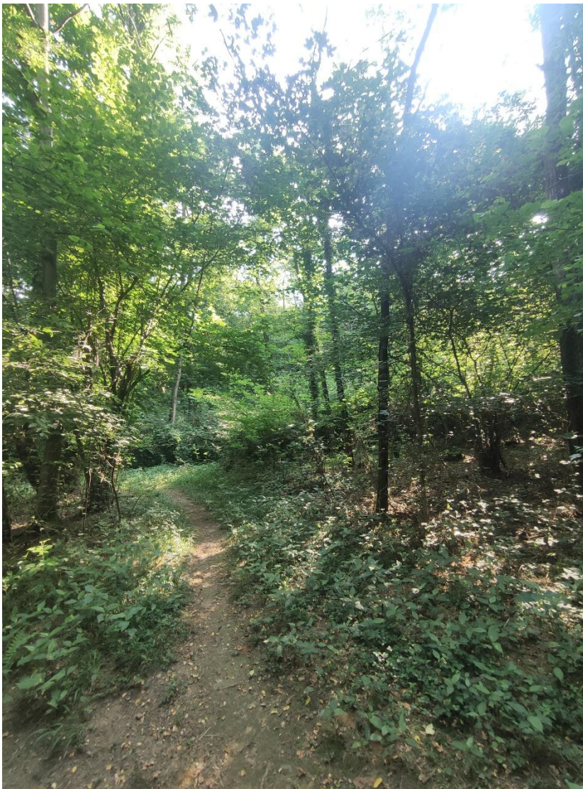
6. Vista sentiero e terreno part. 565 del Comune di Alzate B.