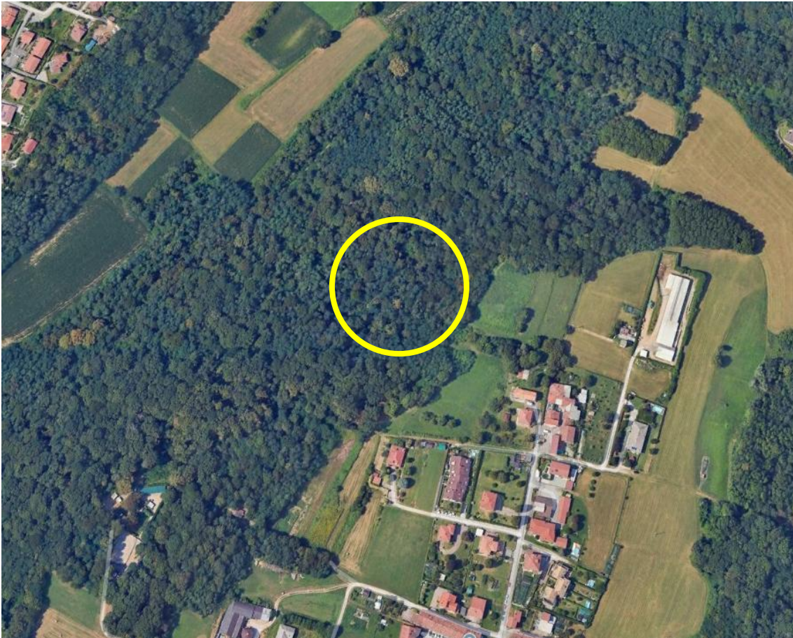
1. Vista Google Earth