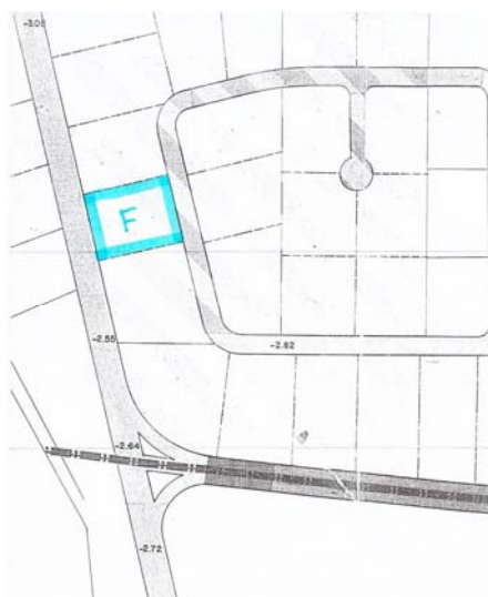
Stralcio di PP con evidenziazione del sito interessato e lotto "F", successivamente edificato

Per tutto ciò che non è stato specificatamente indicato nella presente - secondo l'art. 871 del C.C. - si intendono applicabili le vigenti disposizioni di legge in materia e, naturalmente, del Regolamento Edilizio del Comune di Nettuno.