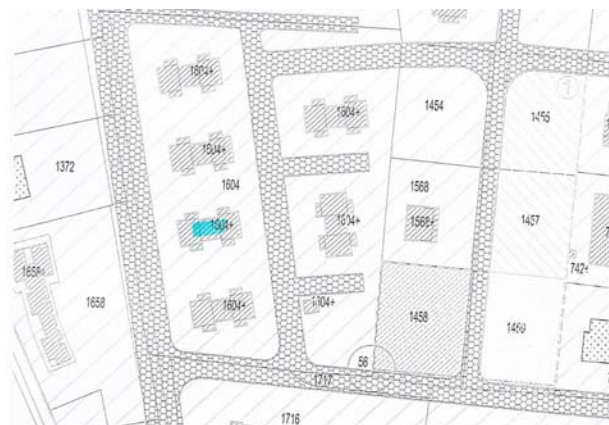
Stralcio dei nuovi PP (solo adottati)

Con la nuova proposta di P.P. adottata dal C.C. con Delibera n. 22 del 10-04-13, non è apportata alcuna modifica normativa alle zone "Q – verde privato", tranne un incremento della viabilità, previsto a beneficio degli immobili, che non interferisce con la legittimità delle costruzioni realizzate in conformità ai PP, precedentemente vigenti, come si evince anche dal nuovo stralcio, in cui è perfettamente riconoscibile la palazzina "F", che comprende la porzione di villino corrispondente all'immobile eseguito.