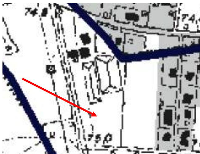
Stralcio della tav. B del PTPR e localizzazione dell'edificio

Tav. C – ( art. 60 c 2) Definizione degli insediamenti urbani storici aggregati o centri storici e degli insediamenti storici puntuali.