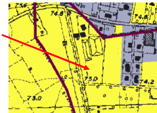
Stralcio della tav. A del PTPR e localizzazione dell'edificio

4°) La tutela è volta al mantenimento della qualità del paesaggio rurale mediante la conservazione e la valorizzazione dell'uso agricolo e di quello produttivo compatibile.