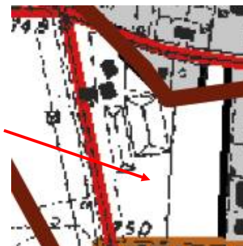
Stralcio della tav. C del PTPR e localizzazione dell'edificio