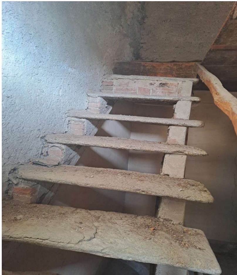
Scala di accesso al piano sottotetto