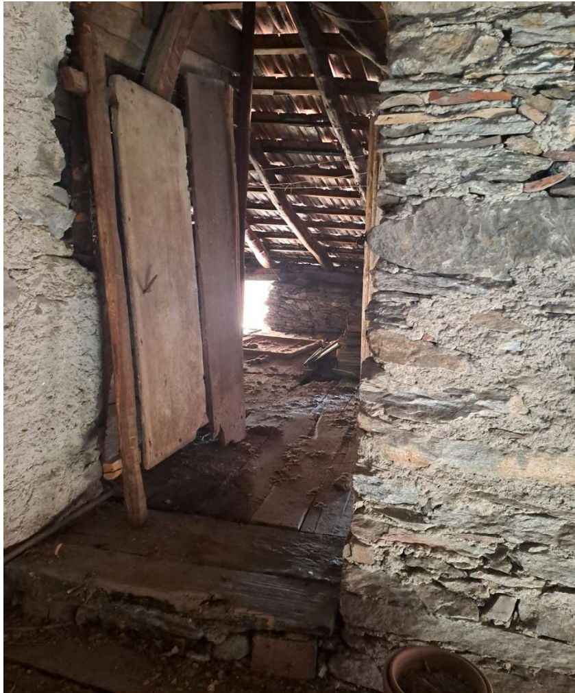
Immagini del sottotetto