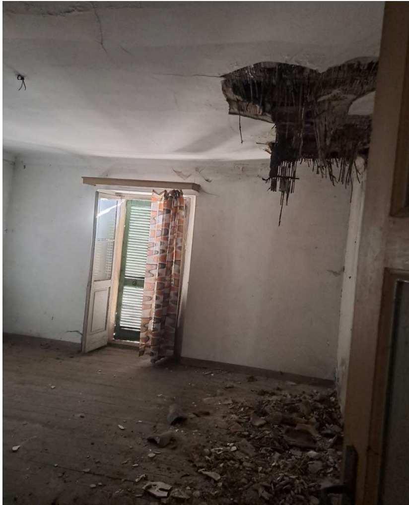
Locale al piano secondo