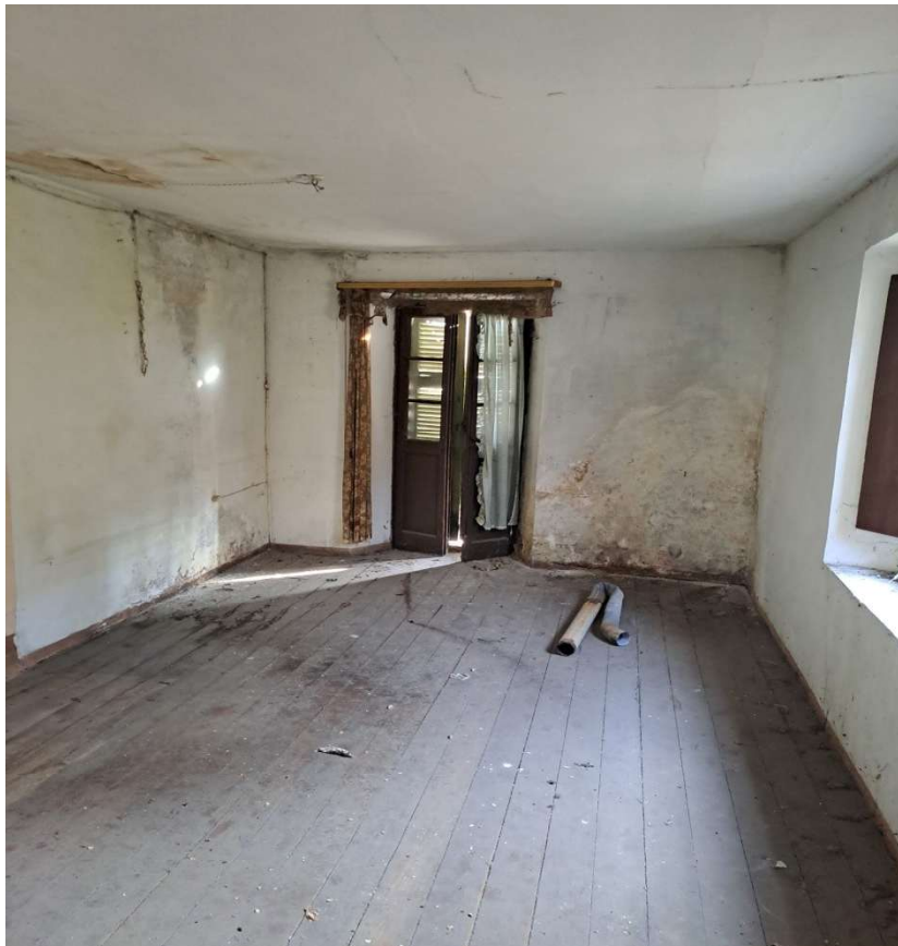
Locale ripostiglio al piano secondo