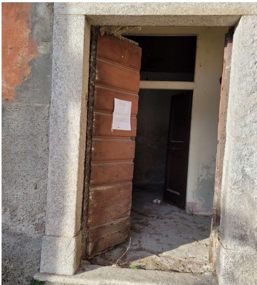
Atrio d'ingresso su Piazza Maggiore, con porta di accesso al ripostiglio