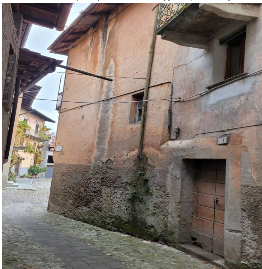
Vista del prospetto su Via Carate Di Sopra (porta d'ingresso al civico 1)