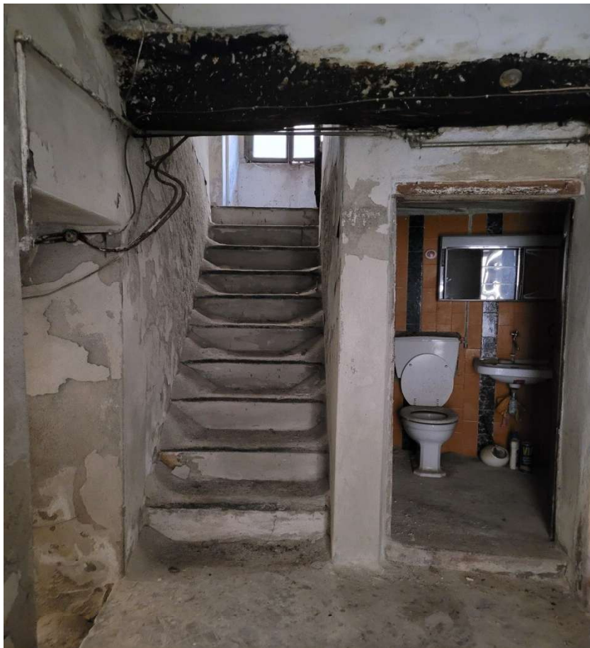
Atrio d'ingresso su via Carate di Sopra, con piccolo wc e vano scala