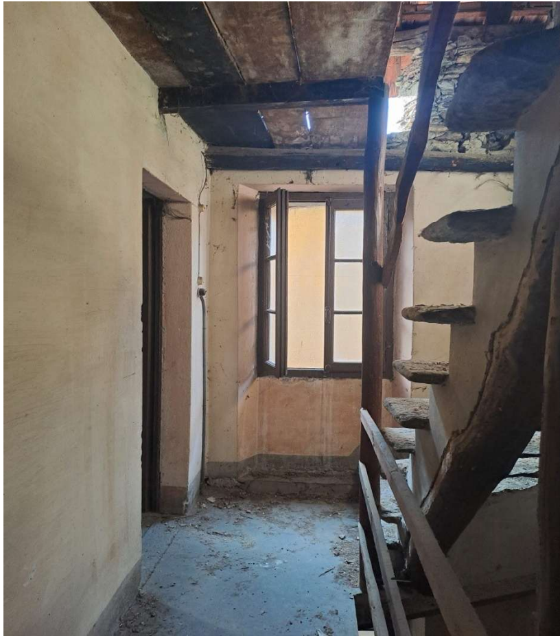
Pianerottolo del secondo piano nel vano scala