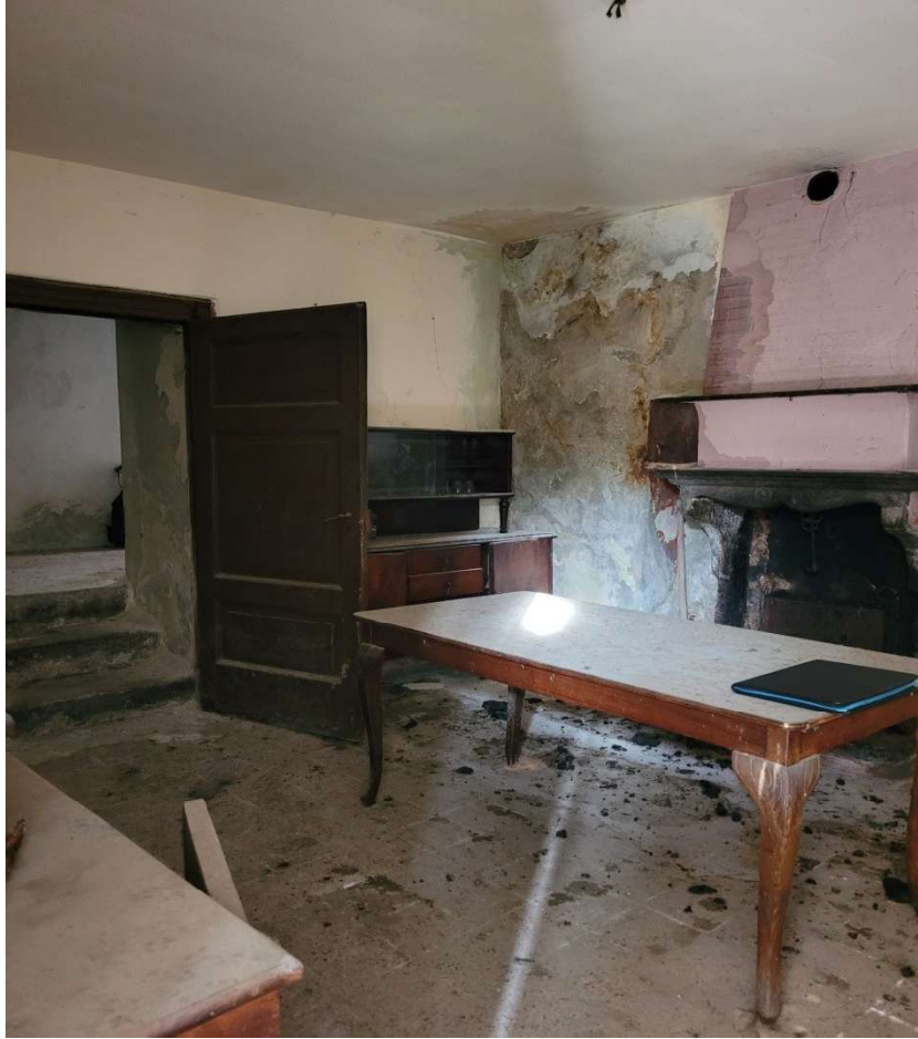
Locale cucina al piano terra