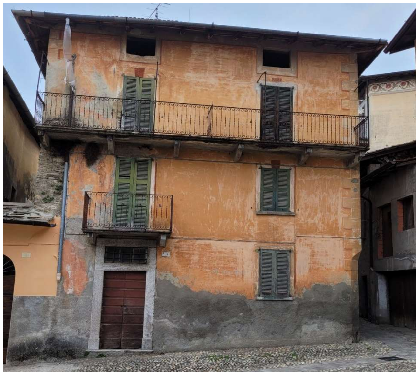
Vista della facciata principale su Piazza Maggiore (porta d'ingresso al civico 4)