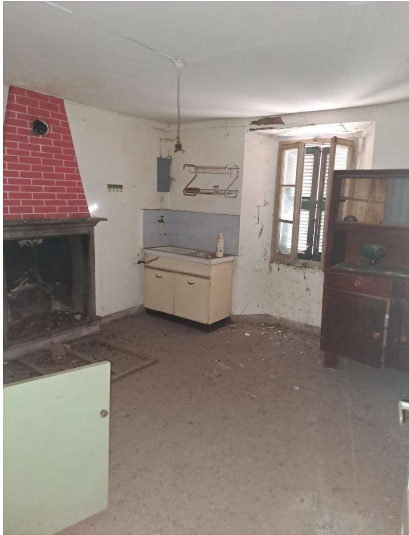
Locale cucina al piano primo