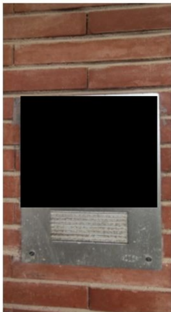
Foto n.7 Pulsantiera citofoni.