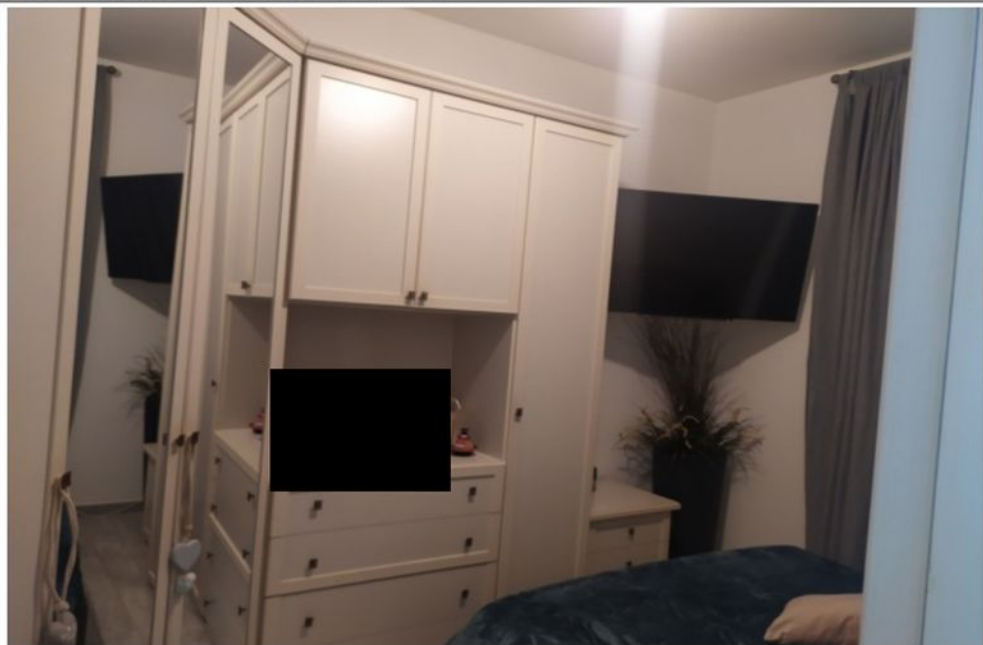
Foto n.12 Vista camera da letto figlio.