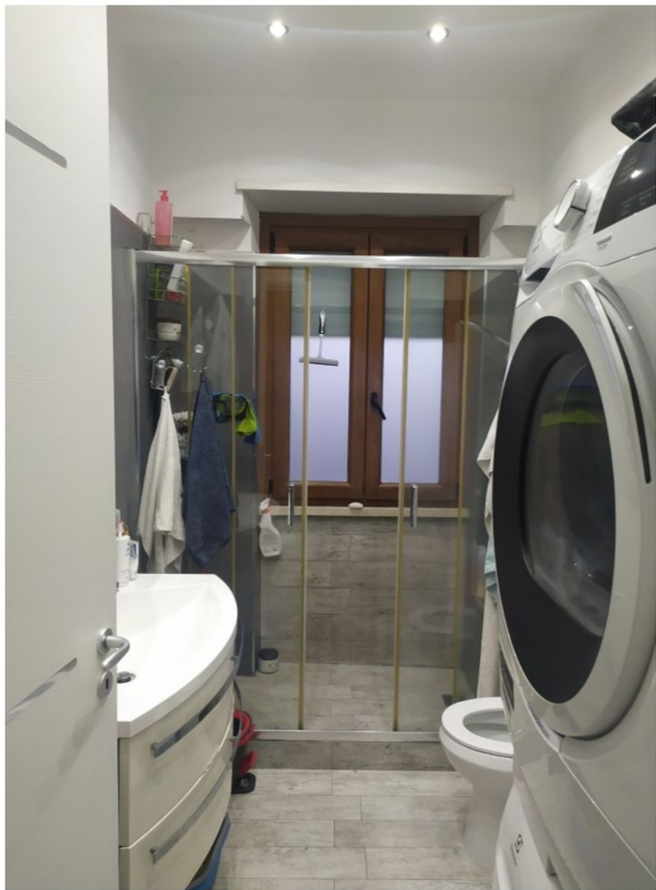
Foto n.13 Bagno.