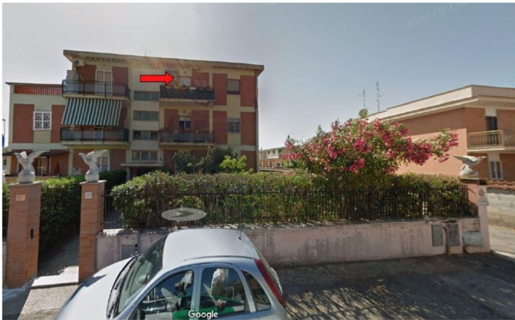
Foto n. 0 Prospetta principale fabbricato. L'appartamento oggetto è indicato dalla freccia rossa