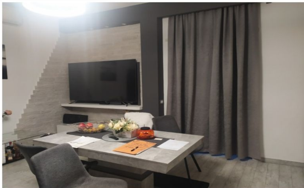
Foto n.9 Vista del soggiorno pranzo dell'appartamento eseguito.