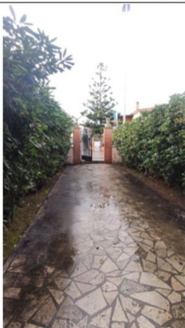
Foto n.6 Vista del camminamento d'ingresso.