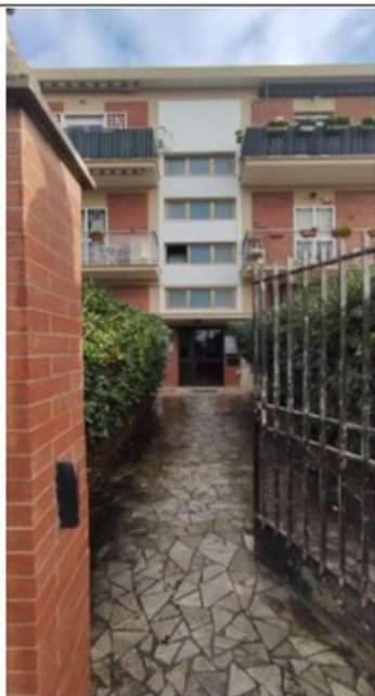
Foto n.5 Vista dell'ingresso alla palazzina Civ. 12