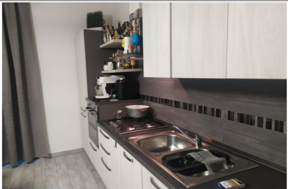
Foto n.10 Vista lato cucina locale soggiorno pranzo.