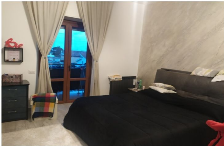
Foto n.11 Vista della camera da letto matrimoniale.