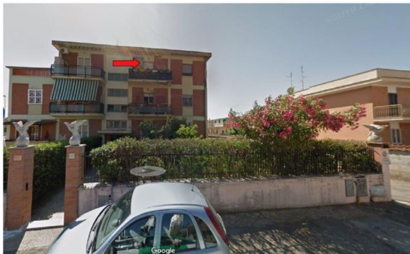
Foto n.9 Prospetto principale fabbricato. L'appartamento eseguito è indicato dalla freccia rossa.