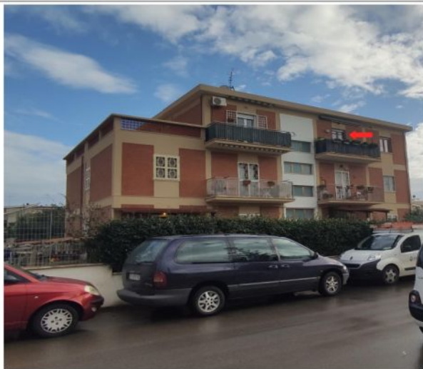
Foto n.4 Condominio di Via Amalfi n.12 Pomezia (RM) loc. Torvaianica. Appartamento eseguito 2° Piano