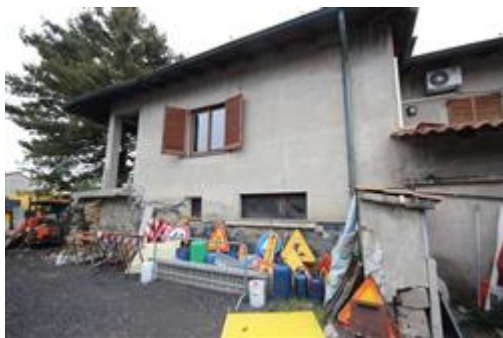
Veduta esterno edificio

BCNC NON PIGNORATI*part.624/702-PT , coerenze in linea di contorno, in senso orario, partendo da nord: part.447, V. Meda, part.624/701 e part.624/704; *part.624/701-PT , coerenze in linea di contorno, in senso orario, partendo da nord: part.624/702, V. Meda, part.1099-1098 e part.624/704.