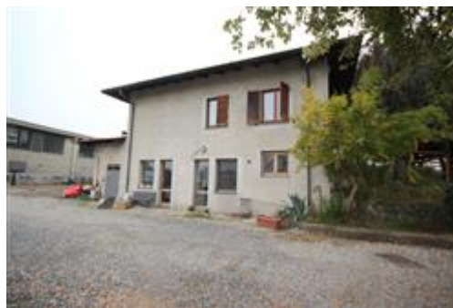
Veduta esterno edificio