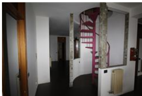
Scala a chiocciola da rimuovere