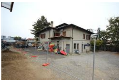
Veduta esterno edificio