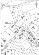
IMMOBILE IN VENDITA STATO ATTUALE Fig. 11 part. 587 - sub 588