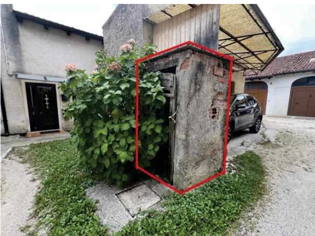
Vista del manufatto (wc) sulla corte esclusiva