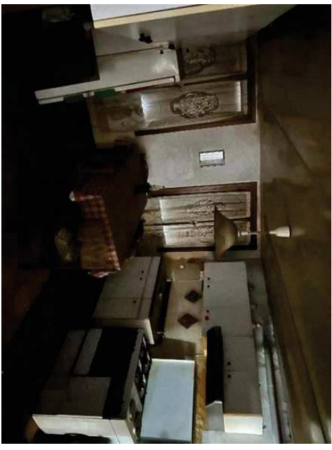
Vista della cucina