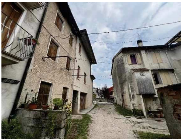
Vista della servitù di passaggio dalla corte comune