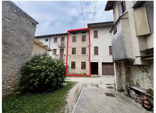
Visa della corte esclusiva sul retro