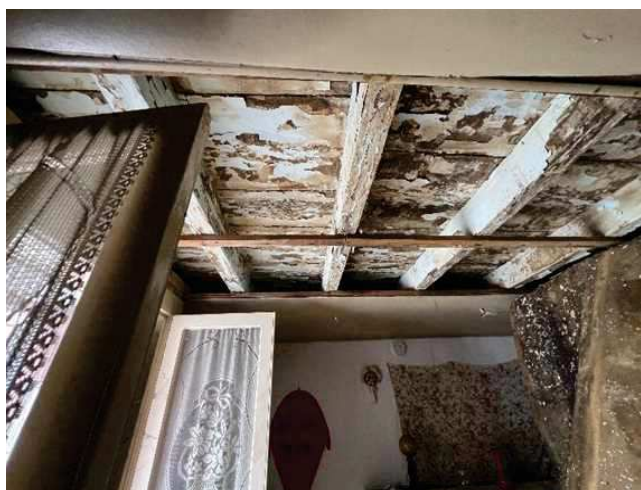
Vista del solaio in legno dell'ingresso al p. rialzato