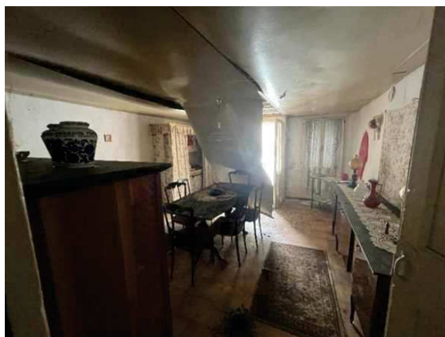
Vista del soggiorno del locale rialzato