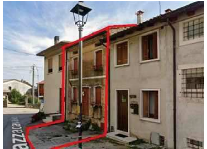
Vista della facciata dalla via Mazzacavallo