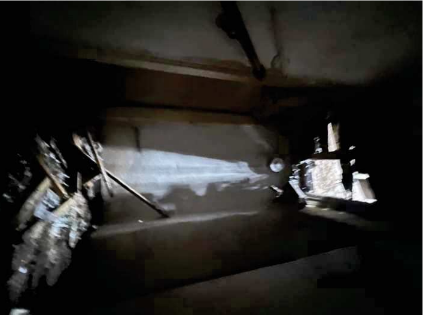
Vista del crollo del solaio del granajo