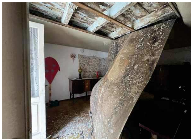
Vista del controsoffitto del solaio in legno crollato