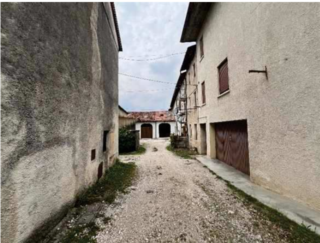
Vista dell'ingresso dalla corte comune