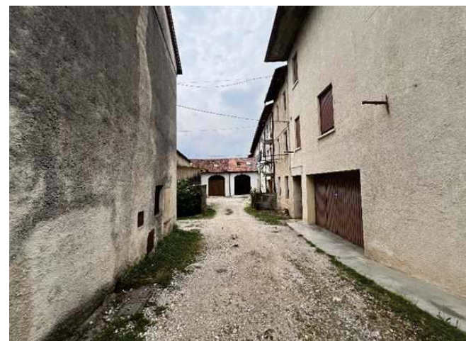
Vista dell'ingresso dalla corte comune sul retro