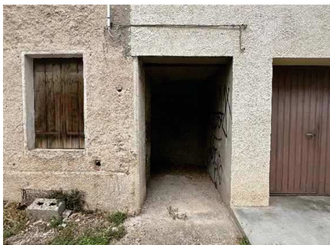
Vista dell'ingresso comune al ripostiglio del p.semint.