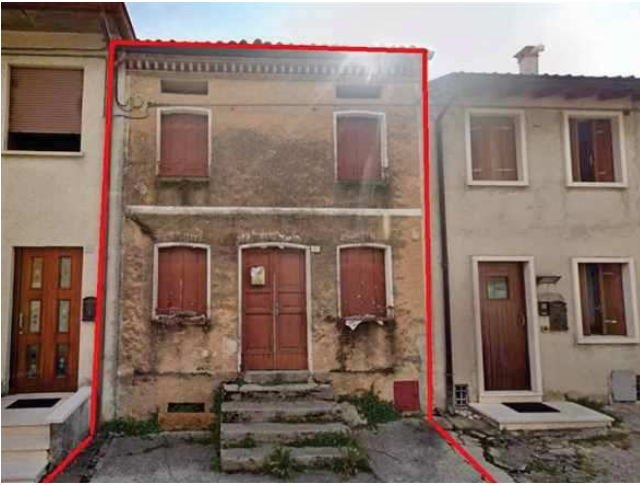
Vista della facciata dalla via Mazzacavallo