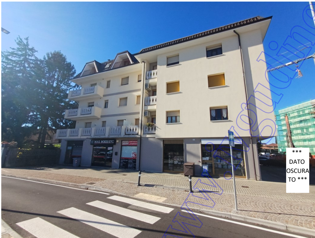
Vista esterna foto 2