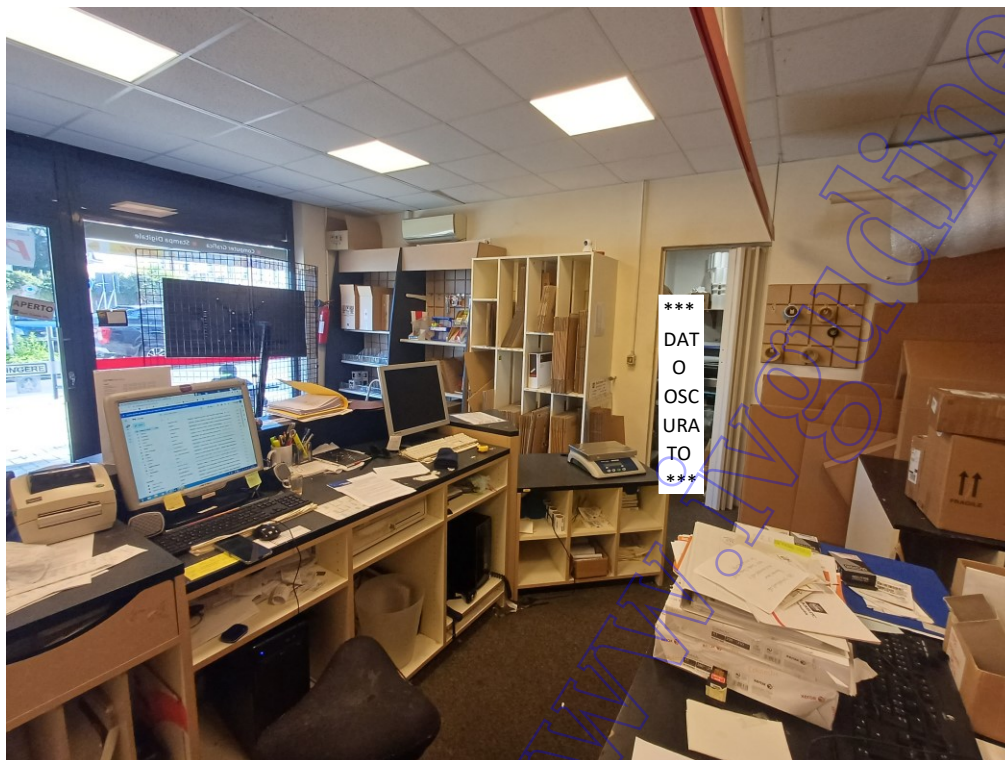
Vista interna negozio foto 2