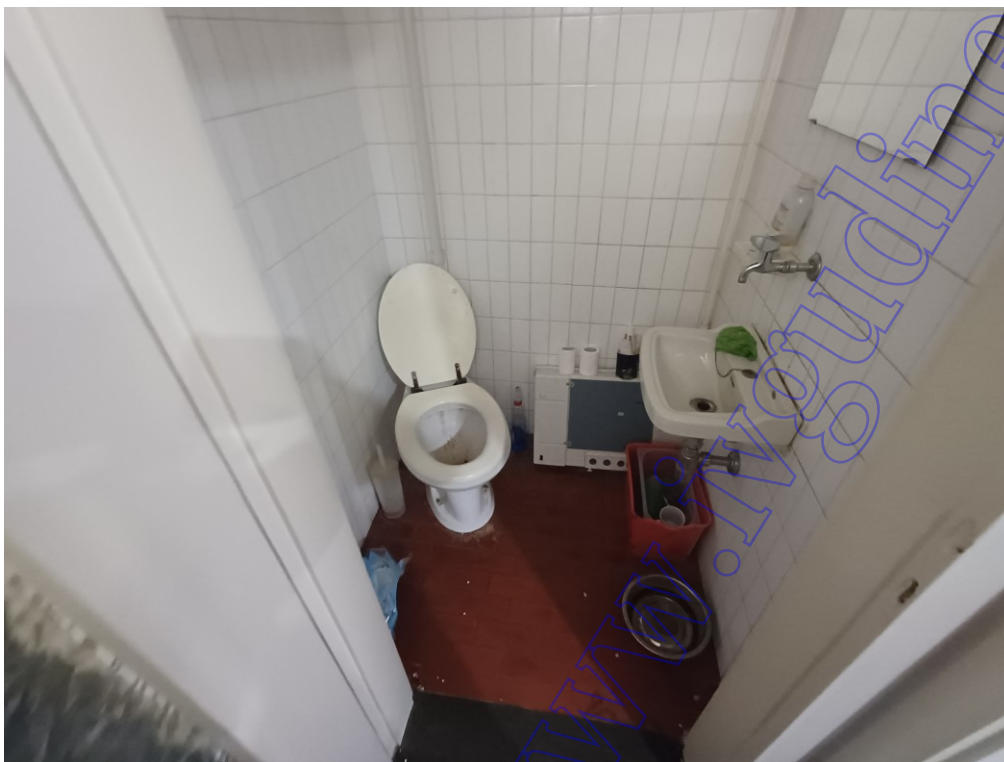
Vista interna negozio foto 4