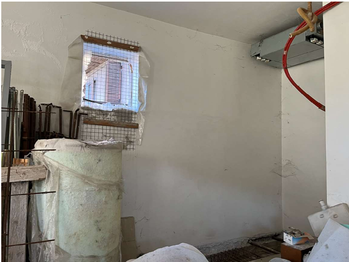
Lotto 3_sub. 10 (2)

Via Sassari n° 8 - 10152 Torino T +39 011 583 5113 F +39 178 274 99 40 P.IVA 09584890017 g.rosotto@architettitorinopec.it