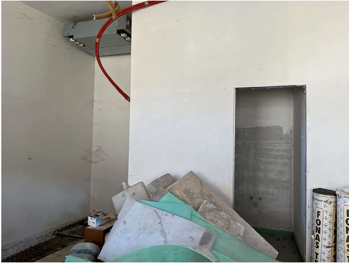
Lotto 3_sub. 10 (1)