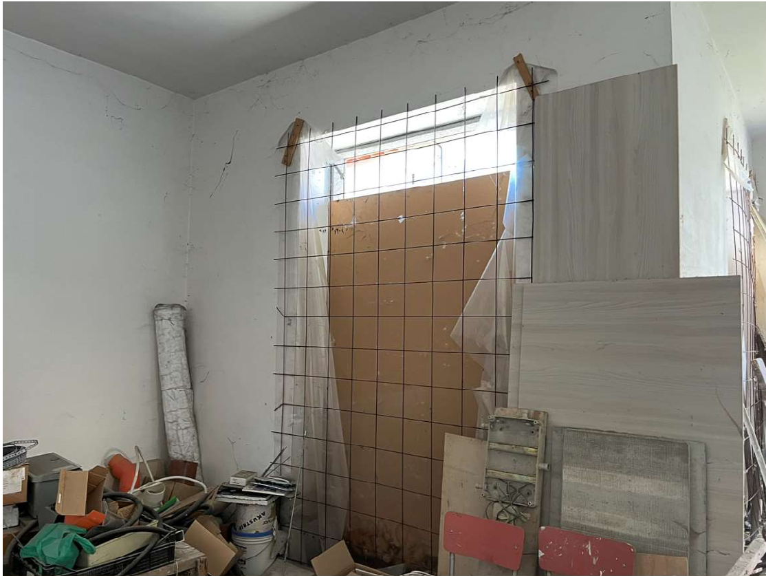
Lotto 3_sub. 10 (9)