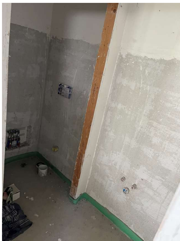
Lotto 3_sub. 10 (8)

Via Sassari n° 8 - 10152 Torino T +39 011 583 5113 F +39 178 274 99 40 P.IVA 09584890017 g.rosotto@architettitorinopec.it