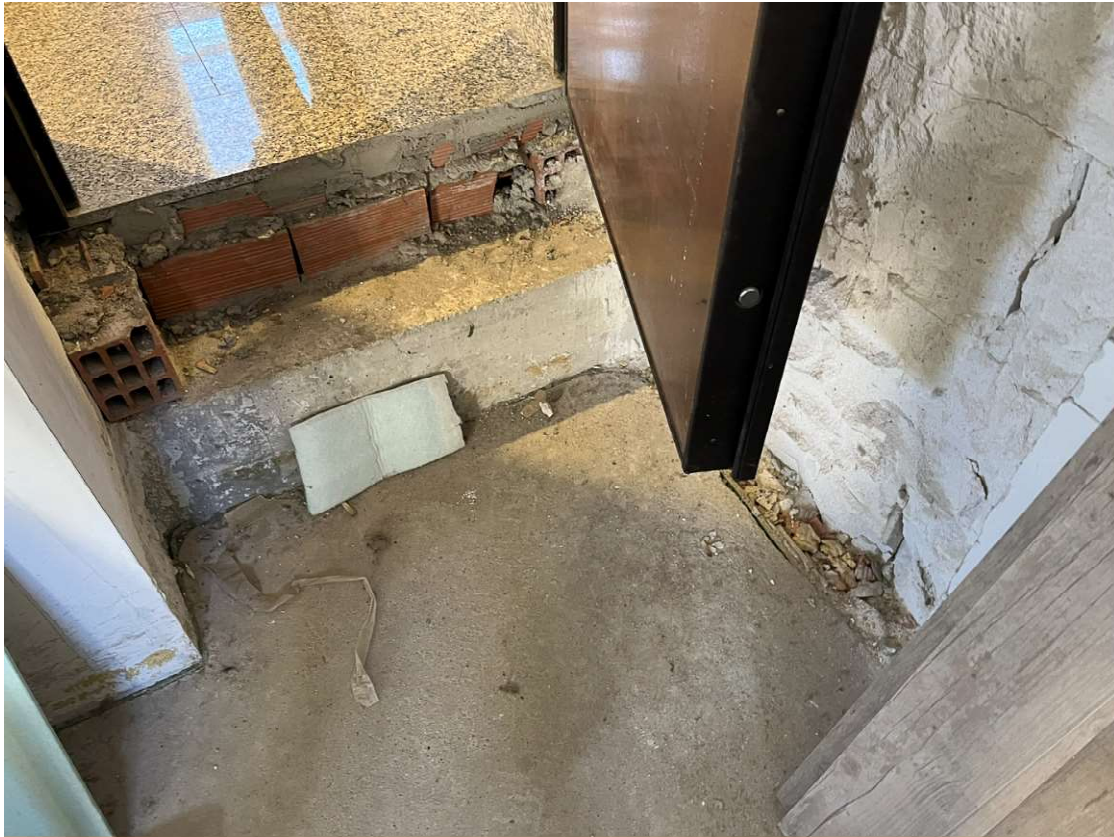
Lotto 3_sub. 10 (11)

Via Sassari n° 8 - 10152 Torino T +39 011 583 5113 F +39 178 274 99 40 P.IVA 09584890017 g.rosotto@architettitorinopec.it