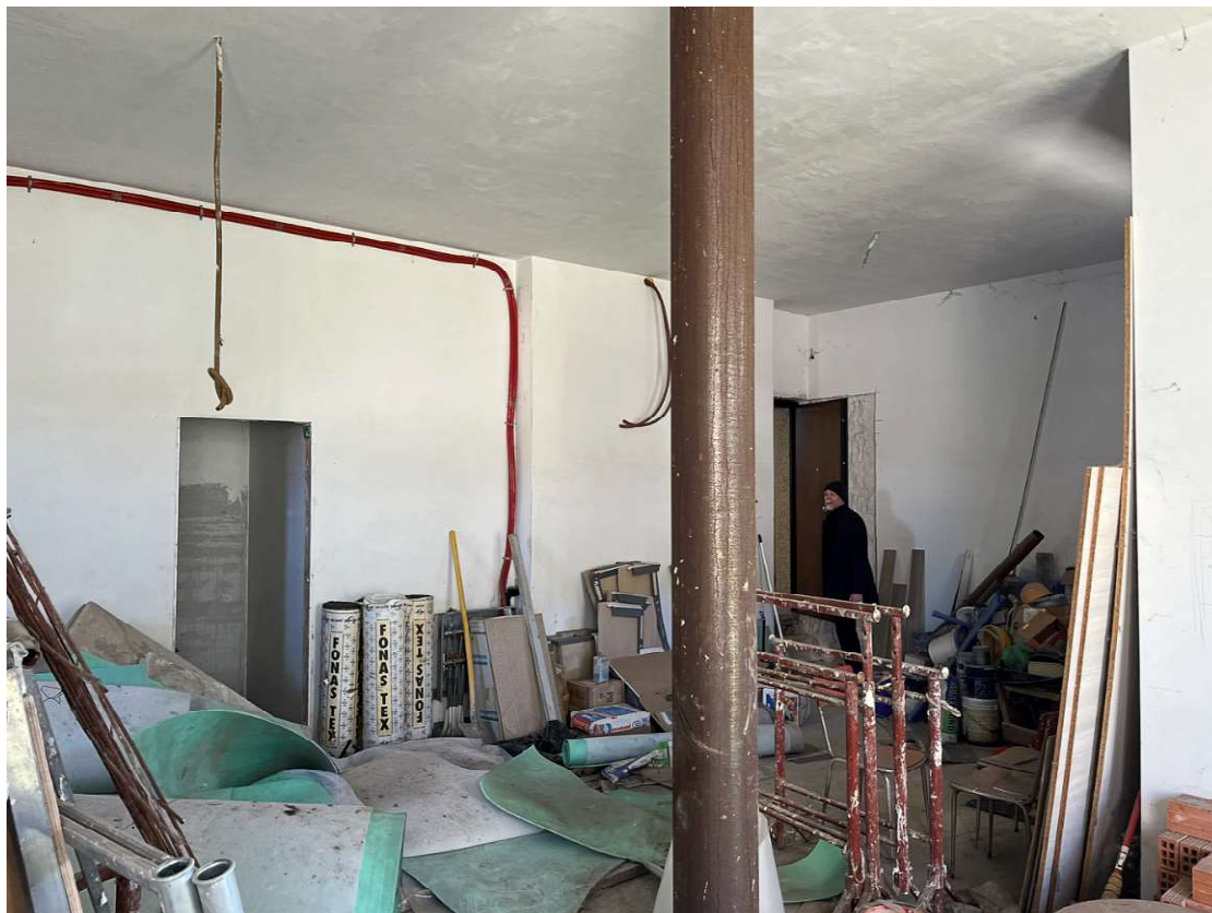
Lotto 3_sub. 10 (5)