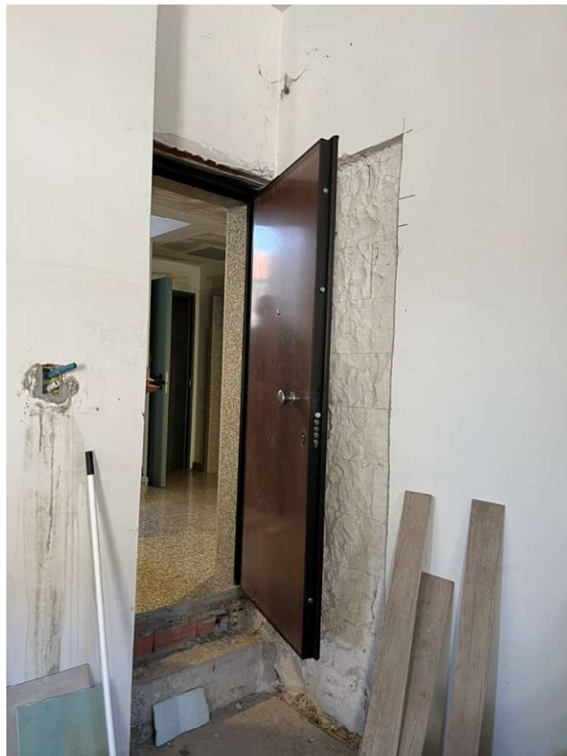
Lotto 3_sub. 10 (10)

Via Sassari n° 8 - 10152 Torino T +39 011 583 5113 F +39 178 274 99 40 P.IVA 09584890017 g.rosotto@architettitorinopec.it