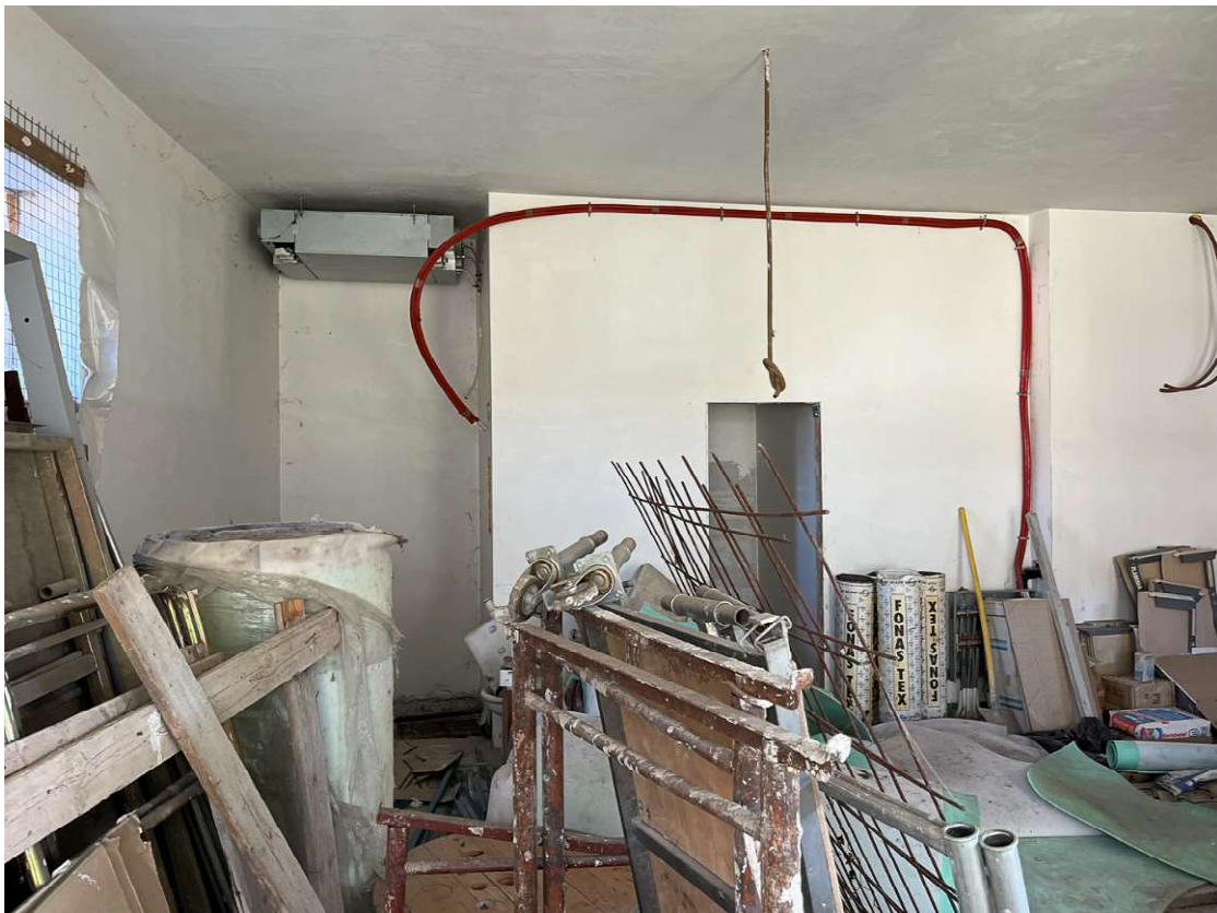
Lotto 3_sub. 10 (4)

Via Sassari n° 8 - 10152 Torino T +39 011 583 5113 F +39 178 274 99 40 P.IVA 09584890017 g.rosotto@architettitorinopec.it