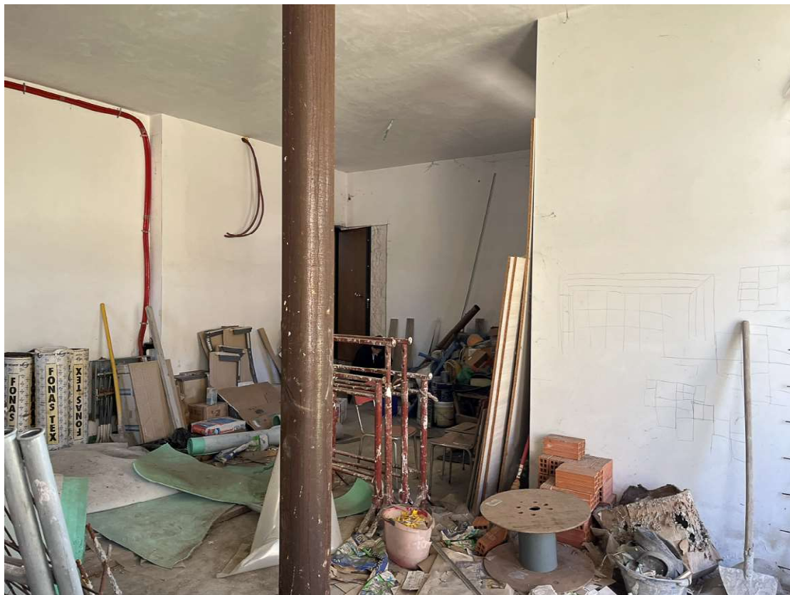
Lotto 3_sub. 10 (7)