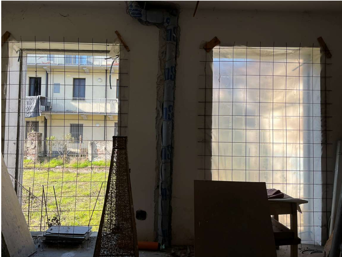
Lotto 3_sub. 10 (3)