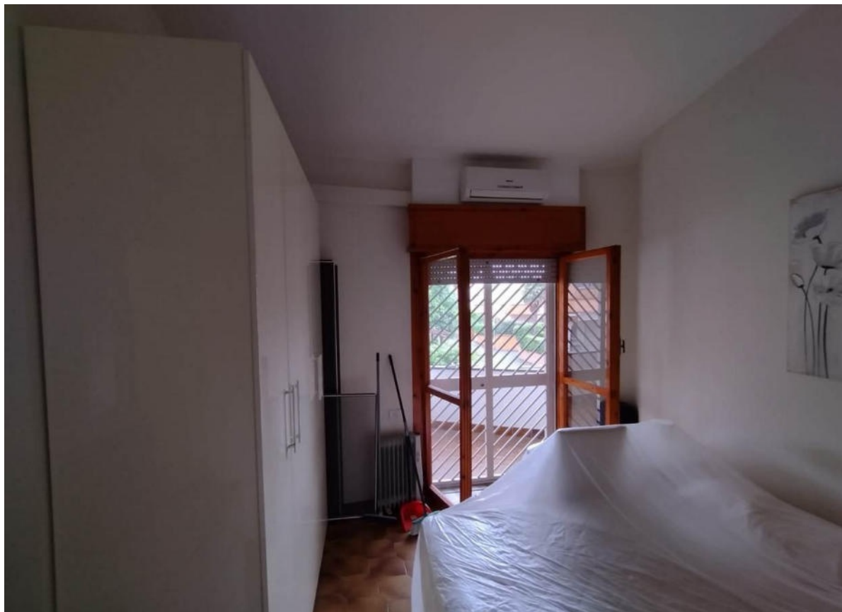
Vista della camera 2