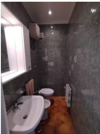
Vista del bagno