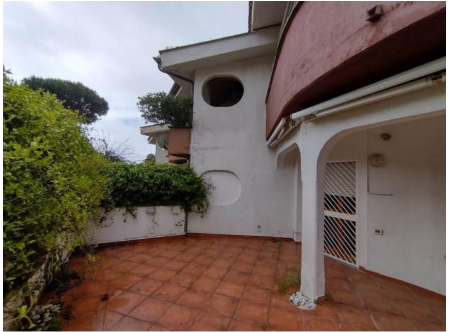
Viste del prospetto principale