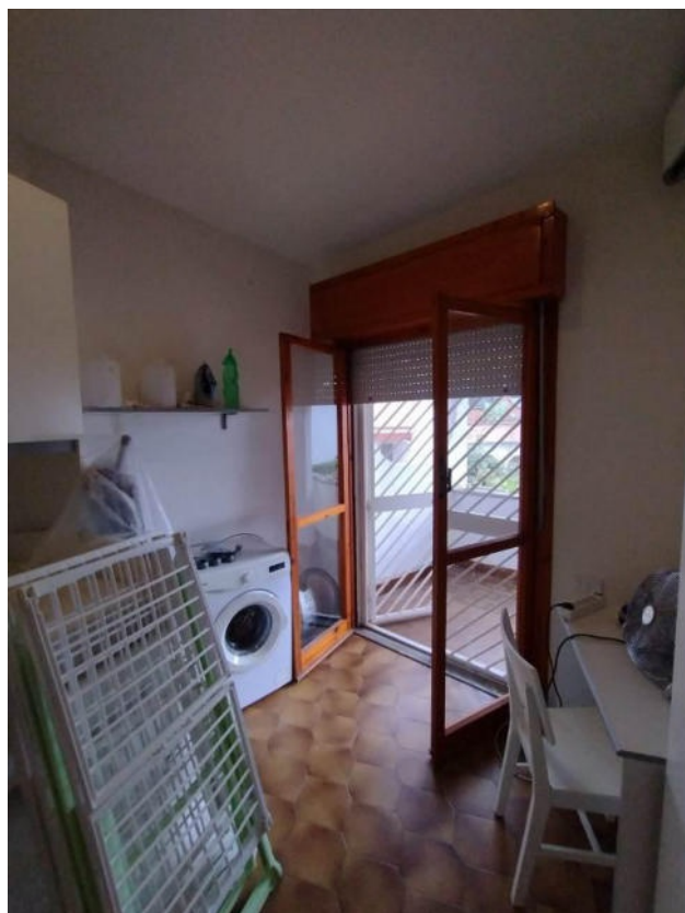
Vista della camera 1