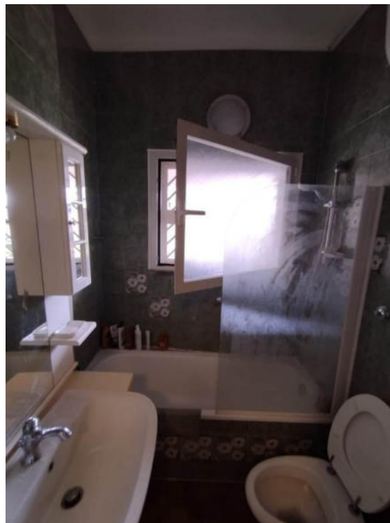
Vista del bagno al 1P