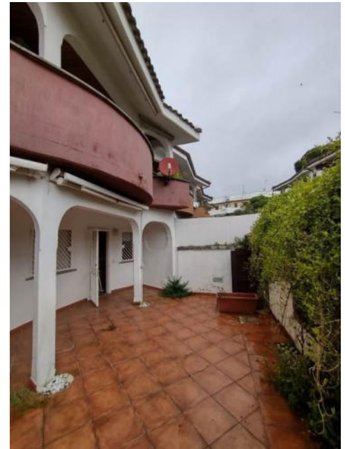
Viste dell'ingresso alla proprietà