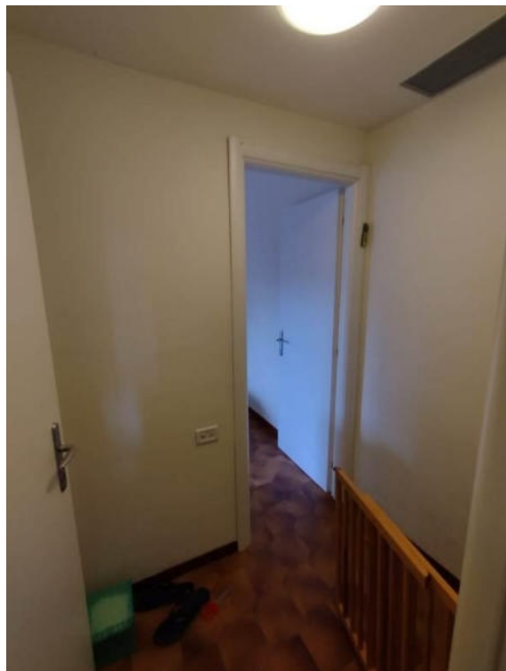
Vista del disimpegno al 1P