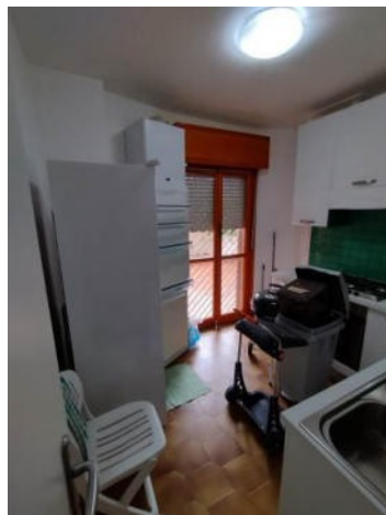
Vista della cucina