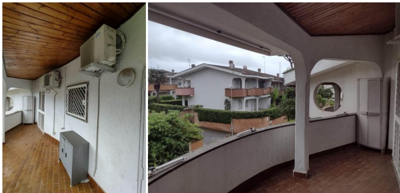
Vista del balcone al piano 1