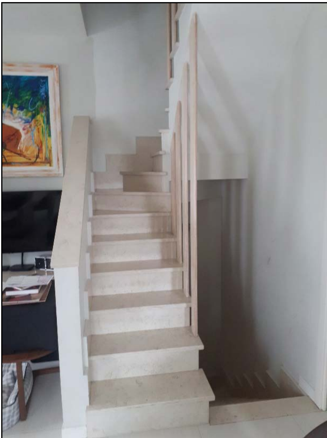
Scala di accesso piani seminterrato e 1°