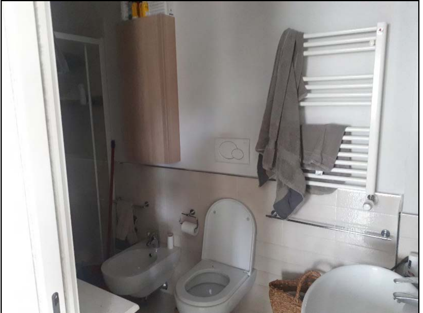
Locale igienico piano terra