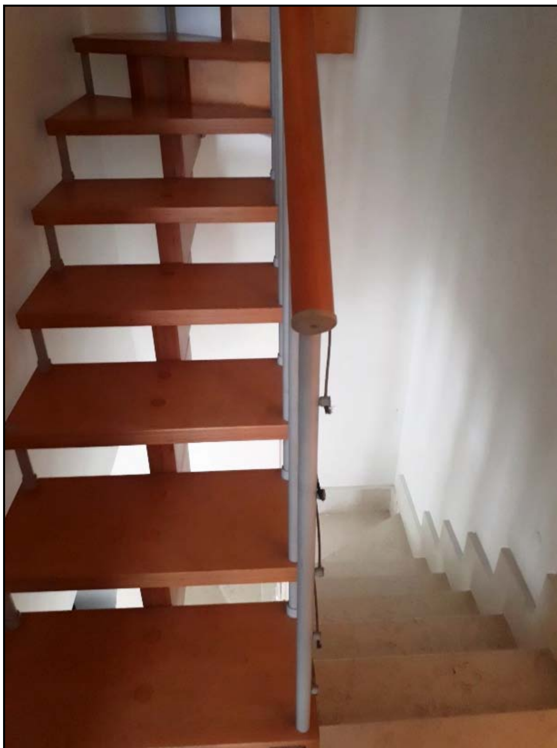
Scala di accesso soffitta