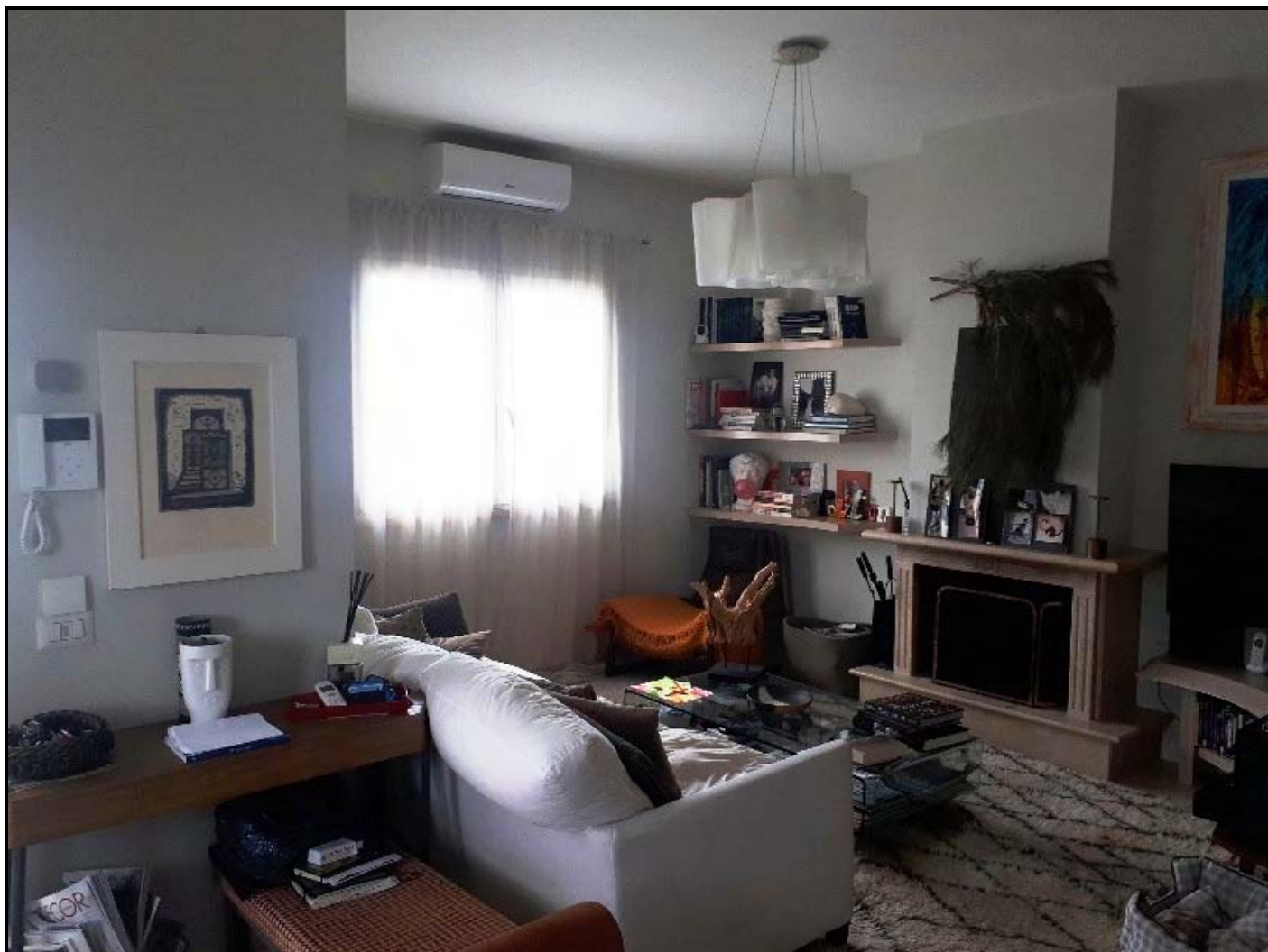
Soggiorno piano terra