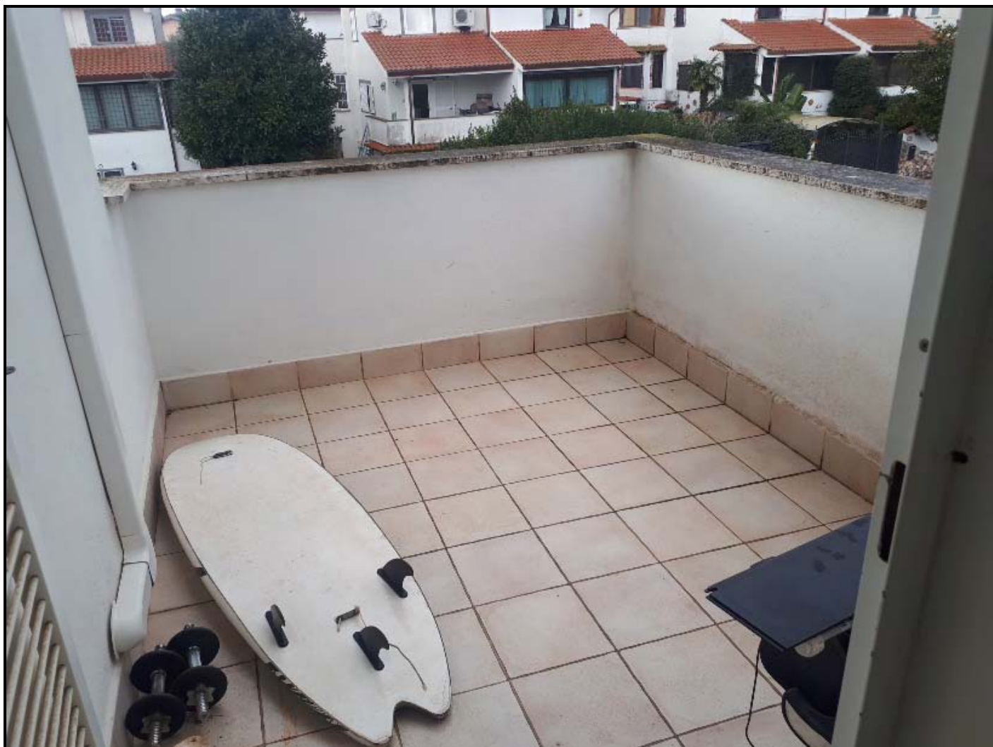
Balcone piano 1°