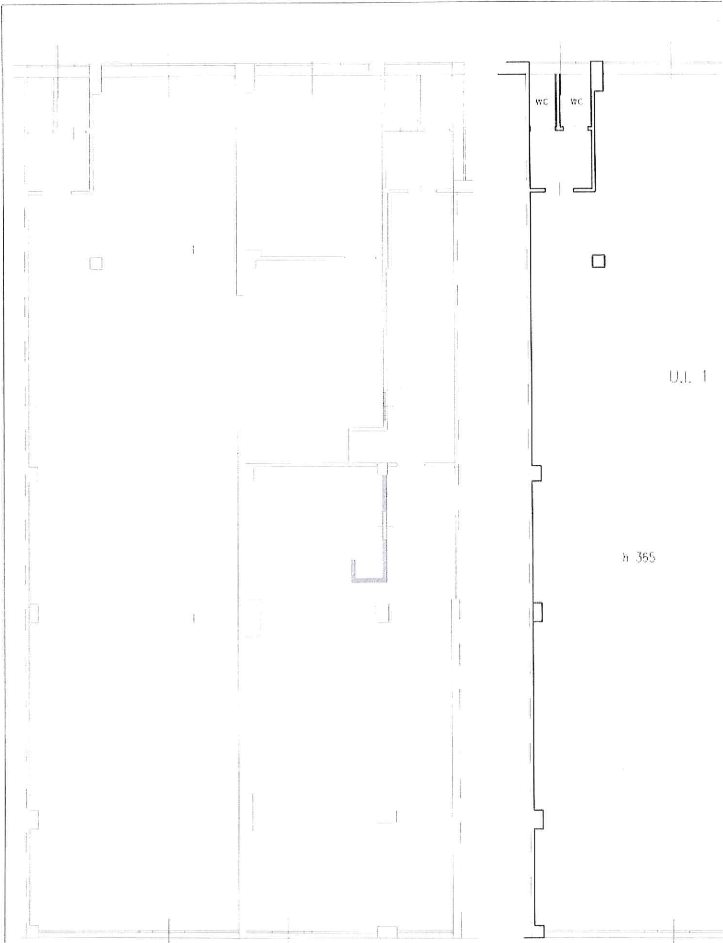
PIANTA STATO COMPARATIVO, scala 1:100