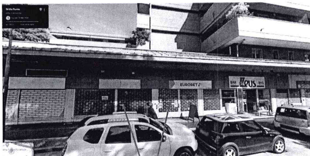
Estratto Ortofoto Ubicazione vetrine su via Fiume

Trattasi di un negozio con due ampie vetrine e rispettivi accessi, oltre a locali accessori e servizi igienici.