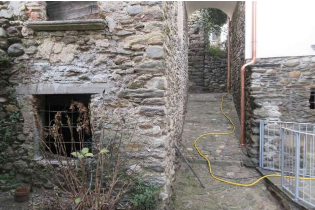
Vista della facciata principale con l'altra finestra