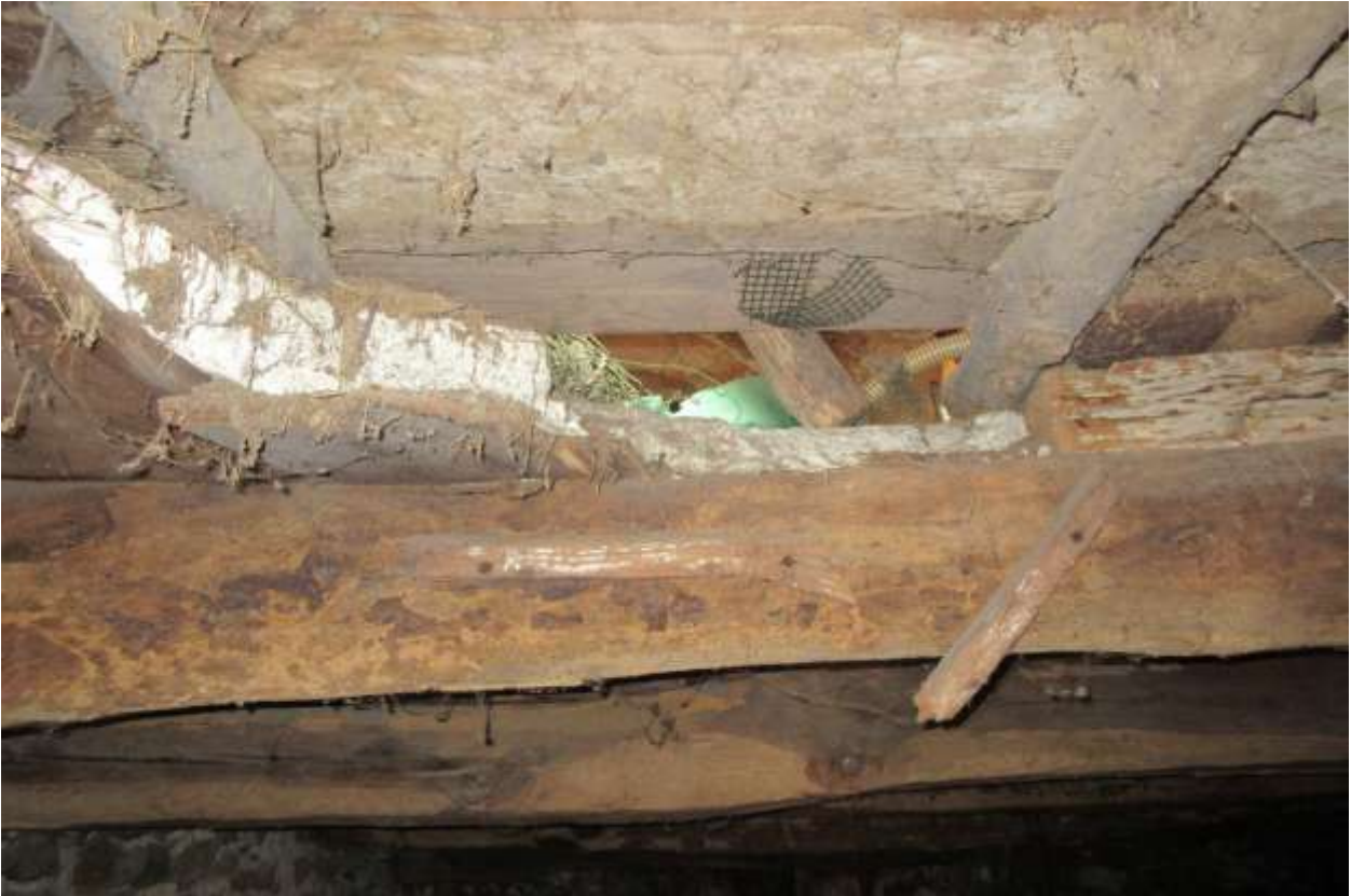
Particolare della soletta dove è presente un buco