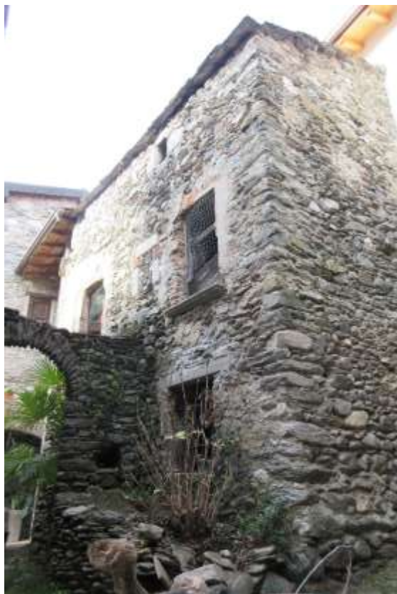
Vista anteriore del fabbricato