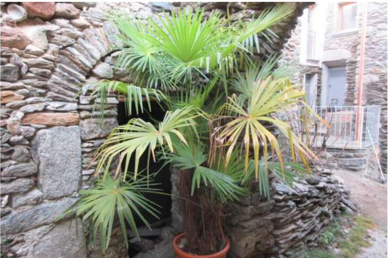
Ingresso dell'U.I.U. dalla via pubblica