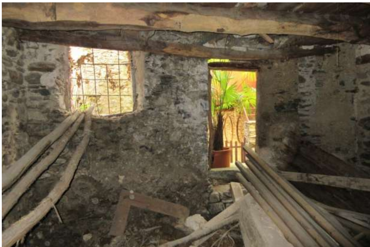
L'interno del locale è pieno di vario materiale