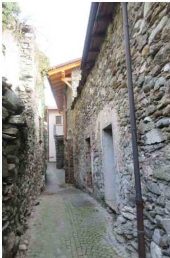
Vista posteriore del fabbricato