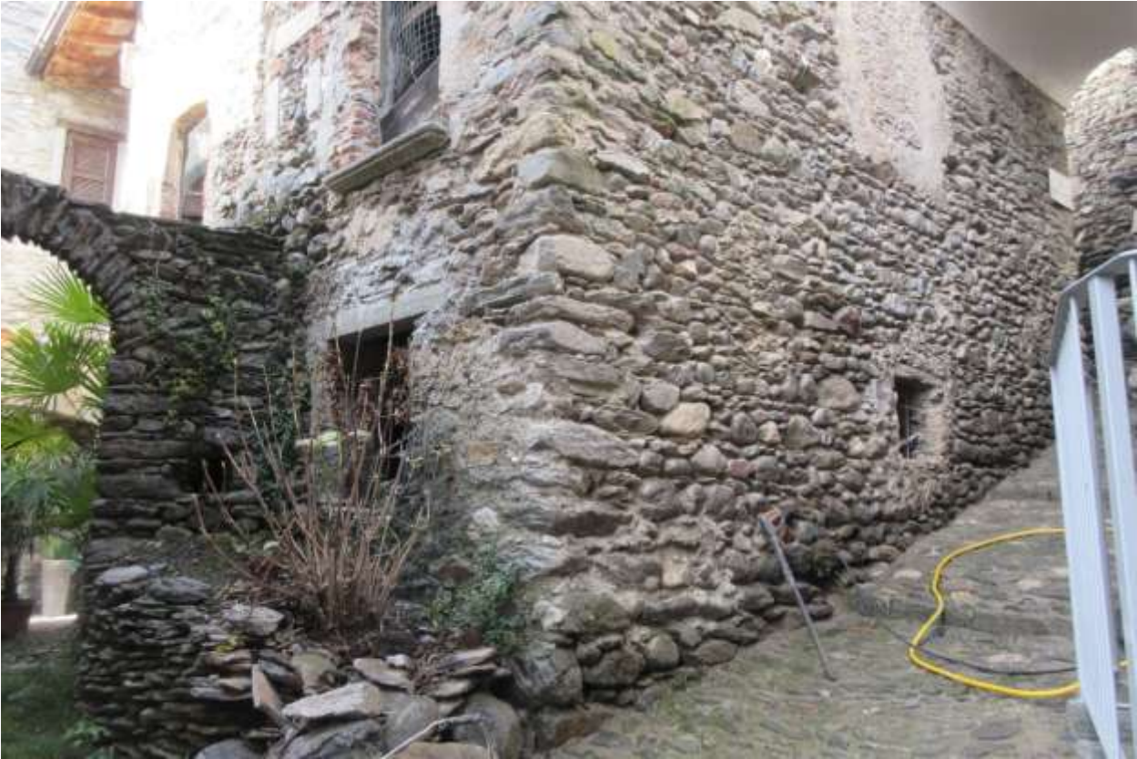
Vista dell'U.I.U. oggetto d'esecuzione posta al piano terra del fabbricato che si affaccia sulla strada pedonale denominata Via degli Aviggi

Fotografie scattate nel sopralluogo effettuato il giorno 11/12/2025