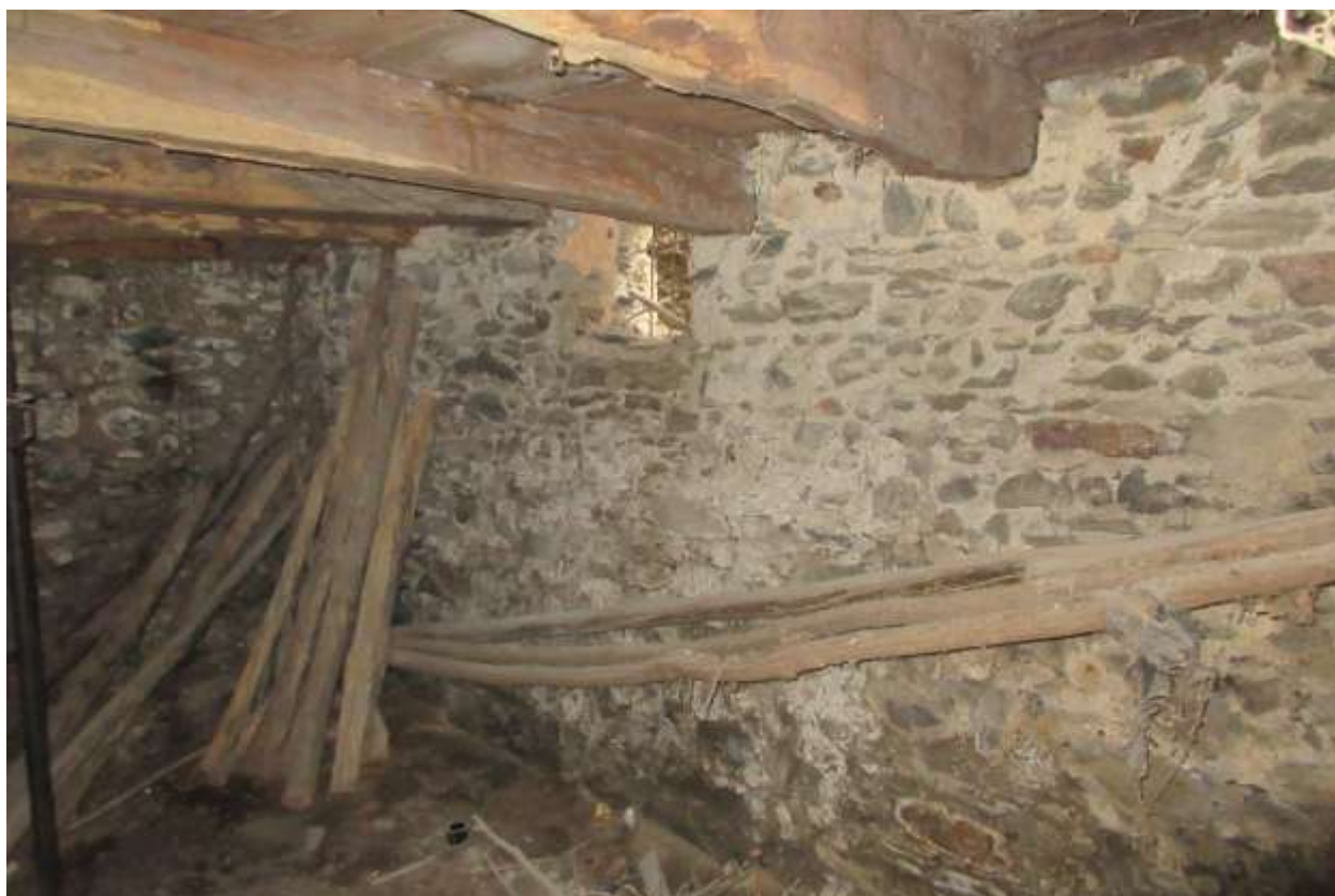
Vista della parete con la finestra che si affaccia sulla Via degli Aviggi