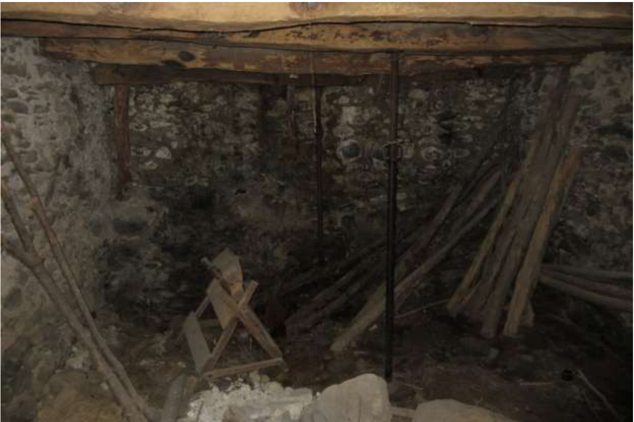
Vista dell'interno del monolocale, dove si vedono i puntelli in ferro che sorreggono la soletta in legno