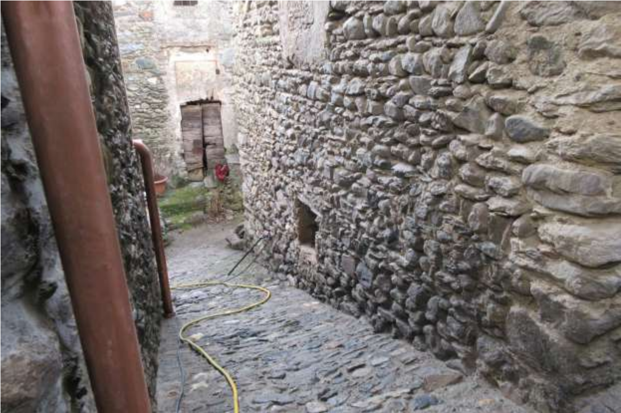
Facciata con finestra che si affaccia sulla Via degli Aviggi