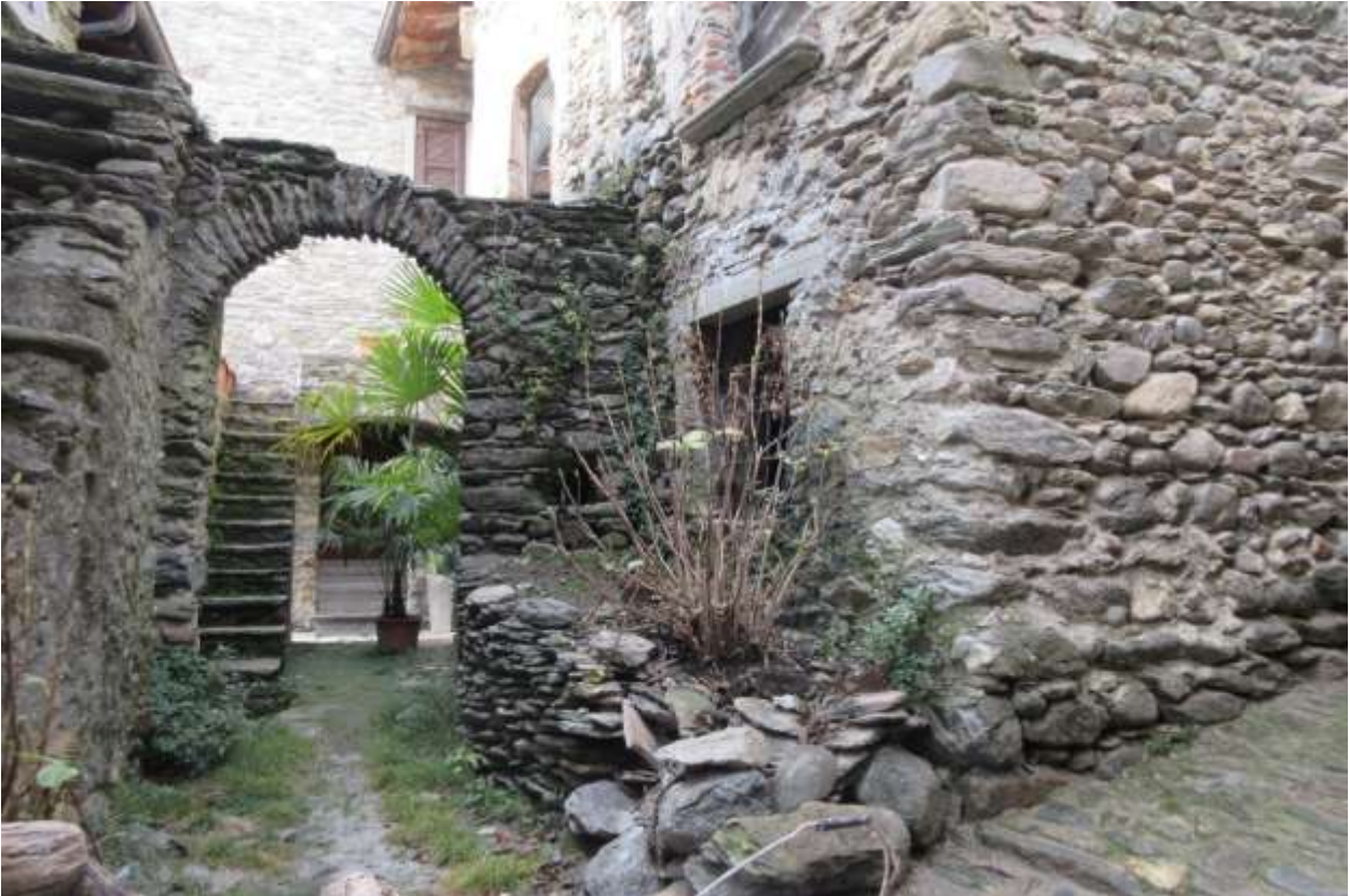
Vista della facciata principale