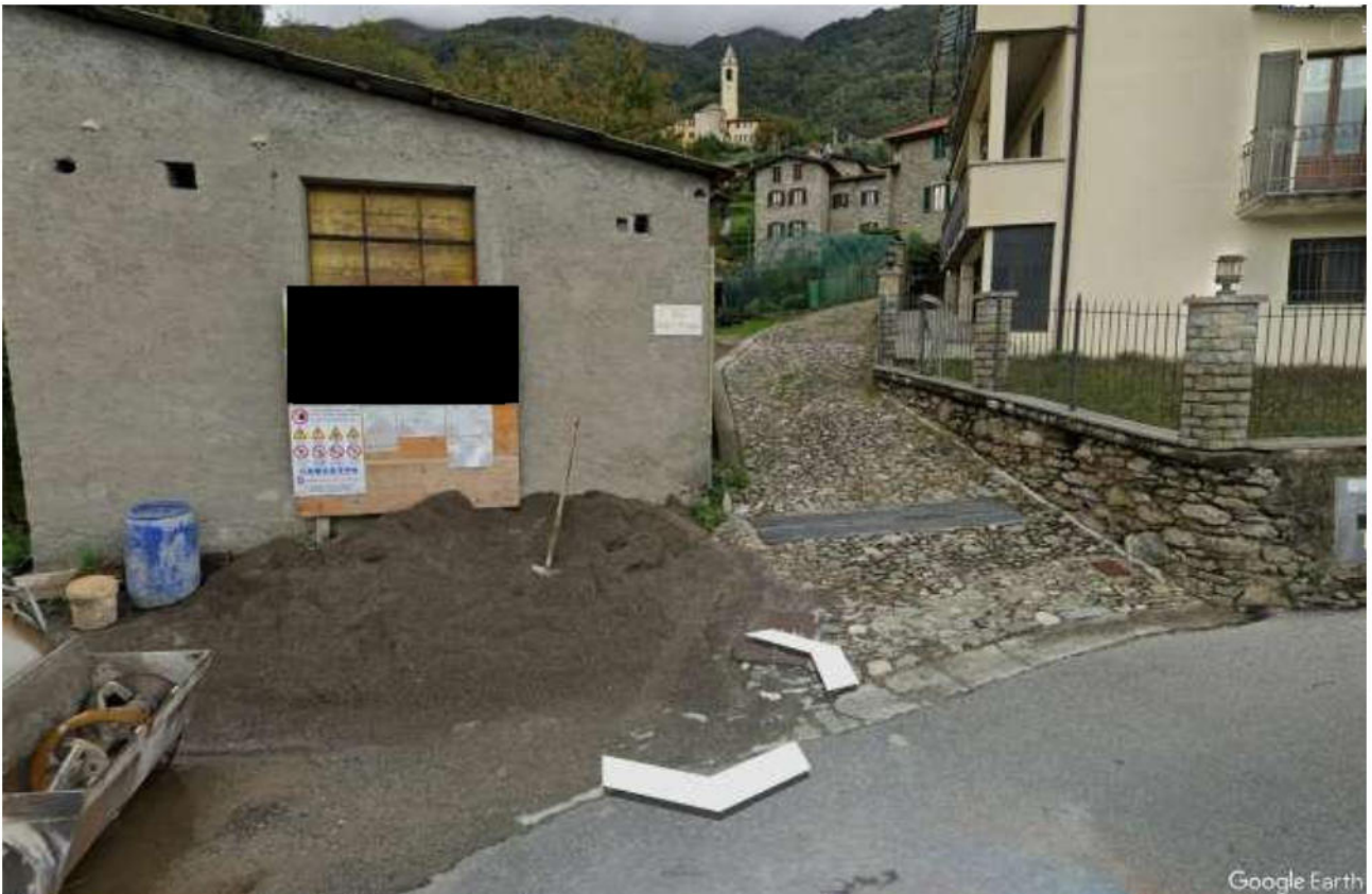
Strada comunale denominata "Via degli Aviggi" che da accesso pedonalmente al centro storico della fraz. Ghiano