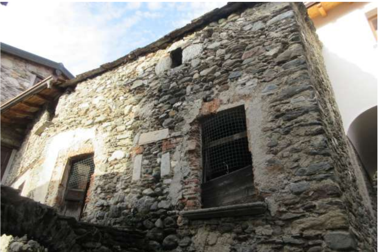
Vista del locale sovrastante e della gronda del tetto in beole di pietra