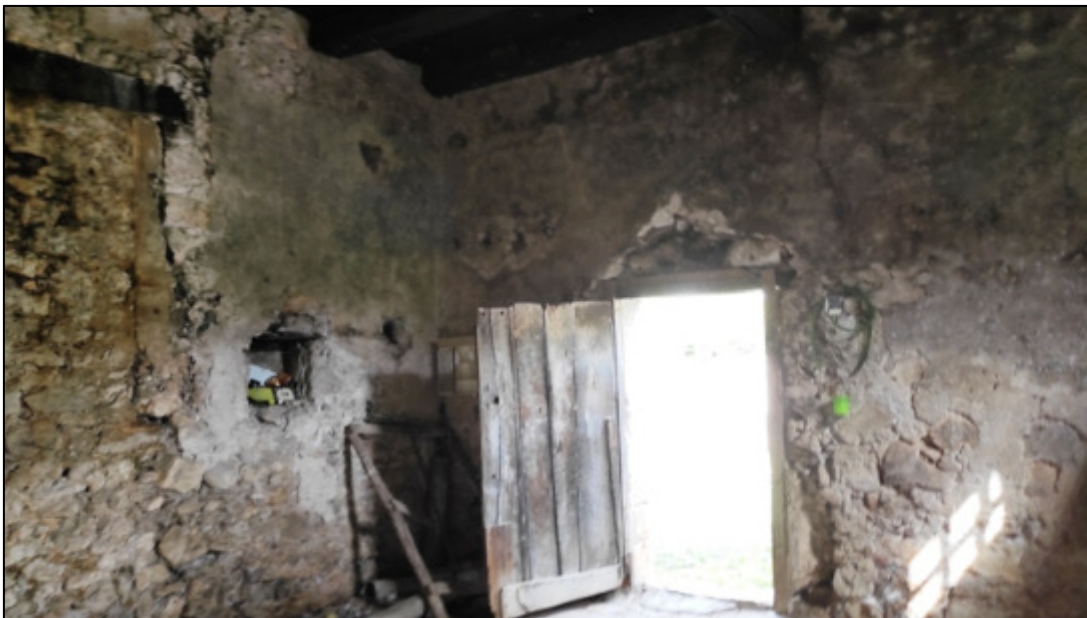
Deposito o al piano terra.