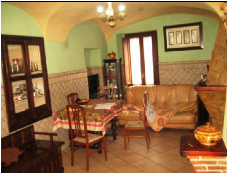
Salone con camino al primo piano.