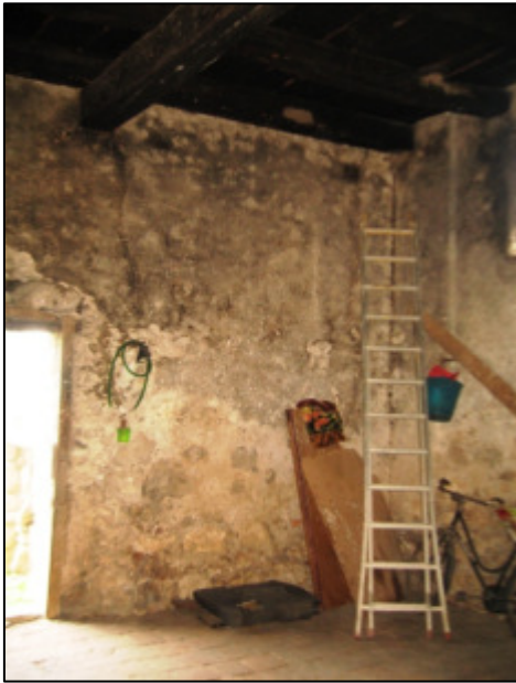
Deposito al piano terra