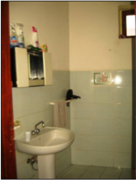
Bagno presso la camera matrimoniale