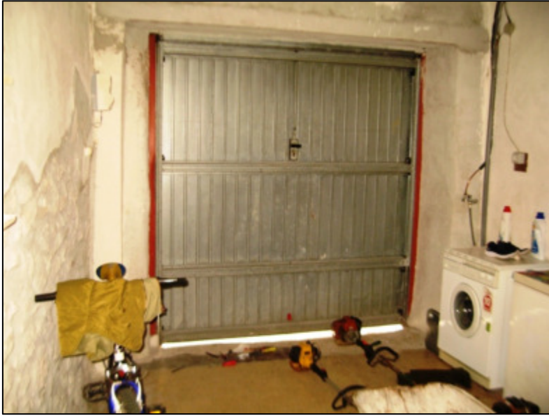
Deposito al piano terra.