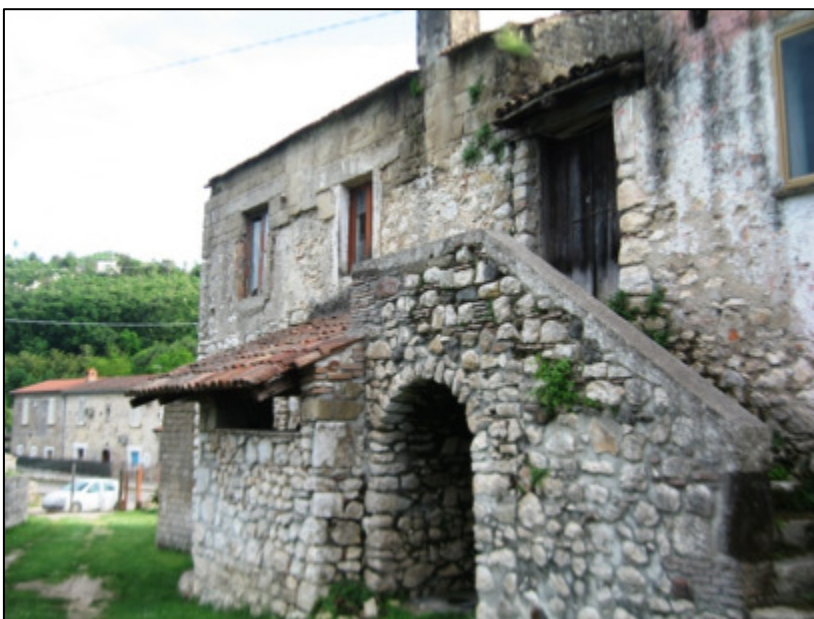
Vista dell'immobile dal cortile comune.