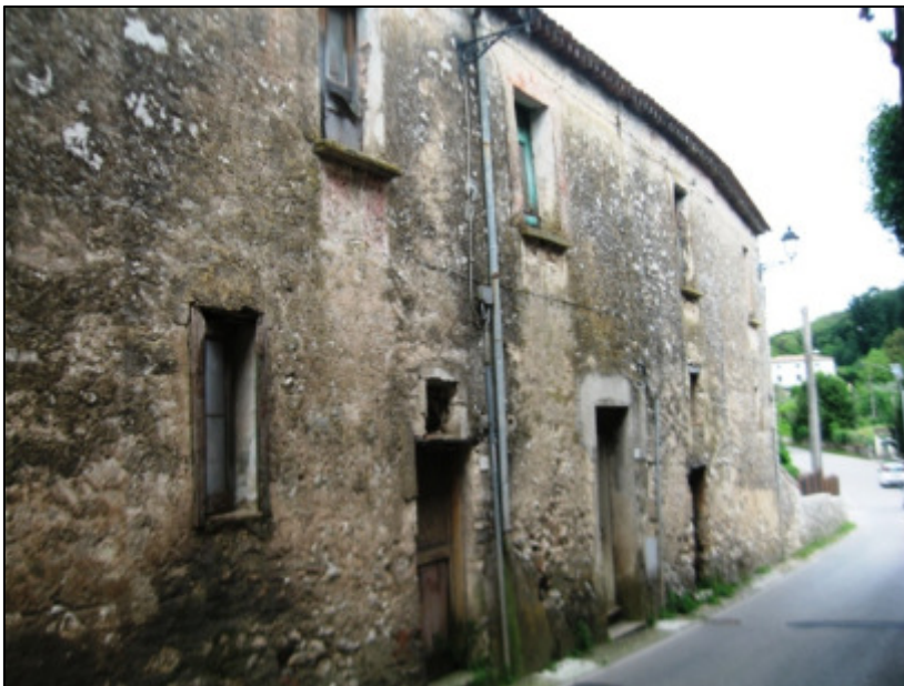
Veduta dell'immobile da via Roma.