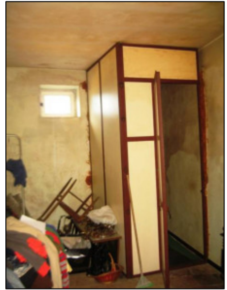
Deposito al secondo piano.