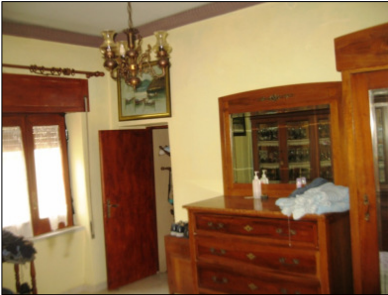
Camera da letto al primo piano.