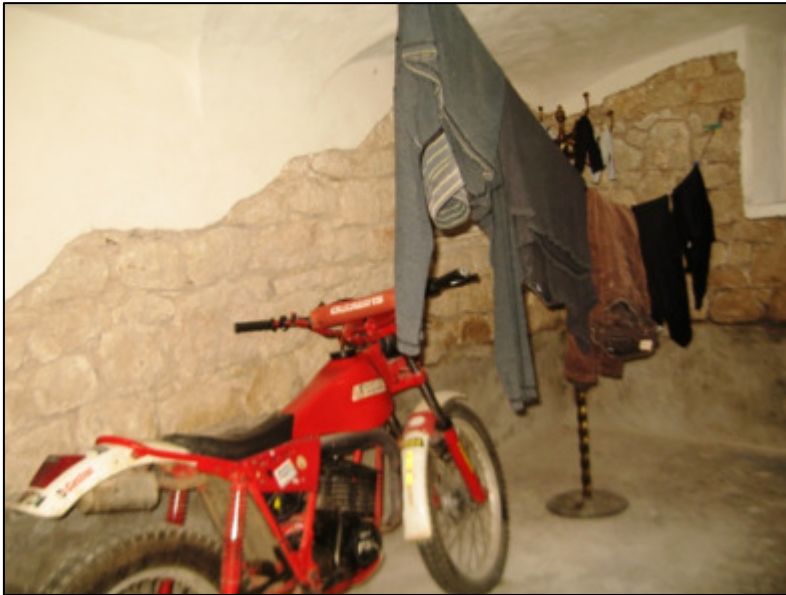
Cantina al piano terra