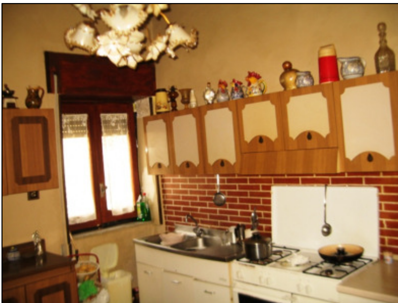
Cucina al primo piano.