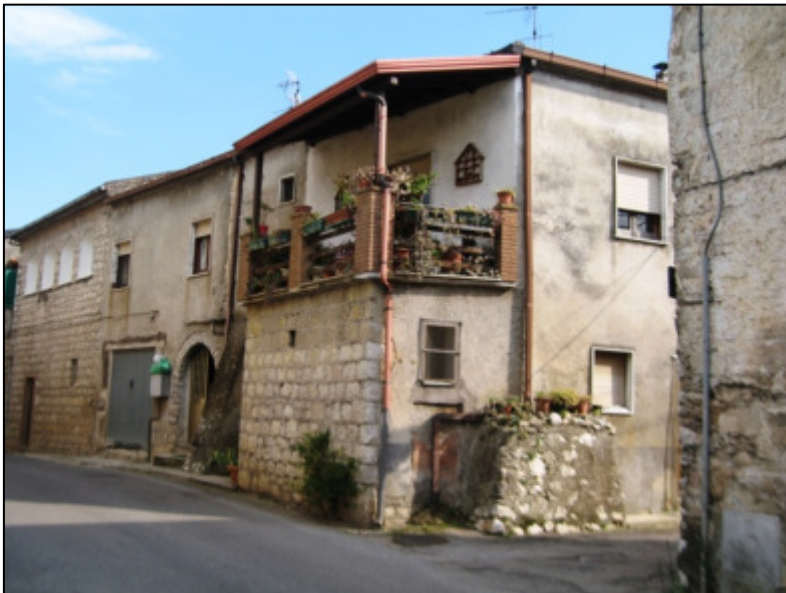
Vista dell'immobile pignorato da via Roma.