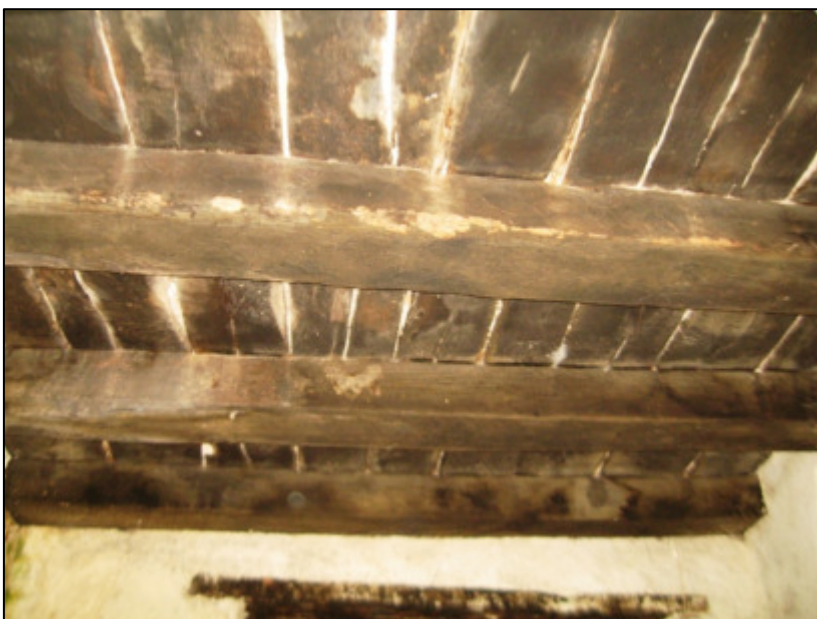
Intradosso del solaio in legno del primo piano.