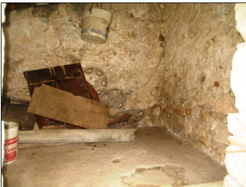
Deposito al piano terra.