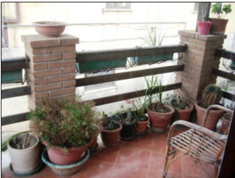
Balcone al primo piano presso la camera da letto matrimoniale.