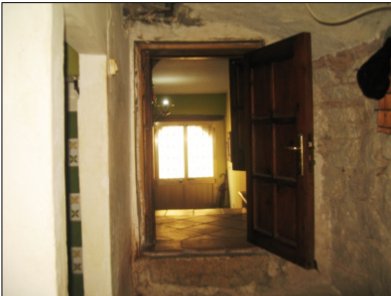
Legnaia con wc al piano terra.