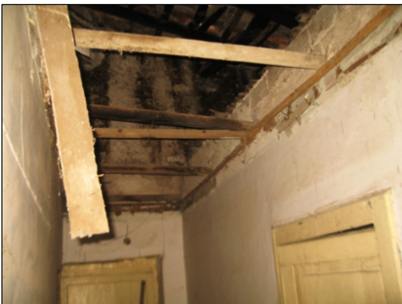
Corridoio al primo piano.