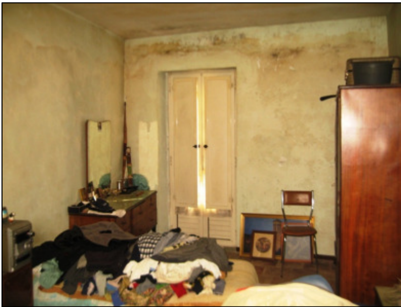
Deposito al secondo piano.