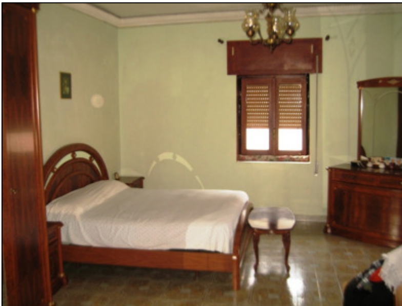
Camera da letto matrimoniale al primo piano