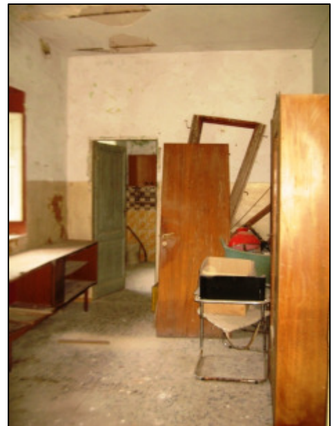
Locale al primo piano.