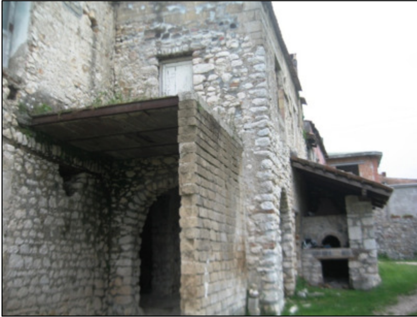
Vista dell'immobile dal cortile comune.