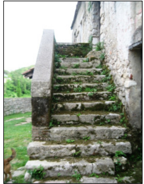
Scale esterna di accesso al primo piano.