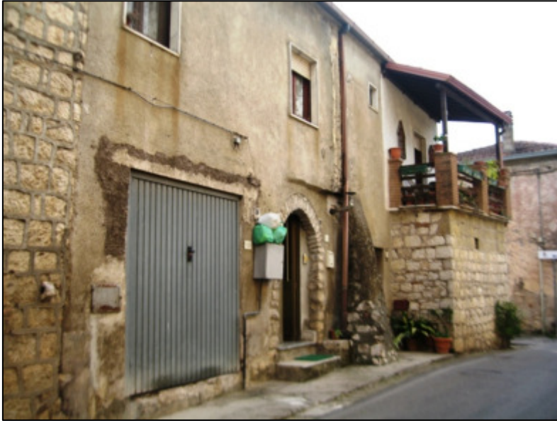
Vista dell'immobile pignorato da via Roma.