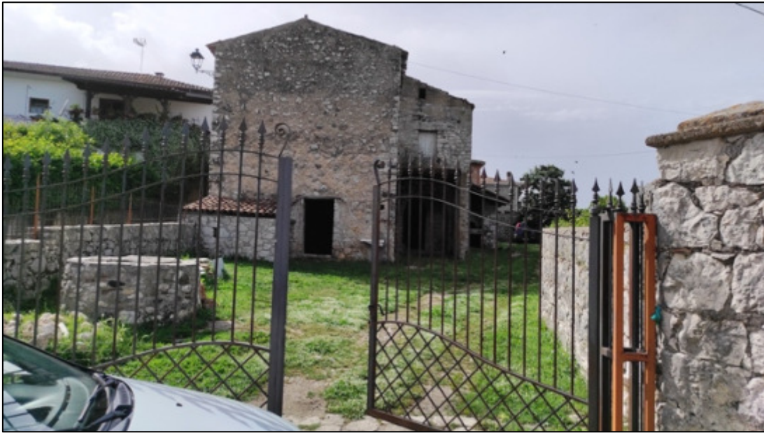
Ingresso principale all'immobile