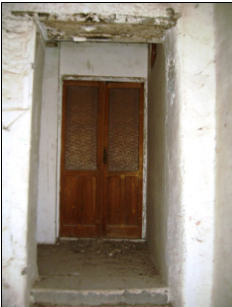
Ingresso al primo piano.