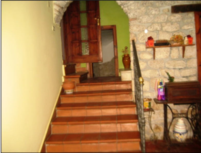
Scala interna di accesso al primo piano dall'ingresso al piano terra.