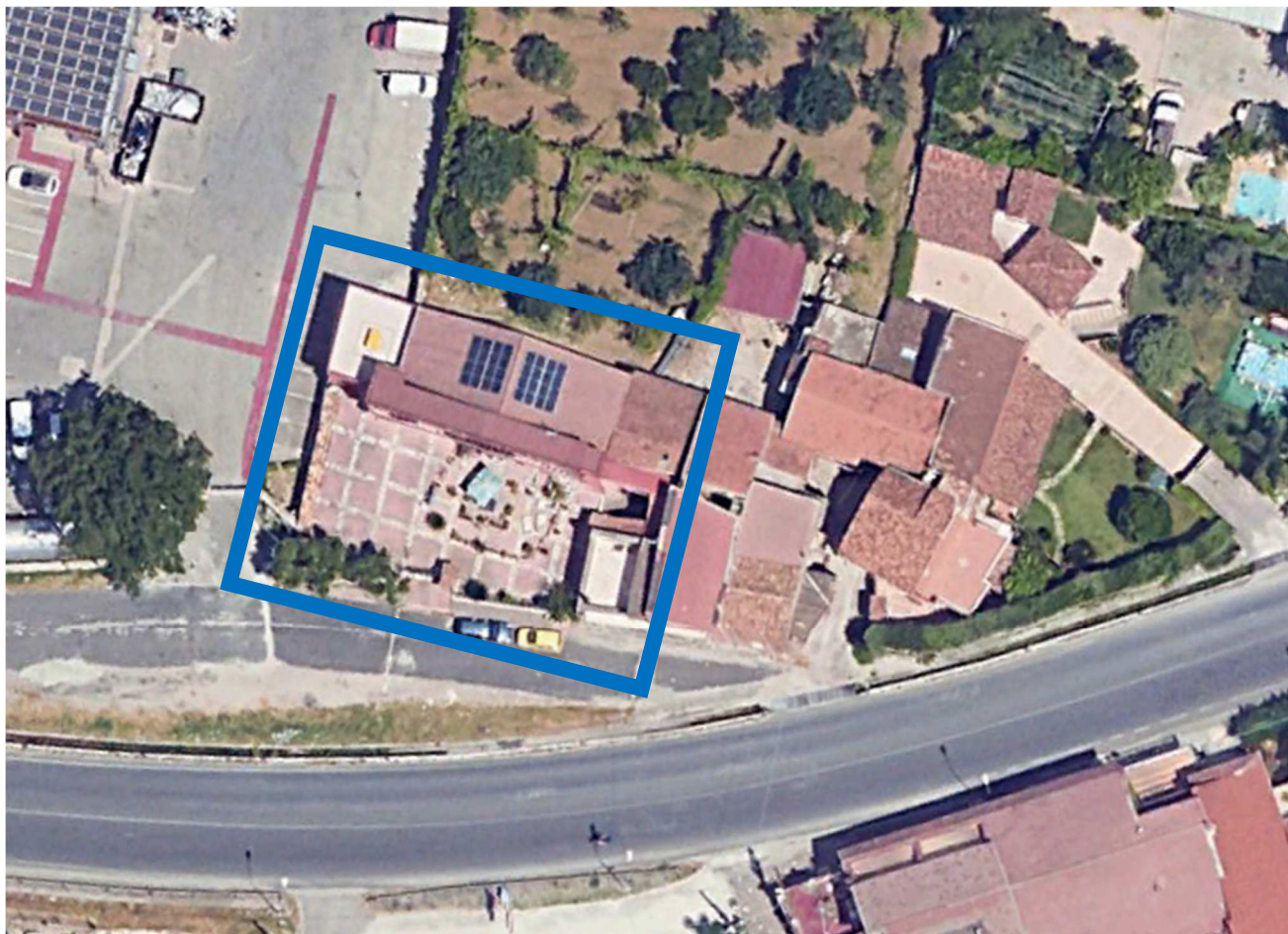
Vista di dettaglio

Nelle sottostanti ortofoto è possibile individuare il fabbricato nel contesto territoriale.