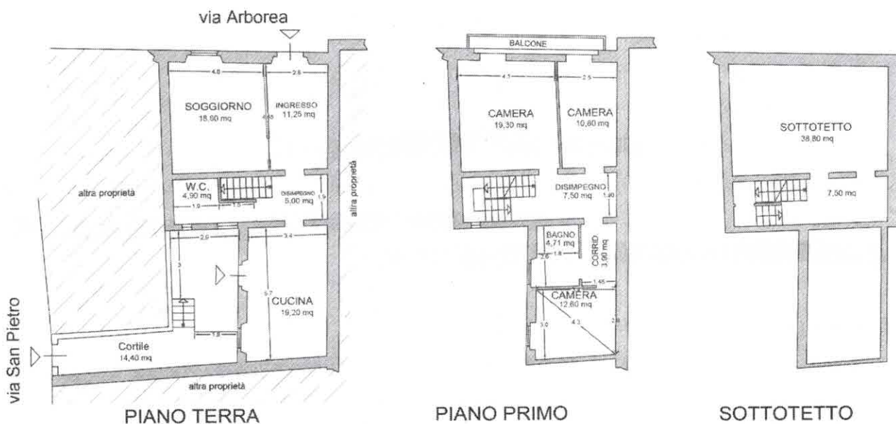
Figura n. 8

Il fabbricato, descritto nell'immagine sottostante, è costituito da un ampio ambiente formatosi a seguito della demolizione, fino a 1 metro di altezza, del tramezzo che divideva il soggiorno dall'ingresso, disimpegno, vano scala, un bagno di servizio, cucina con affaccio e accesso sul cortile interno.