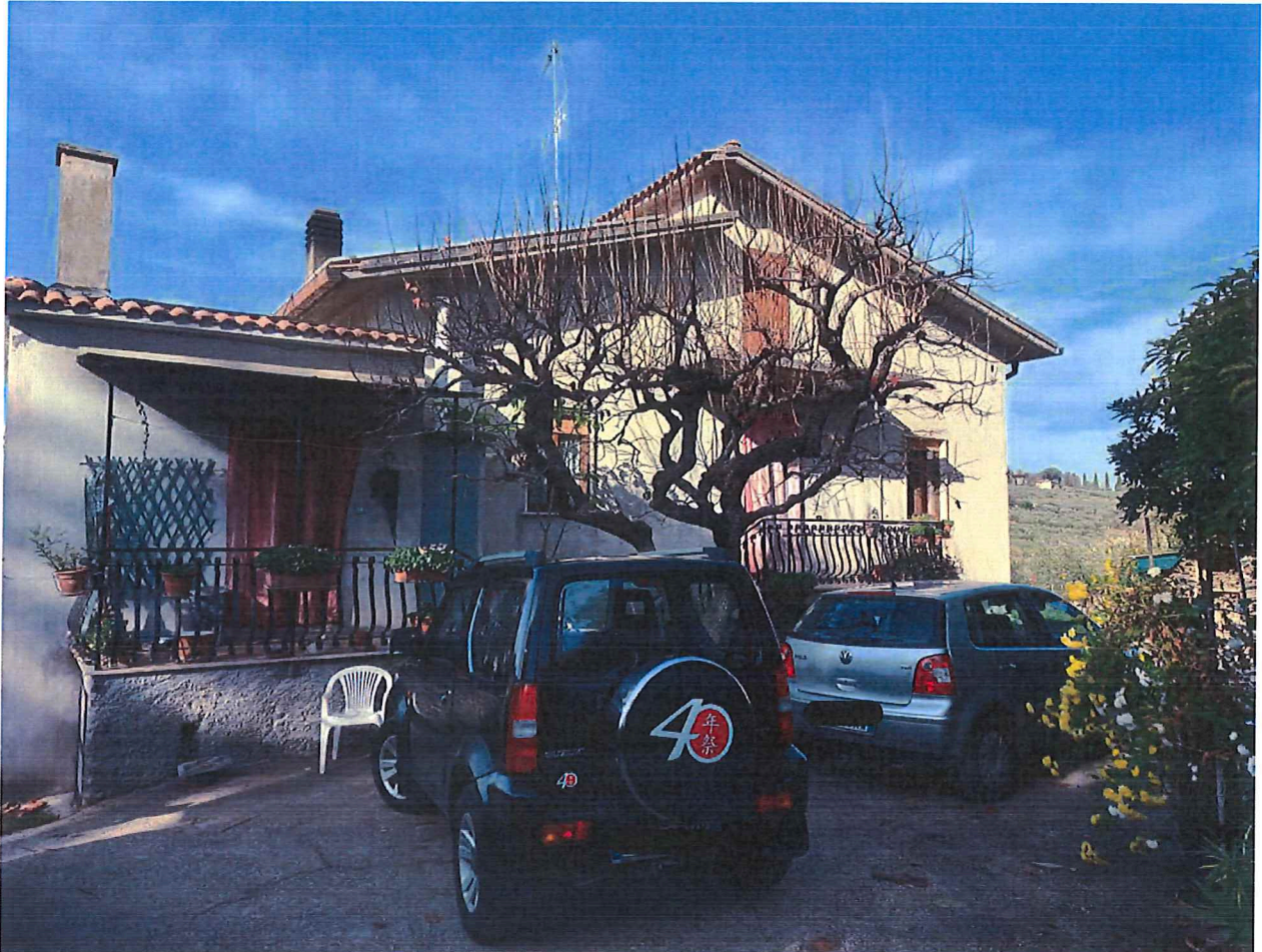
FOTO N. 01- Vista lato strada del fabbricato da cielo a terra con annessi terreni con destinazione agricola, sito in località "Capolli" del Comune di Poggio Nativo, con accesso da via Colle Comune, individuato al NCEU del detto comune al fg. 7 part. 57 sub. 1-2-3-4 il fabbricato, part. 408 il garage e part. 56 e 409 i terreni annessi.