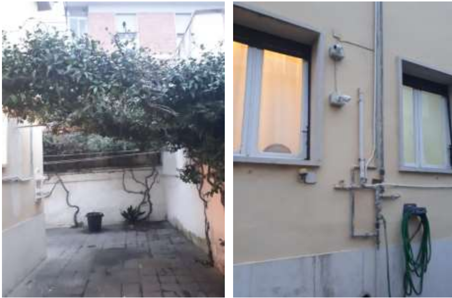
F.to 1: Vista cortile di pertinenza e facciata villa