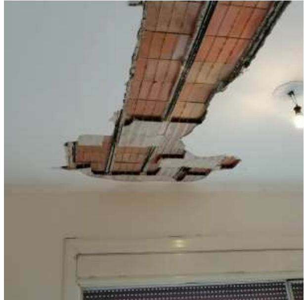
F.to 2: Vista intradosso solaio soggiorno