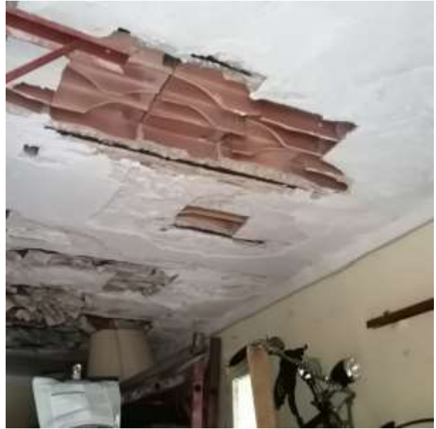
F.to 3: Vista intradosso solaio garage