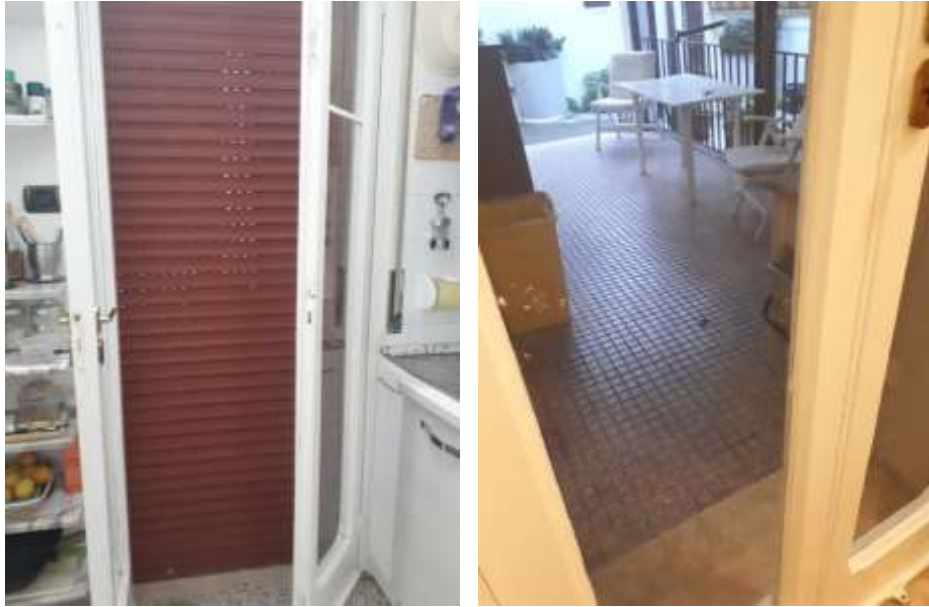
F.to 7: Tapparelle e pavimento veranda coperta posteriore