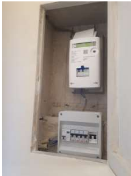
F.to 11: Scaldabagno Ariston e contatore elettrico con salvavita