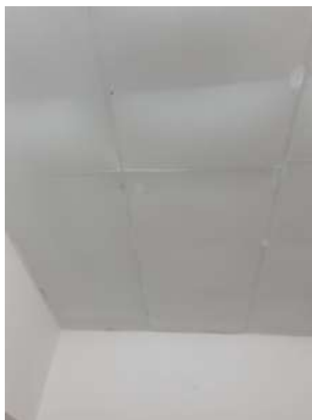
F.to 6: Rivestimento pareti cucina e controsoffittatura cucina