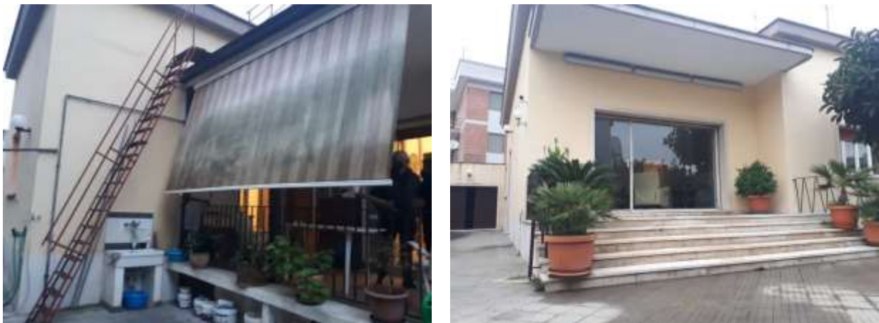
F.to 3: Scala accesso lastrico solare e facciata villa su strada principale