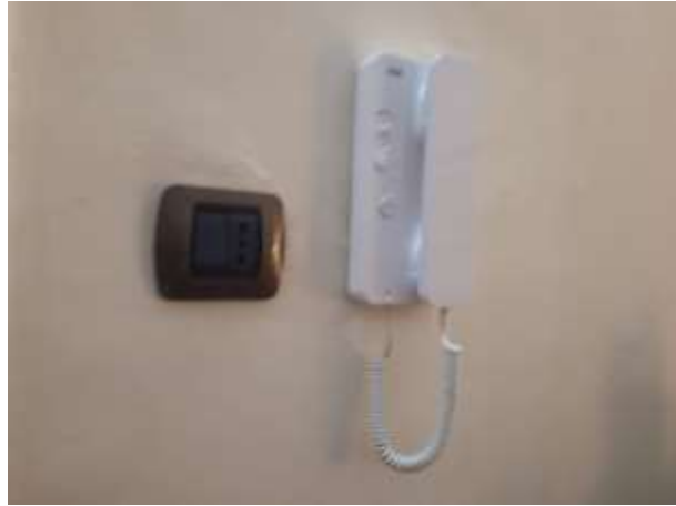
F.to 4: Caldaia Vaillant e Citofono