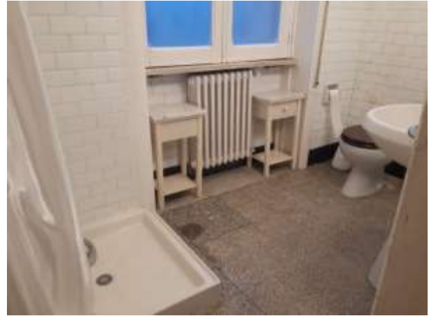
F.to 9: Macchie di umido camera letto e vista bagno