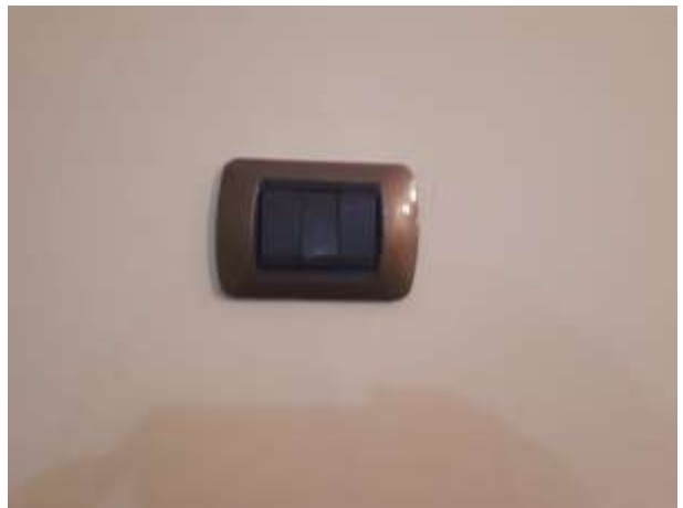
F.to 10: Termosifoni e Placche