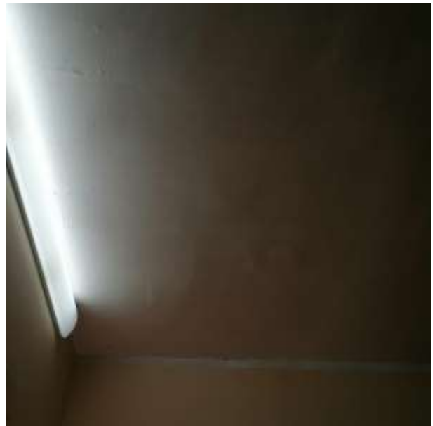
F.to 4: Vista intradosso solaio abitazione con avvallamenti e bombature