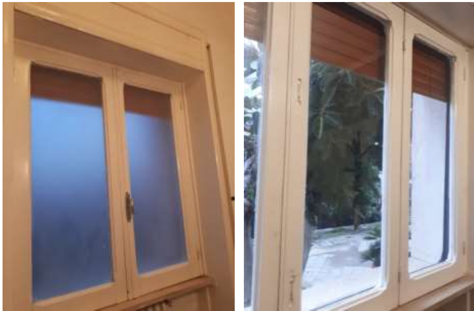
F.to 8: Infissi interni in legno bianco