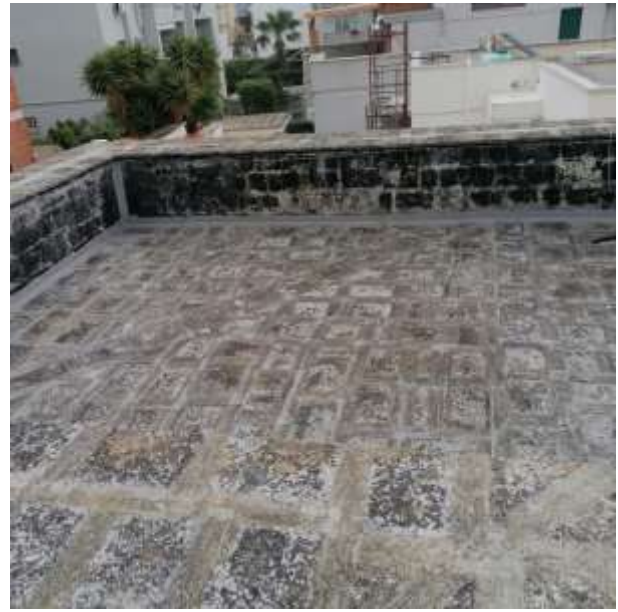
F.to 1: Vista lastrico solare