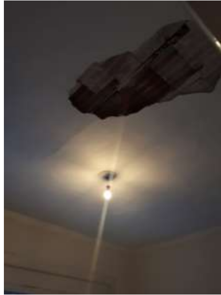
F.to 12: Solaio garage e solaio soggiorno