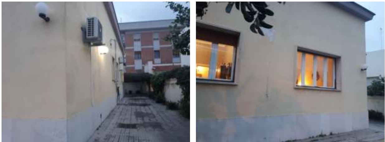
F.to 2: Vista cortile di pertinenza e facciata villa