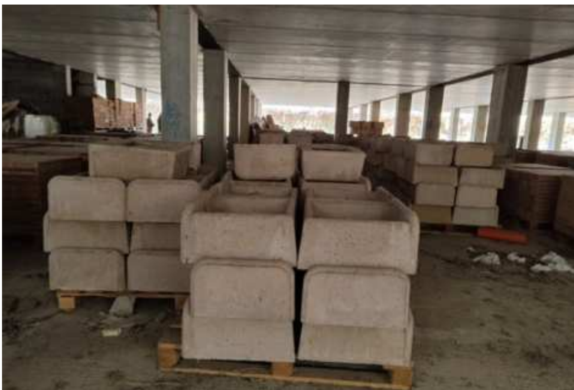
Fig.94 – Vista delle strutture del piano e del deposito di bancali di materiale edilizio (secondo piano interrato).