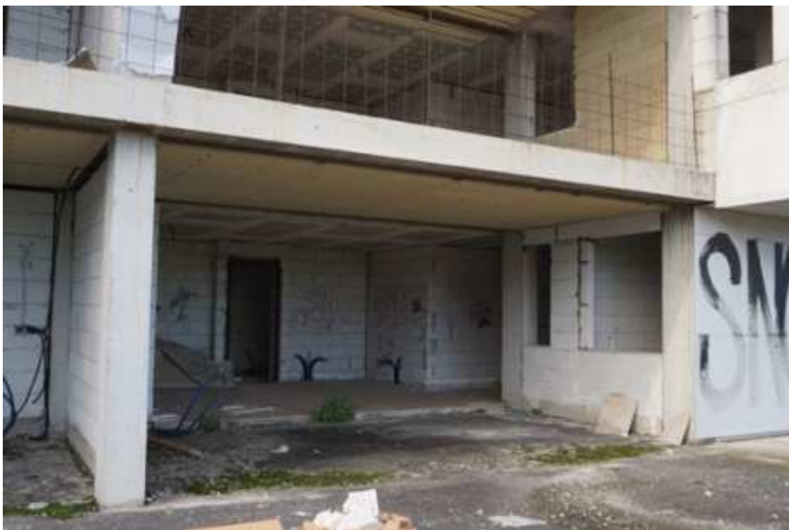
Fig.68 – Vista dalla terrazza esterna delle partizioni interne (piano rialzato).