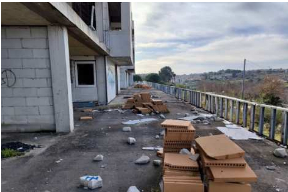
Fig.72 – Vista da nord verso sud della terrazza esterna (piano rialzato).