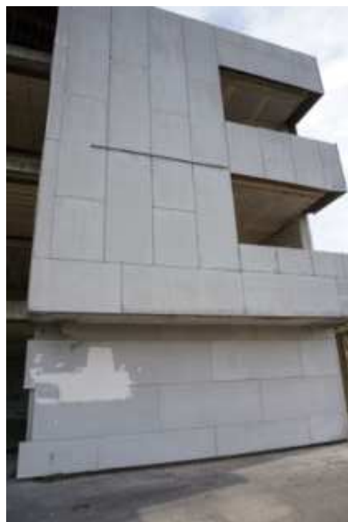
Fig.42-43 – Vista dal Piano Rialzato delle Facciate poste ad est del corpo di fabbrica (piano rialzato)