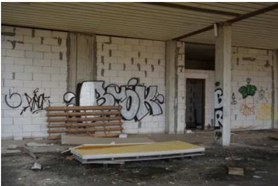
Fig.18 – Vista dei locali tecnici e cantinole realizzate prive di opere di finitura (primo piano interrato).