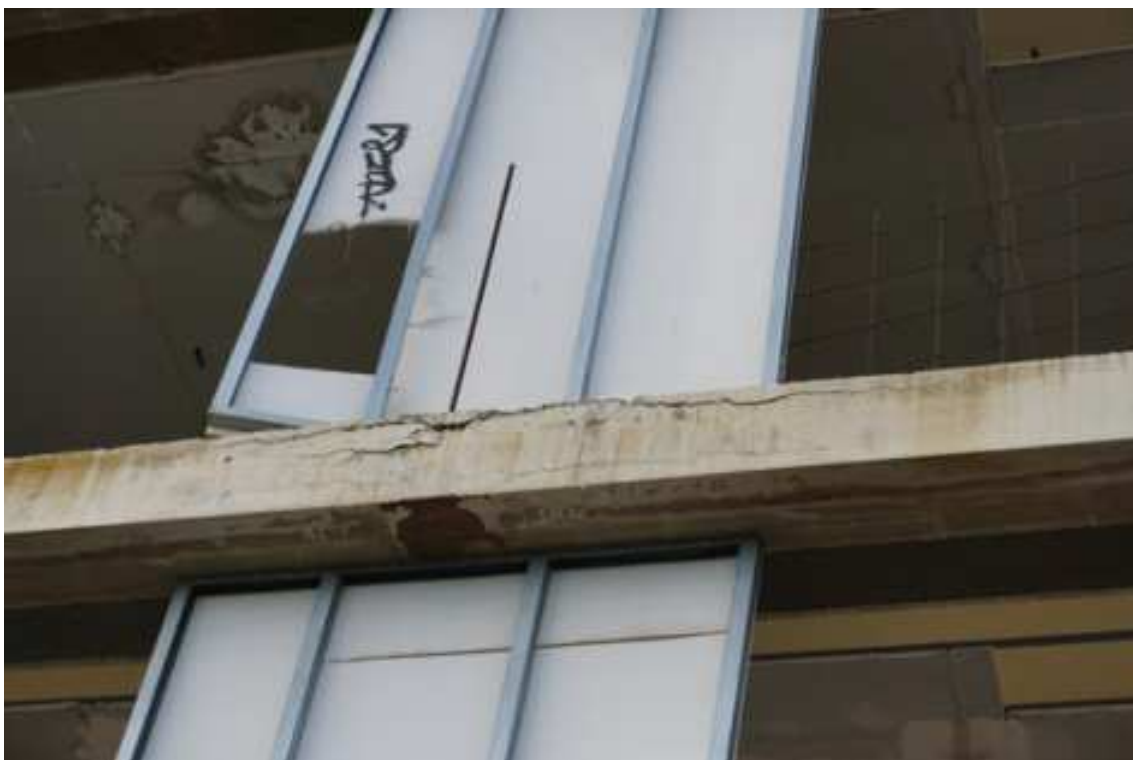
Fig.81– Vista sui fenomeni di degrado del cls sul bordo dei solai dei piani superiori (piano rialzato).