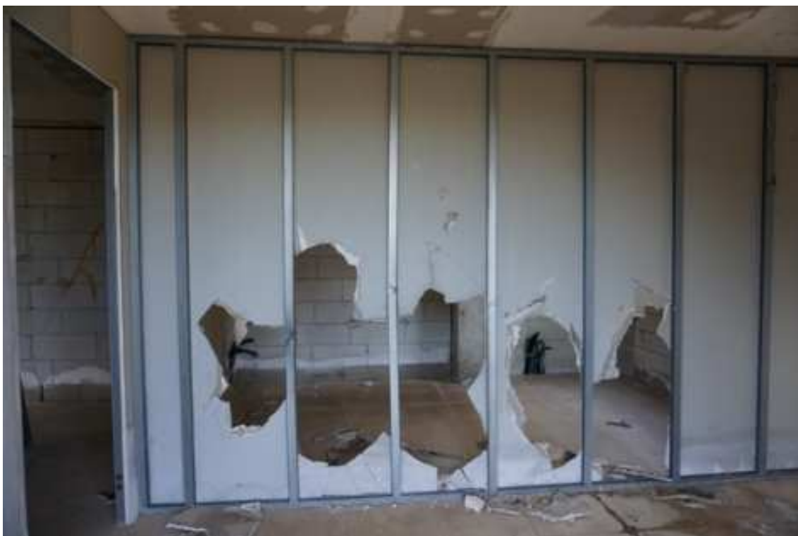
Fig.66 – Vista di predisposizione delle partizioni dei vani interni e vandalizzazione di parte di essi (piano rialzato).