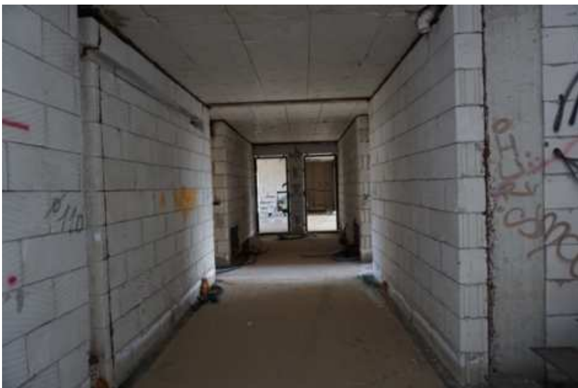
Fig.38 – Vista sui corridoi di accesso agli alloggi posti in testata (piano rialzato).