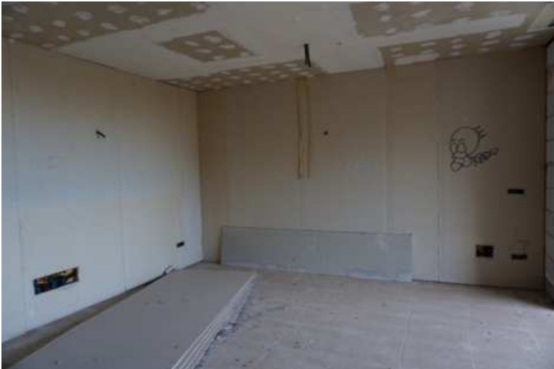
Fig.63 – Vista di vano interno al complesso residenziale con montaggio dei pannelli in cartongesso (piano rialzato).