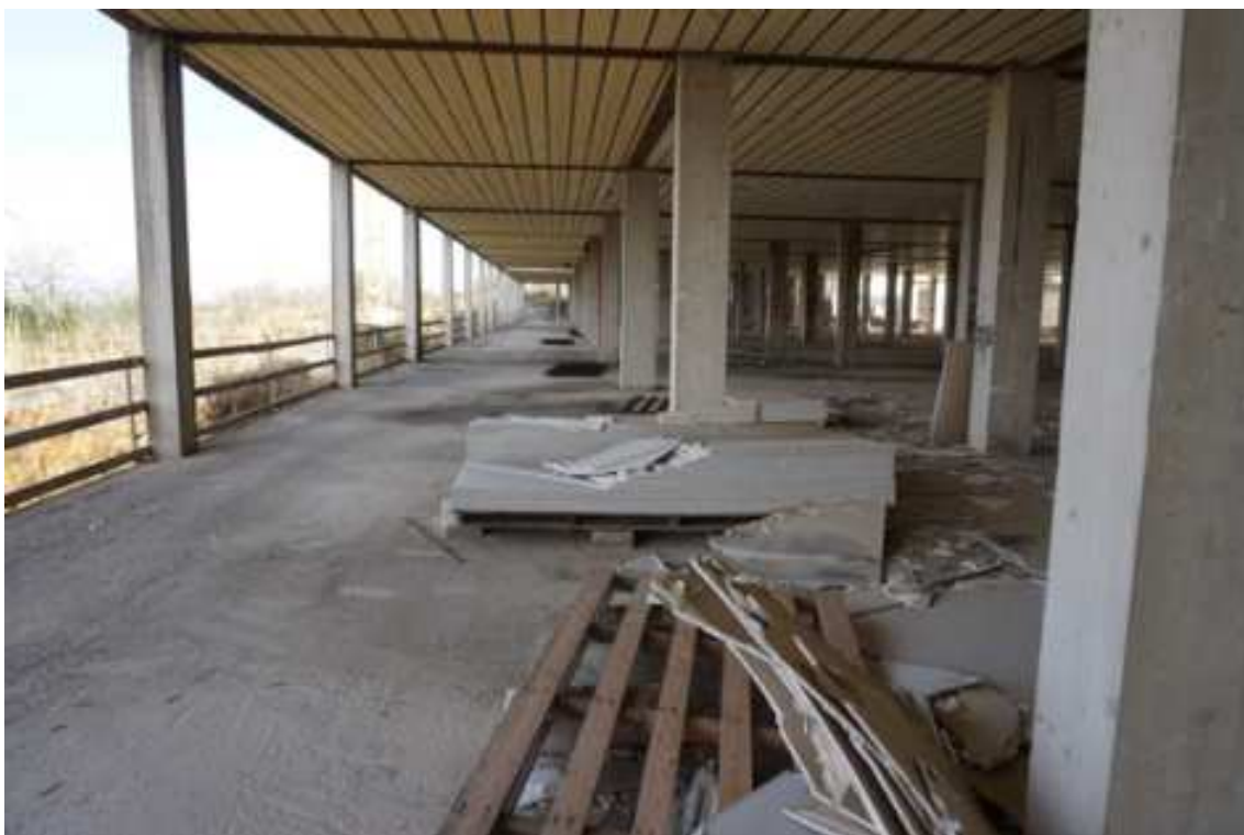
Fig.14 – Vista da sud-verso nord con enfilade delle campate strutturali (primo piano interrato).