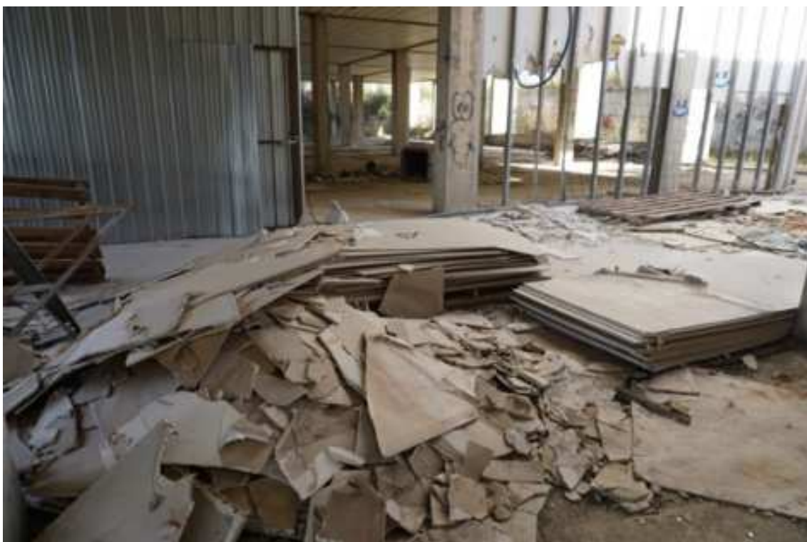
Fig.23 – Vista su vano scala e pareti in cartongesso, pannelli in cartongesso e pallet abbandonati (primo piano interrato).