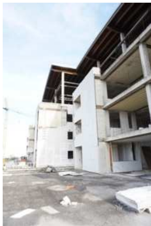
Fig.44-45 – Vista dal Piano Rialzato delle Facciate poste ad est del corpo di fabbrica (piano rialzato).