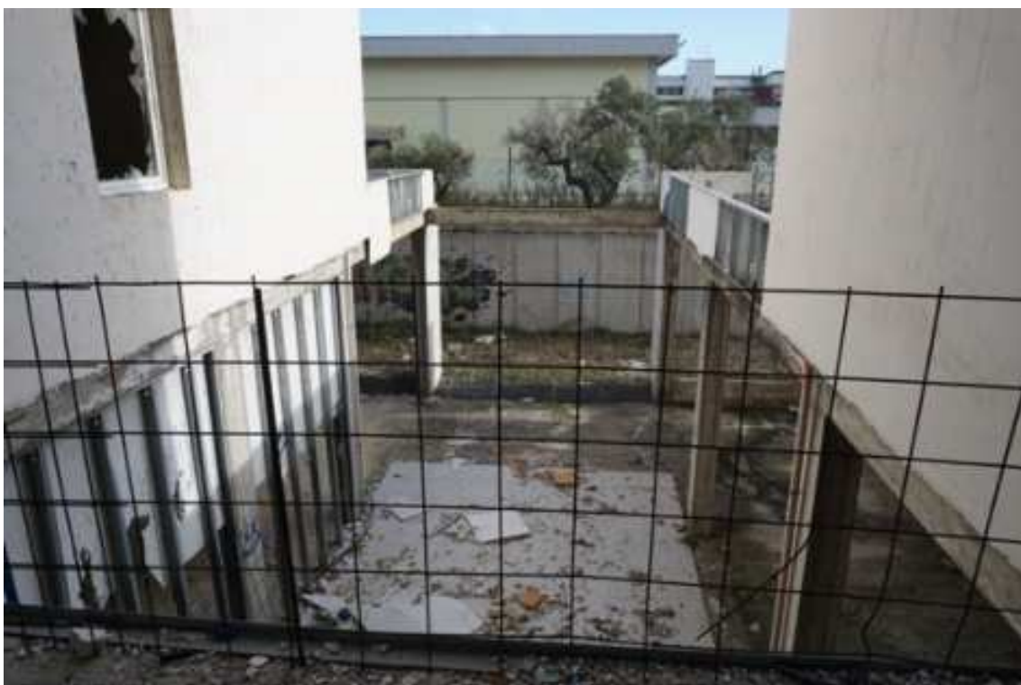
Fig.78 – Vista da ovest verso est del piano interrato da piano rialzato (piano rialzato).