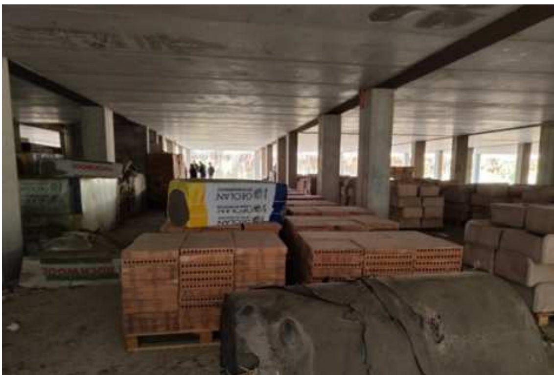
Fig.93 – Vista delle strutture del piano e del deposito di bancali di materiale edilizio (secondo piano interrato).