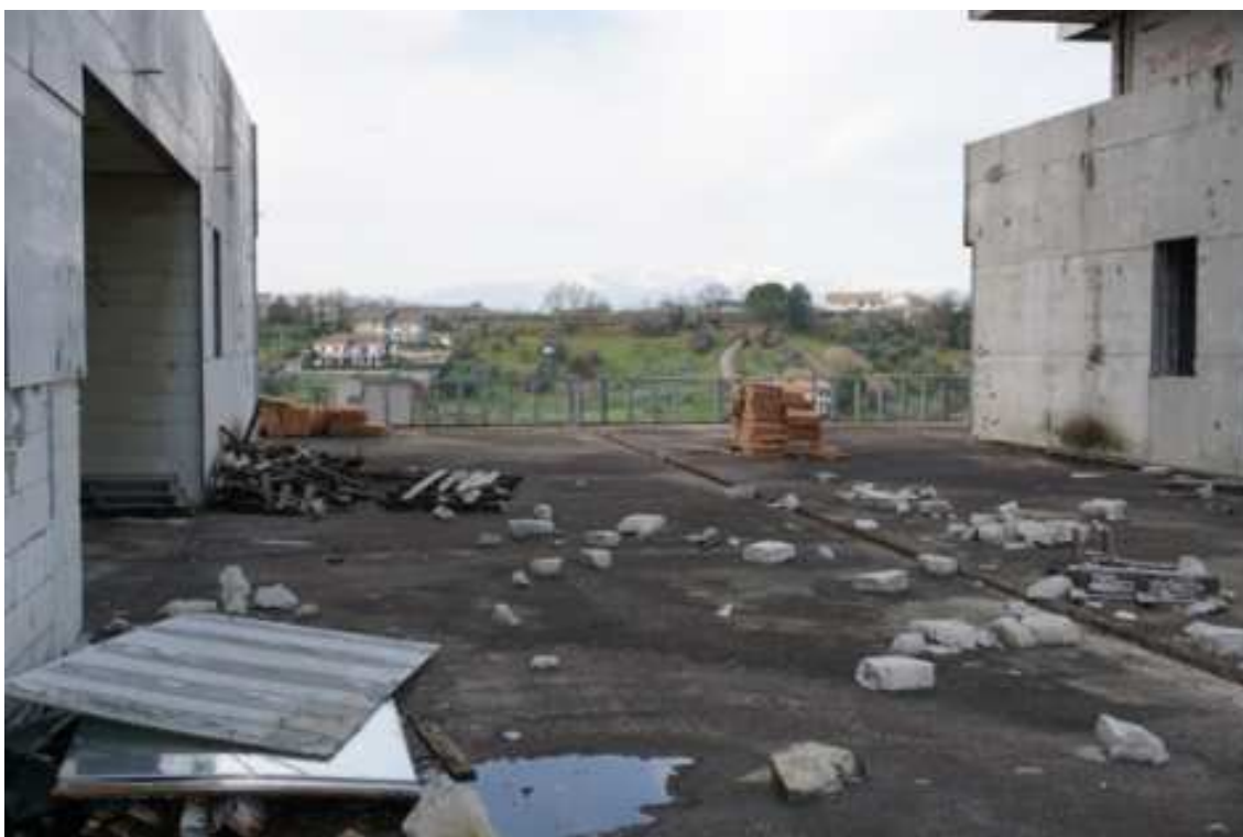
Fig.69 – Vista da est verso ovest della zona centrale della terrazza esterna (piano rialzato).