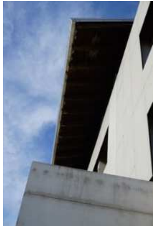
Figg.55-56 – Vista di dettaglio dei fronti del fabbricato (piano rialzato).