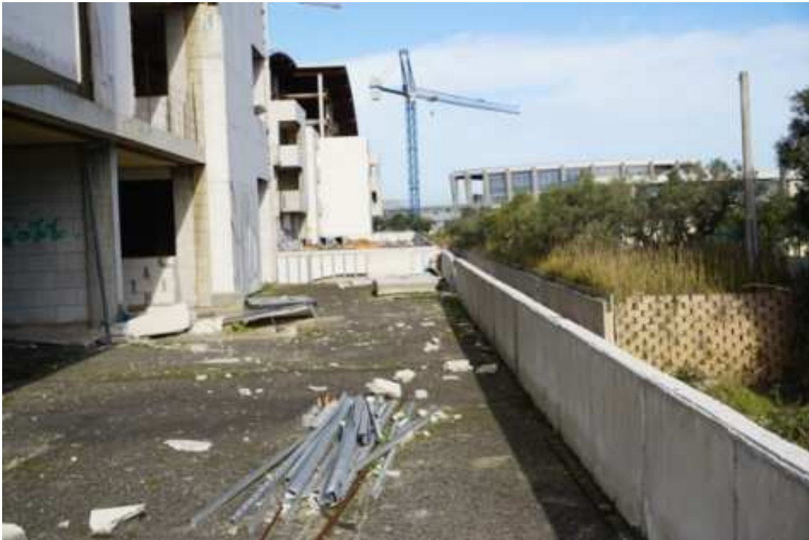
Fig.54 – Vista da sud verso nord dei fronti del fabbricato (piano rialzato).