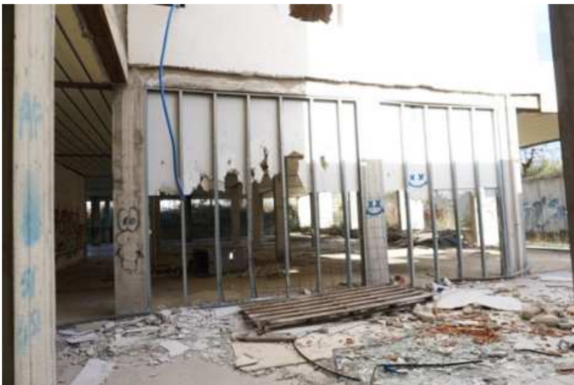
Fig.22 – Vista su pareti in cartongesso vandalizzate (primo piano interrato).