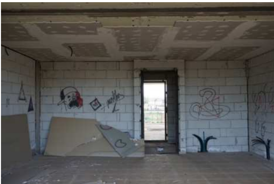
Fig.67 – Vista partizioni dei vani interni e predisposizione degli impianti termici (piano rialzato).