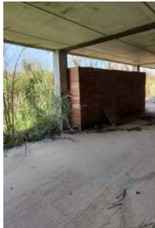
Figg.85-86 – Vista delle strutture del piano e del deposito materiali (secondo piano interrato).