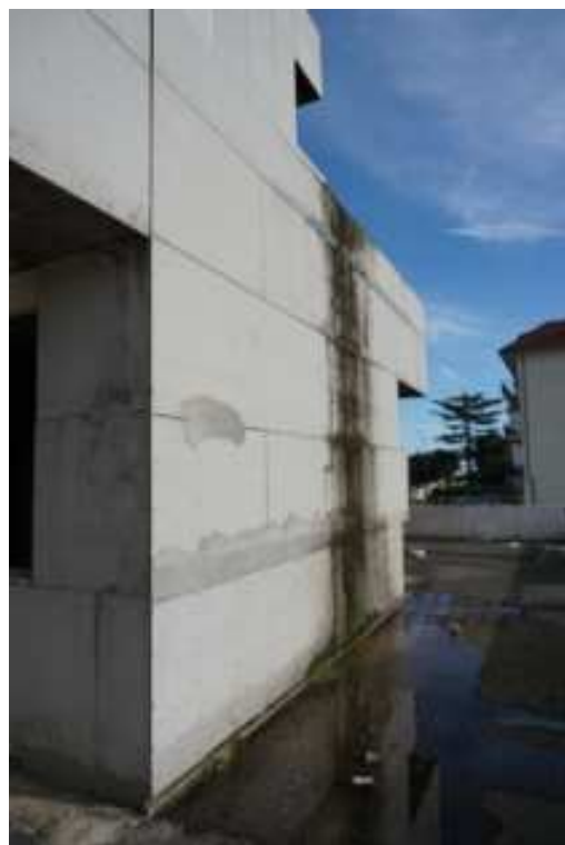
Figg.47-48 – Vista del balcone di testata posto a sud con dettaglio dello stato di degrado di facciate e solai (piano rialzato).