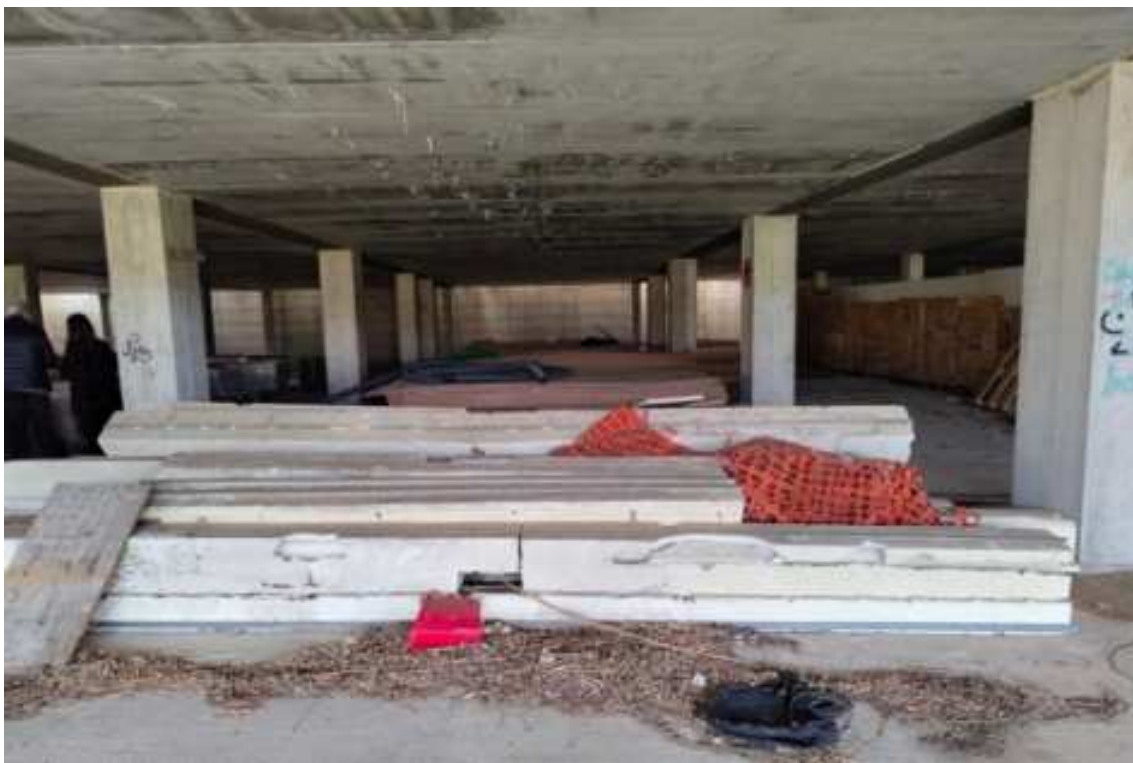
Fig.90 – Vista delle strutture del piano e del deposito di bancali di materiale edilizio (secondo piano interrato).