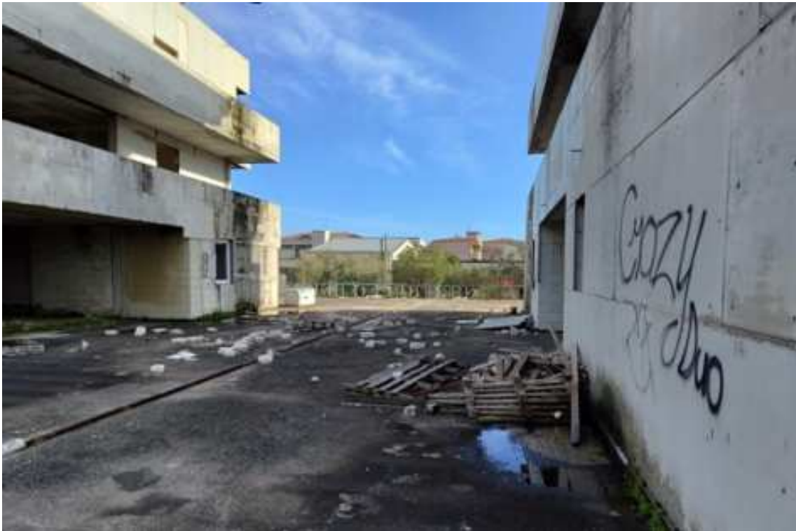
Fig.71 – Vista da ovest verso est della zona centrale della terrazza esterna e di parte delle facciate laterali del complesso residenziale (piano rialzato).