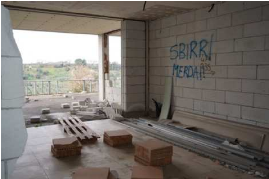
Fig.62 – Vista del vano interno al complesso residenziale con affaccio verso ovest (piano rialzato).