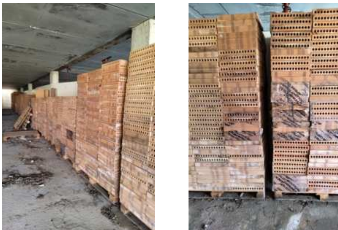
Figg.87-88 – Vista delle strutture del piano e del deposito materiali (secondo piano interrato).