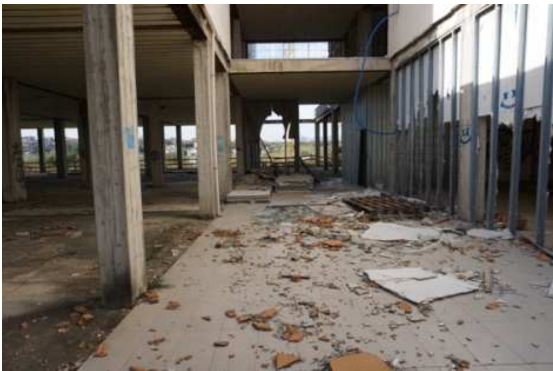
Fig.24 – Vista da ovest verso est degli spazi interni dagli esterni (primo piano interrato).