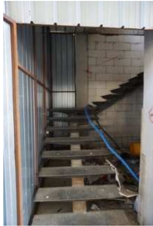
Figg.27-28 – Vista su accesso al vano scala e rampa in ferro con trave (primo piano interrato).