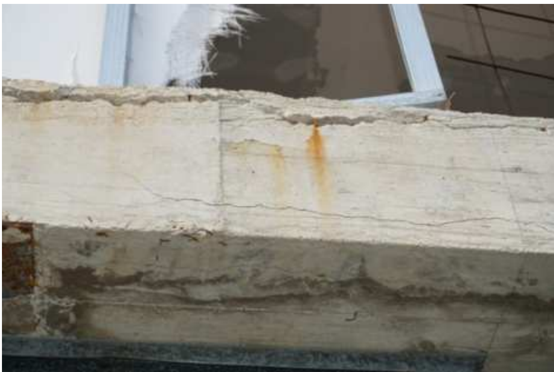
Fig.83– Vista (piano rialzato).