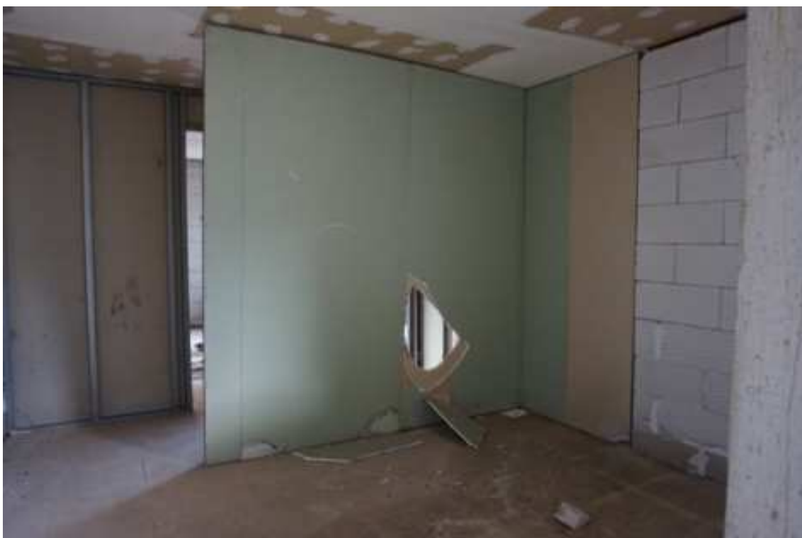
Fig.65 – Vista di predisposizione delle partizioni dei vani interni e vandalizzazione di parte di essi (piano rialzato).