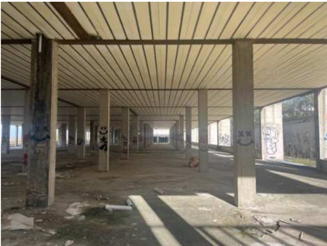
Fig.6 – Vista da sud verso nord del passo strutturale e solai di calpestio e di copertura (primo piano interrato).