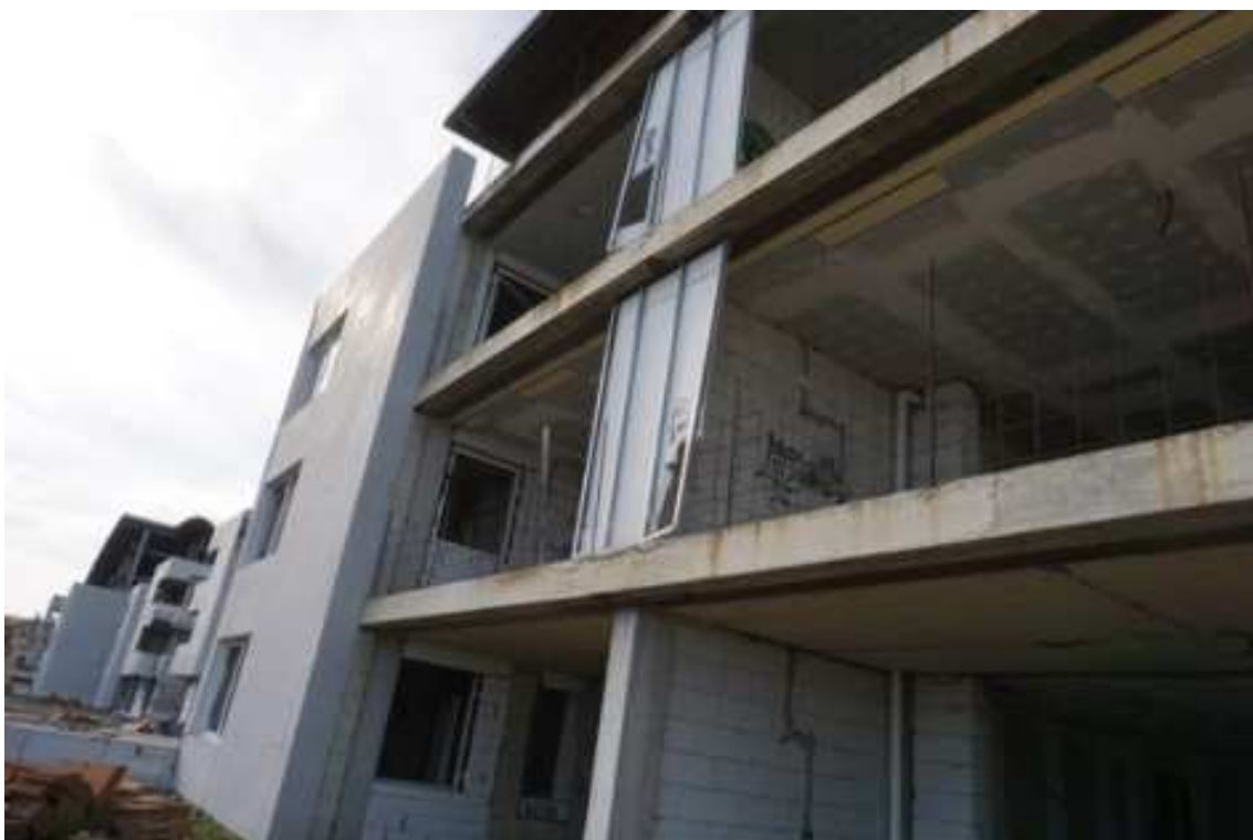
Fig.80– Vista da nord verso sud delle facciate rivolte ad est (piano rialzato).