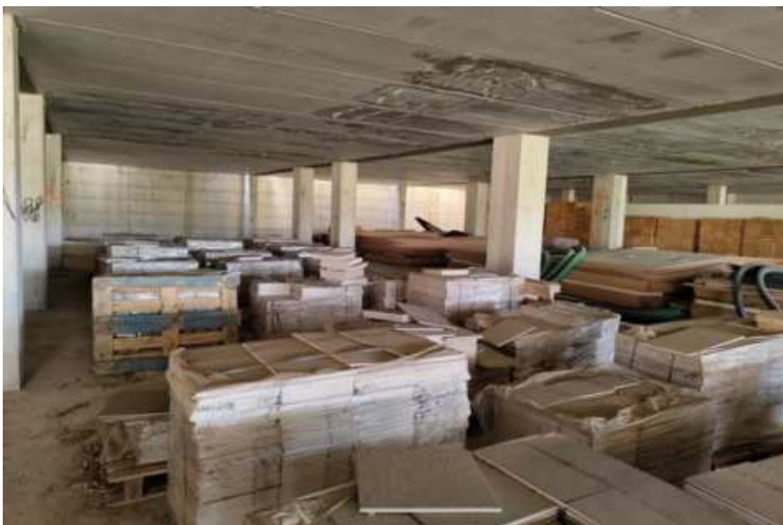
Fig.91 – Vista delle strutture del piano e del deposito di bancali di materiale edilizio (secondo piano interrato).