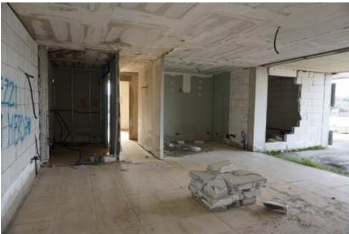
Fig.39 – Vista dei vani interni agli alloggi e suddivisione dei vani pareti vandalizzate (piano rialzato).