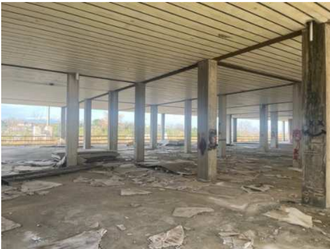
Fig.7 – Vista da sud-est verso ovest (primo piano interrato).