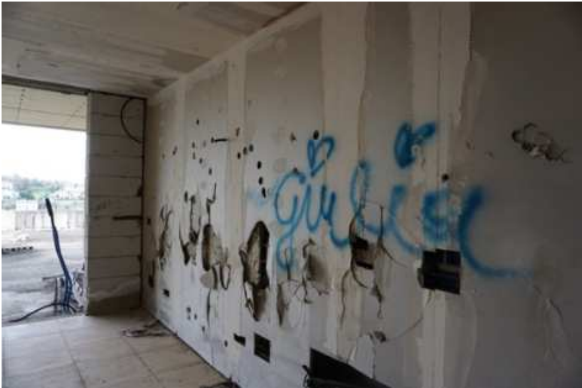
Fig.61 – Vista dei vani interni al complesso residenziale (piano rialzato).