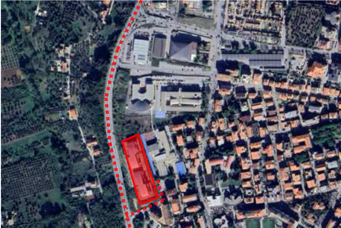
Fig.1 – Vista dei Terreni su ortofoto con individuazione della Circonvallazione Histonienne e di Via D.G. Rossetti