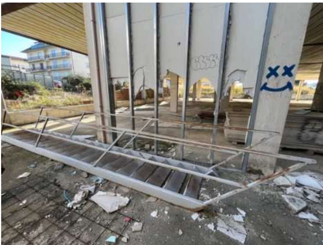
Fig.8 – Vista da nord-ovest verso nord-est delle pareti in cartongesso vandalizzate (primo piano interrato).