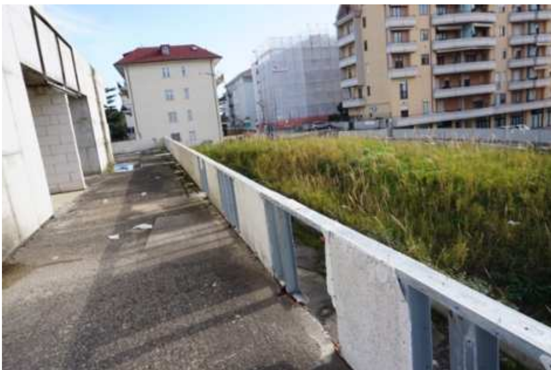
Fig.46 – Vista del balcone di testata sud del complesso residenziale su via G.D. Rossetti (piano rialzato).