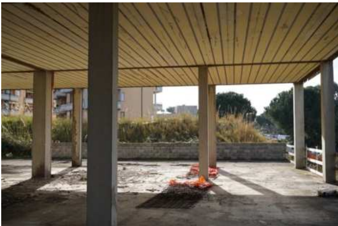
Fig.16 – Vista da nord verso sud delle strutture portanti di tipo intelaiato in cls armato (primo piano interrato).