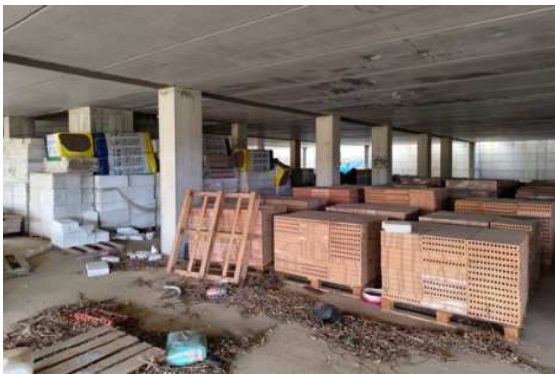
Fig.89 – Vista delle strutture del piano e del deposito di bancali di materiale edilizio (secondo piano interrato).