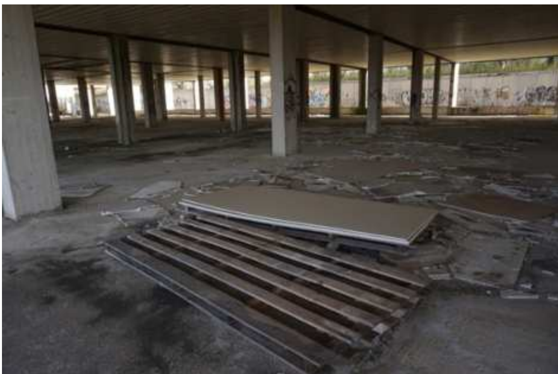
Fig.13 – Vista da sud-est verso istituto superiore Pàntini- Pudente (primo piano interrato).