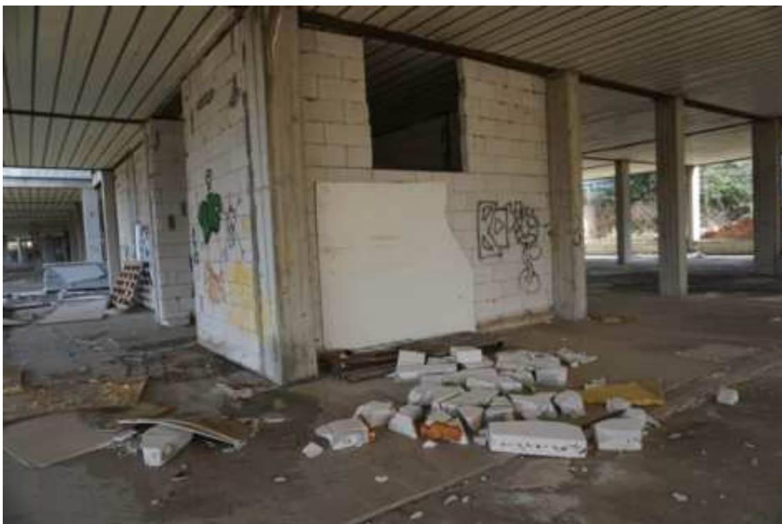
Fig.20 – Vista dei locali tecnici e cantinole privi di opere di finitura e scarti edilizi (primo piano interrato).