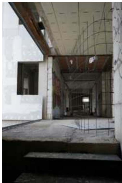
Figg.33-34 – Vista vano scala da Piano Rialzato al Primo Piano interrato e su corridoio di distribuzione (piano rialzato).