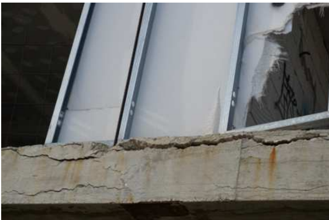
Fig.82– Vista di dettaglio sui fenomeni di degrado cls sul bordo dei solai dei piani superiori (piano rialzato)..