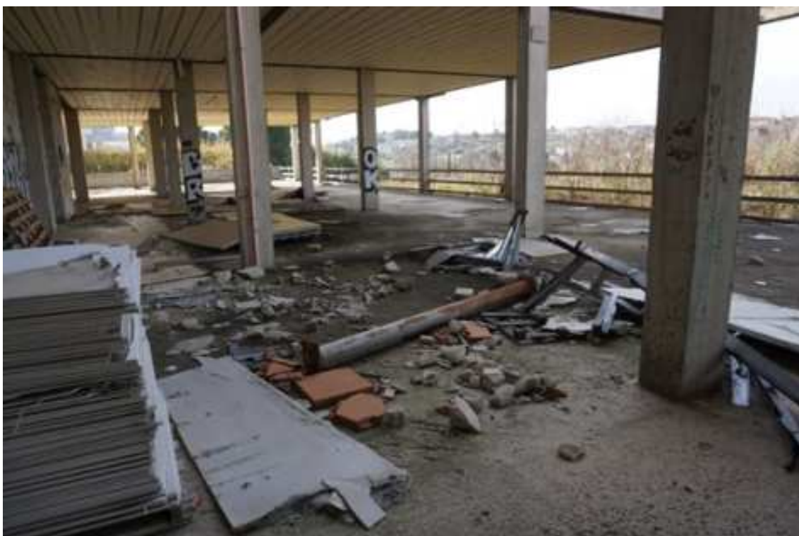
Fig.17 – Vista su strutture e materiale edile accantonato (primo piano interrato).