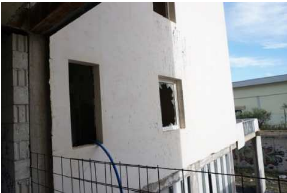
Fig.79 – Vista di dettaglio delle facciate rivolte a sud-est (piano rialzato).