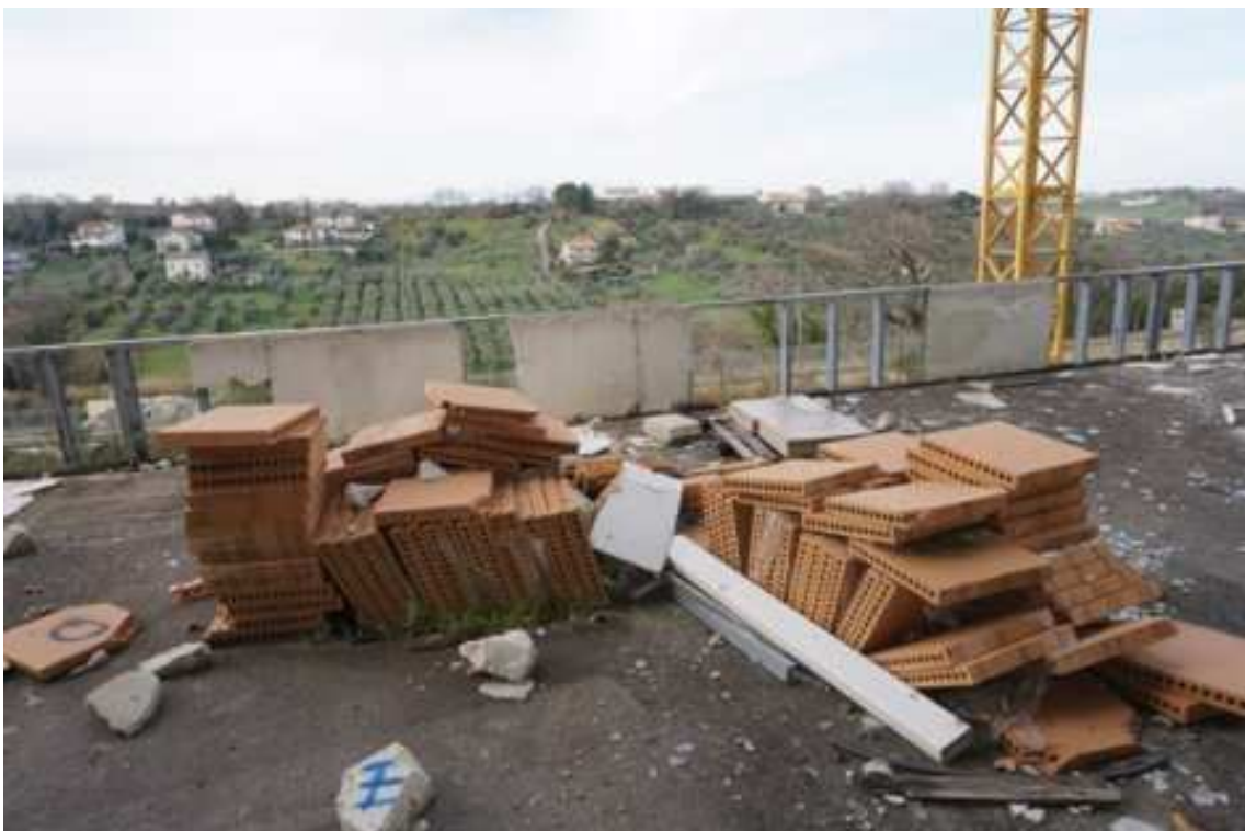
Fig.74 – Vista verso ovest della terrazza esterna con dettaglio su tavelloni in argilla accatastati (piano rialzato).