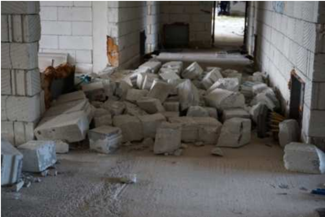
Fig.59 – Vista su spazi di distribuzione (piano rialzato).