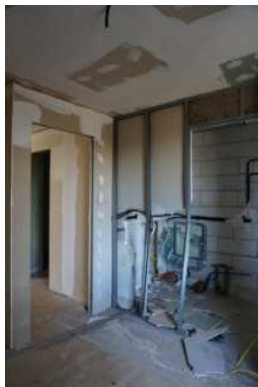
Figg.49-50 – Vista dei vani interni privi di opere di finitura e con presenza di interventi vandalici (piano rialzato).