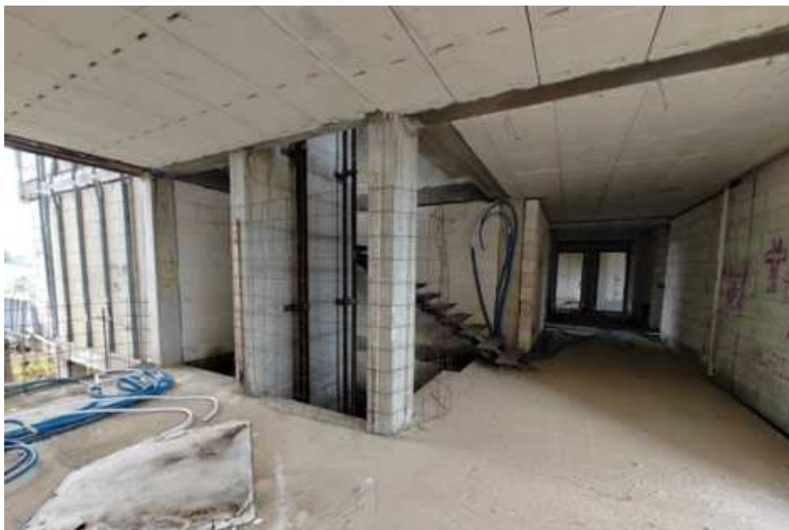
Fig.37 – Vista sui corridoi di distribuzione e del vano scala/ascensore (piano rialzato).