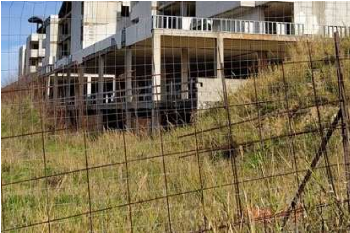
Fig.84– Vista dell'accesso da sud al secondo piano interrato