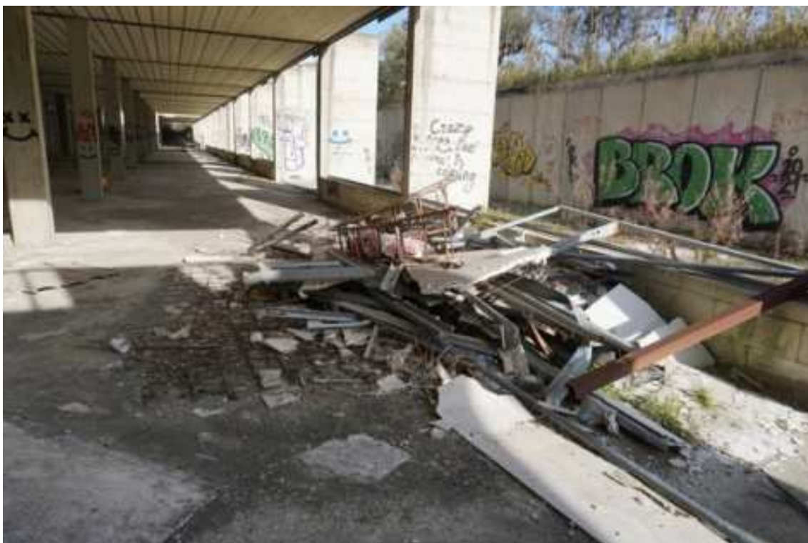
Fig.12 – Vista da sud-est verso istituto superiore Pàntini-Pudente (primo piano interrato).