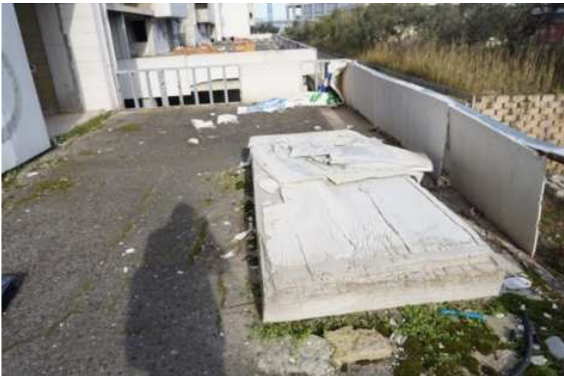
Fig.58 – Vista di parapetto in cartongesso posto al limite delle terrazze (piano rialzato).