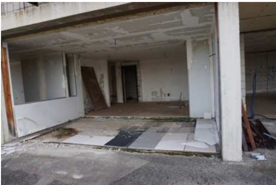
Fig.41 – Vista dall'esterno dei vani interni agli alloggi (piano rialzato).