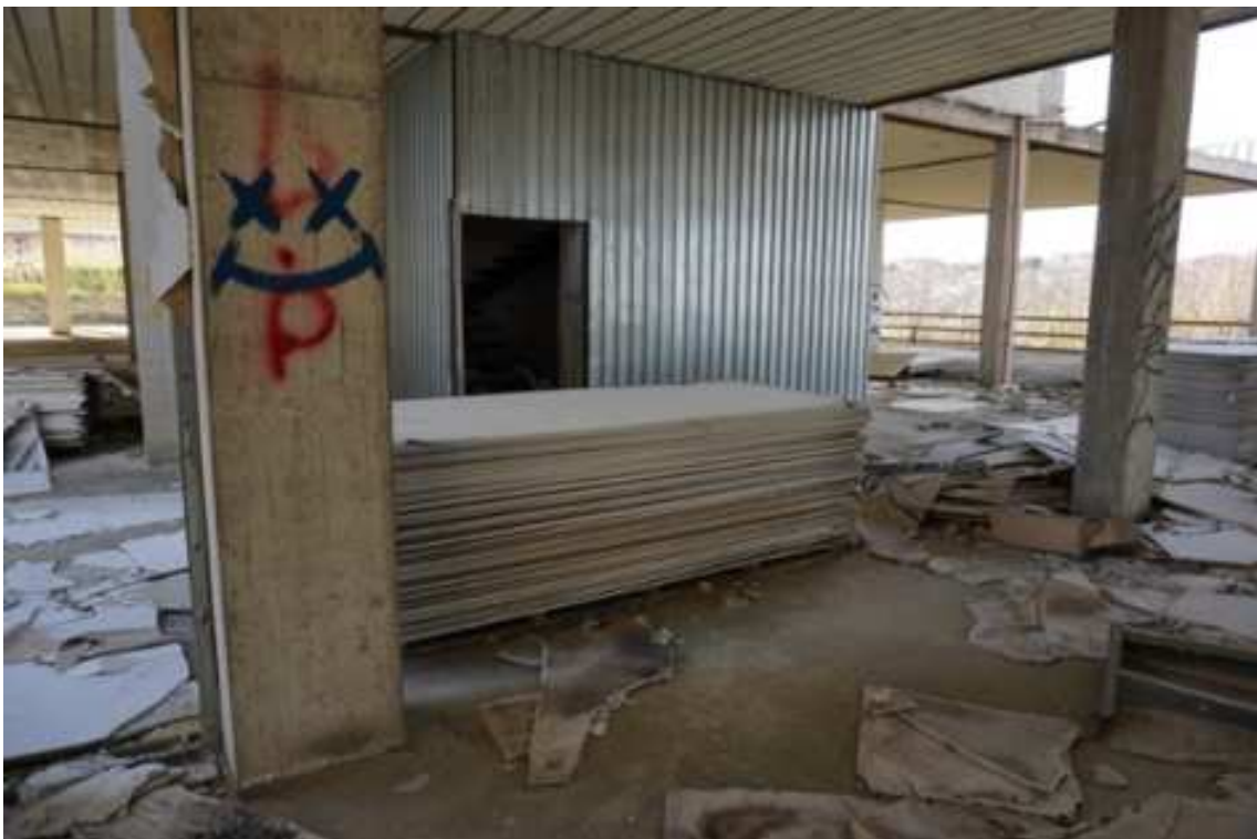
Fig.26 – Vista dell'accesso al vano scala di accesso ai piani superiori (primo piano interrato).