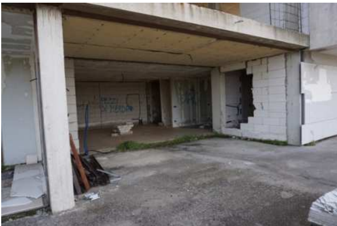
Fig.40 – Vista dall'esterno dei vani interni agli alloggi (piano rialzato).