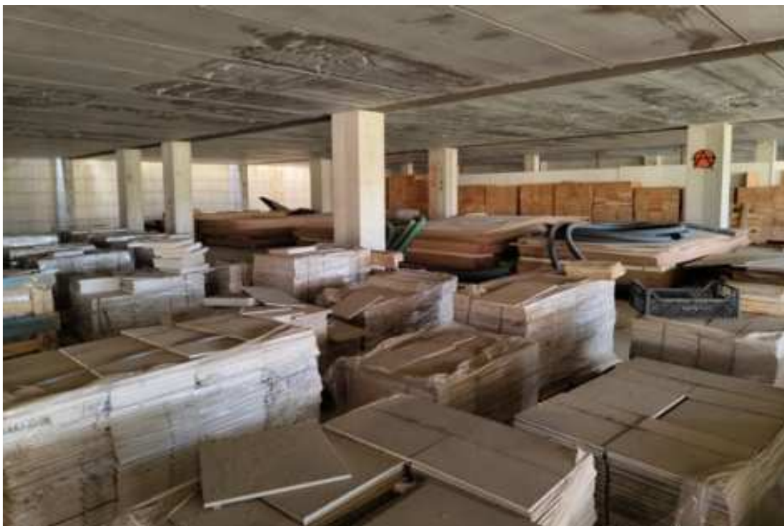
Fig.92 – Vista delle strutture del piano e del deposito di bancali di materiale edilizio (secondo piano interrato).