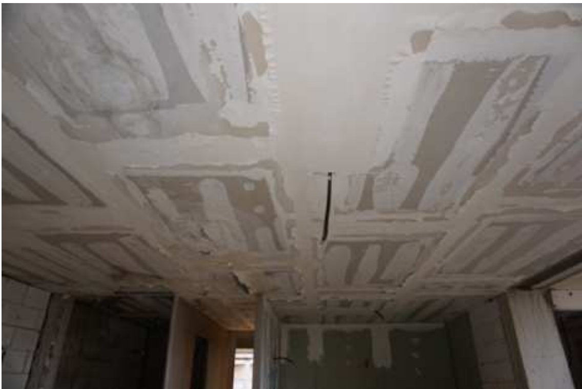
Fig.64 – Vista dei vani interni al complesso residenziale con dettaglio su soffitto in cartongesso e presenza di fenomeni infiltrativi (piano rialzato).