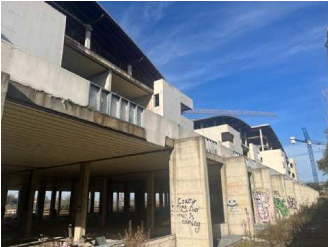
Fig.3 – Vista dell’immobile posto sui terreni al Fg 36 P.lle 4415-4418 dall’ingresso posto a sud est (primo piano interrato)