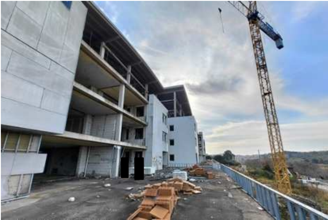
Fig.73 – Vista da nord verso sud della terrazza esterna con individuazione dei piani superiori (piano rialzato).