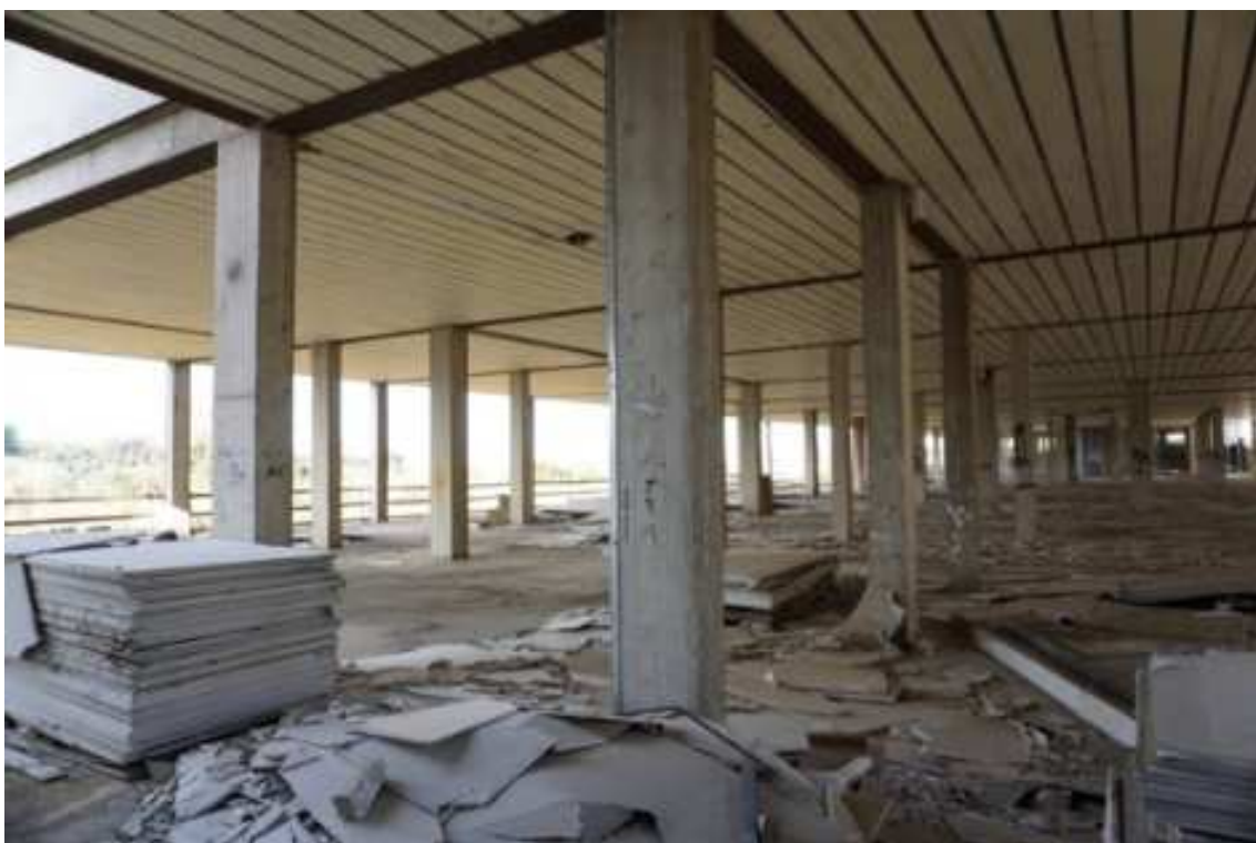
Fig.9 – Vista su strutture e materiali da costruzione abbandonati (primo piano interrato).