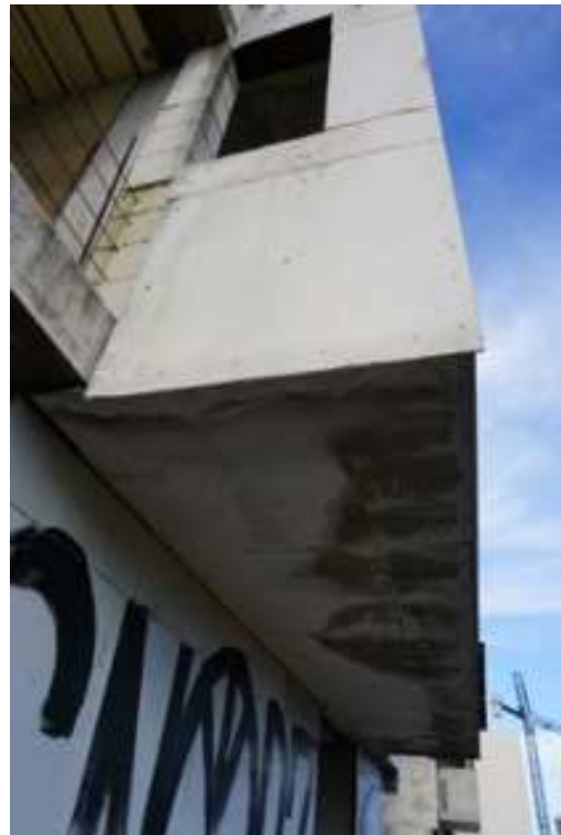
Figg.76-77 – Vista dal basso degli impalcati superiori (piano rialzato).