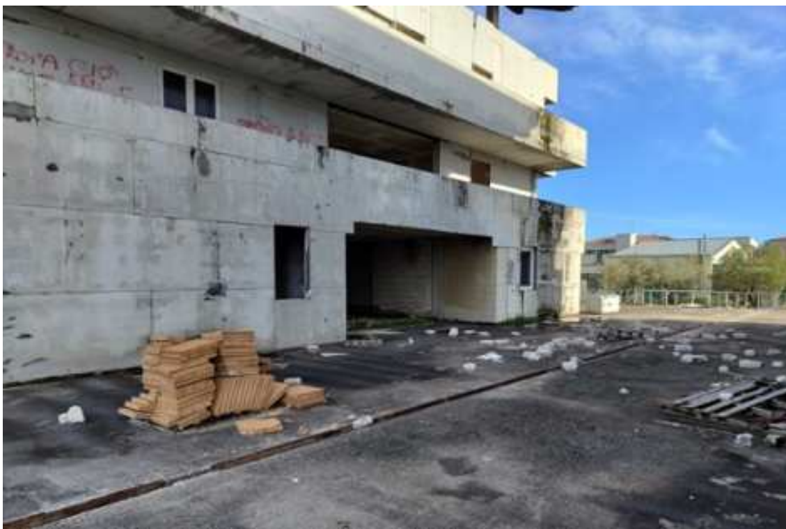
Fig.70 – Vista da ovest verso est della zona centrale della terrazza esterna e di parte della facciata laterale del complesso residenziale (piano rialzato).