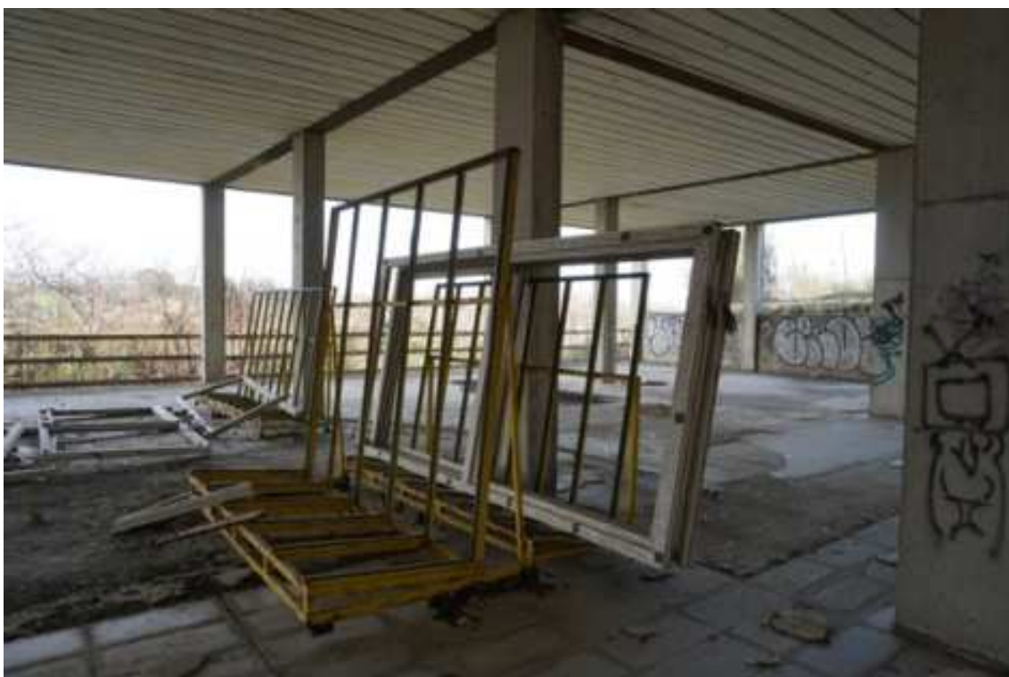
Fig.21 – Vista su telai di infissi posizionati in cantiere (primo piano interrato).