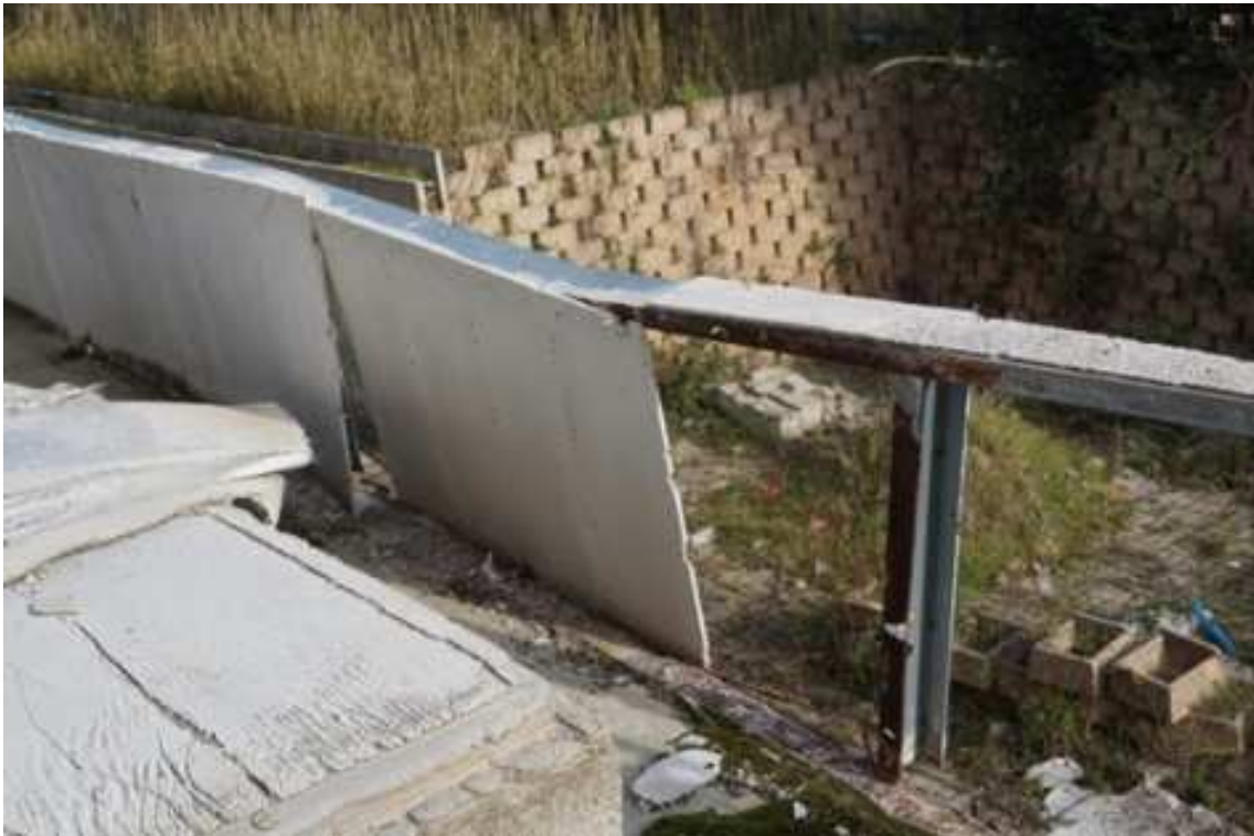
Fig.57 – Vista di parapetto in cartongesso posto al limite delle terrazze (piano rialzato).