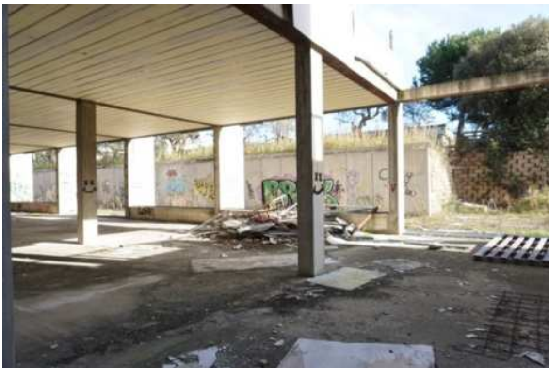
Fig.11 – Vista da sud-est verso istituto superiore Pàntini- Pudente (primo piano interrato).