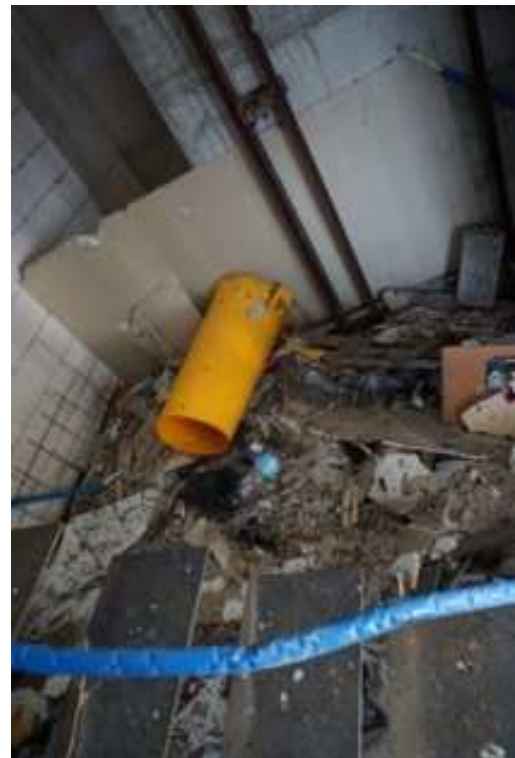
Figg.29-30 – Vista su vano scala ed ingombro vano ascensore (primo piano interrato/piano rialzato).