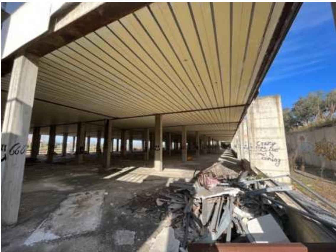
Fig.4 – Vista su immobile e terreni al Fg 36 P.lle 4415-4418 (primo piano interrato).