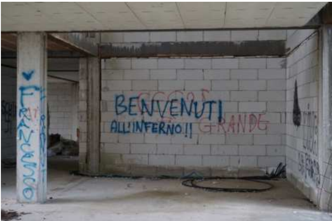
Fig.60 – Vista su spazi comuni di distribuzione (piano rialzato).