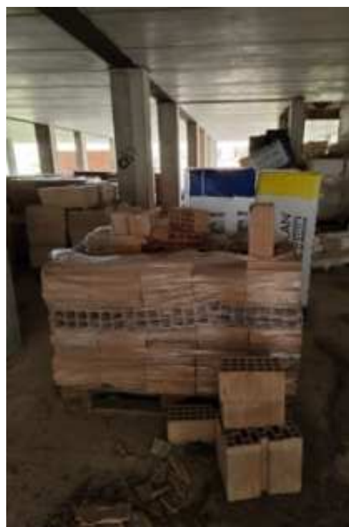
Figg.95-96 – Vista delle strutture del piano e del deposito di bancali di materiale edilizio (secondo piano interrato).