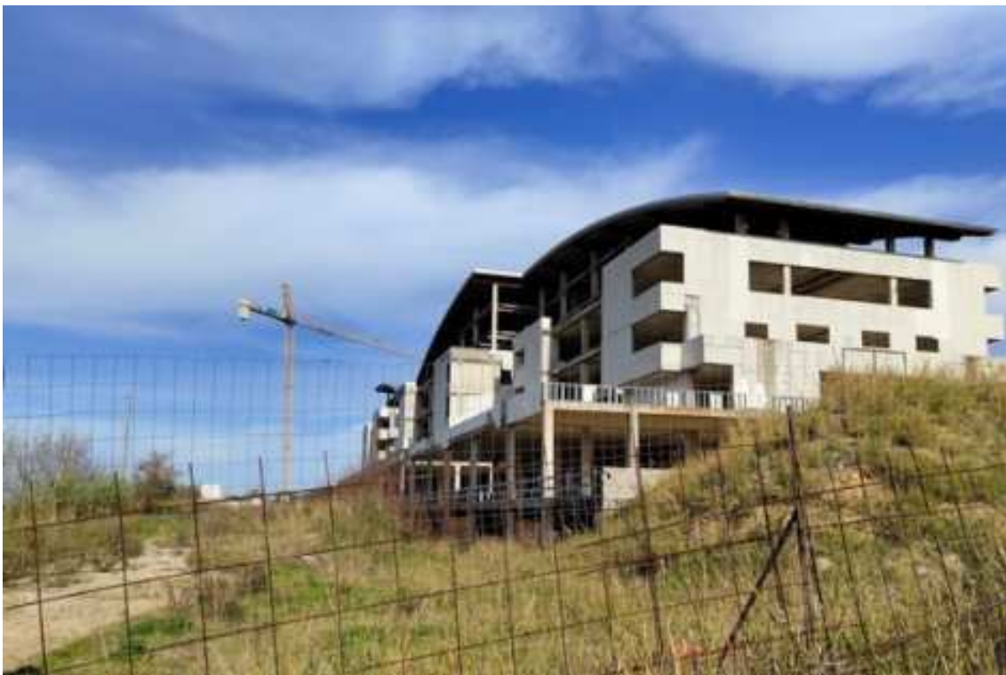
Fig.2 – Vista su immobile e terreni al Fg 36 P.lle 4415-4418 da via D.G. Rossetti verso via Histonienne