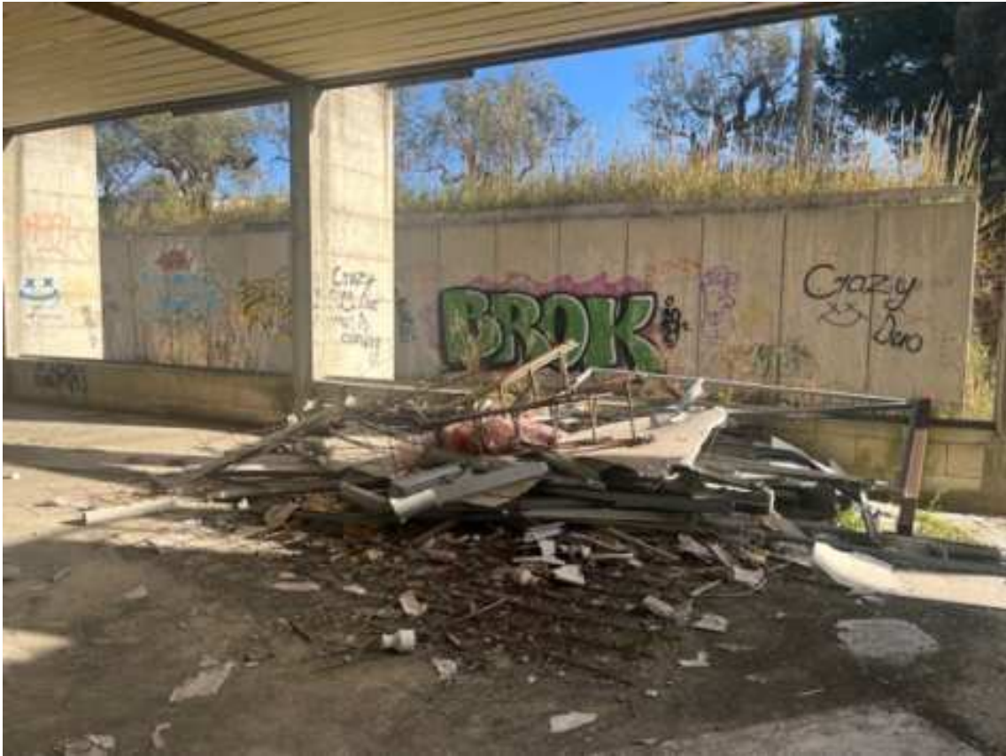
Fig.5 – Vista su scarti edili presenti sul solaio di calpestio (primo piano interrato).