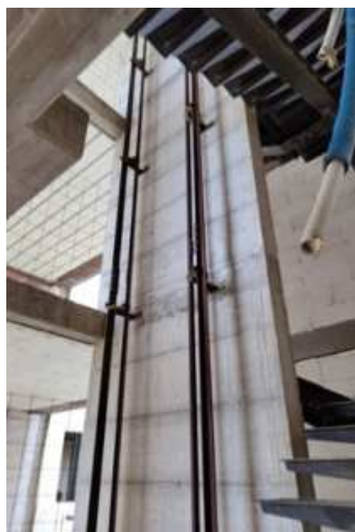
Figg.35-36 – Vista di dettaglio dei binari e delle pulegge del vano ascensore in stato di abbandono (piano rialzato).