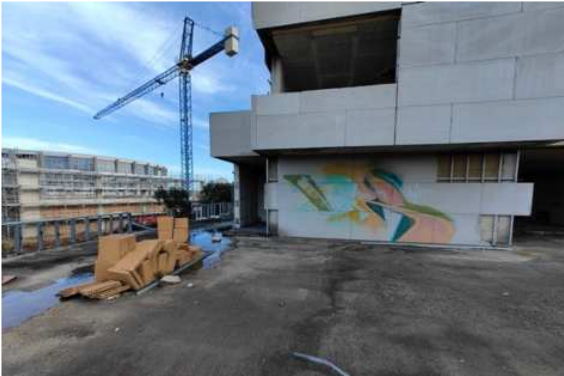
Fig.75 – Vista della facciata esposta a nord-ovest (piano rialzato).