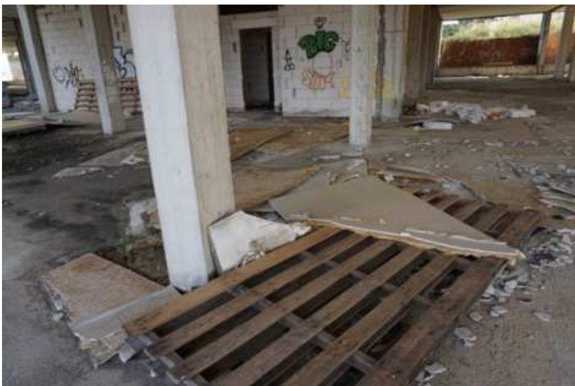
Fig.19 – Vista dei locali tecnici e cantinole privi di opere di finitura e scarti edilizi (primo piano interrato).