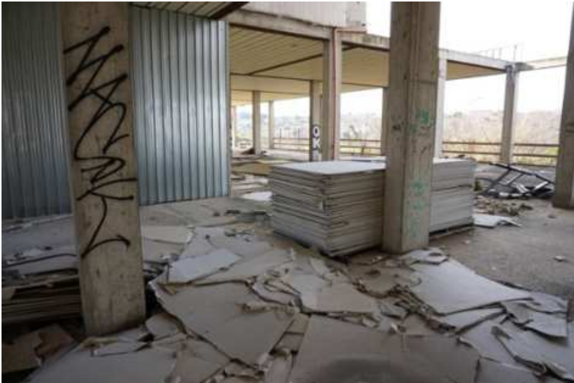
Fig.25 – Vista da nord-ovest verso sud-est degli spazi interni (primo piano interrato).