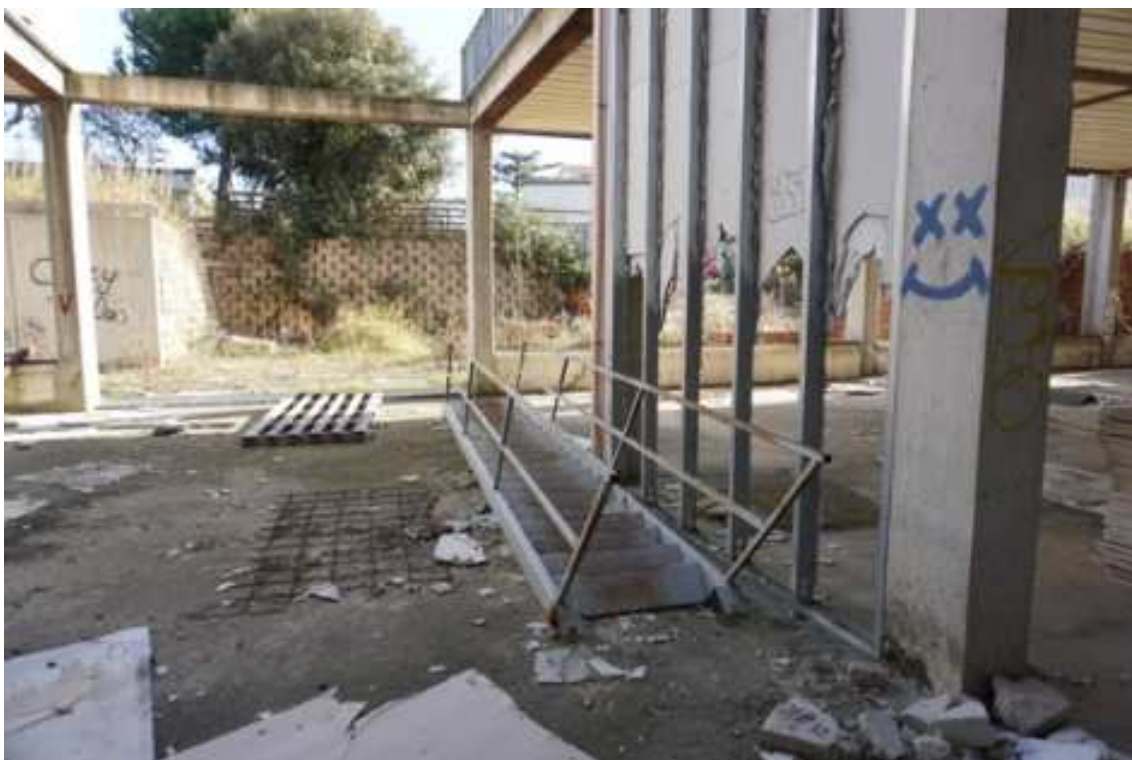
Fig.10 – Vista da nord-ovest verso nord-est (primo piano interrato).