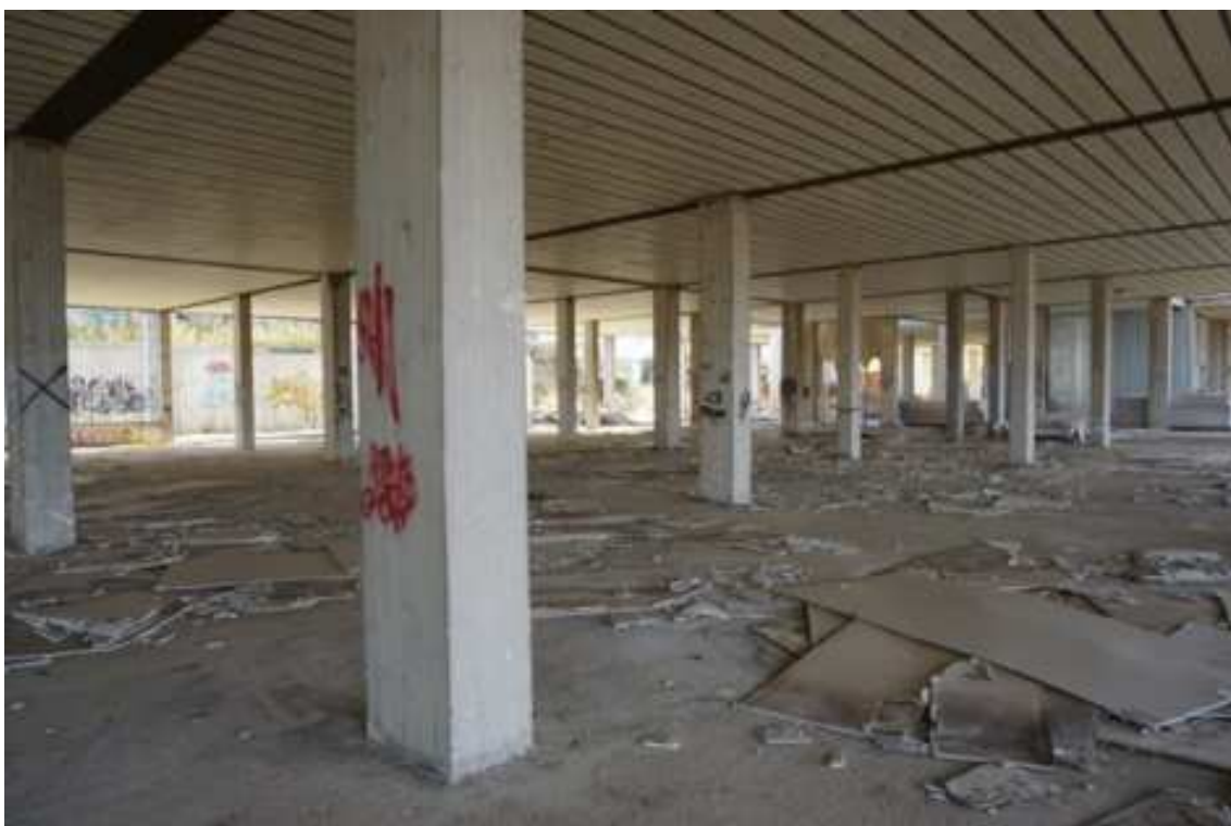
Fig.15 – Vista da nord verso sud delle strutture portanti (primo piano interrato).