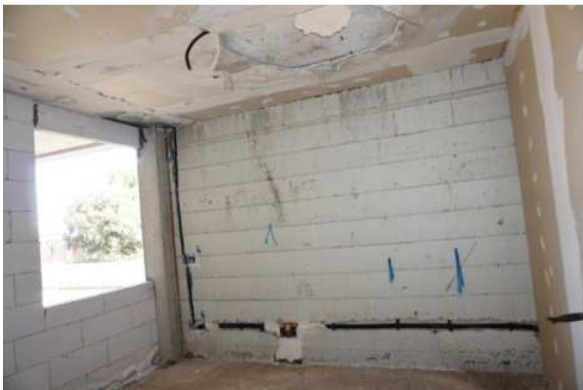
Fig.51 – Vista di un vano interno privo di opere di finitura e con fenomeni infiltrativi in atto (piano rialzato).