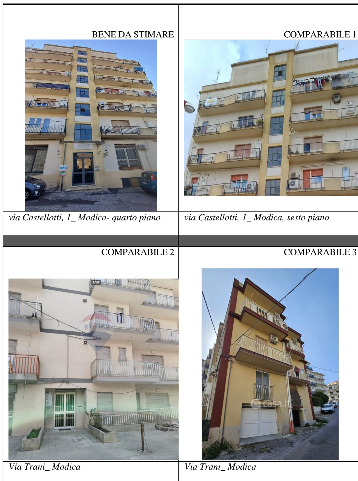
Figura 7. Riferimento fotografico dei comparabili presi in considerazione per la determinazione del costo secondo la norma UNI ai fini della redazione MCA

Ho utilizzato gli standard di valutazione immobiliare e redatto la MCA conformemente a quanto previsto dalla norma UNI 11558. Si allega di seguito stralcio della redazione eseguita ed i comparabili di riferimento che si trovano o nella stessa via o nel quartiere dove insiste il bene oggetto di valutazione: