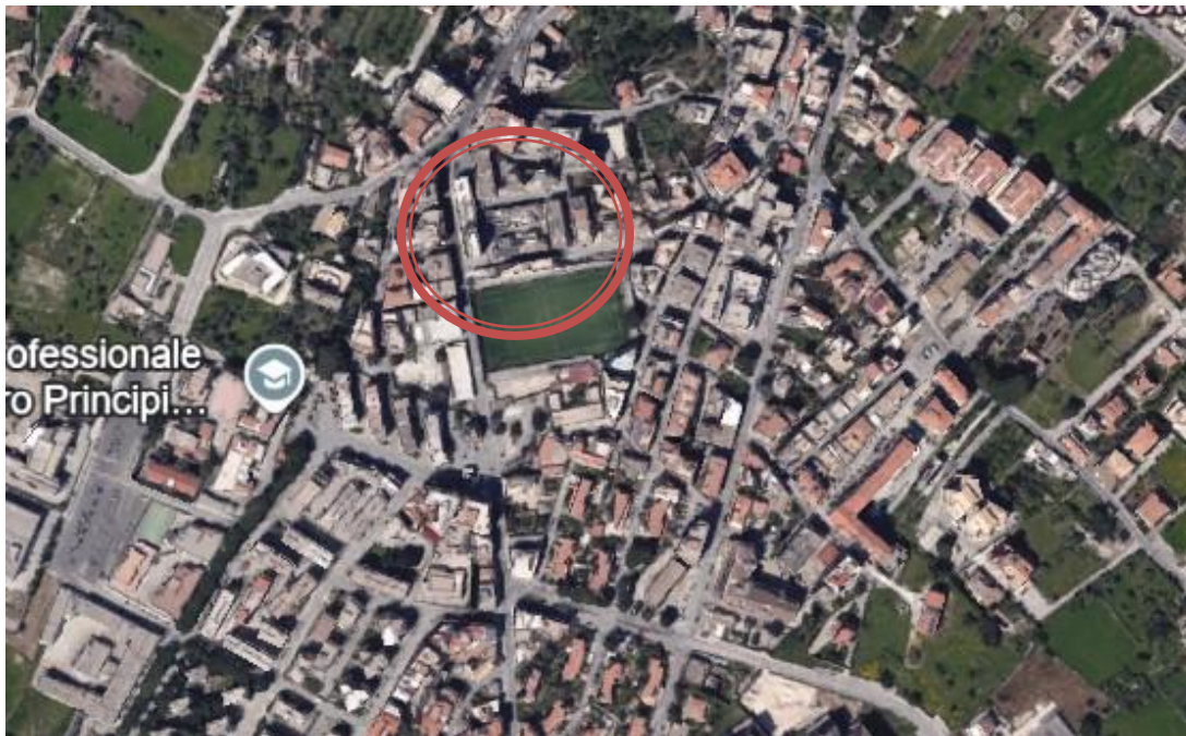
Figura 1. Immagine aerea estratta dal sito google hearth con l'identificazione del bene oggetto di pignoramento.

Si tratta di un appartamento facente parte di un condominio realizzato con regolare autorizzazione, un nulla osta del 1967 e successiva modifica ai prospetti autorizzata nel 1970 dal Comune di Modica. E' ubicato in zona B del vigente PRG di Modica. Il condominio di cui fa parte l'appartamento gode di una posizione strategica e baricentrica tra il centro storico e la zona di espansione commerciale. Su via Nazionale la facciata ha grande pregio, meno sul retro ove insiste l'accesso agli appartamenti, la via Castellotti. Il bene ha 3 lati liberi e confina con la suddetta via Castellotti, via Nazionale, e si affaccia su una strada privata. Un lato confina con proprietà terzi in quanto vi sono 2 appartamenti per piano.