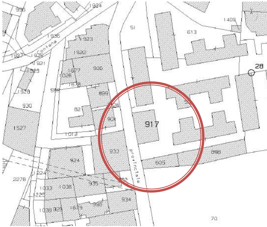
Figura 2. Stralcio della mappa catastale.