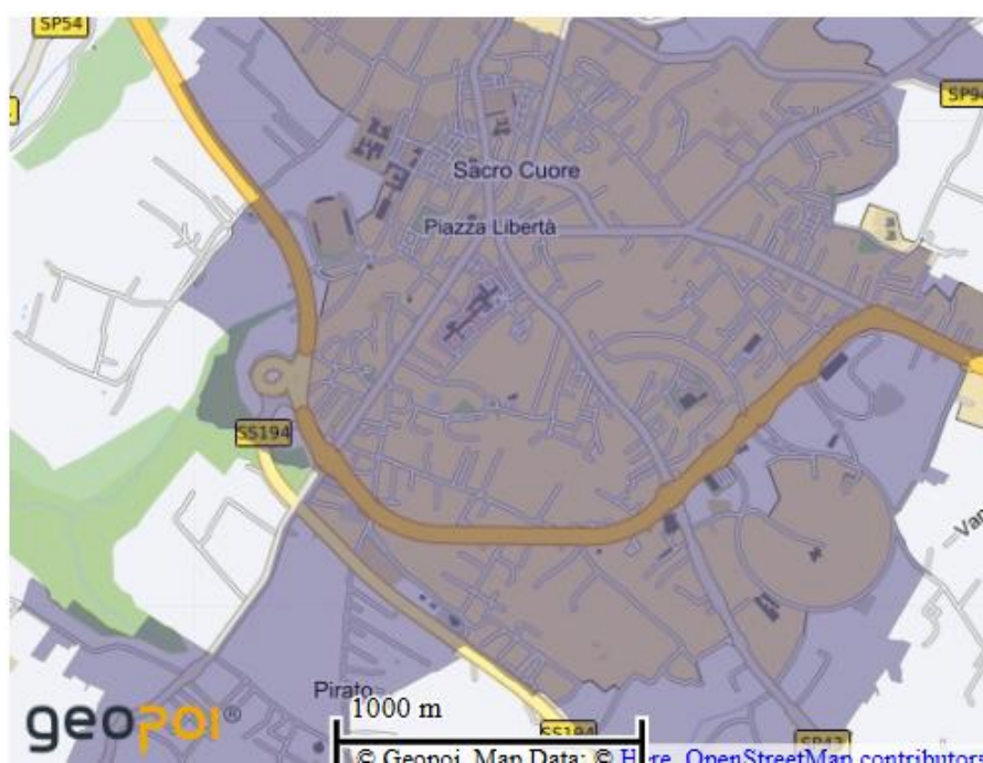
Figura 4. Zonizzazione del cespite in riferimento alle indicazioni OMI. Sito all'interno della fascia di colore giallo con tipologia di edilizia a prevalenza economica popolare

Nella determinazione di tali valori ho altresì tenuto in debito conto le quotazioni O.M.I. edite dall'Agenzia del Territorio che vengono di seguito allegate.