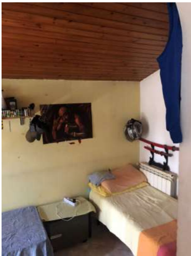
foto 41 CAMERA OGGETTO ISTANZA DI SANATORIA PROT. 15931