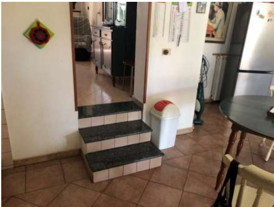
foto 36 CUCINA AMPLIAMENTO NON SANABILE