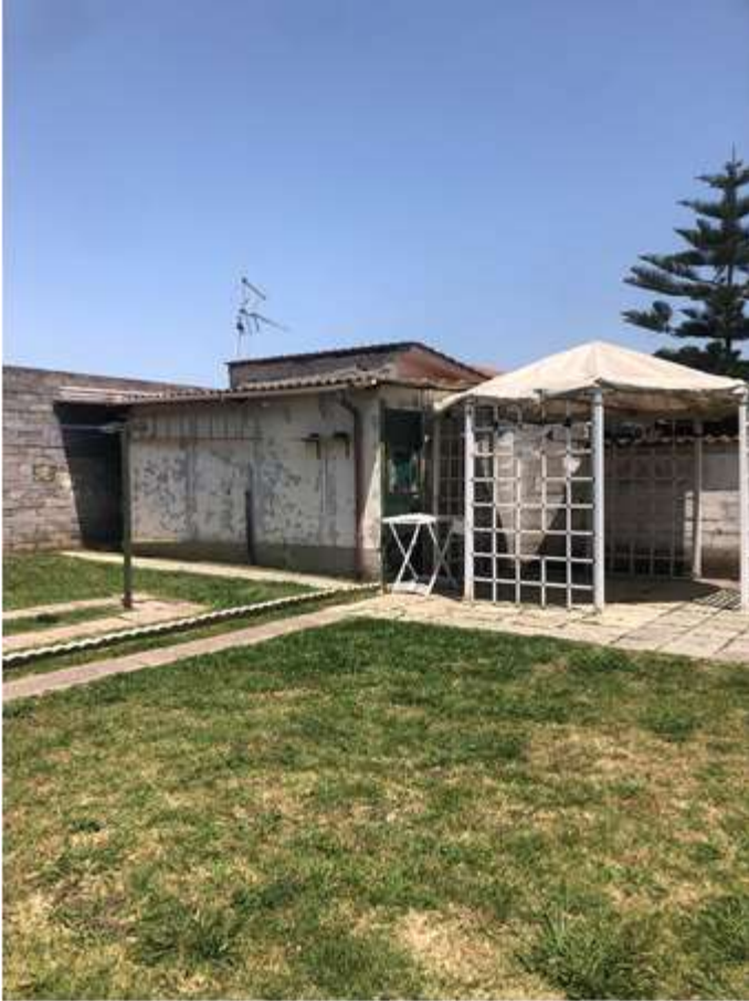
foto 47 MANUFATTO ABUSIVO SU SUB 5