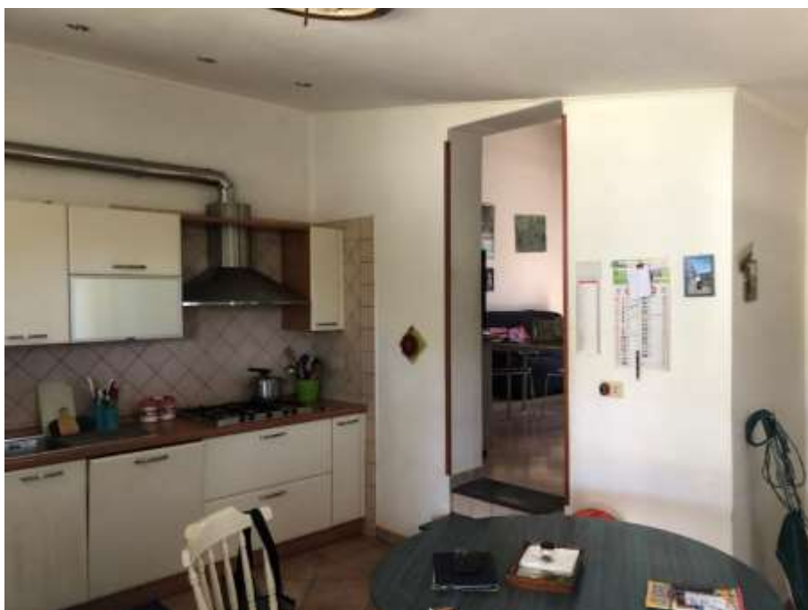
foto 37 CUCINA AMPLIAMENTO NON SANABILE