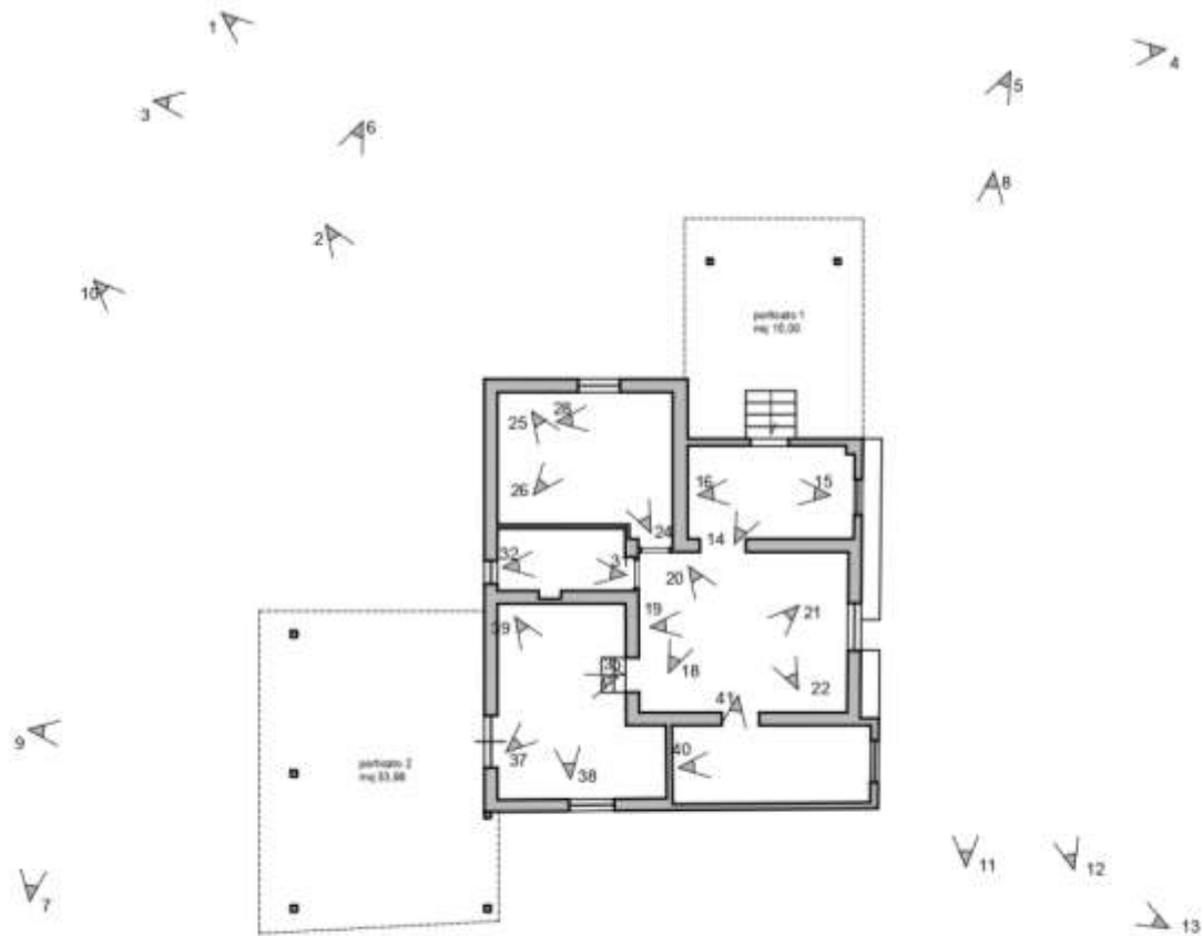
PLANIMETRIA CON CONI OTTICI