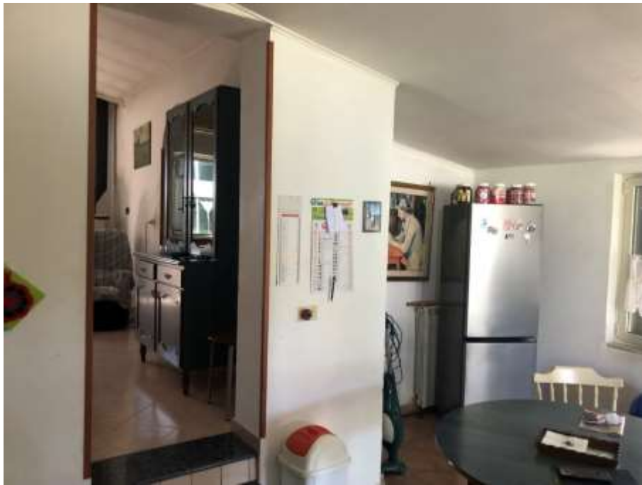
foto 39 CUCINA AMPLIAMENTO NON SANABILE