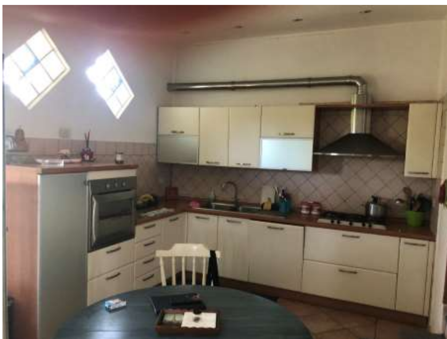
foto 38 CUCINA AMPLIAMENTO NON SANABILE