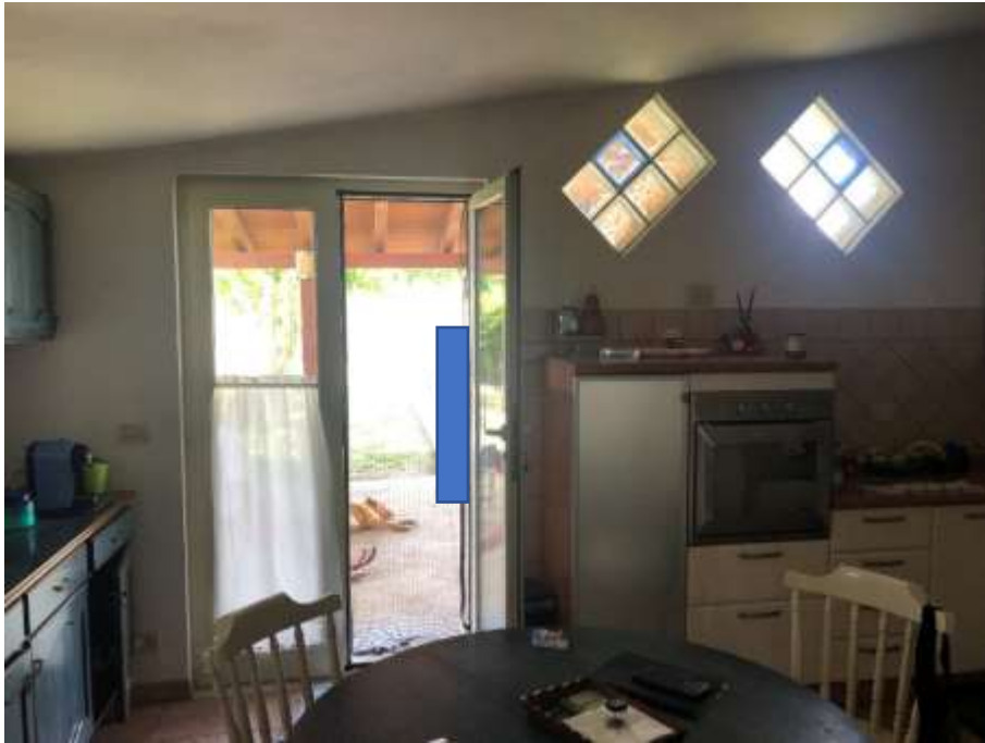
foto 35 CUCINA AMPLIAMENTO NON SANABILE