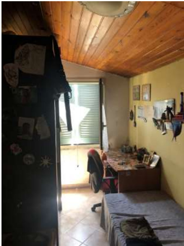
foto 40 CAMERA OGGETTO ISTANZA DI SANATORIA PROT. 15931