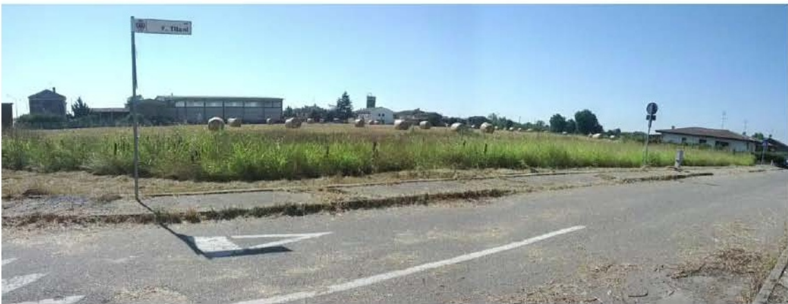
foto panoramica 4: Lotti 8 – 7 – 6 – 5 (fg.18 mapp.962 – 961 – 960 – 959)