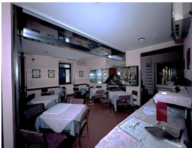
Foglio 39 part. 210 sub. 6