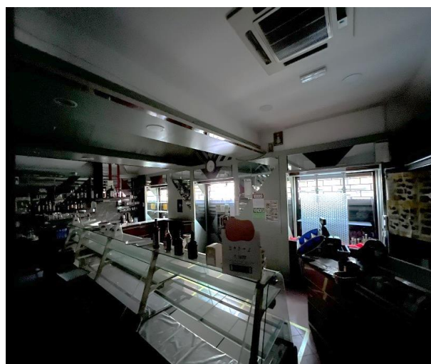
Foglio 39 part. 210 sub. 10