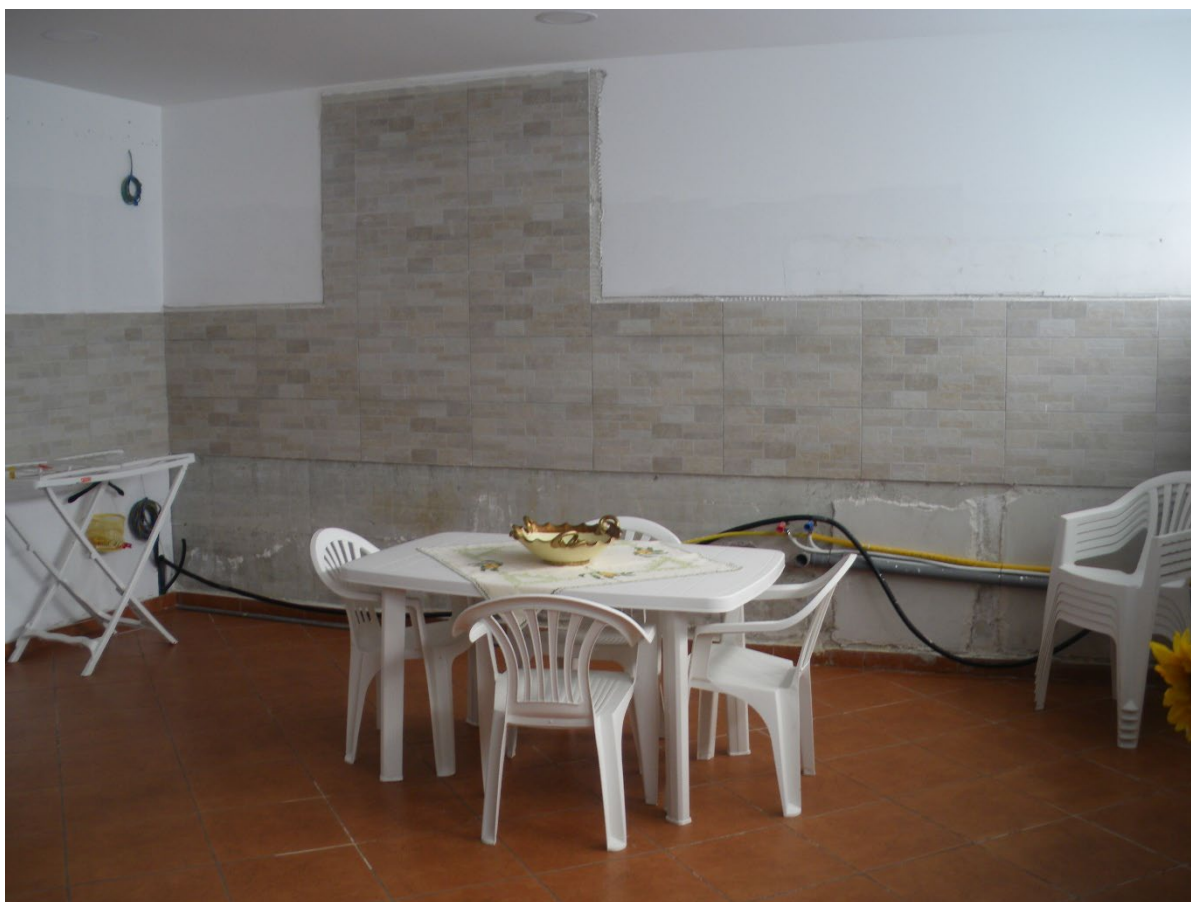
Foto n. 05: Spazio cucina-tinello – Si evidenzia la parete attrezzata (lotto n. 01)