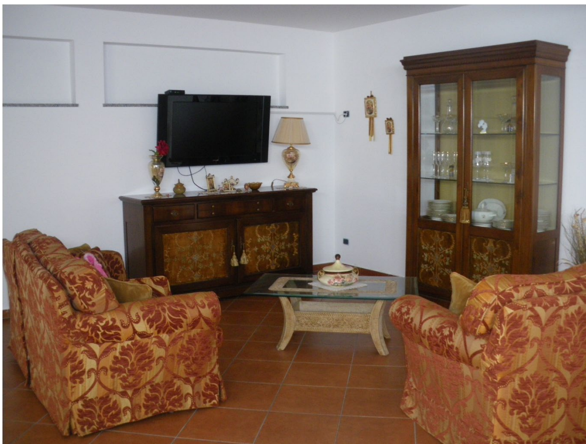
Foto n. 03: Soggiorno salotto antistante all'ingresso (lotto n. 01)