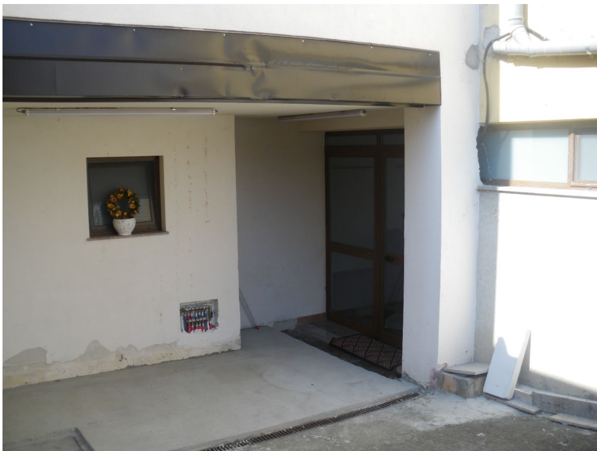
Foto n. 02: Ingresso dall'esterno al lotto n. 01 – Frontalmente si evidenzia l'addizione del begno