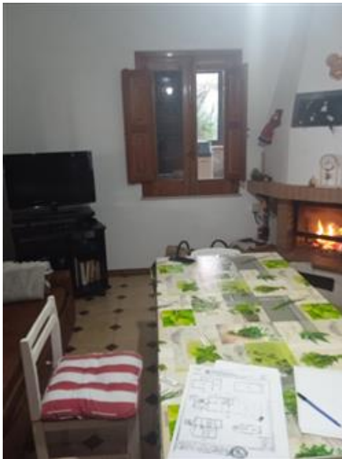
Foto n. 9 cucina con caminetto