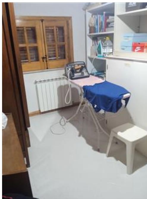
cameretta a piano terra