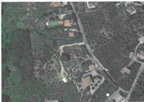
Allegato 1