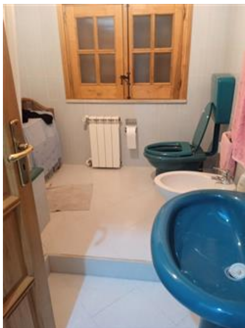
Bagno a piano terra