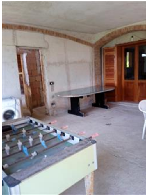
Foto n. 5 Patio coperto