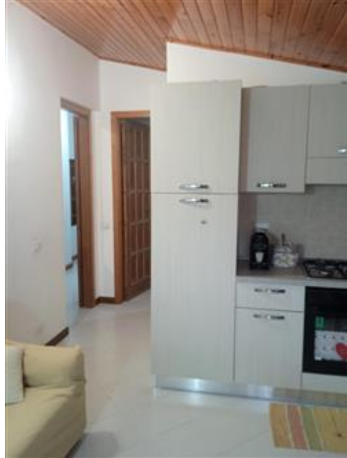
Foto n. 16 cucina primo piano e disimpegno