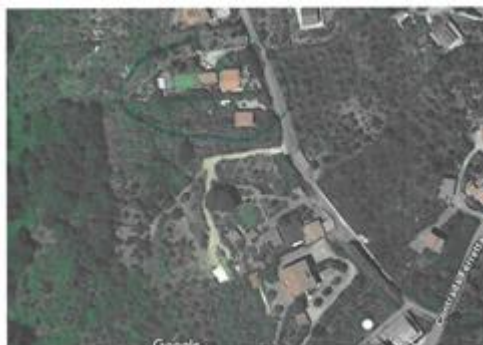
Allegato 1