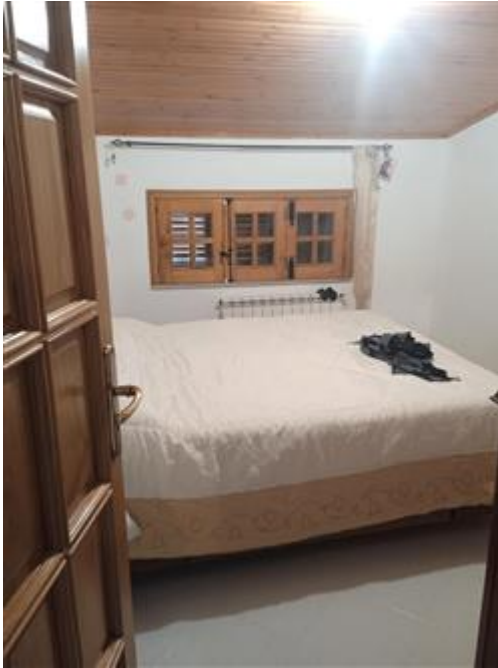
foto n. 19 camera da letto principale