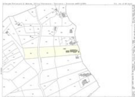
Allegato 3 Estratto di mappa foglio 18 particella 254