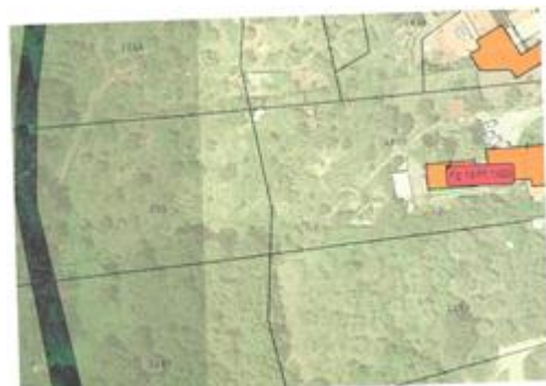
Allegato 2 Ortofoto