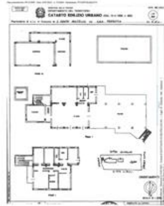
Allegato 5 Planimetria catastale