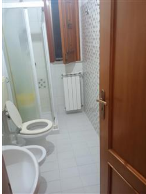
Foto n. 20 bagno secondario primo piano