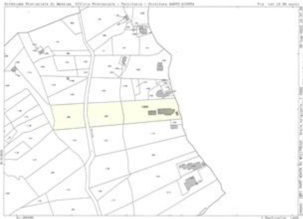
Allegato 3 Estratto di mappa catastale