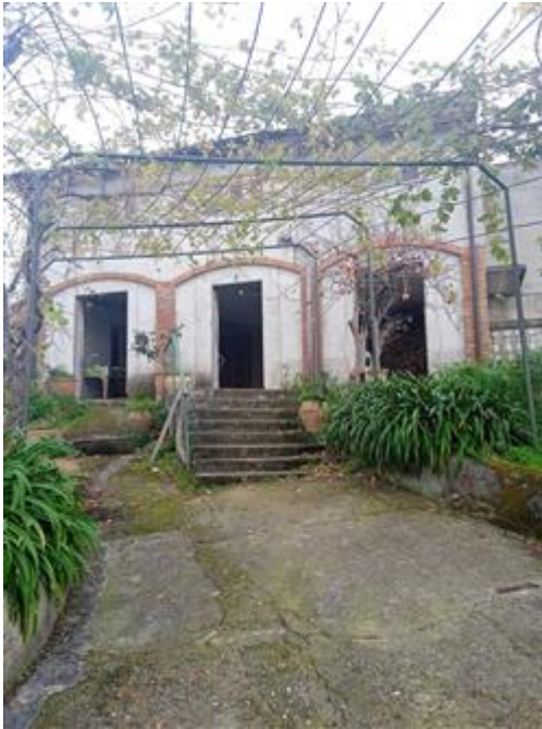
Foto n. 2 Varco d'ingresso alla villetta

L'intero edificio sviluppa 3 piani, 2 piani fuori terra, 1 piano interrato. Immobile costruito nel 1987 ristrutturato nel 1995.