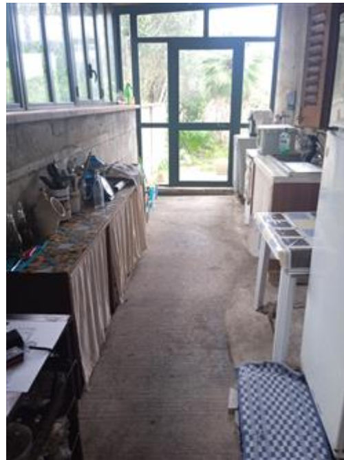
Foto n. 10 particolare veranda esterna chiusa a vetri e profiati di alluminio verniciato