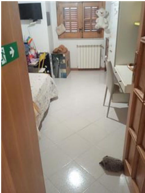
Foto n. 17 camera da letto primo piano