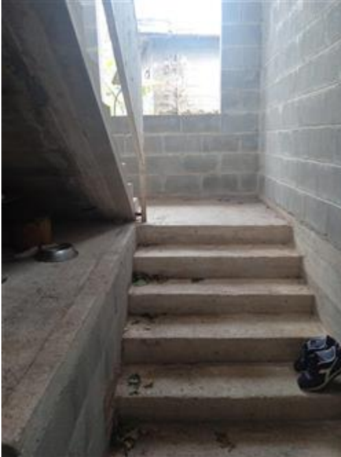
Foto n. 14 scala di collegamento tra il piano terra e primo piano