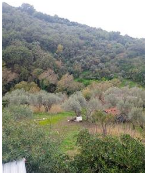
Foto n. 21 Terreno particella 254

Presenta una forma quadrata , un'orografia in declivio, una tessitura prevalente terreno di medio impasto con ciottoli, i seguenti sistemi irrigui: inesistenti , le seguenti sistemazioni agrarie: inesistente, sono state rilevate le seguenti colture erbacee: pascolo ,arboree: uliveto ,Il terreno