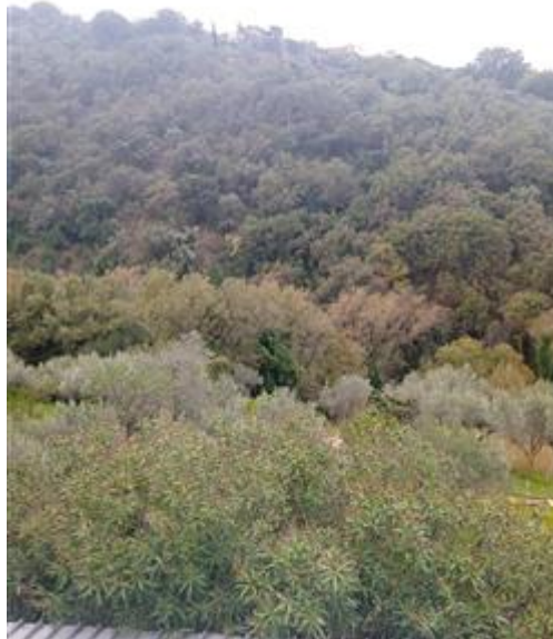
Foto n. 22 terreno particella 254

Presenta una forma quadrilatero, un'orografia in declivio , i seguenti sistemi irrigui: inesistenti, le seguenti sistemazioni agrarie: inesistente , sono state rilevate le seguenti colture erbacee: nessuna ,arboree: essenze boschive e ulivo ,di selvicoltura: roverella Il terreno