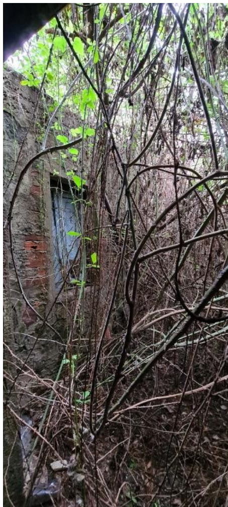
Prospetto locale bagno