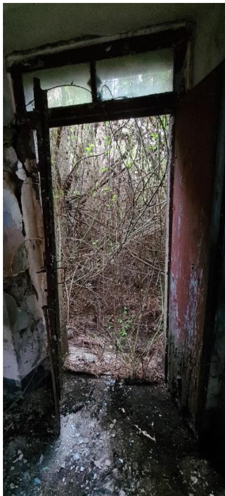
Accesso al cortile