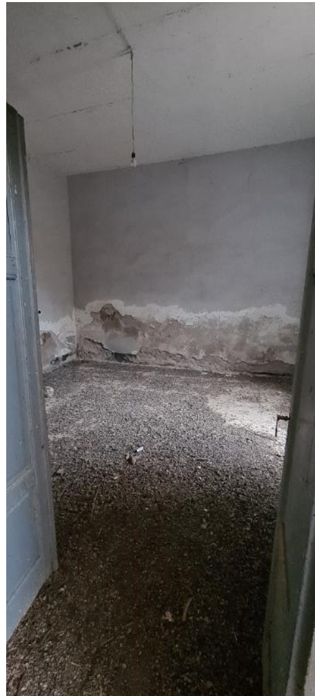
Camera n. 1 – lato destro