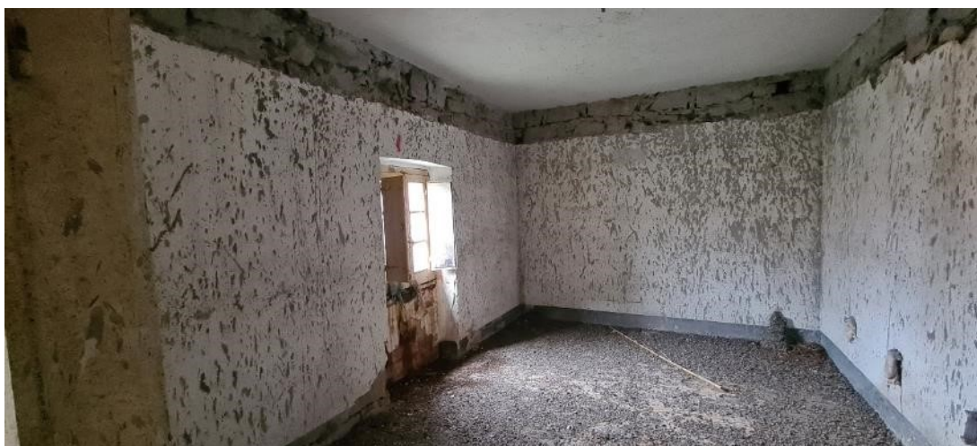
Camera piano primo – lato destro, prospetto posteriore