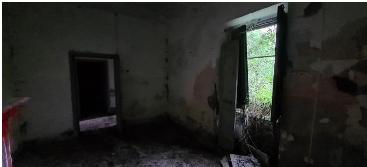
Locale cucina camera n. 2 lato destro