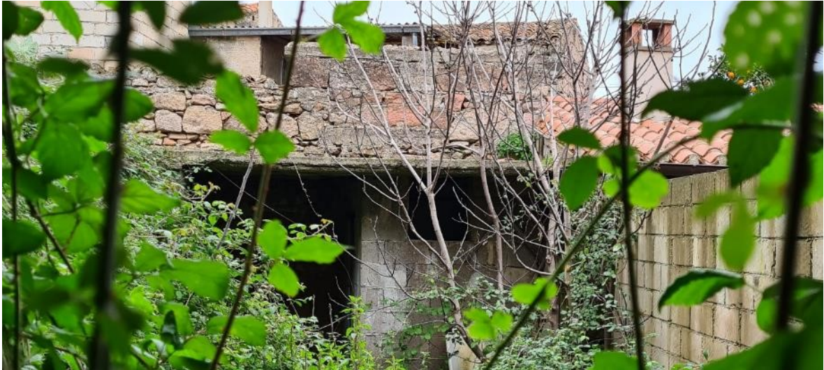
Cortile posteriore - tettoia-corpo accessorio