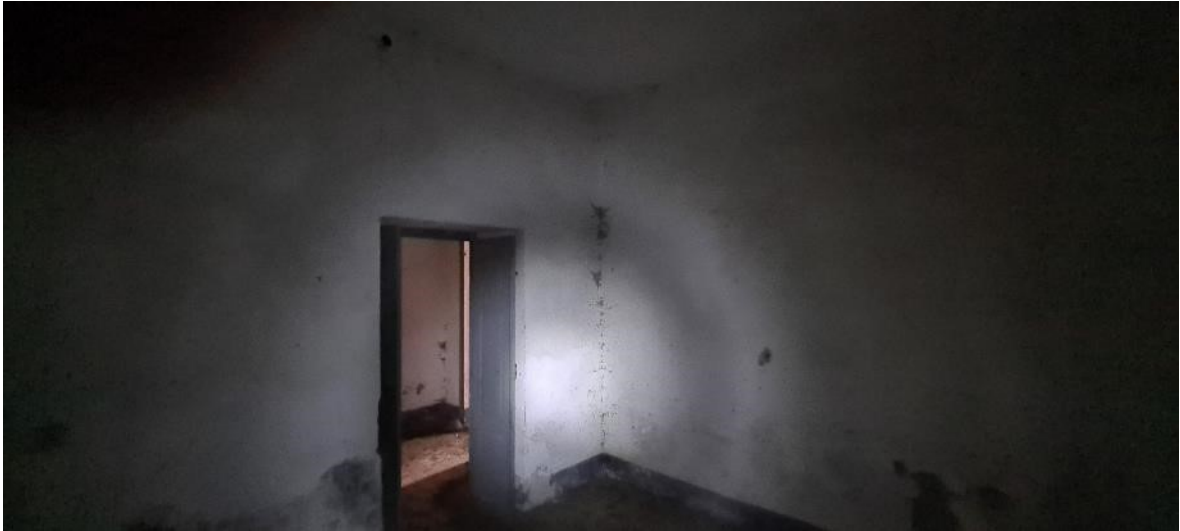
Camera n. 3 lato sinistro