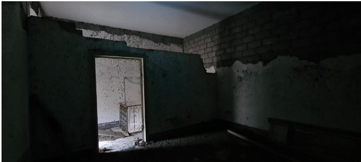
Camera piano primo – lato sinistro, prospetto anteriore