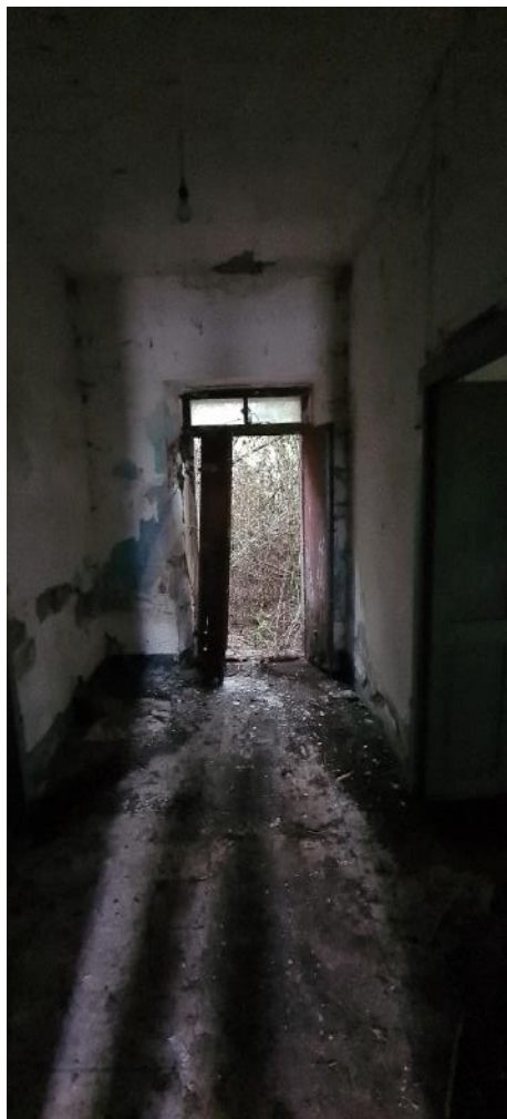
Disimpegno n. 2 – vista accesso cortile