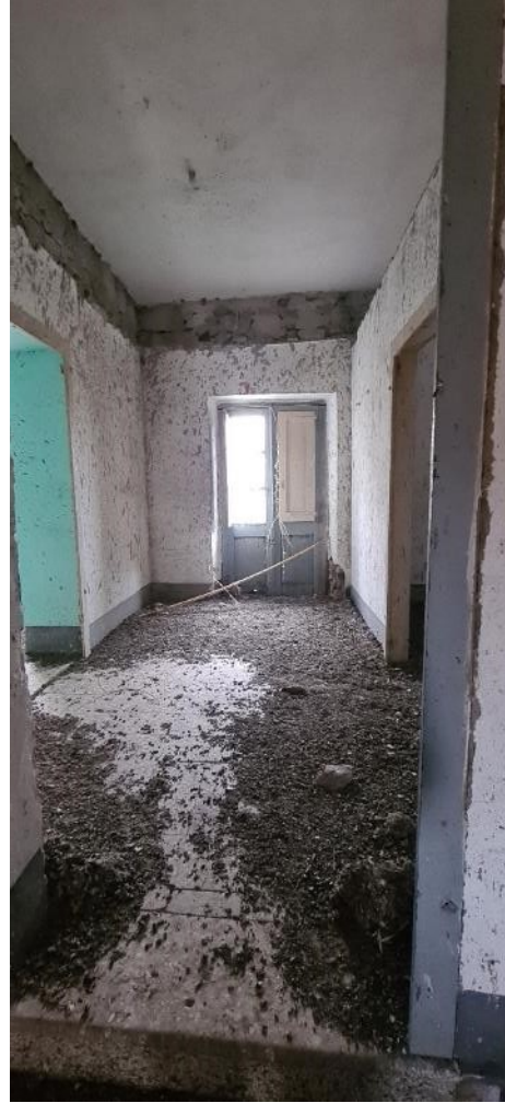
Disimpegno piano primo – lato posteriore