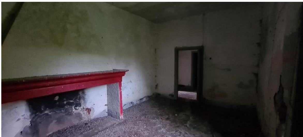
Locale cucina camera n. 2 lato destro