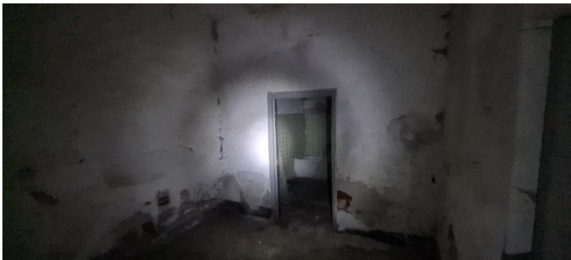
Camera n. 3 lato sinistro – ingresso bagno