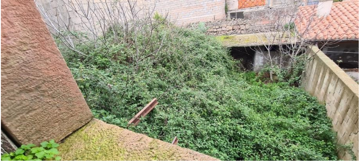
Cortile posteriore e tettoia-corpo accessorio