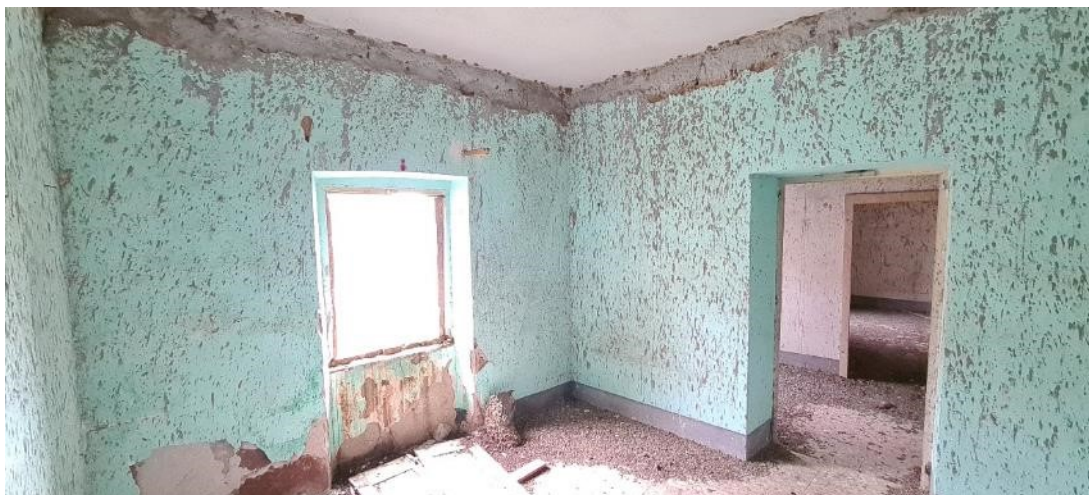
Camera piano primo – lato sinistro, prospetto posteriore