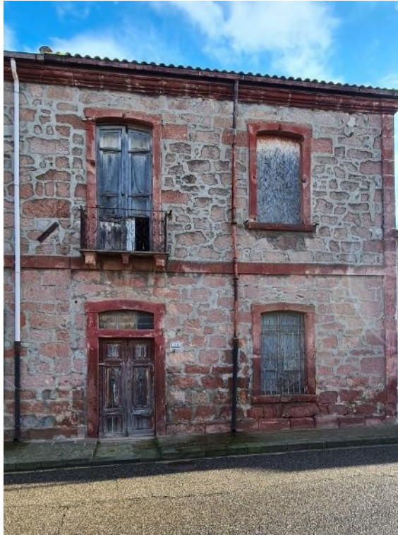
Prospetto anteriore - via Nazario Sauro n. 25