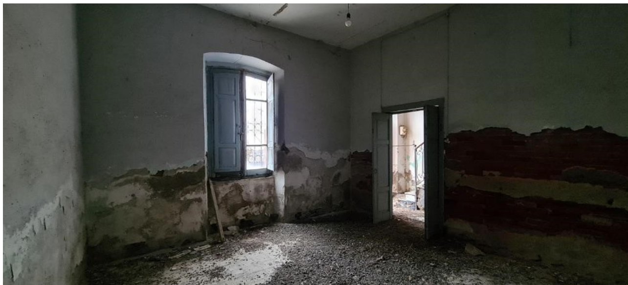
Camera n. 1 – lato destro