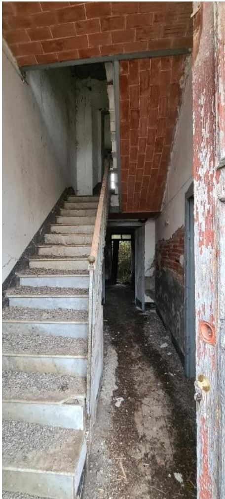
Ingresso – Disimpegno – Vano scala