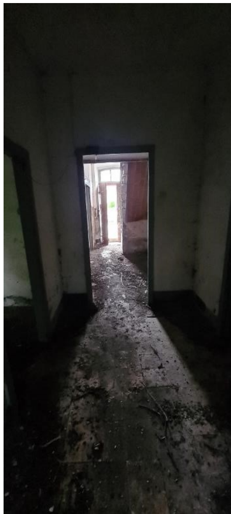
Disimpegni 1 – 2 vista acceso via N. Sauro