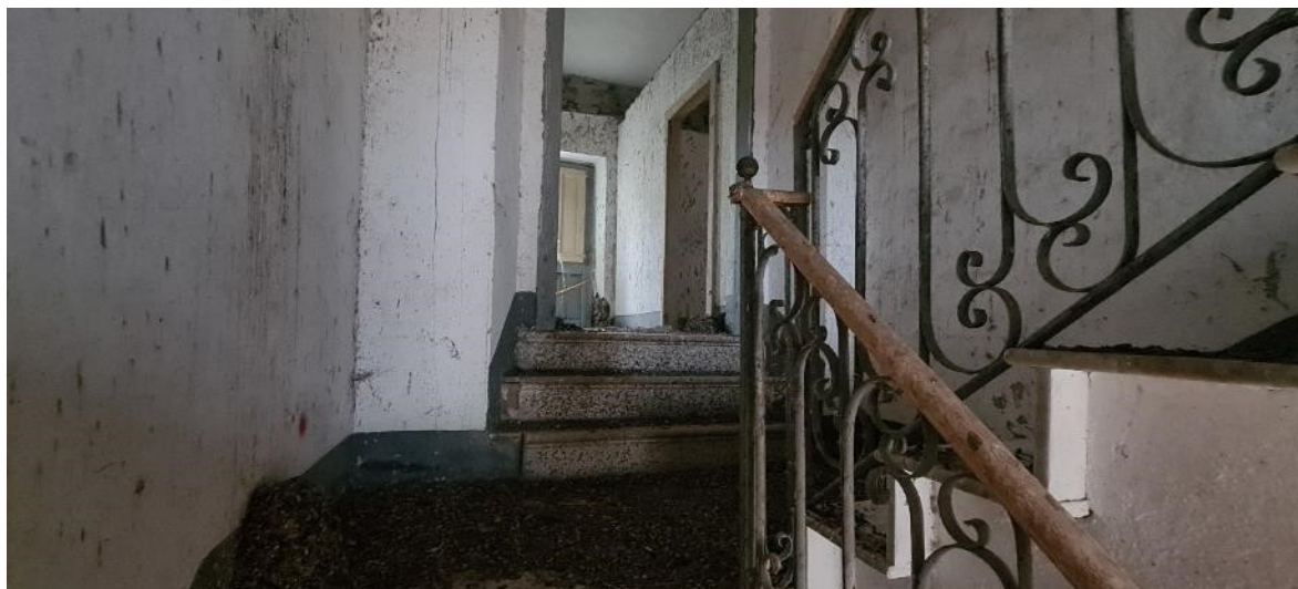
Accesso camere piano primo – livelli sfalsati