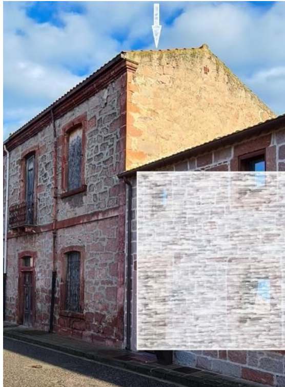
Prospetto laterale - via Nazario Sauro n. 25