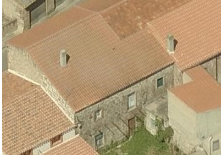
Prospetto posteriore