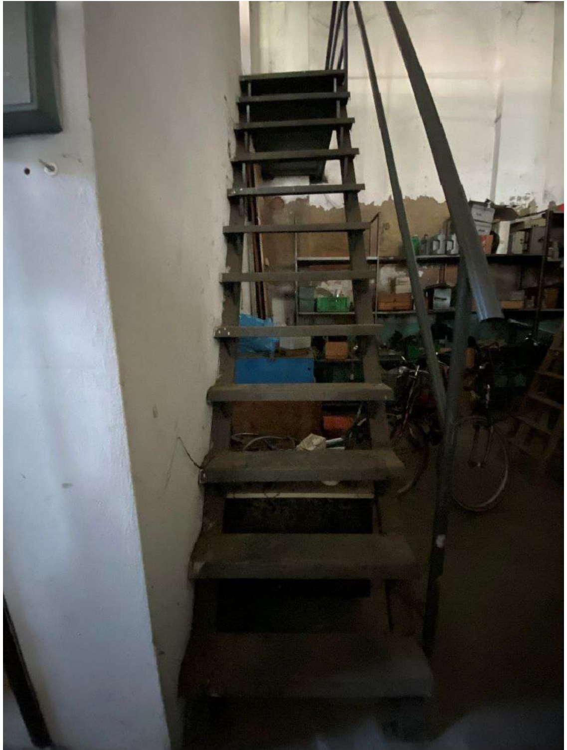
Vista della scala, realizzata senza titolo, che conduce allo spazio sopra l'ufficio, l'antibagno e il bagno