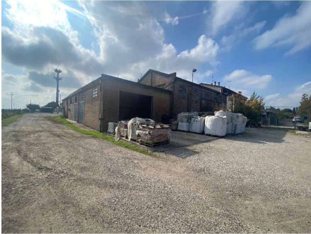
Vista della strada sterrata che parte da via Savena Vecchia E che termina in prossimità del lotto pignorato, dove si scorge l'entrata dell'autorimessa, una parte dell'area cortiliva e del l'accesso del laboratorio sul fronte nord