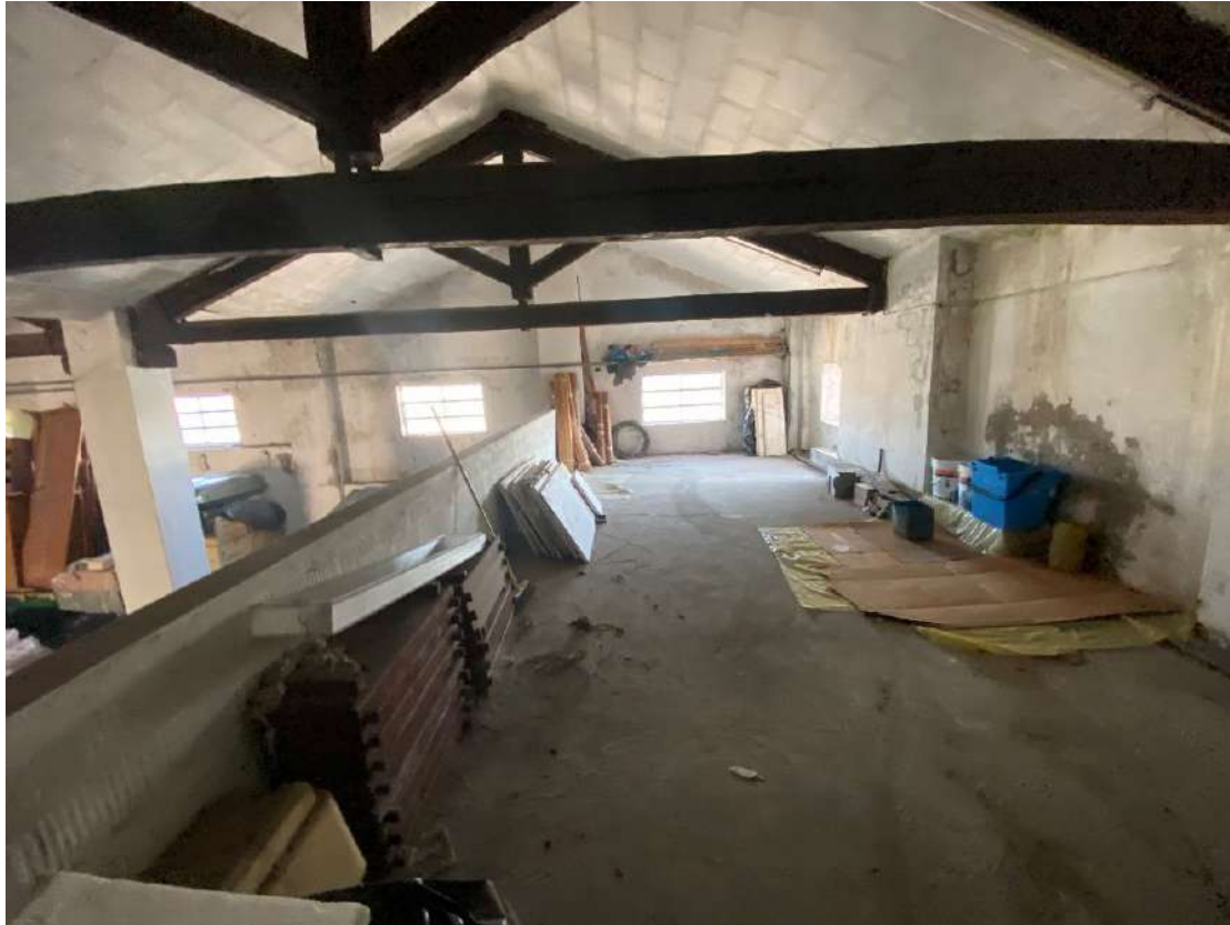
Vista dello spazio, fruibile dalla scala metallica, senza titolo, presente sopra l'ufficio, l'antibagno e il bagno