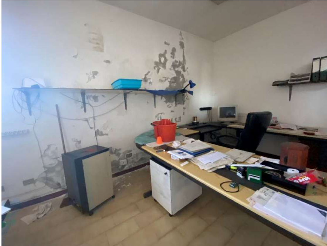
Viste della zona ufficio, che si trova internamente all'ampio spazio destinato a laboratorio