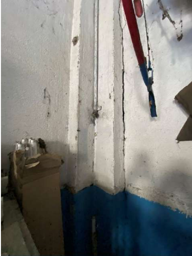
Viste delle lesioni strutturali presenti, in particolare nella parete nord/ovest del fabbricato destinato a laboratorio