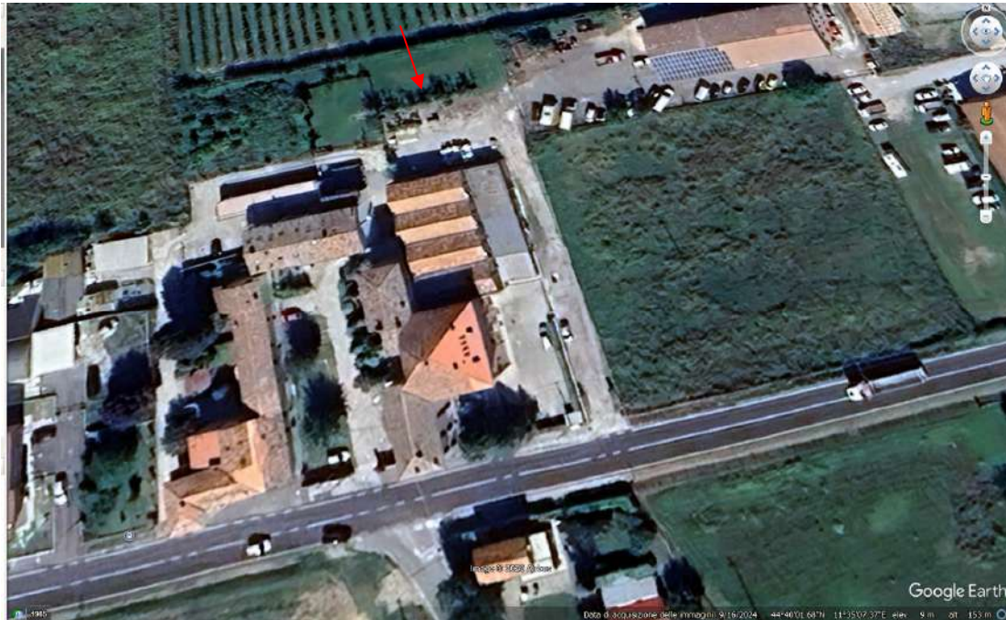
Vista aerea della zona

ES RG N.64/25- LOTTO UNICO - UNITA' IMMOBILIARI (LABORATORIO, AUTORIMESSA, AREE CORTILIVE E AREE URBANE), PORZIONI DI EDIFICIO UBICATE NEL COMUNE DI BARICELLA (BO), LOCALITA' SAN GABRIELE, VIA VECCHIA SAVENA N.559