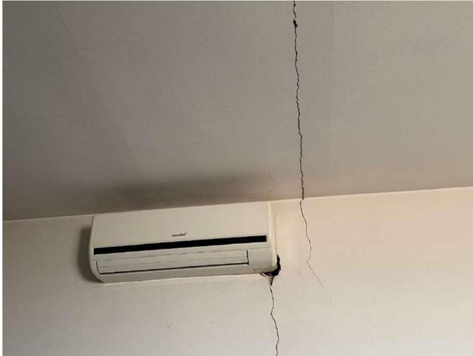
Viste delle lesioni strutturali presenti in parete e nel solaio di copertura dell'ambiente destinato ad ufficio