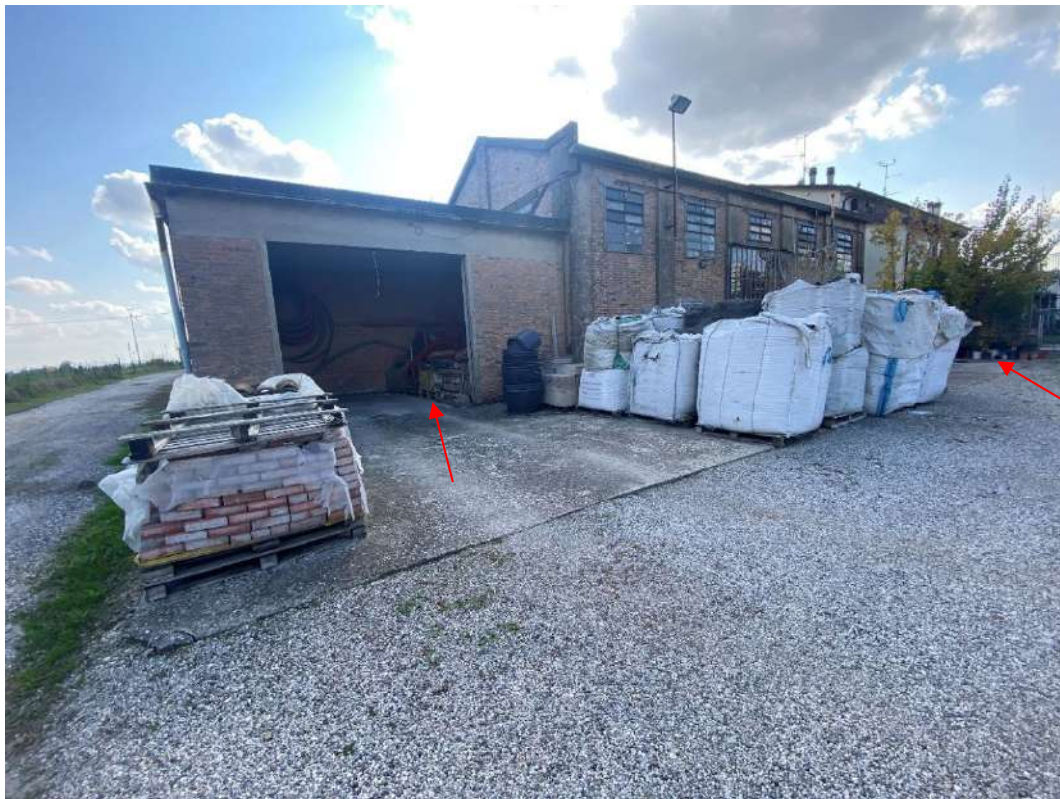
Vista di una porzione del lotto pignorato, dove si scorge l'entrata dell'autorimessa, una parte dell'area cortiliva e del l'accesso del laboratorio sul fronte nord