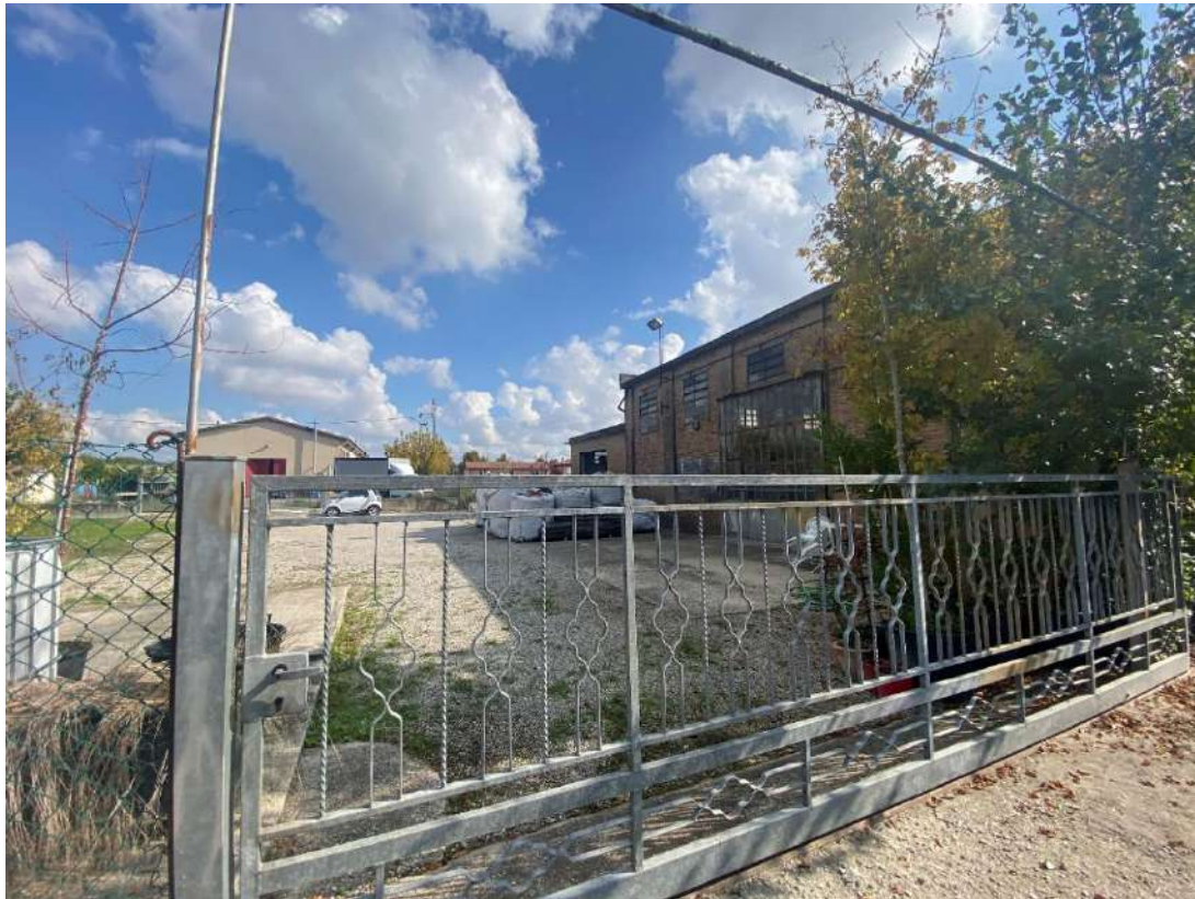
Vista di una porzione del fabbricato pignorato destinata a laboratorio, lato nord, e di una porzione dell'area cortiliva