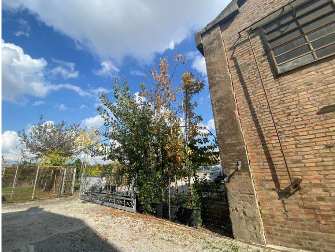
Altra vista di una porzione del fabbricato pignorato destinata a laboratorio, lato ovest, e di una porzione dell'area cortiliva destinata al passaggio dei fabbricati residenziali circostanti