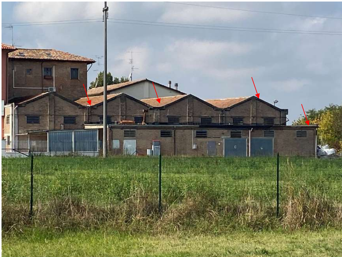
Vista dalla direttrice est di via Savena Vecchia a Baricella (BO) porzione di fabbricato pignorata