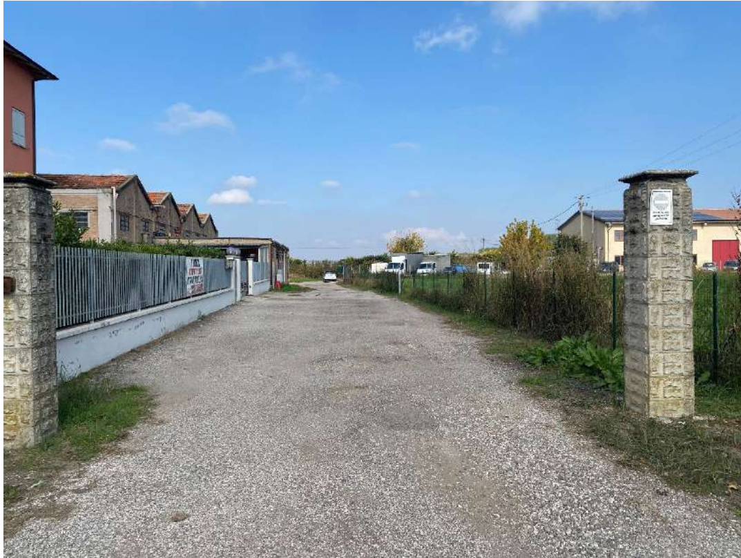
Vista della strada sterrata che conduce da via Savena Vecchia, località San Gabriele Baricella (BO), al lotto pignorato