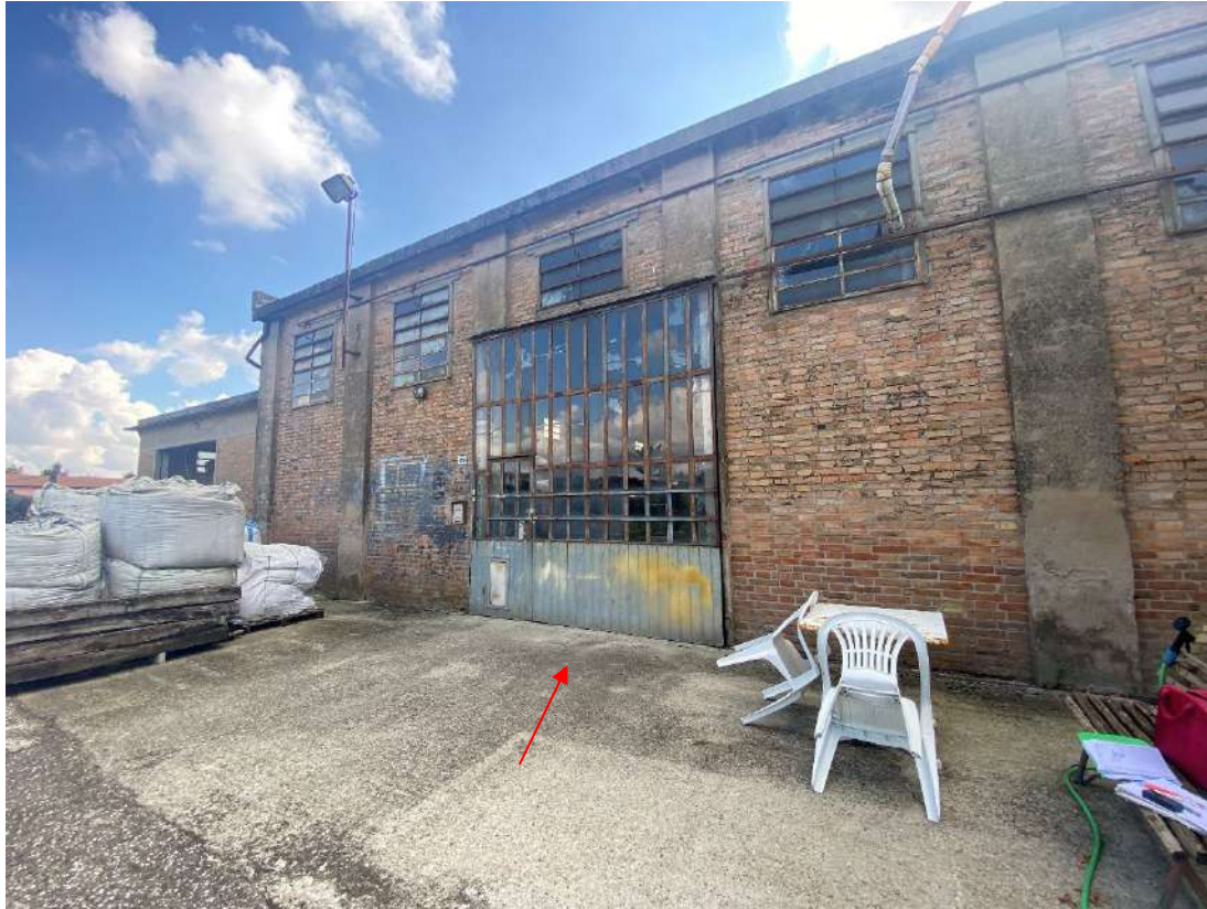
Vista di una porzione del fabbricato, entrata lato nord del laboratorio, e dell'area cortiliva coperta da una gettata in cemento