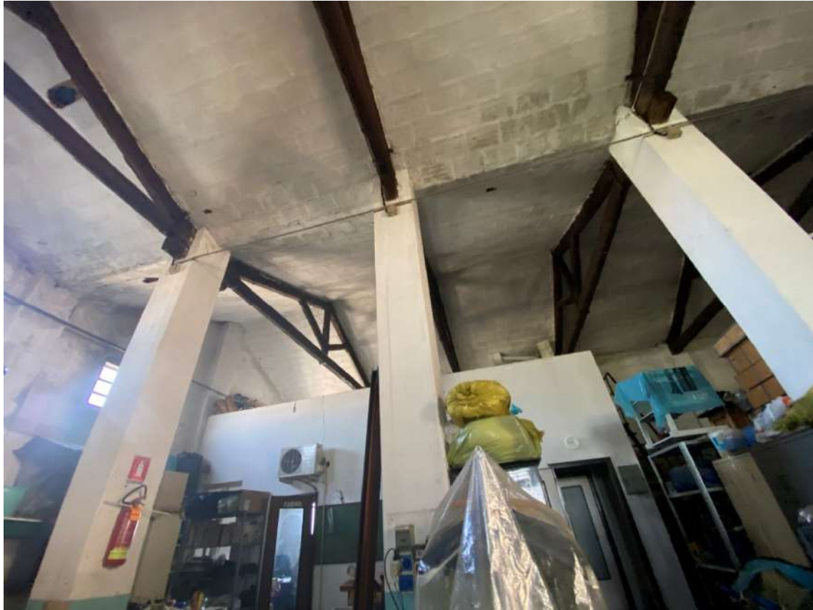
Viste interne del laboratorio/rimessaggio attrezzi caratterizzato un ampio ambiente intervallato da pilastri