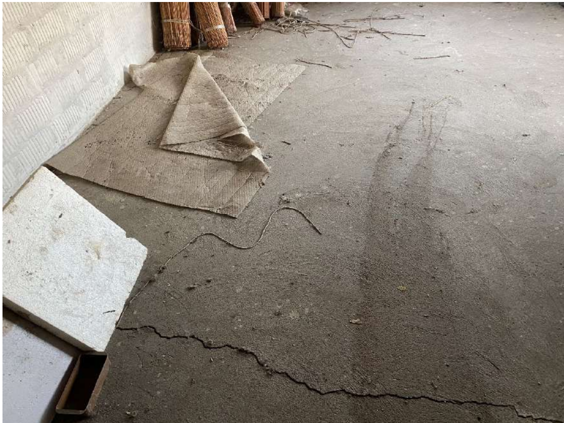
Vista delle lesioni strutturali presenti nello spazio sopra l'ufficio, l'antibagno e il bagno