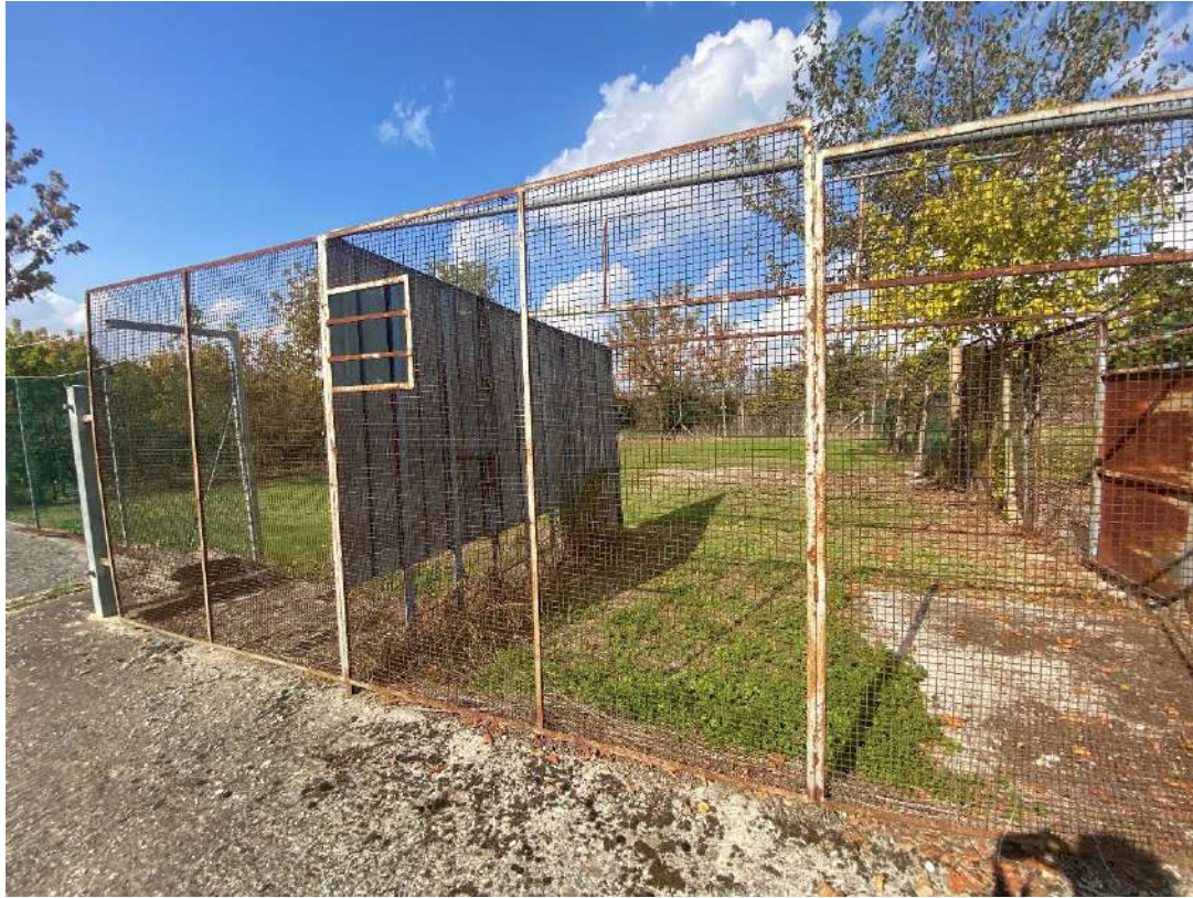
Viste di una porzione dell'area cortiliva e dell'area urbana ubicate sul fronte nord del fabbricato pignorato