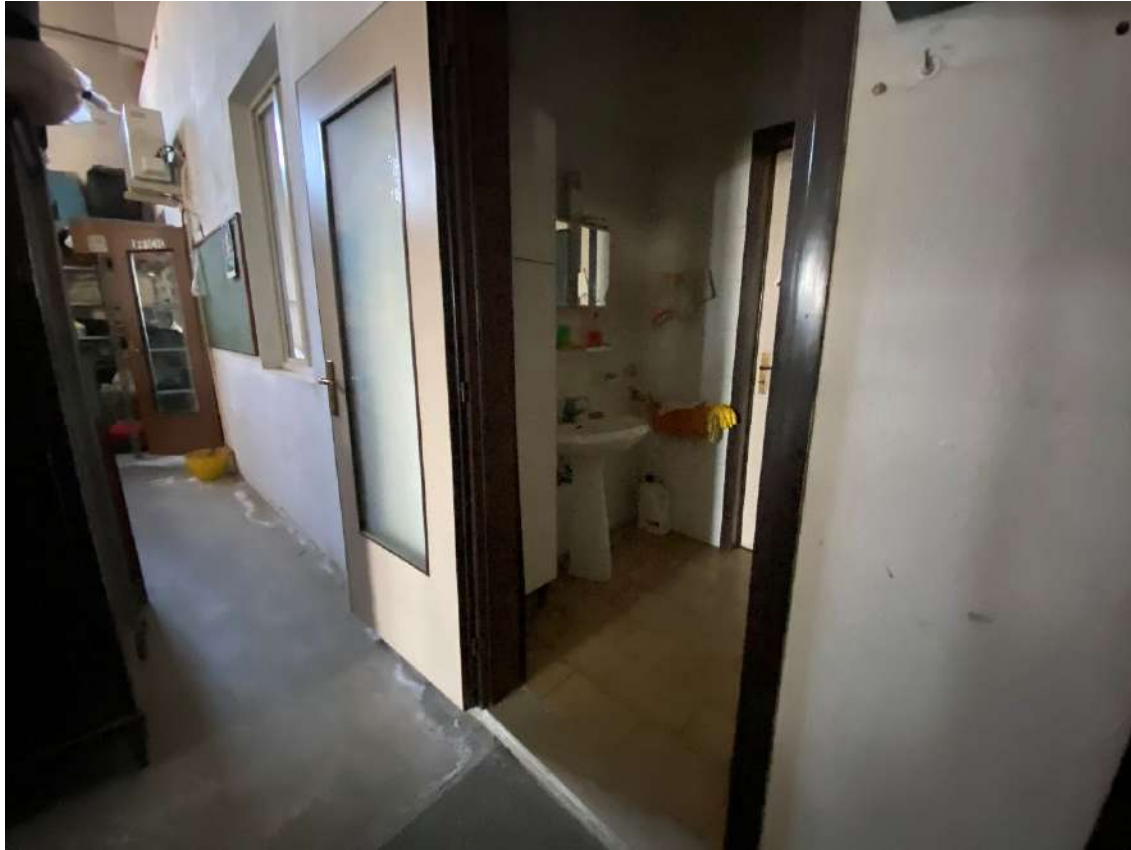
Vista dell'antibagno e del bagno adiacente all'ambiente destinato ad ufficio