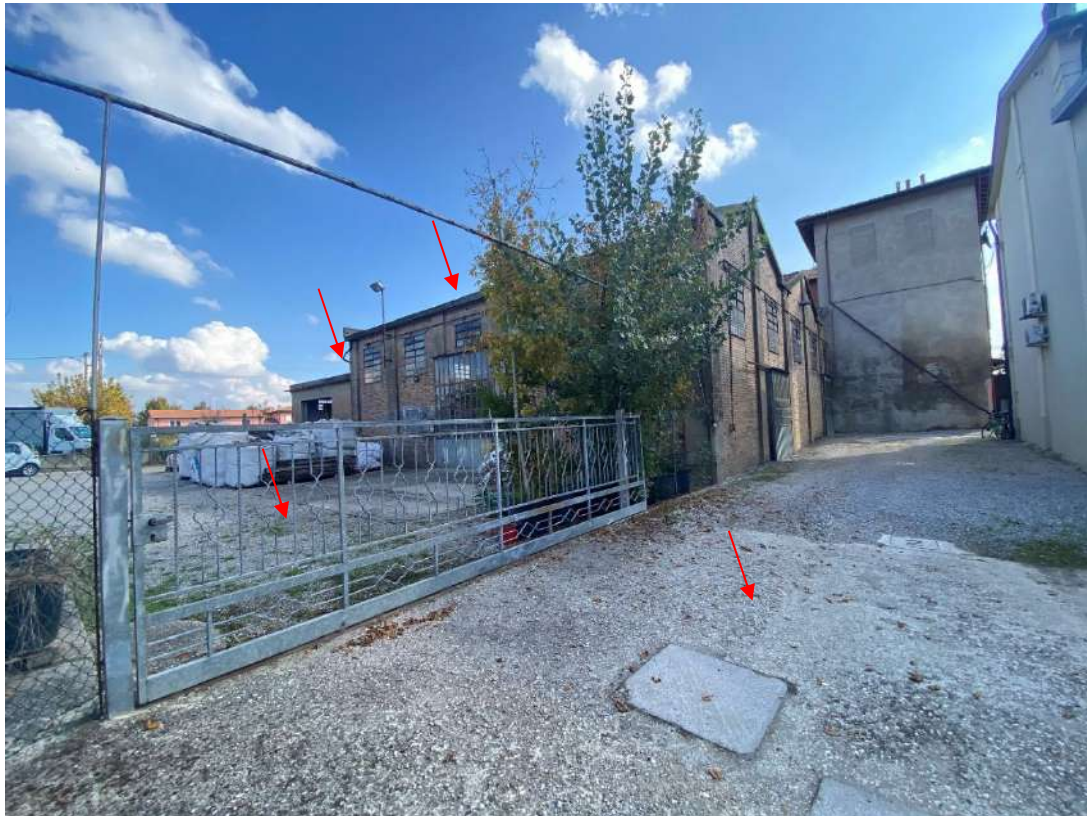
Vista della porzione di fabbricato pignorato e di una porzione dell'area cortiliva, in particolare il lato ovest dell'area cortiliva è interessato da una servitù di passaggio con i fabbricati residenziali vicini