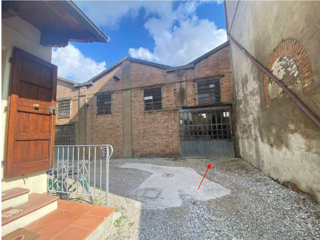
Viste di una porzione del fabbricato pignorato, entrate lato ovest, e di una porzione dell'area cortiliva destinata anche al passaggio dei fabbricati residenziali circostanti