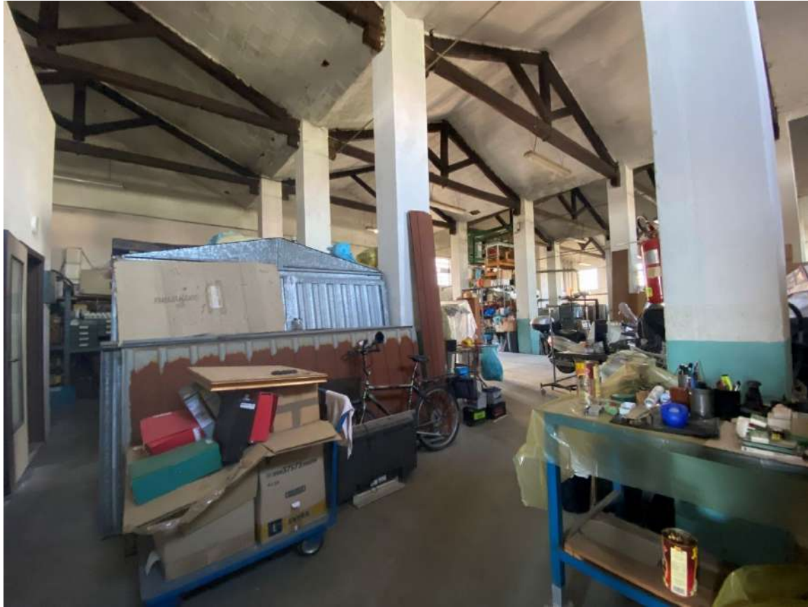
Viste interne del laboratorio/rimessaggio attrezzi caratterizzato un ampio ambiente