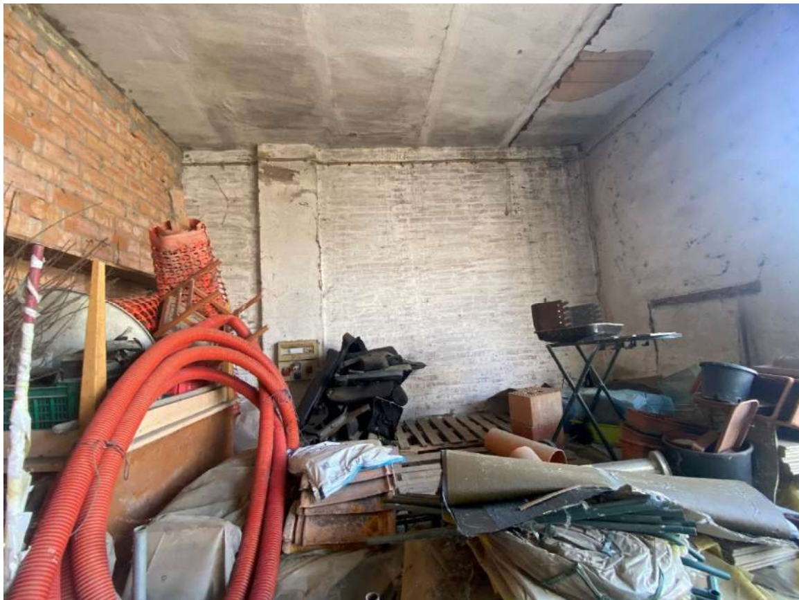
Vista interna dell'autorimessa