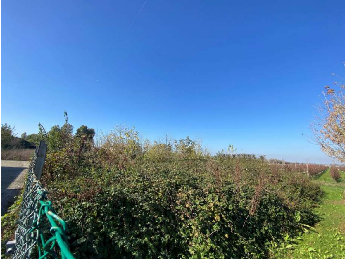
Vista di una porzione dell'area urbana pignorata, contraddistinta dal foglio 16 mappale 33, sub. 38