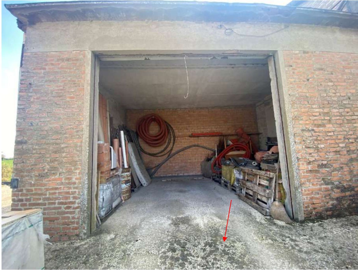
Vista dell'accesso dell'autorimessa composta da un unico vano e dell'area cementata davanti