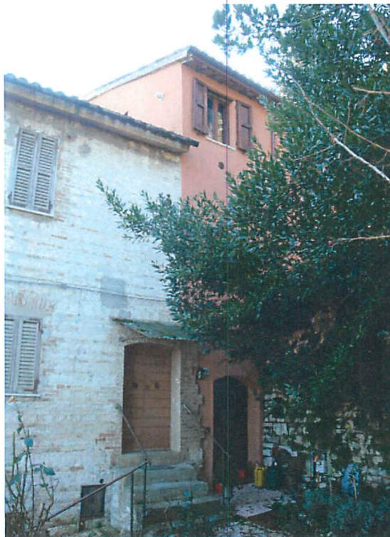
Foto 14. Fronte fabbricato