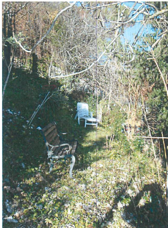
Foto 22. Area scoperta esclusiva: zona prospiciente il secondo piano