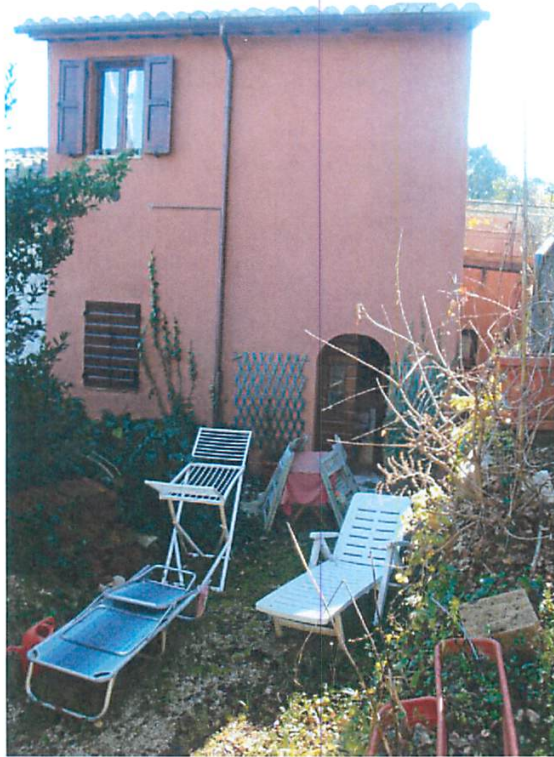
Foto 15. Lato destro fabbricato