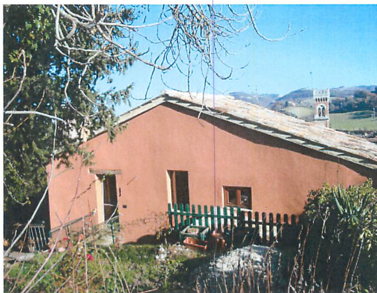
Foto 17. Retro fabbricato