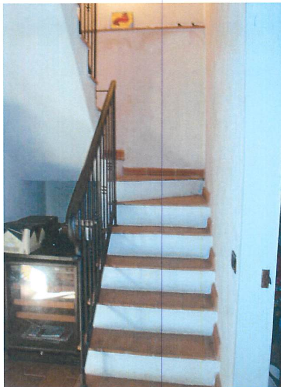
Foto 3. Piano terra - scala interna