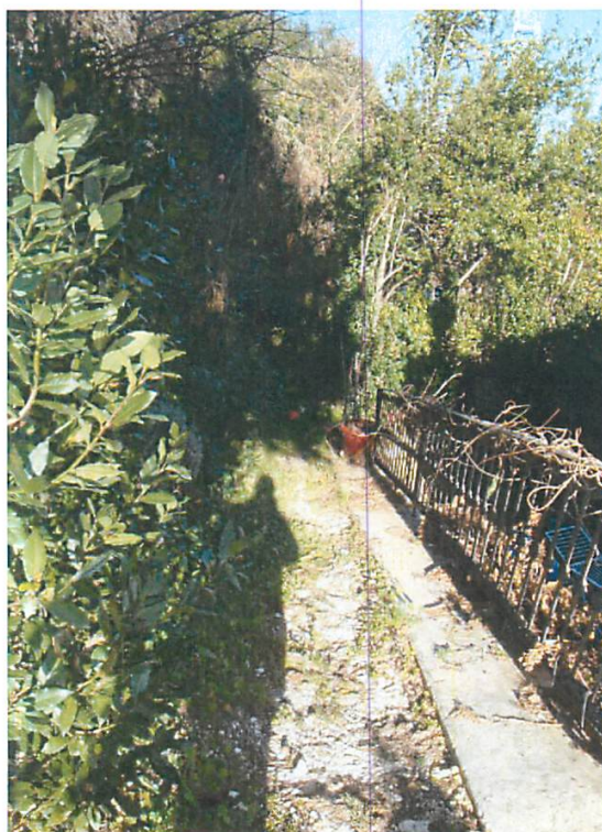
Foto 20. Area scoperta esclusiva: percorso di collegamento tra la zona prospiciente il primo piano ed il secondo