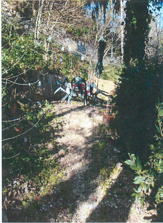
Foto 21. Area scoperta esclusiva: zona prospiciente il secondo piano