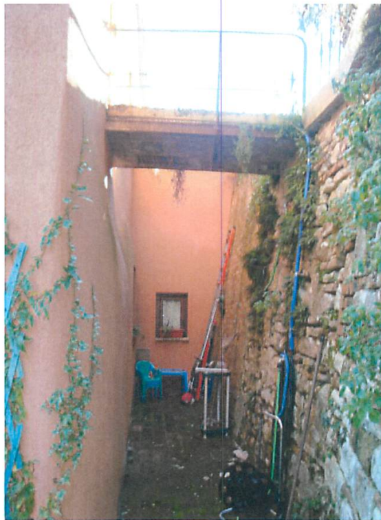
Foto 16. Lato destro fabbricato - parete wc annesso alla camera da letto nr. 2