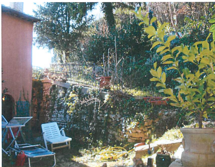
Foto 19. Area scoperta esclusiva: zona prospiciente il primo piano