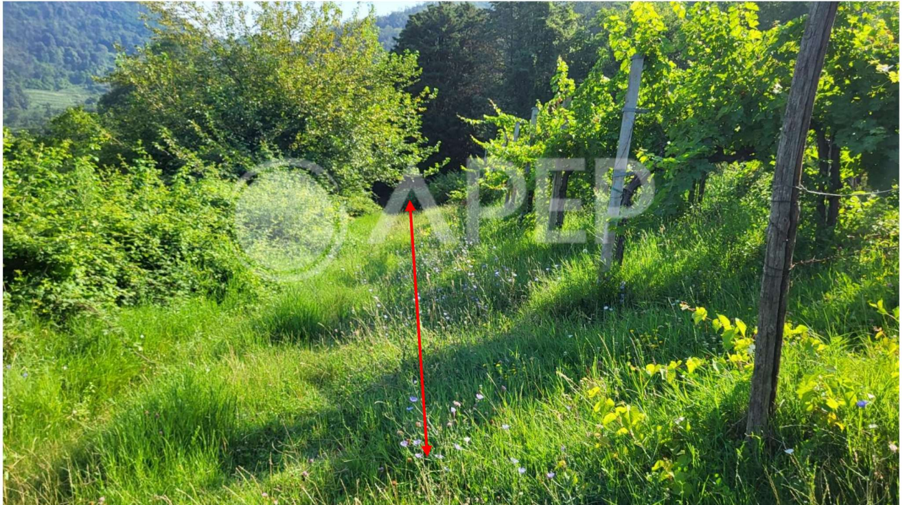
FOTO N .3 - PERCORSO AI TERRENI