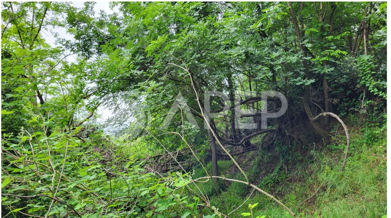
FOTO N .4 - INTERRUZIONE PER SMOTTAMENTI DEL PERCORSO