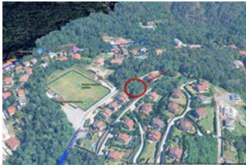
Panoramica Lotto 2

I beni sono ubicati in zona di espansione in un'area residenziale, le zone limitrofe si trovano in un'area sportiva. Il traffico nella zona è limitato (zona traffico limitato), i parcheggi sono sufficienti. Sono inoltre presenti i servizi di urbanizzazione primaria e secondaria.