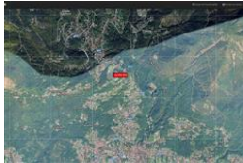
Immagine aerea Lotto 2