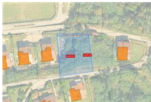
Sovrapposizione catastale Lotto 2