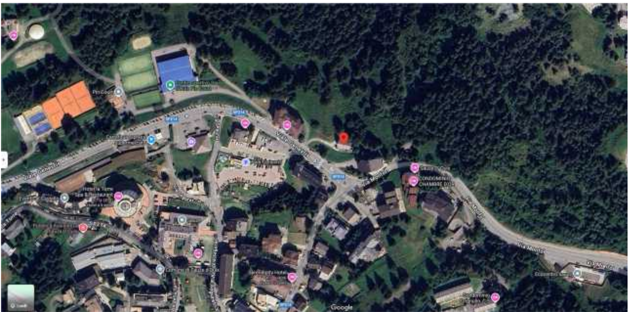
Estratto Satellitare Ravvicinato Viale Genevris n. 2