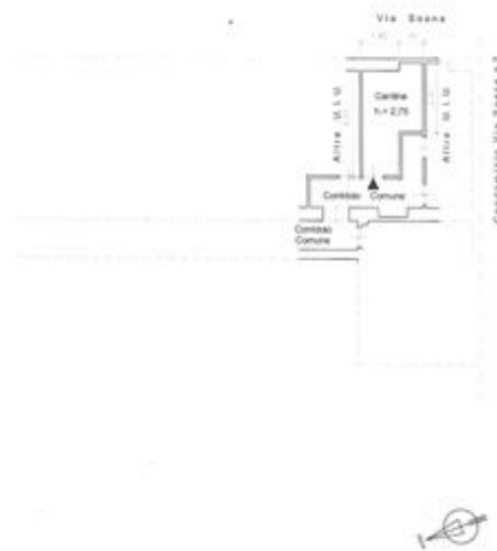
Planimetria cantina piano sotterraneo