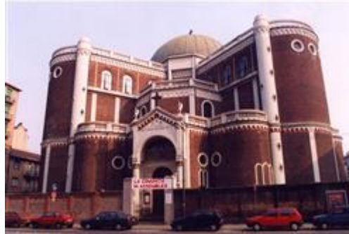
Parrocchia Maria Regina della Pace

trovano in un'area mista residenziale/commerciale. Il traffico nella zona è scorrevole, i parcheggi sono sufficienti. Sono inoltre presenti i servizi di urbanizzazione primaria e secondaria, i seguenti servizi ad alta tecnologia: Ospedale San Giovanni Bosco, le seguenti attrazioni storico paesaggistiche: Parrocchia Maria Regina della Pace.