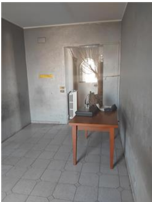
Veduta interno tinello