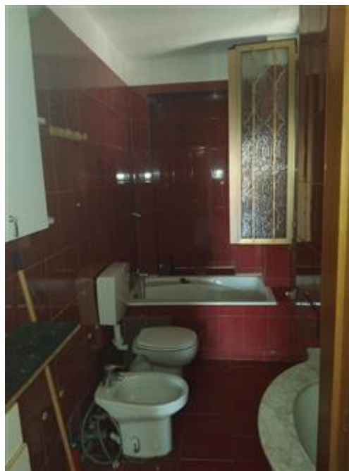
Veduta interno servizio igienico