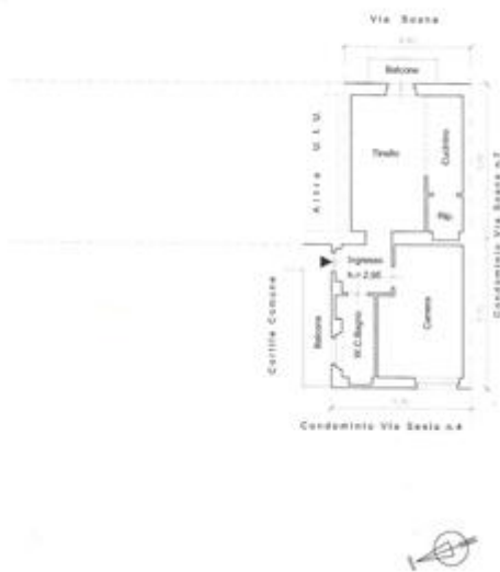
Planimetria appartamento piano terzo