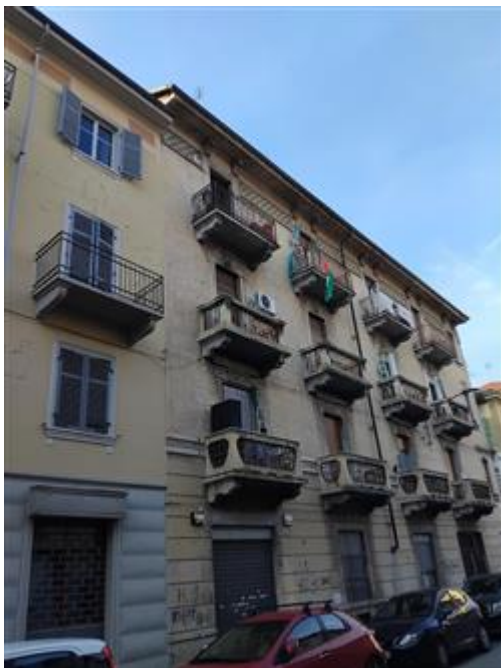
Veduta prospetto sud-est (su via Soana) del condominio

L'intero edificio sviluppa cinque piano, quattro piano fuori terra, uno piano interrato. Immobile costruito nel 1900 ristrutturato nel 1927.