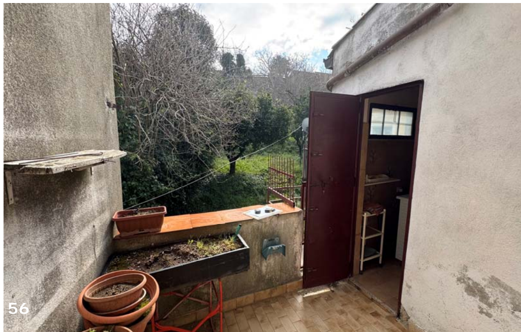
Foto 56 e 57: esterni dell'unità immobiliare (bene immobile n. 1); veranda retro del fabbricato.