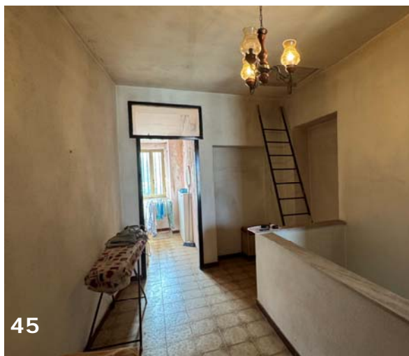
Foto 44 e 45: interni dell'unità immobiliare (bene immobile n. 1); ballatoio disimpegno piano secondo.