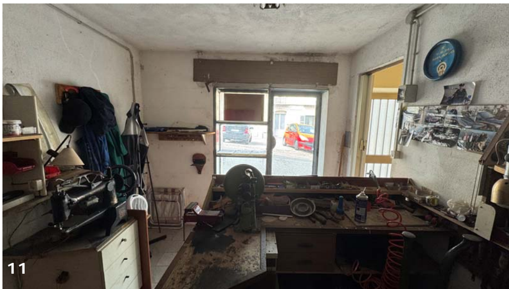
Foto 11: bene immobile n. 1: vista verso ingresso da fronte strada e da accesso laterale da disimpegno comune.