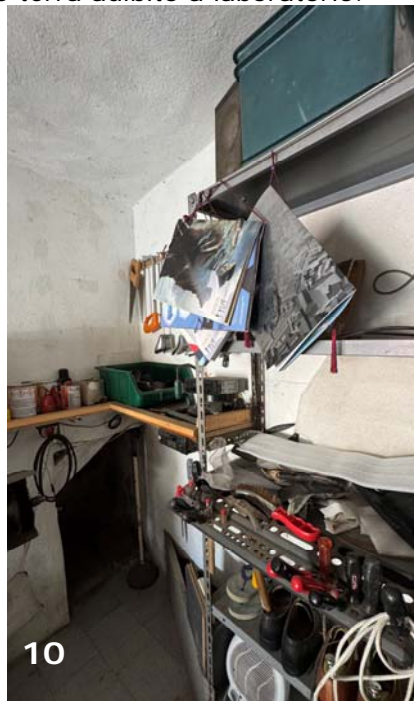
Foto 9 e 10: bene immobile n. 1: viste globali del vano al piano terra adibito a laboratorio.