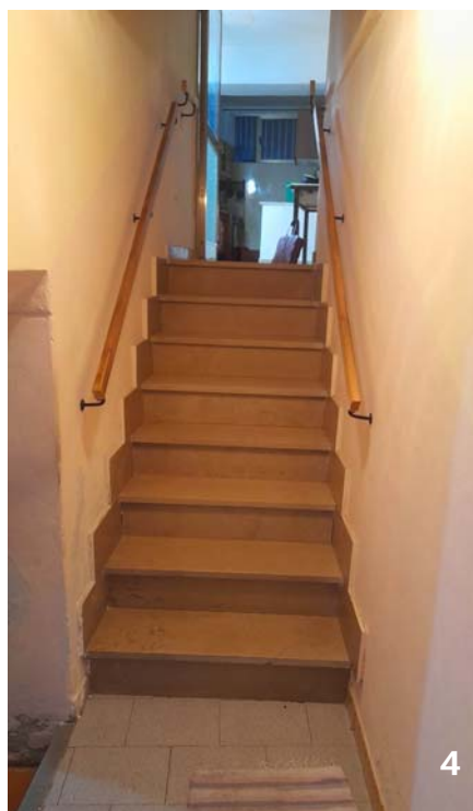
Foto 3 e 4: beni immobili nn. 1 e 2: ingresso comune sul fronte del fabbricato; ingresso ad entrambi gli immobili da rampa di scale rettilinea.