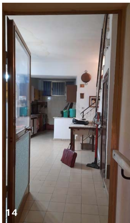
Foto 13, 14, 15 e 16: bene immobile n. 1; piano di sbarco rampa di scale accesso principale, vista sull'ampio vano al piano primo (soggiorno/pranzo e cucina rustica, rampa di accesso a stanzetta posta su interpiano piano primo).