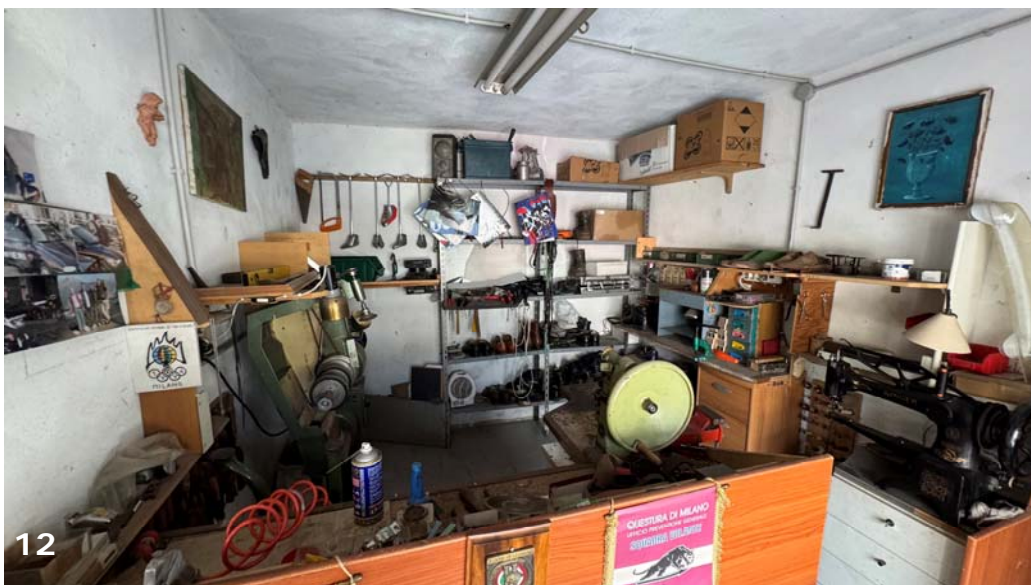
Foto 12: bene immobile n. 1: vista globale dello sviluppo del vano e relative attrezzature per attività di lavorazione pelli.