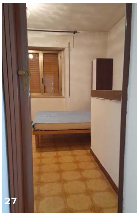
Foto 26 e 27: interni dell'unità immobiliare (bene immobile n. 1); cameretta posta nell'interpiano piano primo.