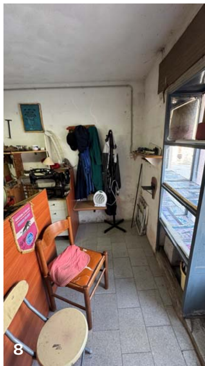
Foto 7 e 8: bene immobile n. 1: ingresso dal fronte strada (via Maestro Messina n. 42) e vista globale del vano al piano terra adibito a laboratorio.