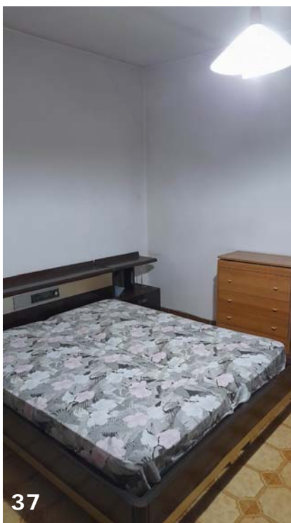
Foto 36, 37, 38 e 39: interni dell'unità immobiliare (bene immobile n. 1); porta di accesso al vano letto matrimoniale piano secondo – viste d'insieme e prospettiva su ballatoio disimpegno.