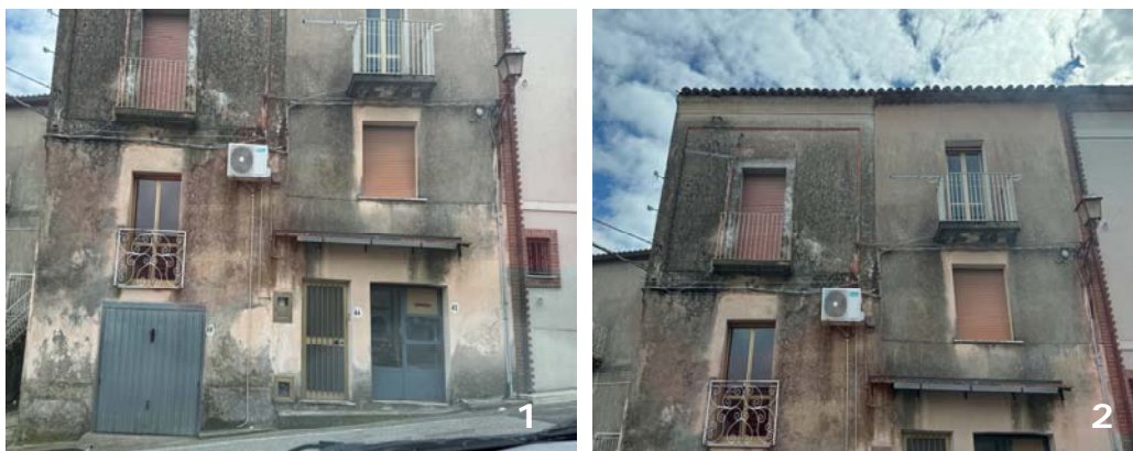
Foto 1 e 2: beni immobili nn. 1 e 2: fabbricato residenziale indipendente: vista d'insieme dalla strada principale di accesso (via Maestro Messina) - spazio antistante con piazzola di parcheggio esterna comunale.

Appendice IV: foto satellitare 3D del Comune di Cortale – lato fronte Ovest – con individuazione in rosso delle porzioni di fabbricato rispondenti ai due beni oggetto della procedura esecutiva.