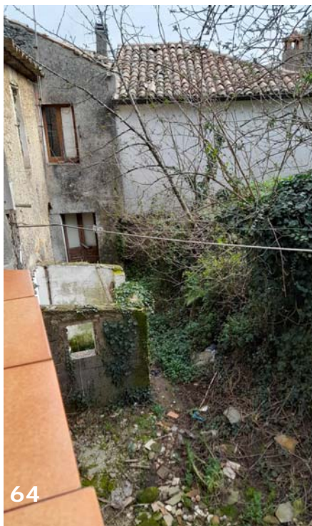
Foto 61, 62, 63 e 64: esterni dell'unità immobiliare (bene immobile n. 1); veranda retro del fabbricato – dettagli e rifiniture e prospettive su piccola area verde retrostante al fabbricato.