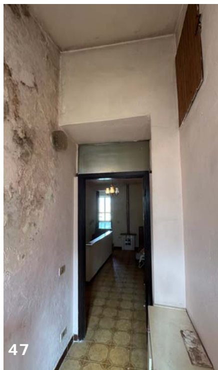
Foto 46 e 47: interni dell'unità immobiliare (bene immobile n. 1); vista ingresso vano accessorio piano secondo e disimpegno.