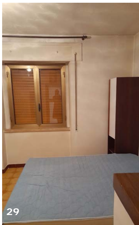
Foto 28 e 29: interni dell'unità immobiliare (bene immobile n. 1); cameretta inter piano – viste generali.