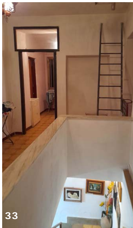
Foto 32 e 33: interni dell'unità immobiliare (bene immobile n. 1); rampa accesso piano secondo e ballatoio di disimpegno.