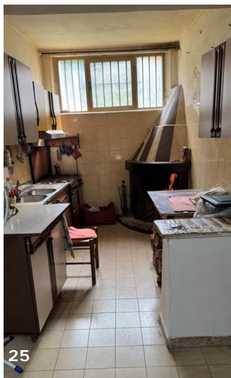
Foto 24 e 25: interni dell'unità immobiliare (bene immobile n. 1); vista della cucina rustica connessa e a vista del vano soggiorno/pranzo.