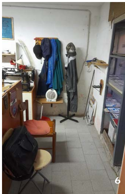
Foto 5 e 6: bene immobile n. 1: vano piano terra adibito a lavorazione di pellami e/o attività calzolaio.