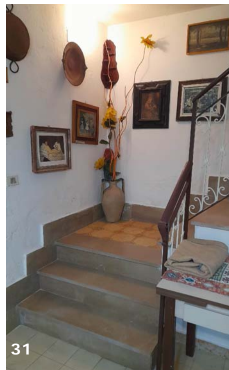
Foto 30 e 31: interni dell'unità immobiliare (bene immobile n. 1); rampa di scale di accesso al piano secondo.