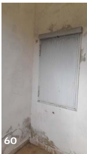
Foto 58, 59 e 60: esterni dell'unità immobiliare (bene immobile n. 1); veranda retro del fabbricato – dettagli piccola copertura parziale, rifiniture e dettaglio infisso in ferro verniciato proprietà Surianello su veranda.

arch. Sabrina Durante consulente tecnico d'ufficio Via Formiti n. 12 - 89046 Lamezia Terme (CZ) - studio: 0968 40 74 10 - mobile: 347 91 24 995 e.mail: sabrina.durante@archiworldpec.it - partita iva: 03050770795 - codice fiscale: DRN SRN 76E67 M208S