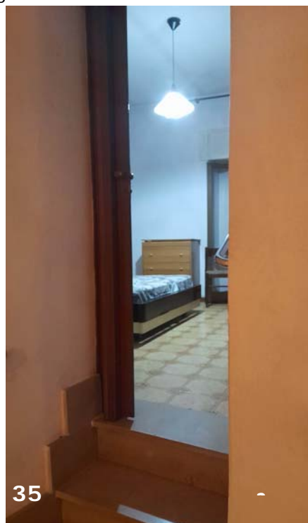
Foto 34 e 35: interni dell'unità immobiliare (bene immobile n. 1); ballatoio di disimpegno e vista su vano letto matrimoniale piano secondo.