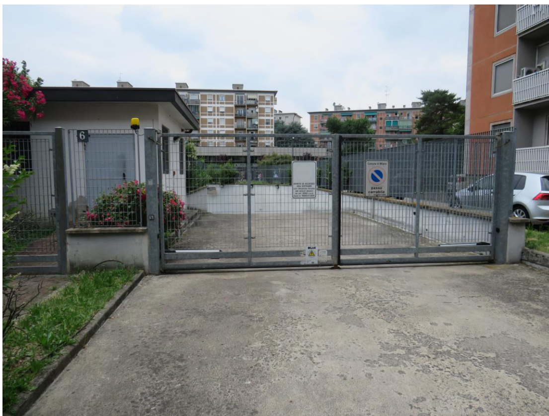
INGRESSO SU AREA DI DISIMPEGNO