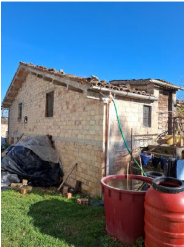
Annessi su altro fabbricato – Vista esterna