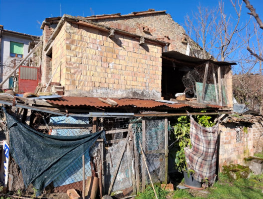
Annessi su altro fabbricato – Vista esterna