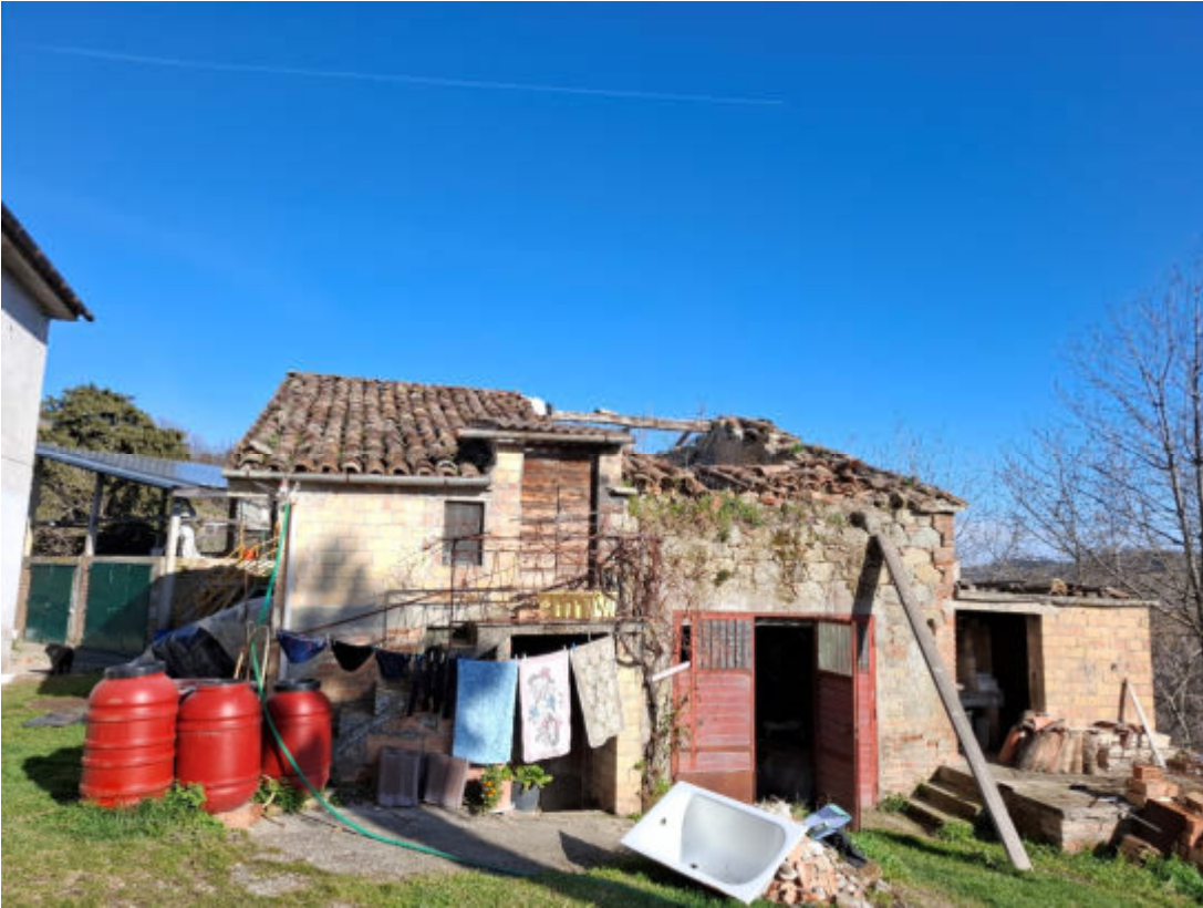
Annessi su altro fabbricato – Vista esterna