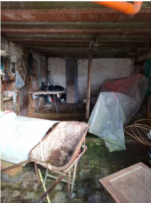
Locale deposito su annesso esterno