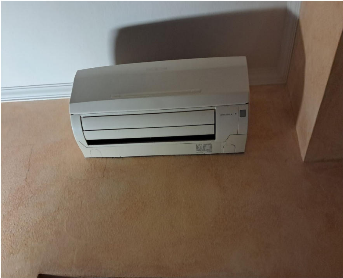
9 – Split dell’impianto di climatizzazione