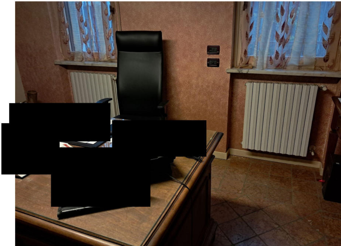
2 – Ufficio titolare