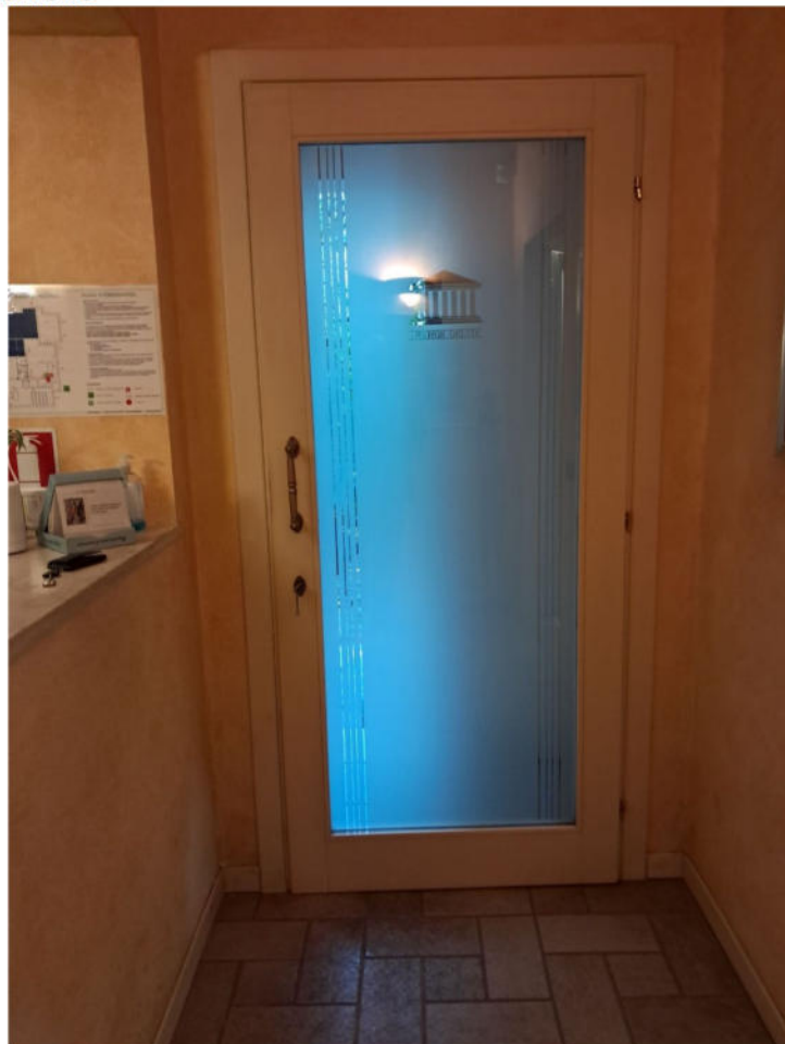
10 – Porta vetrata ingresso