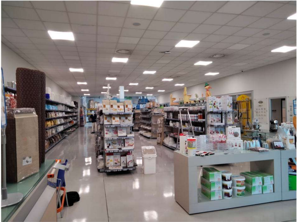
FOTO N. 5 - LOCALE ESPOSIZIONE/VENDITA