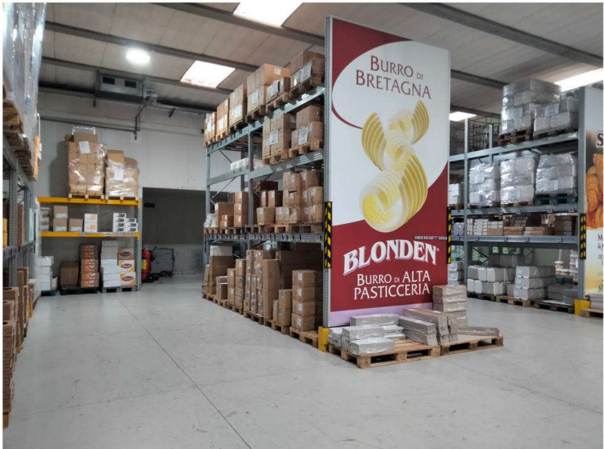
FOTO N. 6 - LOCALE ESPOSIZIONE/VENDITA