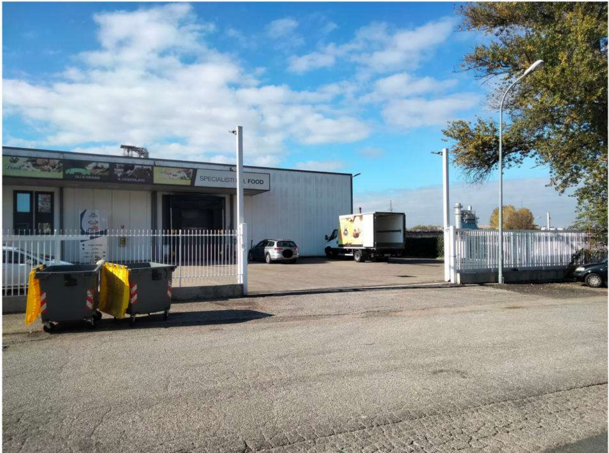
FOTO N. 2 - SECONDO ACCESSO CARRABILE