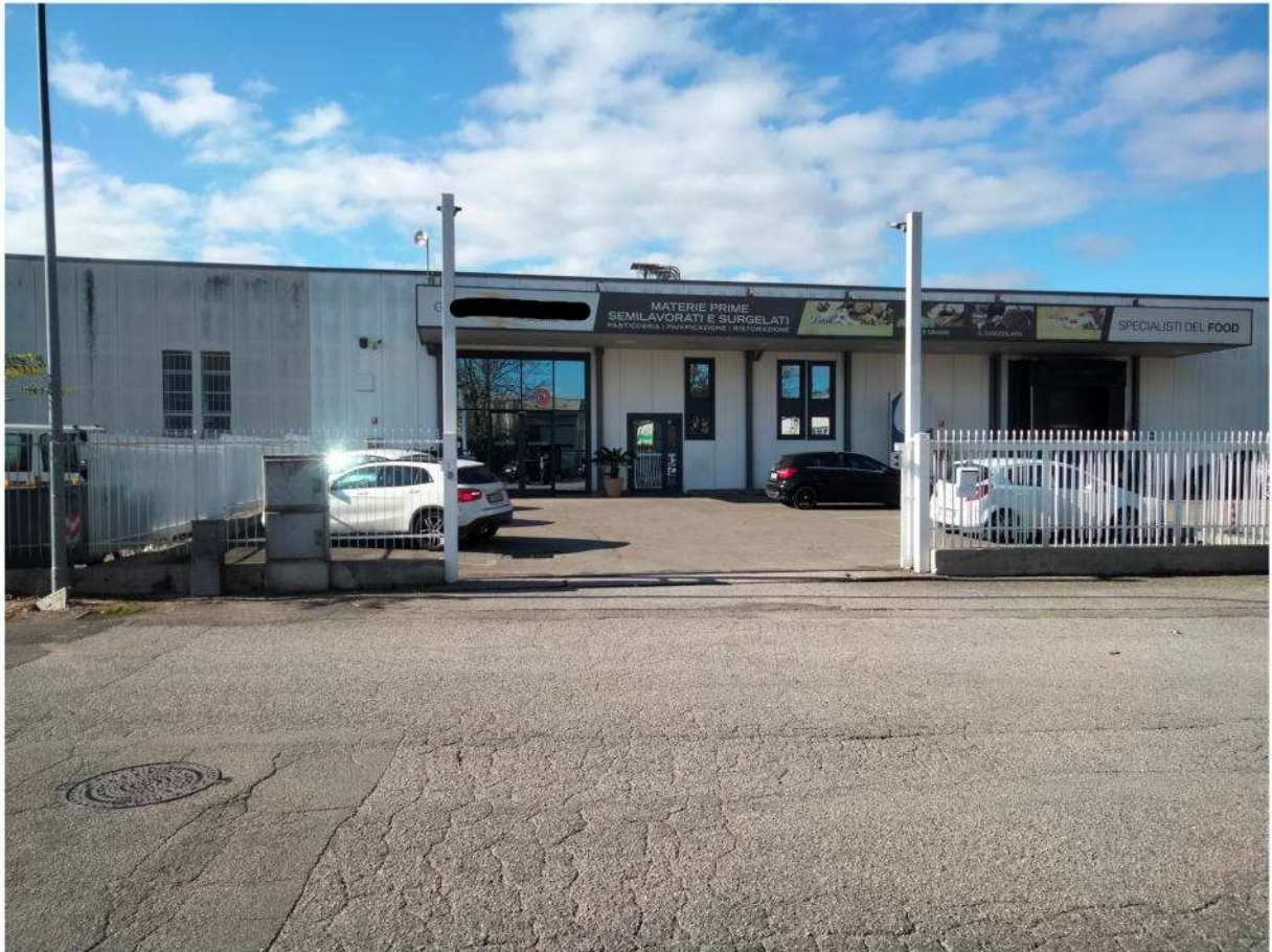
FOTO N. 1 - PRIMO ACCESSO CARRABILE