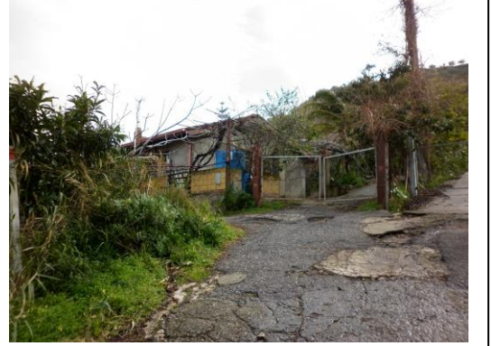
Fotografia: Lotto 7

La superficie commerciale del fabbricato è 180 mq.oltre area di pertinenza.