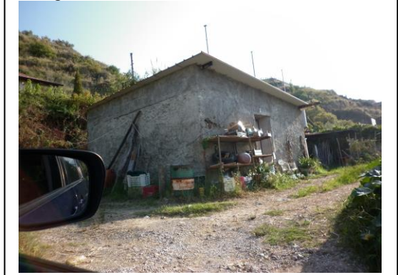
Fotografia: Lotto 8

Non è stata riscontrata la documentazione amministrativa e tecnica afferente agli impianti di cui al D.M. Ministro Sviluppo Economico del 22/01/2008 n. 37.