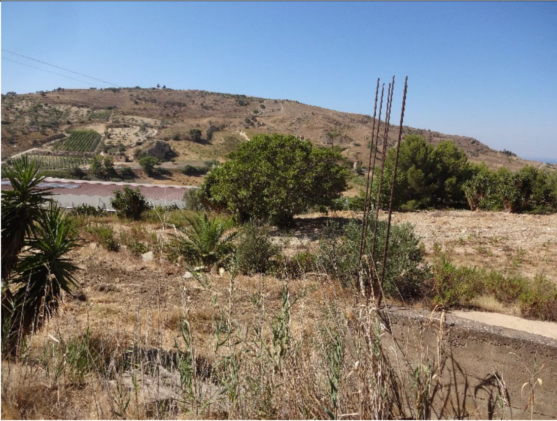
Foto 16-Particolare del terreno