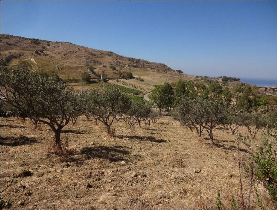
Foto 18-Particolare del terreno