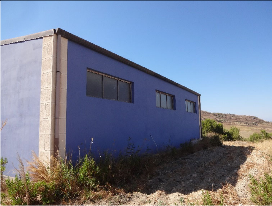
Foto 28-Prospetto posteriore