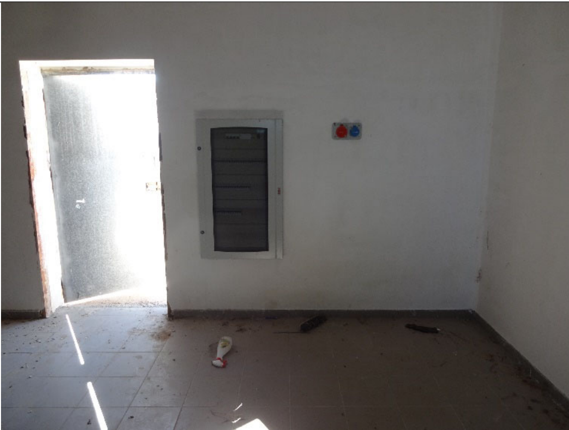
Foto 36-Particolare degli Interni