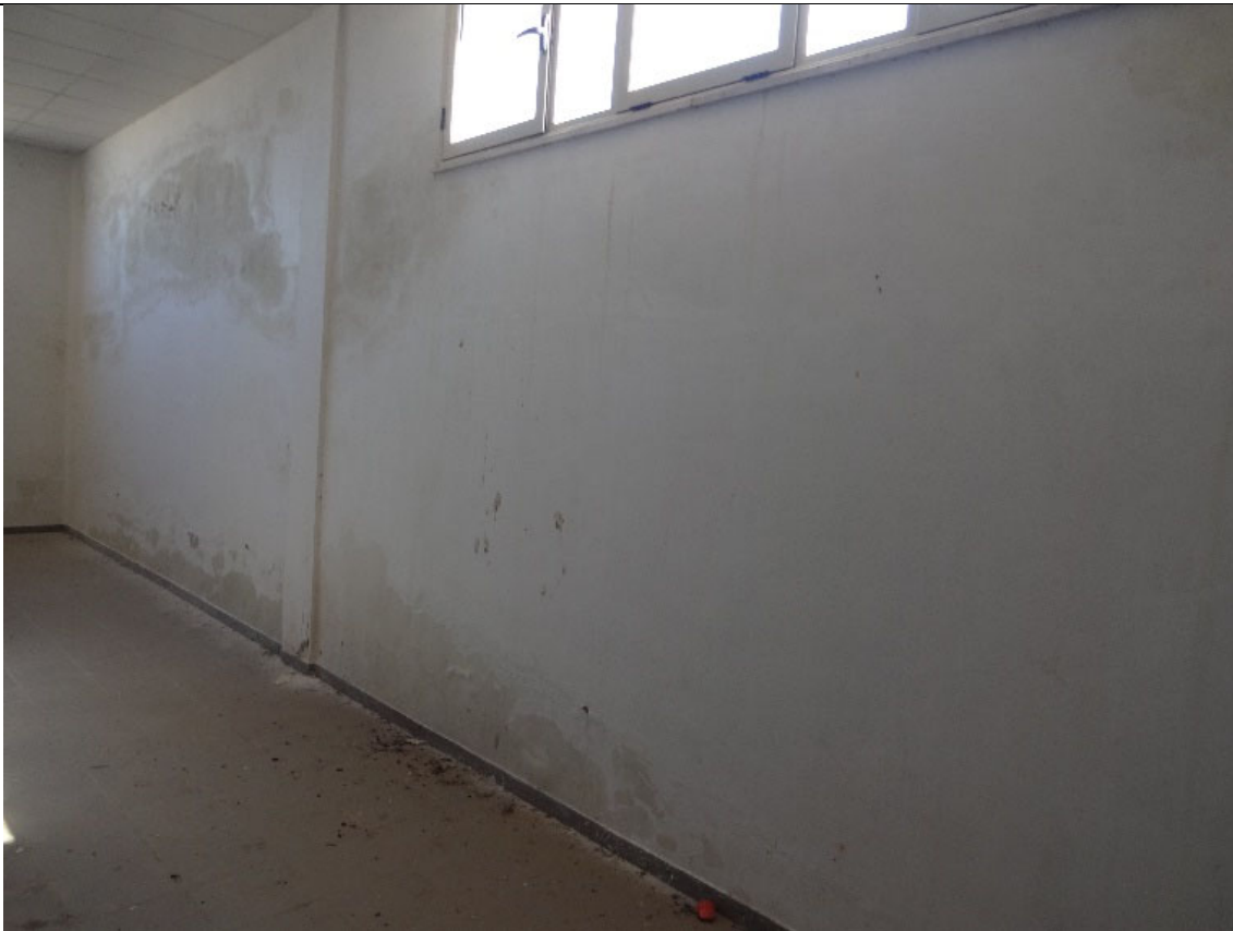
Foto 40-Particolare degli Interni (si noti la presenza di umidità)