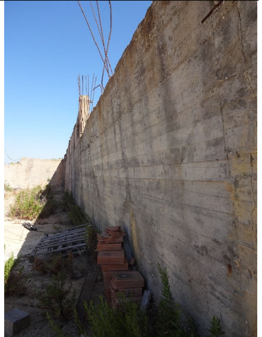
Foto 23-Muro in cemento armato a breve distanza dal fabbricato (notevolmente deformato dalla spinta del sovrastante terrapieno)