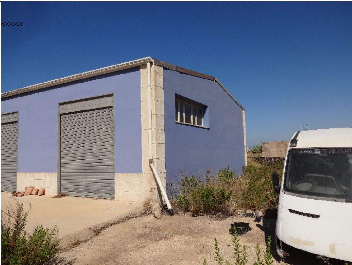
Foto 26-Particolare dei prospetti