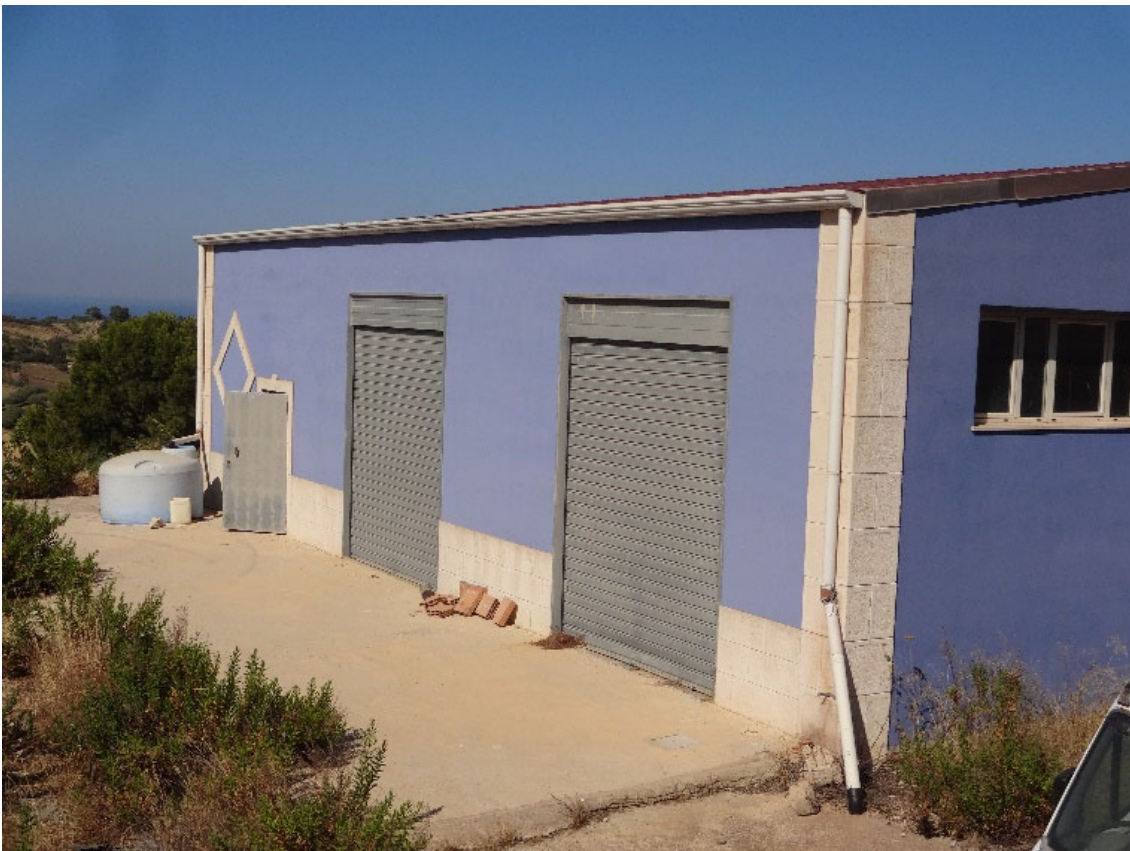
Foto 25-Particolare del prospetto principale