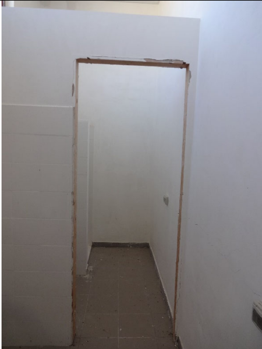
Foto 44-Interni del servizio Igienico