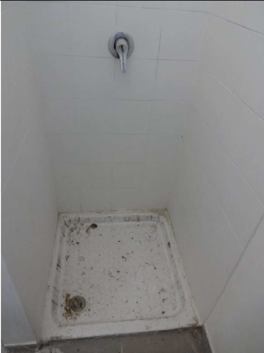
Foto 46-Interni del servizio Igienico