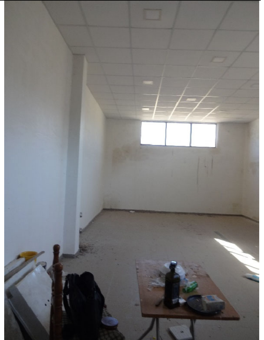
Foto 35-Particolare degli Interni