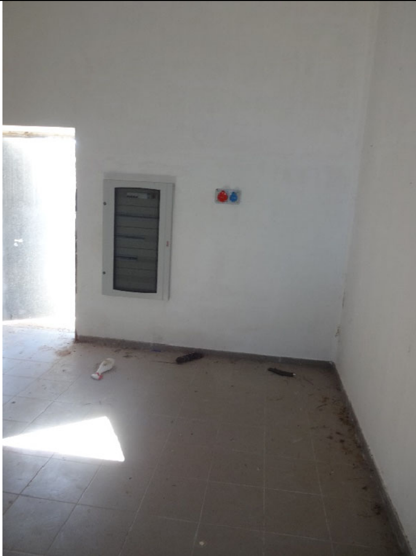
Foto 34-Particolare degli Interni