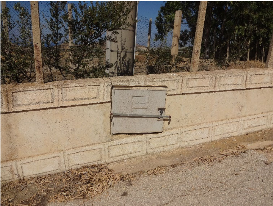
Foto 5-Particolare del muretto adiacente il cancello di accesso