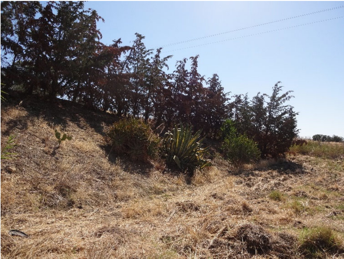
Foto 21-Particolare del terreno