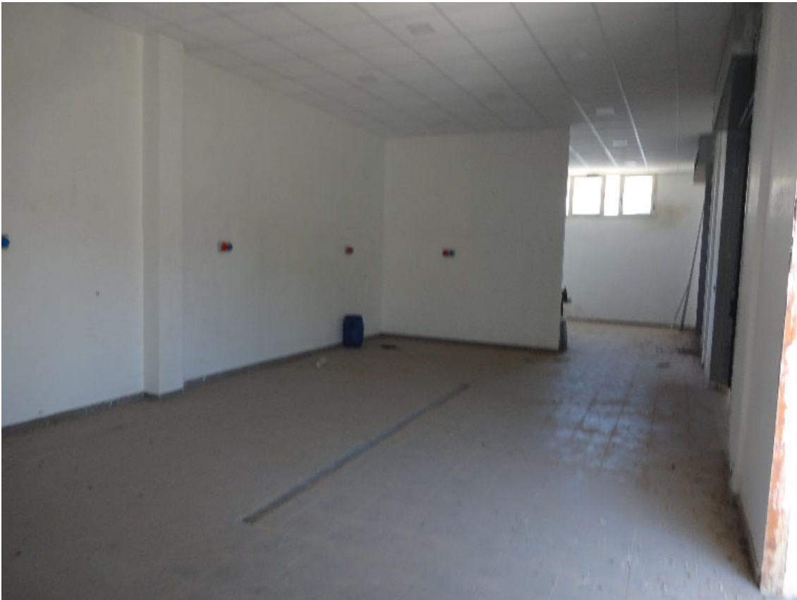
Foto 37-Particolare degli Interni