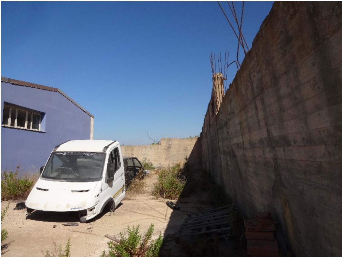
Foto 27-Muro in cemento armato a breve distanza dal fabbricato (notevolmente deformato dalla spinta del retrostante terrapieno)