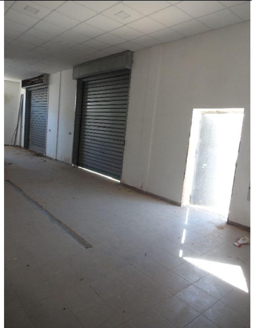
Foto 32-Particolare degli Interni