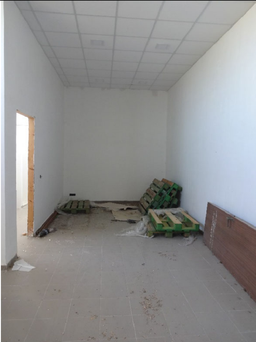
Foto 33-Particolare degli Interni