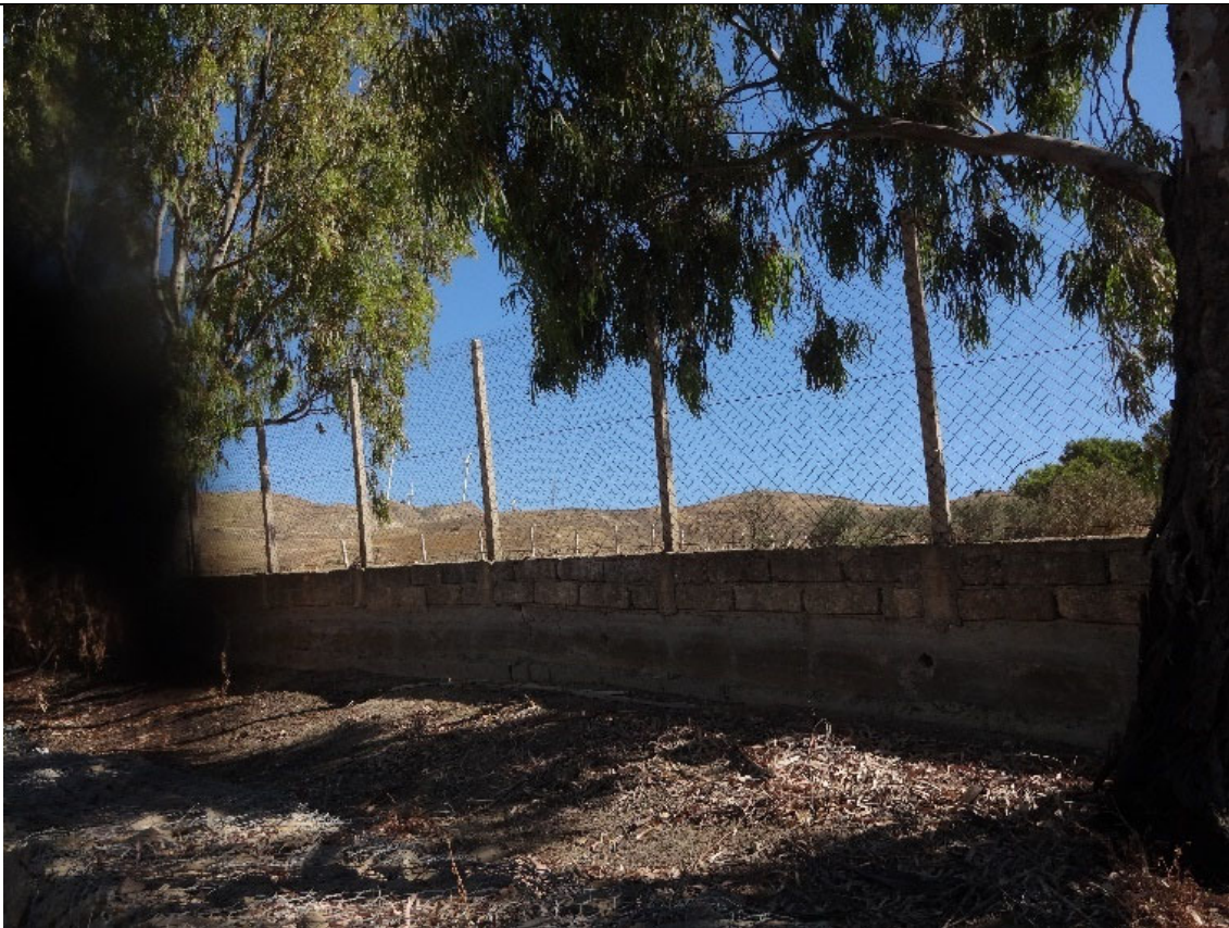
Foto 10-Particolare della recinzione