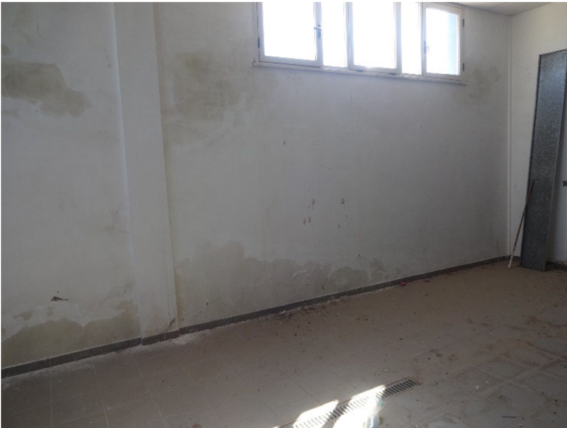
Foto 39-Particolare degli Interni