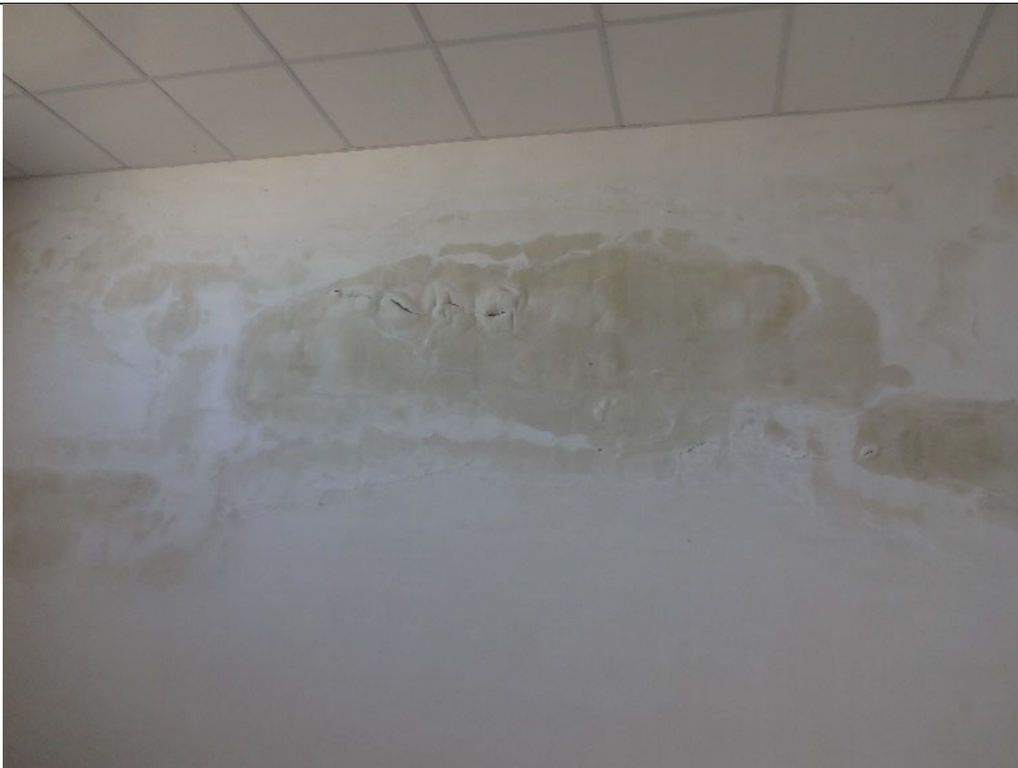
Foto 42-Particolare degli Interni (si noti la presenza di umidità)