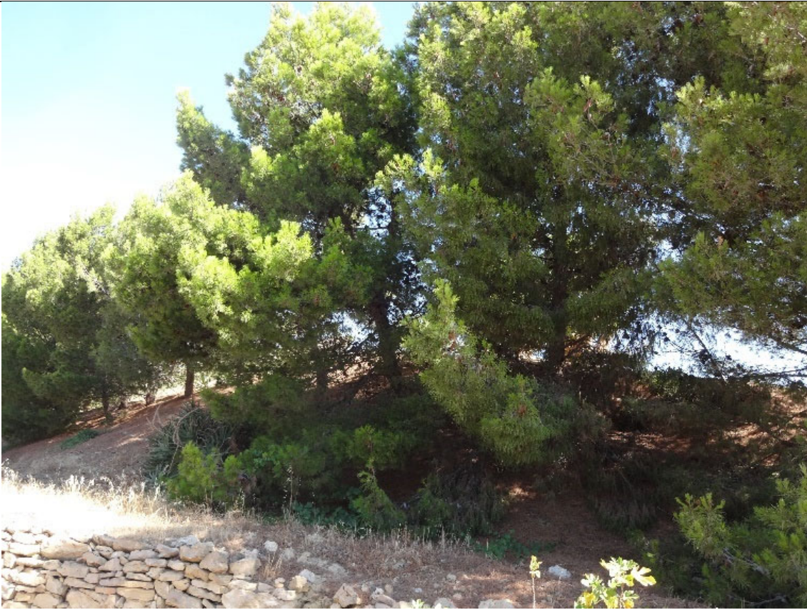
Foto 20-Particolare del terreno