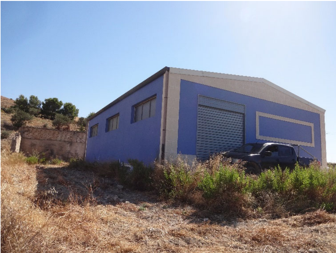
Foto 29-Prospetto posteriore