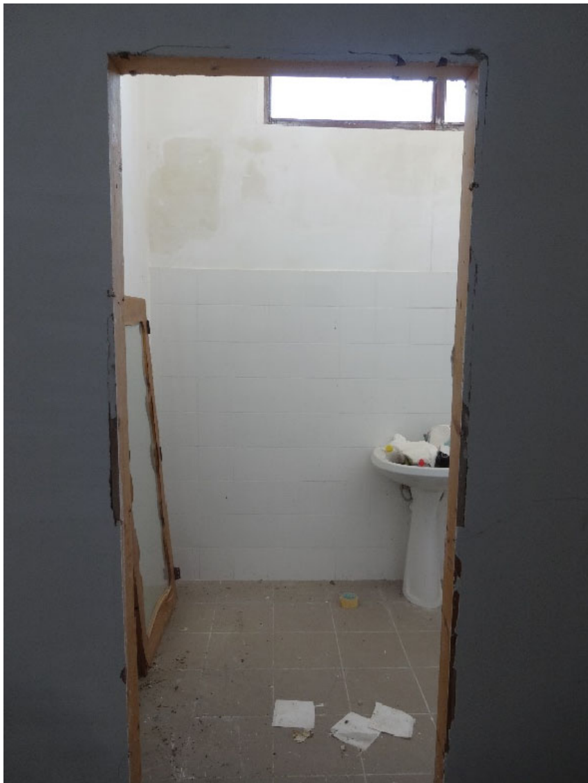
Foto 43-Servizio Igienico