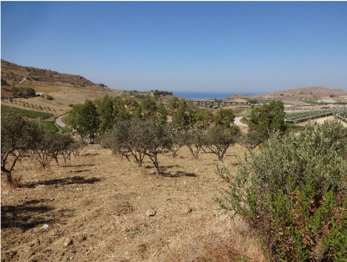
Foto 19-Particolare del terreno