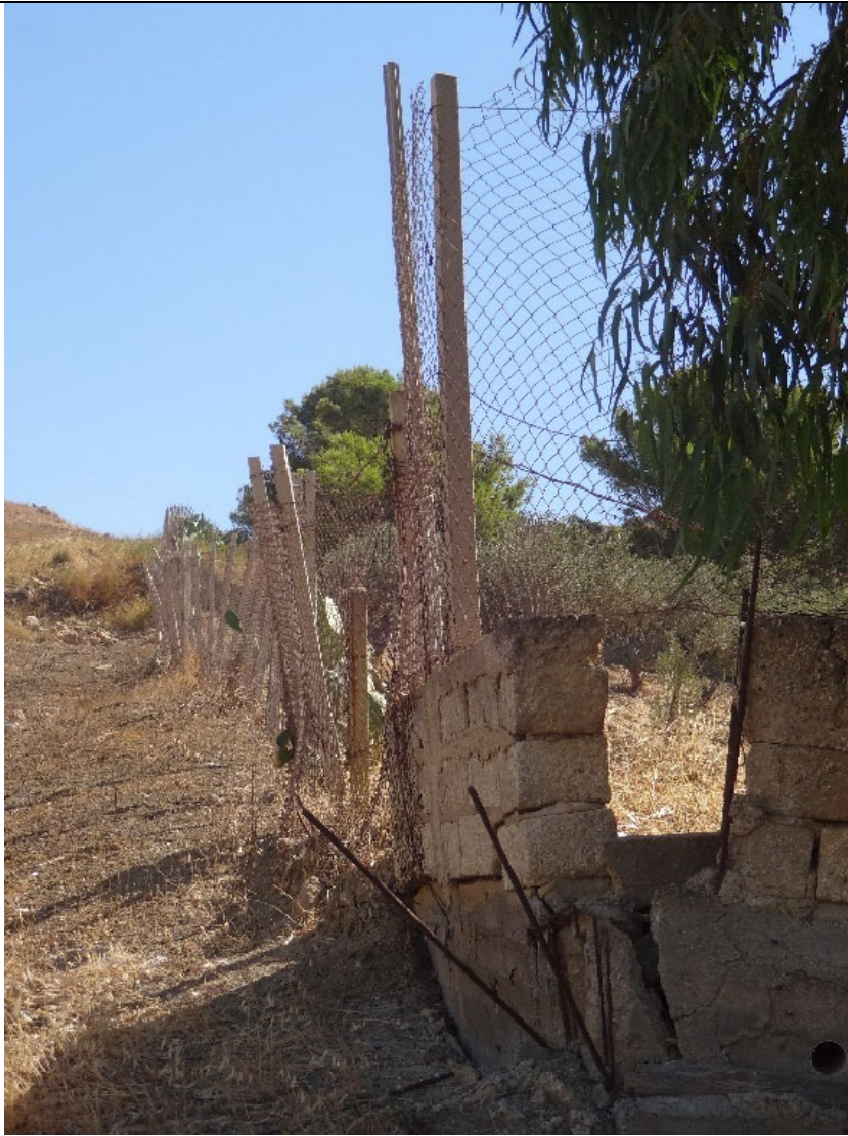
Foto 6-Recinzione lato ovest