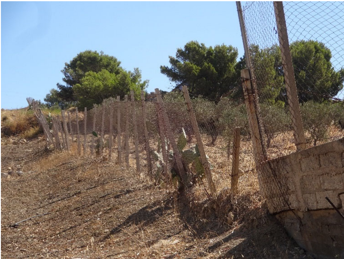
Foto 11-Particolare della recinzione