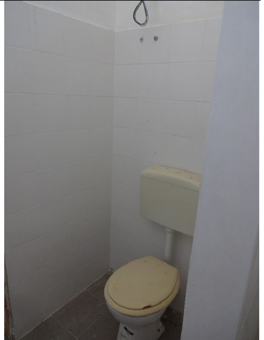
Foto 45-Interni del servizio Igienico