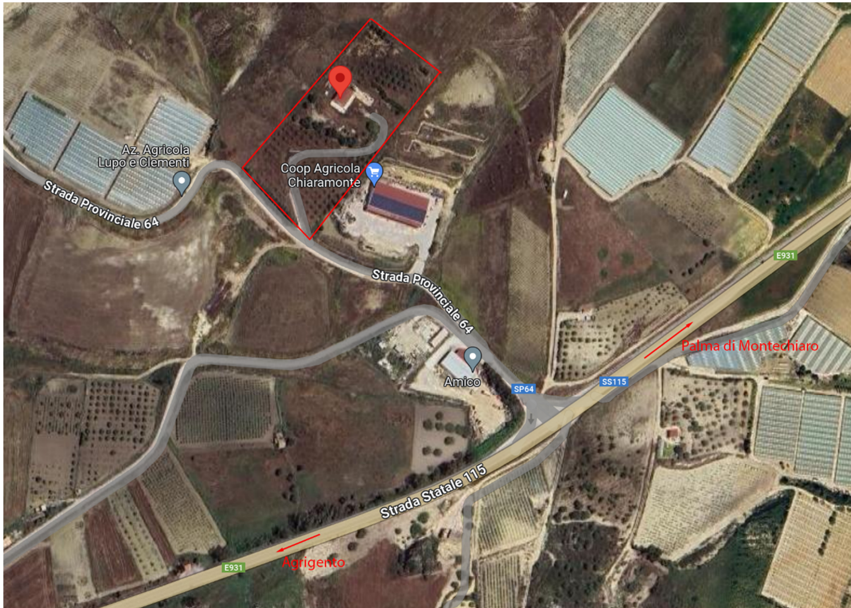
Foto 1-Ortofoto di Zona