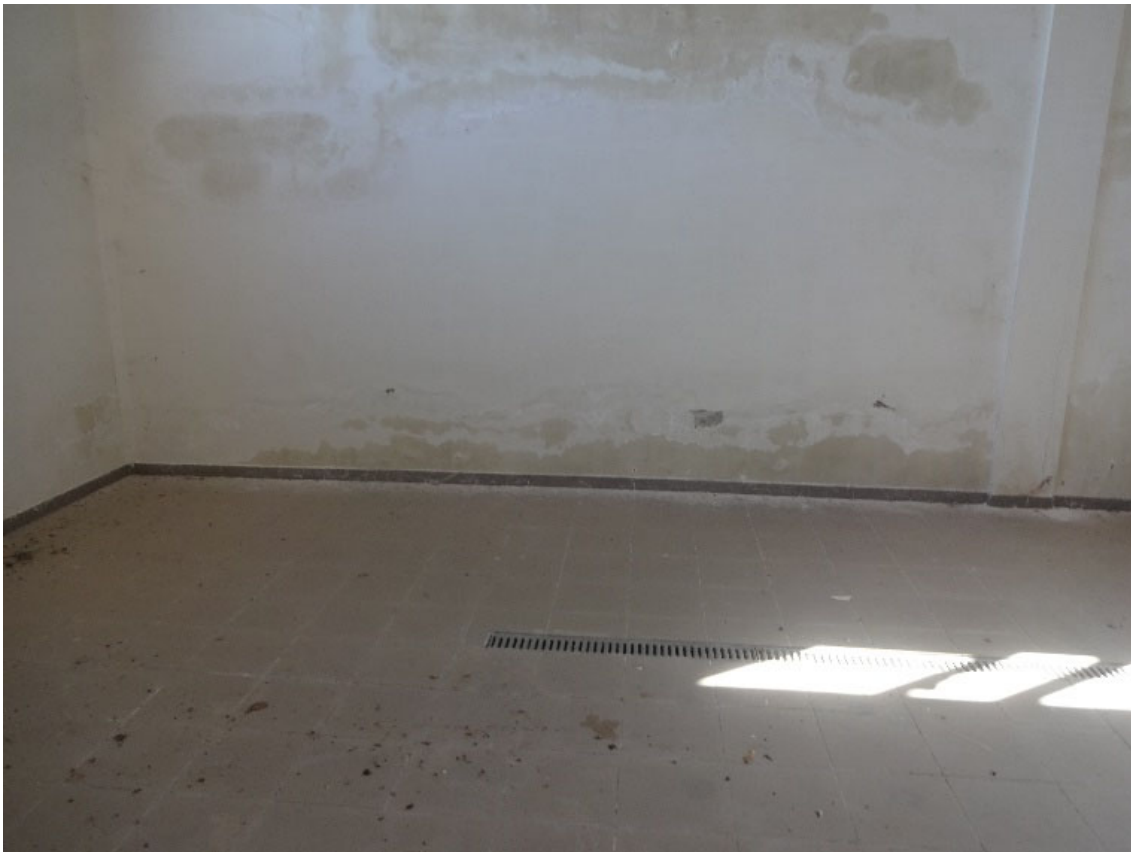
Foto 41-Particolare degli Interni (si noti la presenza di umidità)