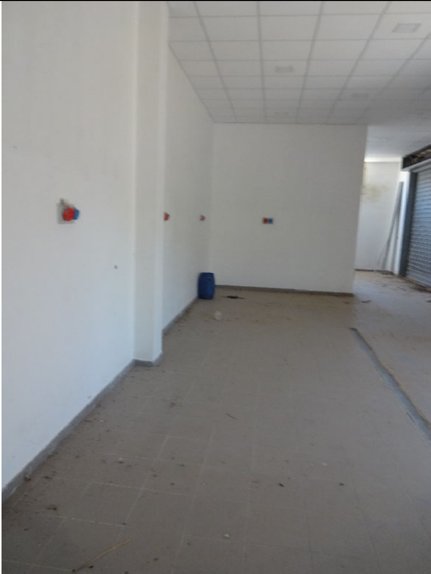
Foto 31-Particolare degli Interni