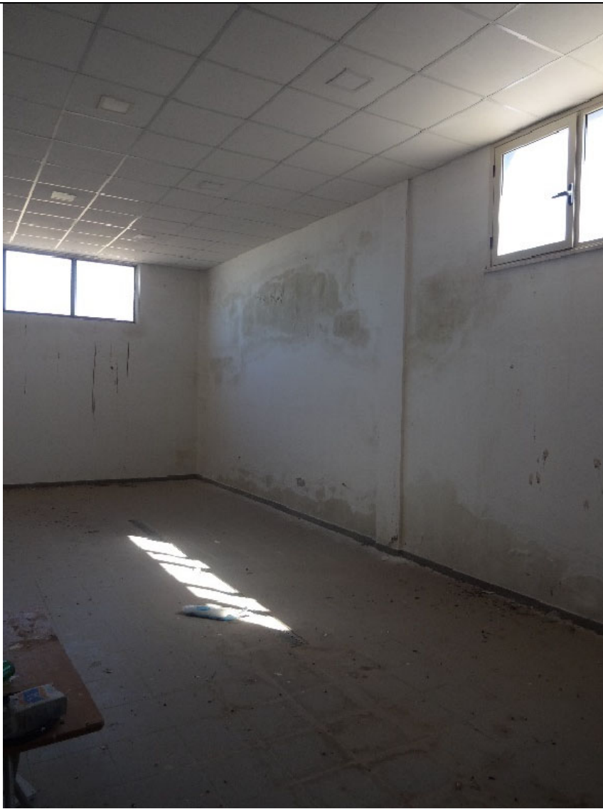
Foto 38-Particolare degli Interni