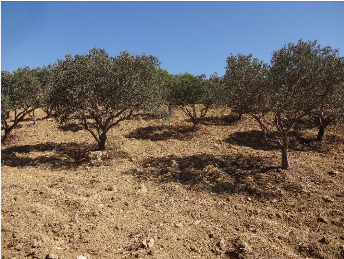
Foto 17-Particolare del terreno