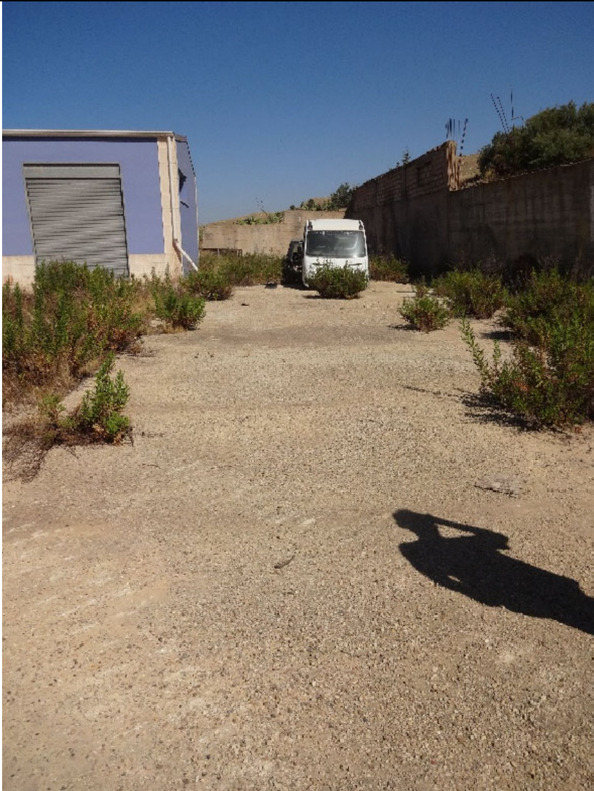
Foto 22-Spazi antistanti il fabbricato